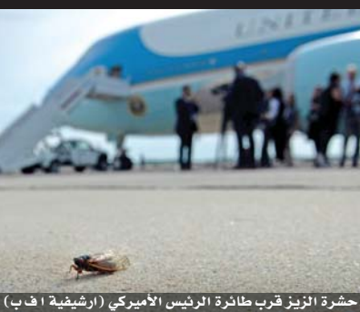
حشرة الزيز قرب طائرة الرئيس الأمريكي

تقع إسبانيا وإيطاليا وفرنسا واليونان على القائمة البرتقالية، ما يرغم المسافرين القادمين من هذه الدول على قضاء فترة حجر صحي من عشرة أيام وإجراء فحوصين لكشف الإصابة على نفقتهم.