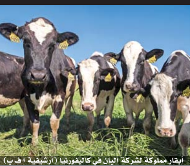
أبقار مملوكة لشركة البان كالفورنيا

صافح بطل الشرائط المصورة «سبايدرمان»، (الرجل العنكبوت) البابا فرنسيس الأربعاء خلال مقابلته العامة التقليدية مع المؤمنين في ساحة القديس داماسو بالفاتيكان مما أثار حماسة الجمهور.