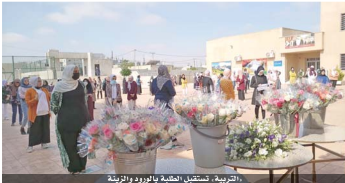
التربية، تستقبل الطلبة بالورود والزينة

عمان - سري الضمور بعد عام من حبس الانفاس والترقب خرج طلبة الثانوية العامة للتوجيهي من أولى جلسات الامتحان لمبحث الثقافة الاسلامية بارتياح حيال الاجراءات المتبعة عند تقديم الامتحان الاول للدورة الاساسية ورددت من المنهاج الدراسي. من جانبه قال وزير التربية والتعليم الدكتور محمد أبو قديس إن عملية التصحيح ستبدأ مباشرة بعد انتهاء تقديم الامتحان وستكون عملية التصحيح اولا بأول حتى تسير الامور كما هو مخطط له.