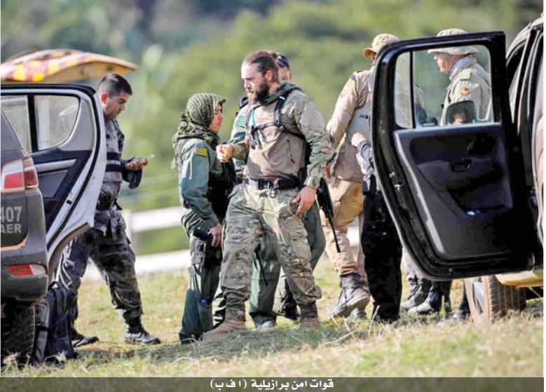
قوات امن برازيلية