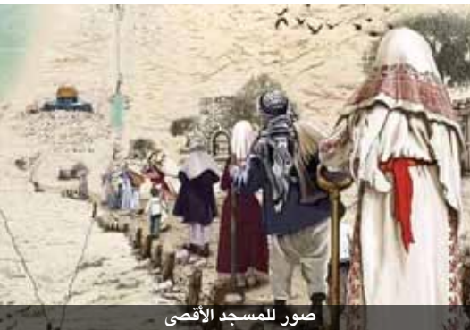
صور للمسجد الأقصى