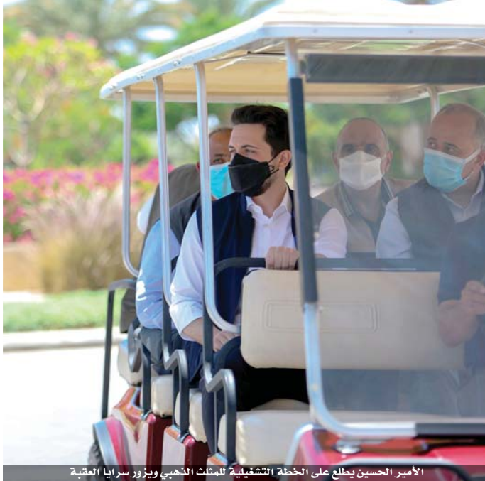
الأمير الحسين يطالع على الخطة التشغيلية للمثلث الذهبي ويؤزر سرايا العقبة

إقامة مشاريع استثمارية تدفع عجلة التنمية وتطور الاقتصاد