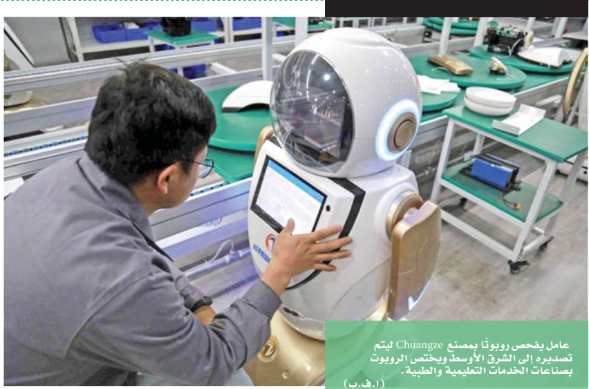
عامل يصحح رويوتا مصنع Chuangze ليتم تصديره إلى الشرق الأوسط ويختص الروبوت بصناعات الخدمات التعليمية والطبية.

twitter.com/alrai facebook.com/alrainewspaper E-mail: alrai@jpf.com.jo ١١١١٨ عمان ٦٧١٠ ٥٦٠٠٨٠٠