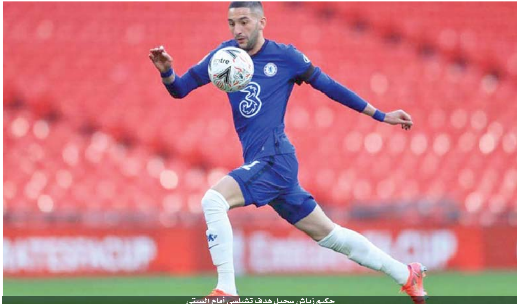
حكيم زياش سجل هدف تشيلسي أمام السيتي

وفي شباط الماضي، انضم ويلوك لاعب منتخب إنجلترا للشباب إلى نيوكاسل على سبيل الإعارة حتى نهاية الموسم من أرسنال، حيث قال آنذاك مدربه ميك آرتيتا إن اللاعب يحتاج إلى خوض