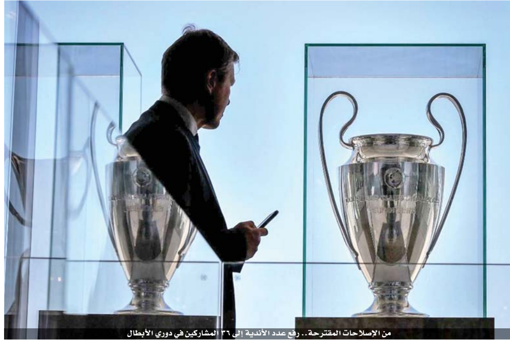
من الإصلاحات المقترحة.. رفع عدد الأندية إلى ٣٦ للمشاركة في دوري الأبطال

وقال «صحيح أن هناك صعوبات جديدة في بلباو، ومع أخذ ذلك في عين الاعتبار، فإن الاتحاد الأوروبي لكرة القدم هو من يجب أن يقرر».