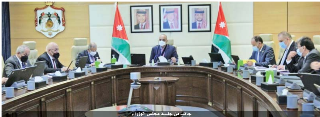
جانب من جلسة مجلس الوزراء

الالتزامات وفقاً لأحكام قانون ضريبة الدخل وقانون الضريبة العامة على المبيعات، وذلك بناء على الطلبات التي تقدموا بها لـ ٤٥٨ شركة ومكافأ، ترقيت عليهم