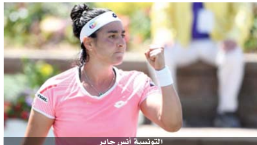
التونسية أنس جابر