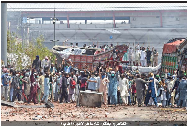
متظاهرون يلقون شارقا في لاهور

إن مباحثات فيينا على المستوى الفني وعلى مستوى اللقاءات الأميركية الإيرانية غير المباشرة، تمهد كما يبدو إلى مباحثات قادمة وشيكة على مستوى سياسي رفيع، وبحضور كل الأطراف.