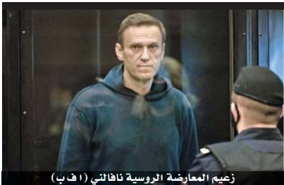
زعيم المعارضة الروسية نافانلي

أهمية هذا الخطاب في أنه يشرح التوجهات الأولى للدولة الأردنية وهي تستهل حياتها الديمقراطية، وهو الخطاب الأول للملك المؤسس طيب الله ثراه.