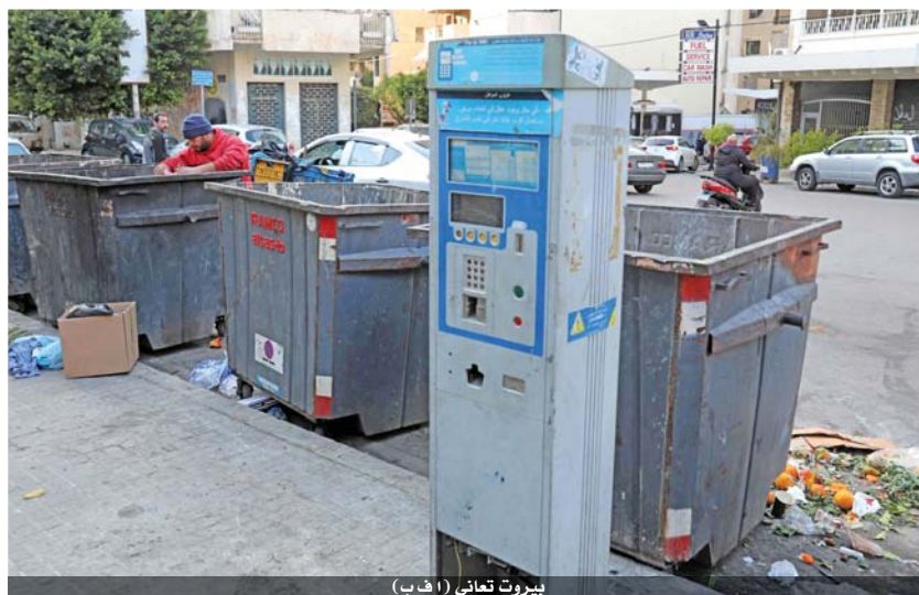
بيروت تعاني