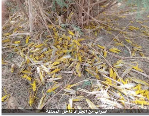
اسراب من الجراد داخل المملكة