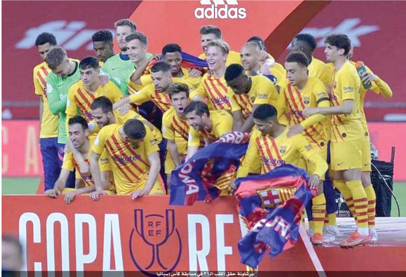
برشلونة حقق اللقب الـ ٣١ في مسابقة كأس إسبانيا