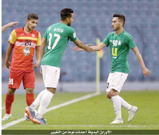
الأوراق البديلة أحدثت نوعاً من التغيير