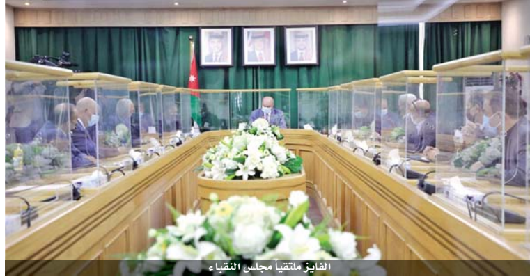
عمان - بترا

التقى رئيس مجلس الأعيان فيصل الفايز، رئيس مجلس النقباء، نقيب المهندسين الزراعيين المهندس عبدالهادي الفلاحات، بحضور أعضاء مجلس النقباء ورؤساء النقابات المهنية.