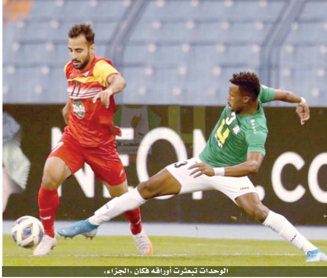
الوحدات تعثرت أوراؤه فكان «الجزء»