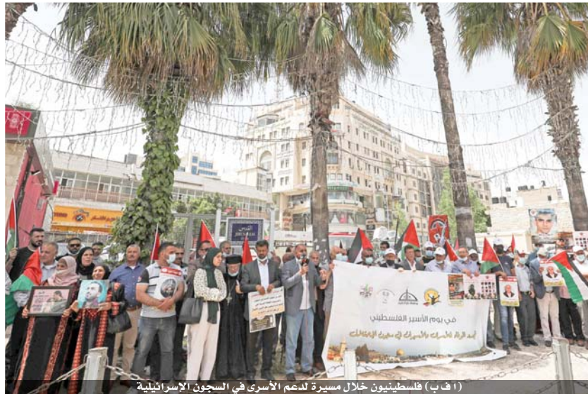
(١ ف ب) فلسطينيون خلال مسيرة لدعم الأسرى في السجون الإسرائيلية