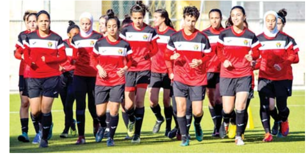
منتخب الشابات يحضر للتصفيات الآسيوية

تأملت النجمة التونسية، أنس جابر، إلى نهائي دورة «شارلستون ٢»، للتنس المقامة في الولايات المتحدة، عقب فوزها على داتا كوفينيتش من الجبل الأسود، في الدور نصف النهائي، أمس الأول. وجاء فوز أنس، المصنفة الـ ٢٨ عالمياً، على كوفينيتش، المصنفة الـ ٦٥ عالمياً، بمجموعتين دون رد، تفاصيلهما ٦-٣، و٦-٠، بعد ساعة و٢٩ دقيقة من اللعب. وشارت النجمة التونسية بذلك، من هزيمتها ضد نفس اللاعبة في الدور نصف النهائي لبطولة «شارلستون ١»، الأسبوع الماضي، بمجموعتين من دون رد (٦-٣، و٦-٢). وتواجه أنس في المباراة النهائية (ليلة أمس)، الأسترالية المغفورة، أسترا شارما، المصنفة الـ ١٦٥ عالمياً، التي تغلبت على الكولومبية ماريا سورانو، بواقع ٦-٠، و٦-١.