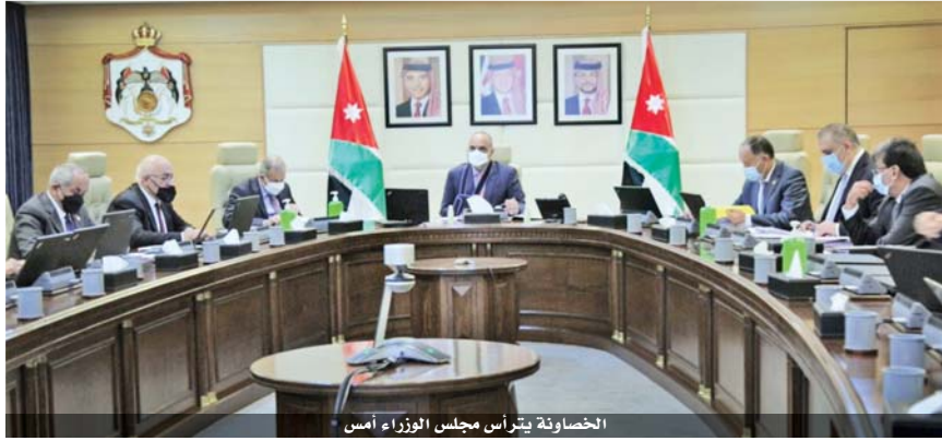
الخصاونة يتراأس مجلس الوزراء أمس

التأمين الصحي المدني. ووافق مجلس الوزراء على توصيات لجنة تسوية القضايا العالقة بين المكفنين ودائرة ضريبة الدخل والخصاونة بتسوية الأوضاع الضريبية لـ ٤٥٨ شركة ومكلفاً، مرتبت عليهم التزامات وفقاً لأحكام قانون ضريبة الدخل وقانون