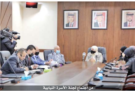
من اجتماع لجنة الأسرة النيابية

وأشروا إلى أهمية إيجاد معالج تشريعي لتخصية الغارمات بعيد عن خيار حبس المدن، وإمكانية استبدال عقوبة السجن