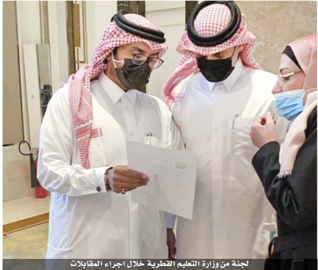
لجنة من وزارة التعليم القطرية خلال إجراء المقابلات

للاستفادة من المهارات المختلفة والخبرات التعليمية التي يتمتع بها. وشدد السفير القطري على ان التبادل التعليمي والتعاون الأكاديمي بين دولة قطر والمملكة الأردنية الهاشمية يحظى بمتابعة مستمرة لاستكمال تنفيذ ما جاء في المباحثات التي تمت بين امير البلاد سمو الشيخ تميم بن حمد آل ثاني واخيه جلالة الملك عبدالله الثاني خلال الزيارة الاخيرة في فبراير ٢٠٢٠، والتي تم فيها التأكيد على توفير ٢٠ ألف فرصة عمل وتعزيز التعاون المشترك بين البلدين الشقيقين في مختلف المجالات.