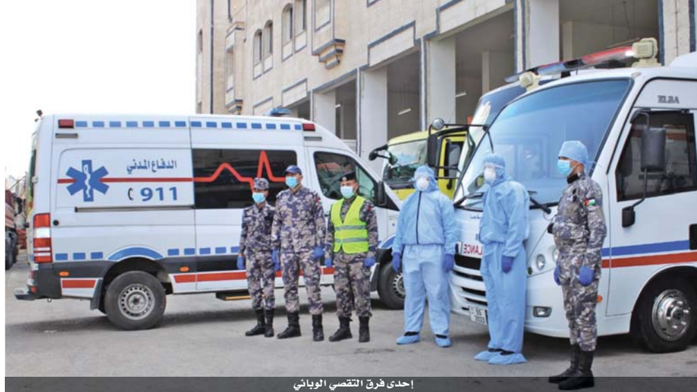
إحدى فرق القصص الوبائي