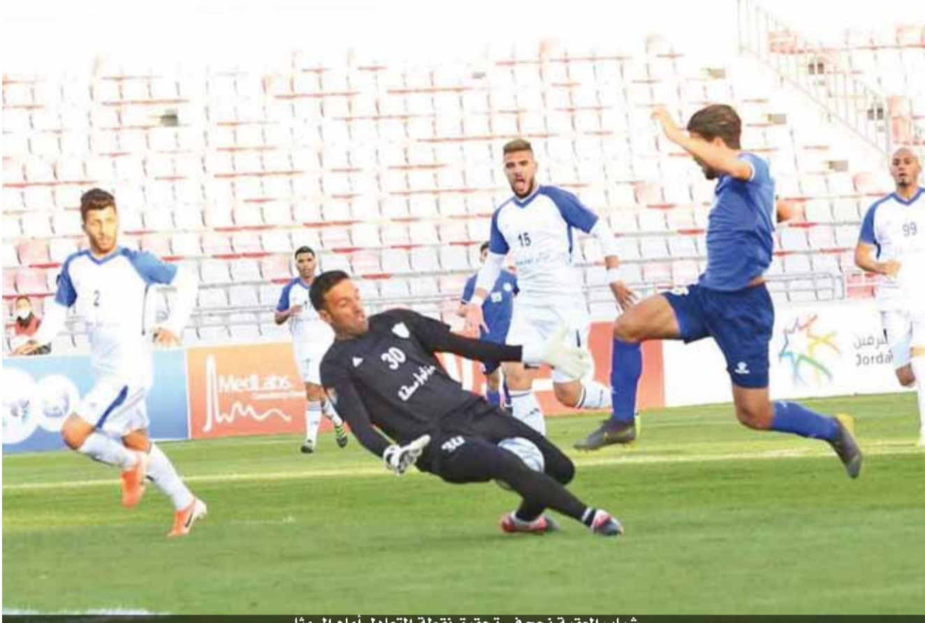
شباب العقبة نجح في تحقيق نقطة التعادل أمام الرمثا

ويأمل الحسين في مواصلة انتصاراته بعد فوزه على معان، فيما يتطلع شباب الأردن لفرصة أطماع منافسه وحصد النقاط الثلاث، والكشف عن نوايا المنافسة مبكراً.