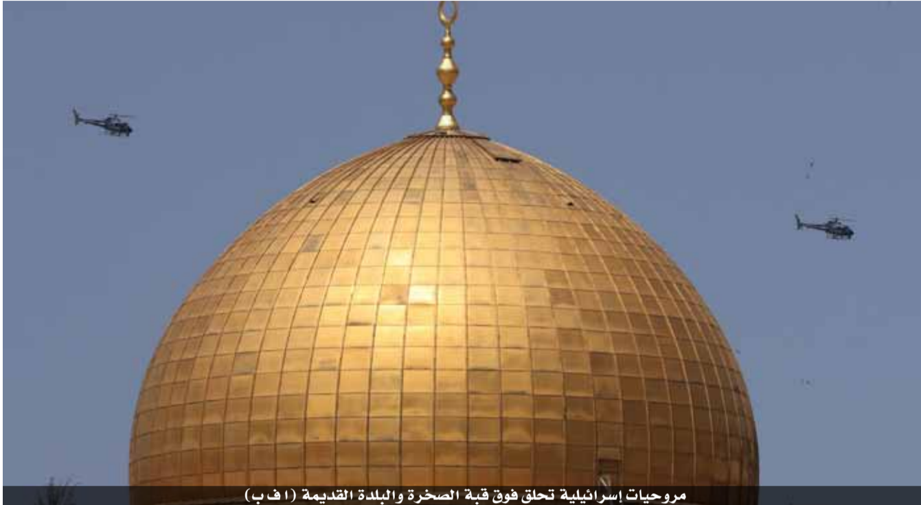
مروحيات إسرائيلية تحلق فوق قبعة الصخرة والبلدة القديمة

الإنسان واتفاقيات جنيف وقرارات الأمم المتحدة ذات الصلة وحملت منظمة التعاون الإسلامي إسرائيل، قوة الاحتلال، المسؤولية الكاملة عن تبعات استمرار مثل هذه الاعتداءات الاستفزازية والخطيرة، داعية في الوقت نفسه، المجتمع الدولي إلى التحرك الفاعل من أجل توفير الحماية للشعب الفلسطيني والأماكن المقدسة، ووضع حد لهذه الانتهاكات الإسرائيلية التي تقذي العنف والتوتر والكراهية، ولا توفر الأجواء المناسبة للسلام العادل القائم على المبادرة العربية وحل الدولتين والقرارات الأممية ذات الصلة.