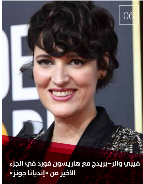
فيبي والر-بريدج مع هاريسون فورد في الجزء الأخير من «إنديانا جونز»