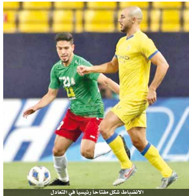
الاتصايب شكل مفتاحاً رئيسياً في التعادل

وتابع: «أداء الفريق اليوم كان مسؤوليتي، لأنني قائد الفريق، وبالتالي أنا أحتمل كامل المسؤولية، لكن في يومين لا نستطيع إيجاد الحلول الكافية».