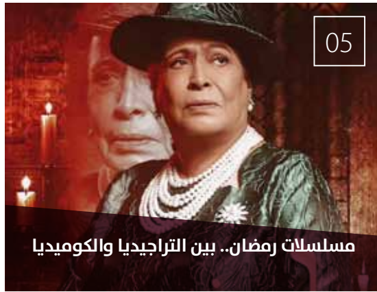
مسلسلات رمضان.. بين التراجيديا والكوميديا