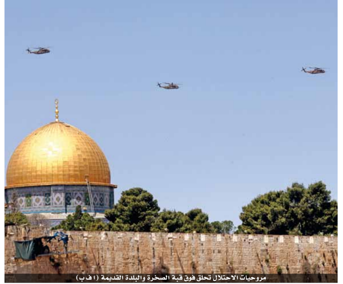
مروحيات الاحتلال تحلق فوق قبة الصخرة والبلدة القديمة