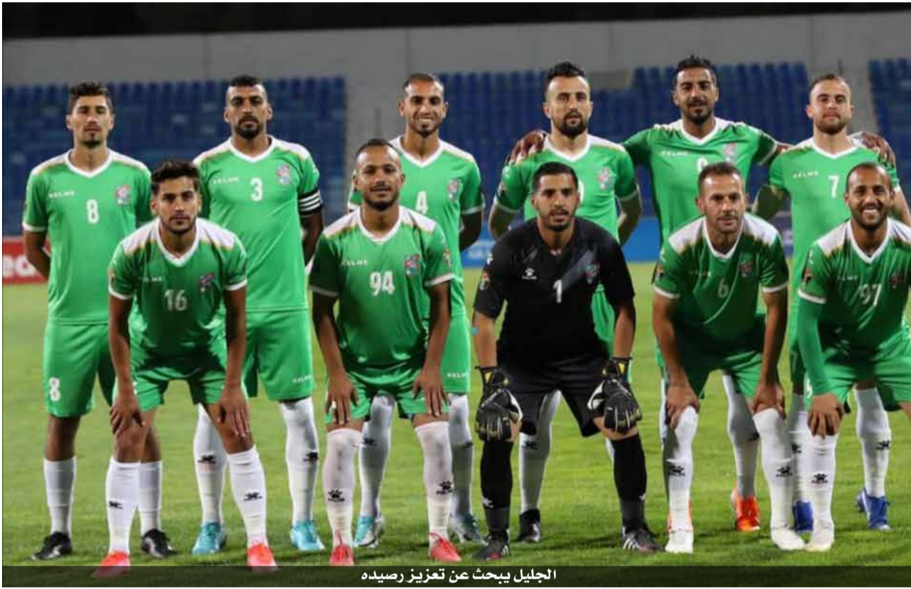
الجليل يبحث عن تعزيز رصيده