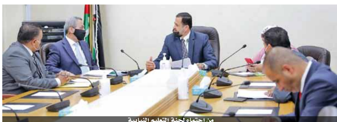
من اجتماع لجنة التعليم النيابية