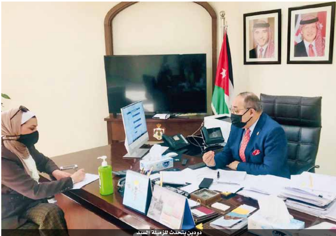
دودين يتحدث للزميلة السيد

هدفنا الوصول لتطعيم ٣ ملايين قبل منتصف العام