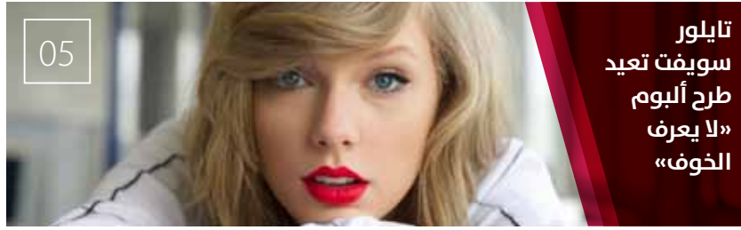
تايلور سويفت تعيد طرح ألبوم «لا يعرف الخوف»