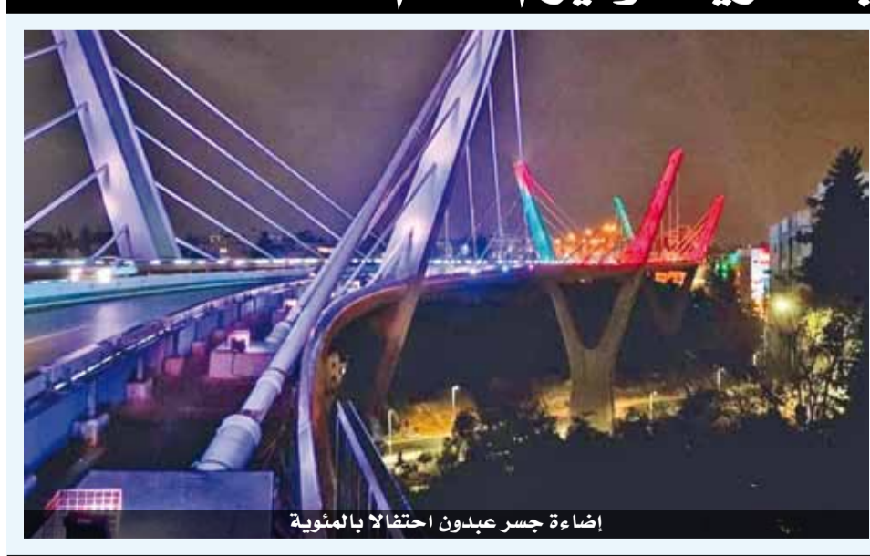
إضاءة جسر صيدون احتفالاً بالمئوية