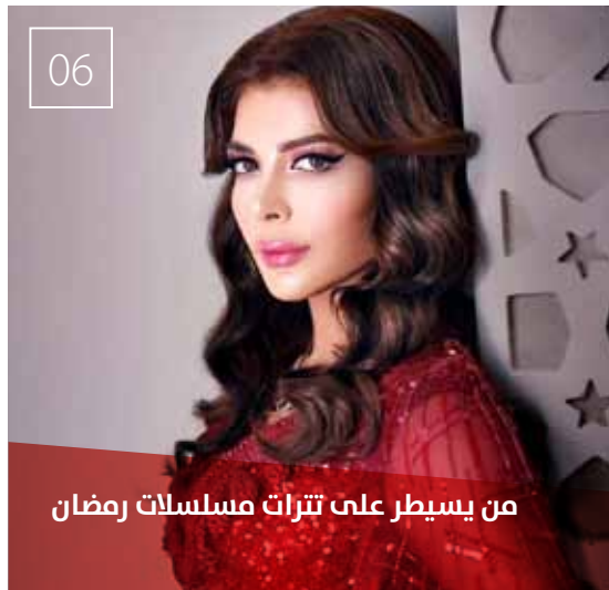
من يسيطر على تترات مسلسلات رمضان