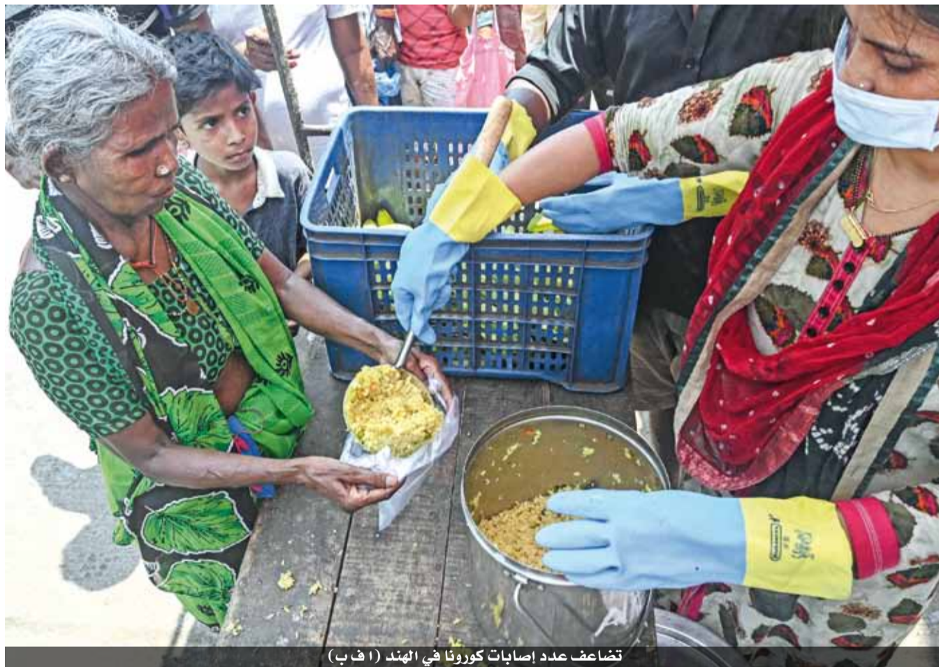
تضاعف عدد إصابات كورونا في الهند

منه كانت مقررة للربع الأخير من العام بدءاً من نيسان ليصل إجمالي الجرعات إلى ٢٥ مليوناً في الربع الثاني، وفق ما قالت المفوضية الأوروبية الأربعاء.