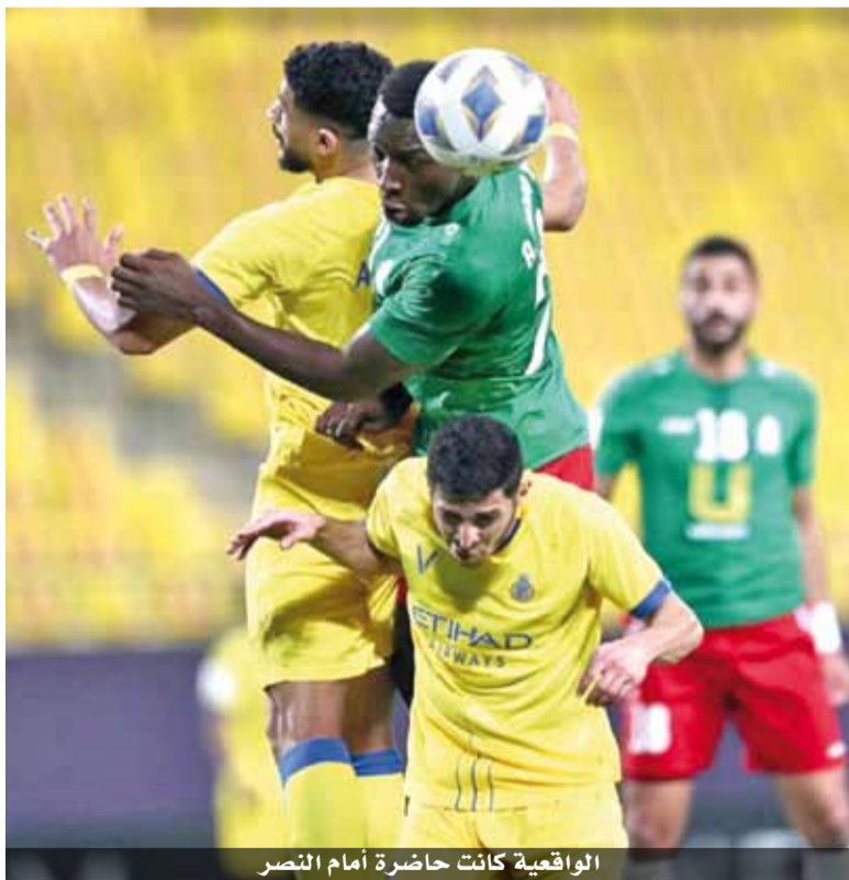
الواقعية كانت حاضرة أمام النصر