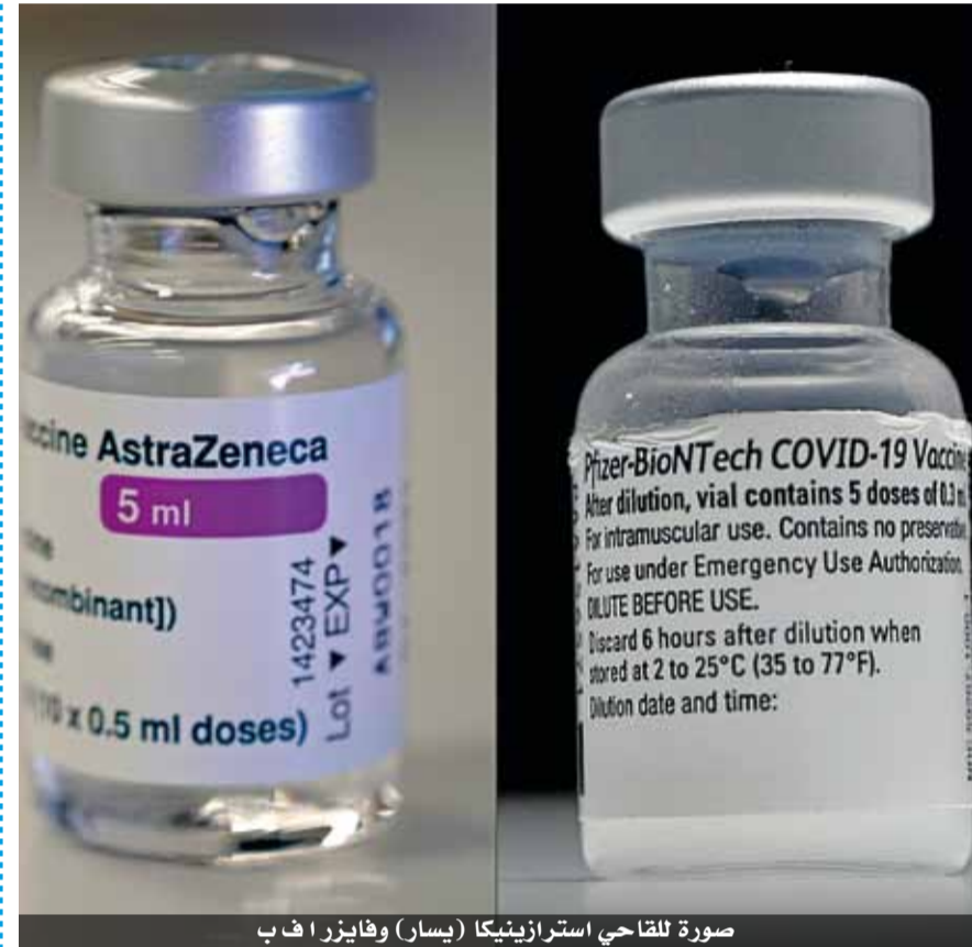
صورة للقاحي استرازينيكا (يسار) وفايزر