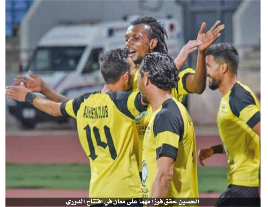
الحسين حقق فوزاً مهماً على معان في افتتاح الدوري