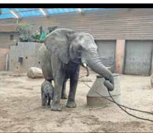
نقود صغير فيل في السويد بعد نبذه من قطيعه