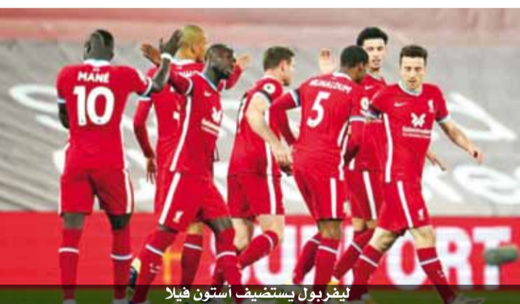
ليفربول يستضيف أستون فيلا

في اليوم ذاته في لقاء يشتد خلاله الأخير نجمه الفرنسي المخضرم فرانك ريبيري للإيقاف.