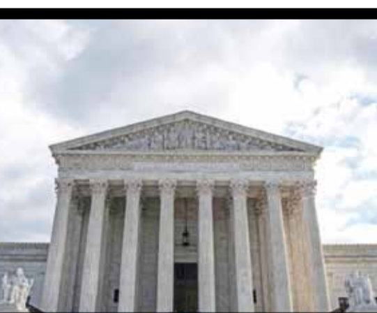
مبنى المحكمة العليا في واشنطن

وأشار في بيان نُشر على فيسبوك إلى أن كييف تدعم حلا «سياسيا ودبلوماسيا، لاستعادة الأراضي الخارجة عن سيطرتها منذ بدء هذا النزاع عام ٢٠١٤. واعتبر أن هناك «حملة تشويه، تقودها