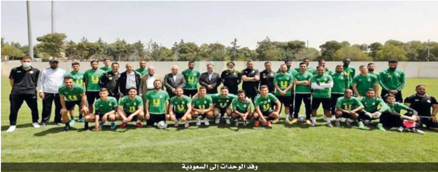
وفد الوحدات إلى السعودية