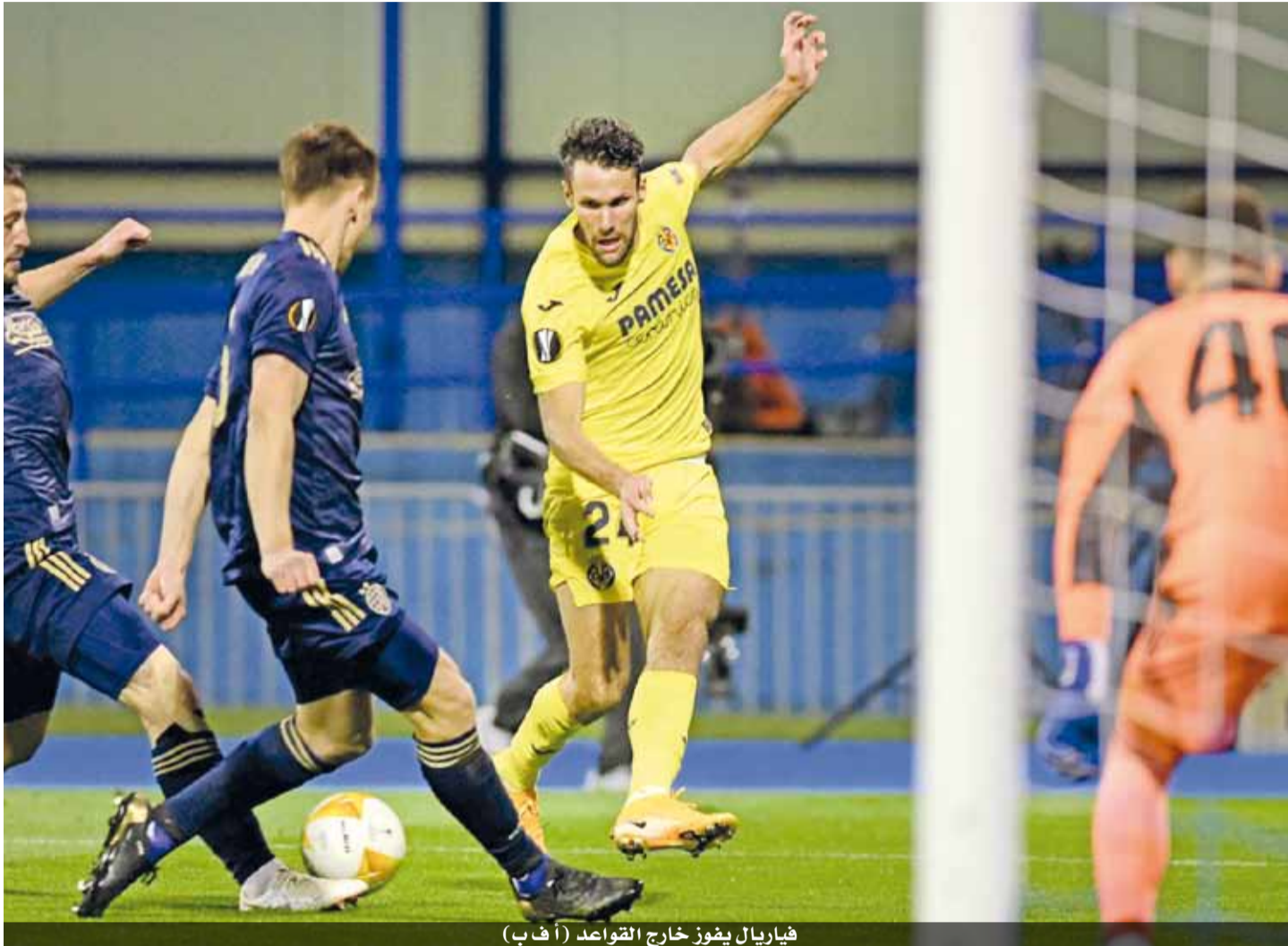
فياريال يفوز خارج القواعد