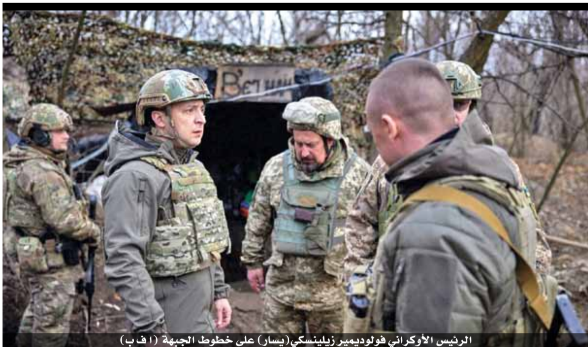
الرئيس الأوكراني فولوديمير زيلينسكي (يسار) على خطوط الجبهة (أ ف ب)

وتضم حديقة بوروس للحيوانات في غرب السويد عشرة فيلة إفريقية، وتشكل ولادات الفيلة في الأسر حدثا نادرا لهذا النوع الذي تراجع أعداد حيواناته بدرجة كبيرة في الطبيعة. وقبل خمسين عاما، كان يجوب حوالي ١٥ مليون فيل إفريقيا لكن أحدث إحصاء للدينيات الكبيرة في ٢٠١٦ أظهر أن العدد لم يعد يتجاوز ٤١٥ ألفا، وفق الاتحاد الدولي لحفظ الطبيعة.