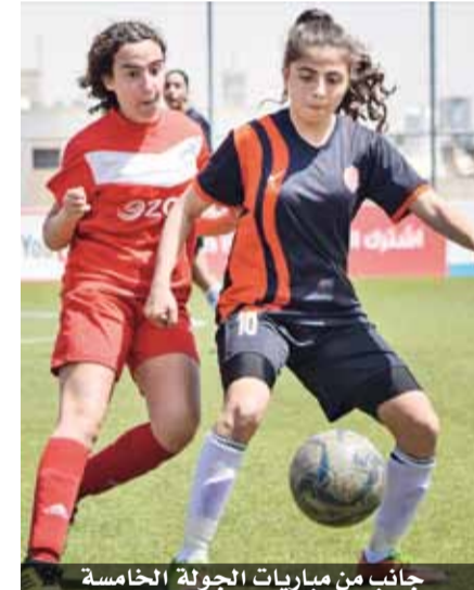
جانب من مباريات الجولة الخامسة