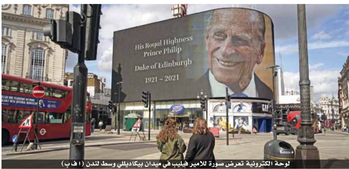
لوحة إلكترونية تعرض صورة للأمير فيليب في ميدان بيكاديللي وسط لندن (أ ف ب)

وقررت جميع الأحزاب السياسية البريطانية تعليق حملتها للانتخابات المحلية في السادس من أيار. وتواتت الإشارات من جميع أنحاء العالم، ولا سيما من العائلات الملكية الأوروبية. وفي أستراليا التي تعتبر إليزابيث الثانية ملكتها، أشاد رئيس الوزراء سكوت موريسون برجل «كان يجسد جيلا». كذلك أشاد رئيس الوزراء الهندي ناريندرا مودي بمسار الأمير فيليب «الملفت»، فيما أشادت برلين بـ «حياة مديدة في خدمة بلاده، وحيث المستشارة أنغيلا ميركل الكندي جاستن ترودو عن «صاحب قناعات ومبادئ».