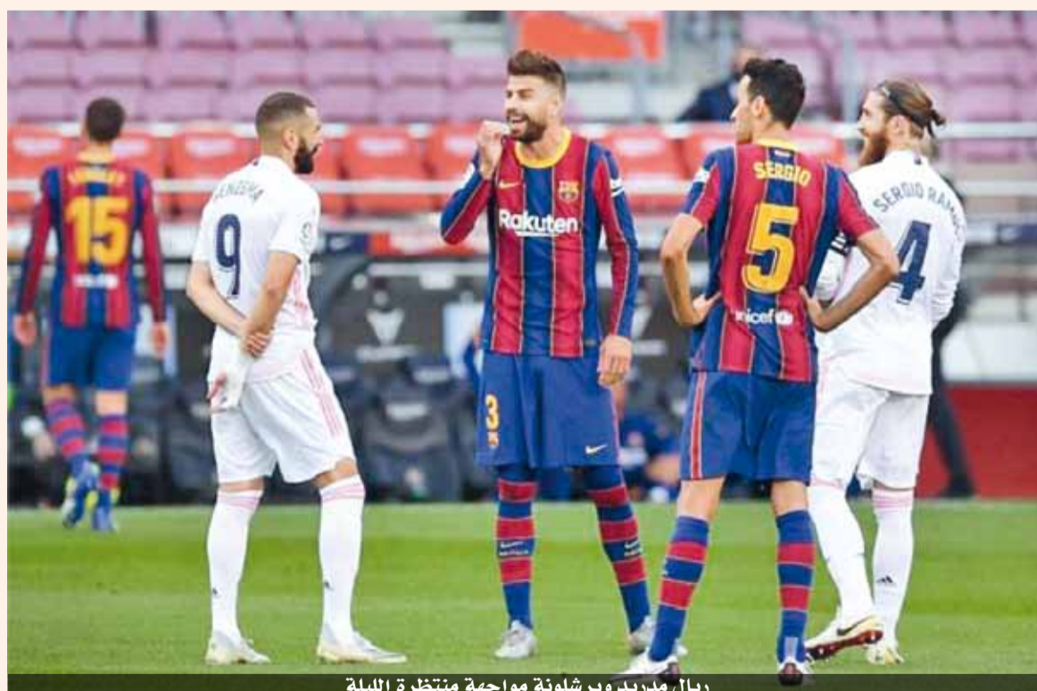
ريال مدريد وبرشلونة مواجهة منتظرة الليلة

الذي بات لا يهتم بمدى تطور حالة هازارد ودخوله قائمة المباراة، وأصبح يركز الدعاء على عدم إصابة فينيسيوس بنزلة برد قبل الكلاسيكو. ديمبلي (٢٣ عاماً) كان صاحب الهدف الحاسم والوحيد في الجولة الماضية أمام بلد الوليد الذي حافظ على فرص فريقه في التتويج بالليجا. كما حظي عثمان خلال هذا الموسم بالاستمرارية في اللعب، التي كان يفتقدها سابقاً على الدوام، حيث خاض ٣٦ مباراة، وبدأ يزور الشباك بشكل أكثر انتظاماً، حيث سجل ١٠ أهداف، منها ٥ في الليجا و٢ في دوري الأبطال وهدفين في كأس الملك، إضافة لمساهمته في صناعة ٤ أهداف. بدوره استعاد فينيسيوس (٢٠ عاماً) أمام ليفريول نسخة ريال مدريد المعروفة في الليالي الأوروبية الكبرى، مسجلاً أول ثنائية له في ١٠٦ مواجهات له بقميص الملكي، ليضع الفريق على بعد خطوة من التأهل لنصف نهائي التشارمبيونزليج. وسجل فينيسيوس، الجناح الأيسر الذي يتميز بالمرارعة والسرعة والفاعلية، ٦ أهداف وصنع ٤ طوال المباريات ٣٧ التي خاضها هذا الموسم. وساهم إصرار اللاعب البرازيلي الشاب وحضوره في الملعب، في جعل زين الدين زيدان ينجح له ويمنحه دوراً في التشكيل الأساسي للفريق، والذي كان يتمتع به في البداية ماركو أسينسيو. وأصبح ديمبلي وفينيسيوس الآن، يستحقان التوقعات التي وضعت فيهما، خلال تعاقب برشلونة وريال مدريد معهما، خاصة مع ارتفاع قيمة صفقتهم.