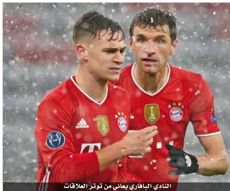
النادي البافاري يعاني من توتر العلاقات

مهمة الاشراف على المنتخب الألماني بعد نهائيات كأس أوروبا الصيف المقبل خلفاً ليواكيم لوف الذي سيترك المنصب بعد البطولة القارية.