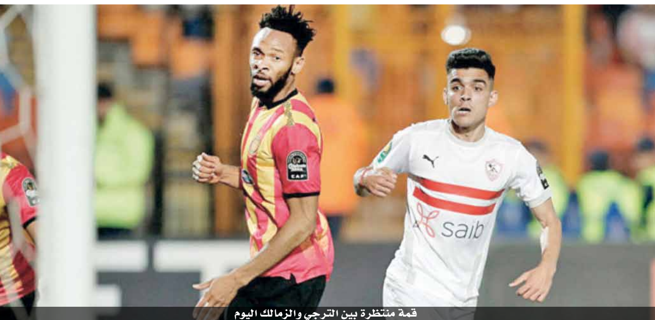
قمة منتظرة بين الترجي والزمالك اليوم