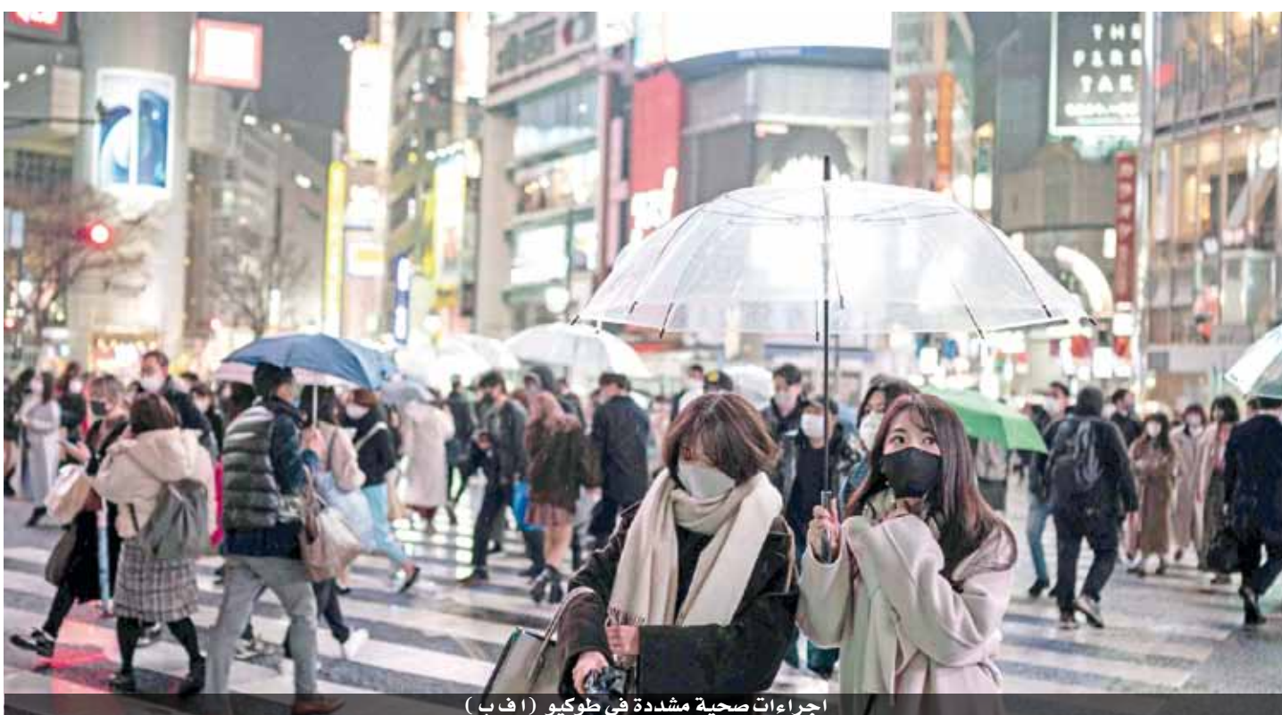
إجراءات صحية مشددة في طوكيو

أما في أوروبا، فقد ارتفع عدد الإصابات الجديدة بفيروس كورونا بنسبة ٩ بالمائة الأسبوع الماضي ليتجاوز المليون حسب الفرع الإقليمي لمنظمة الصحة العالمية الذي يضم حوالي خمسين بلدا أوروبا وصولا إلى آسيا الوسطى. وأكد المدير الإقليمي للمنظمة في أوروبا هانس كلوغه