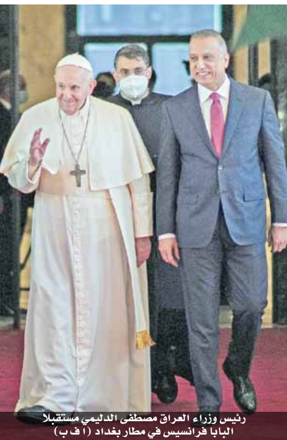
رئيس وزراء العراق مصطفى الديلمي مستقبلا البابا فرانسيس في مطار بغداد

وهو وصوله، تطرق إلى كل المواضيع الحساسة والقضايا التي يعاني منها العراق خلال لقائه الرئيس العراقي برهم صالح.