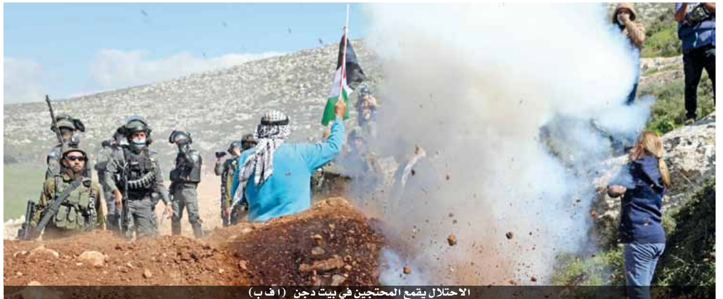
الاحتلال يقمع المحتجين في بيت دجن