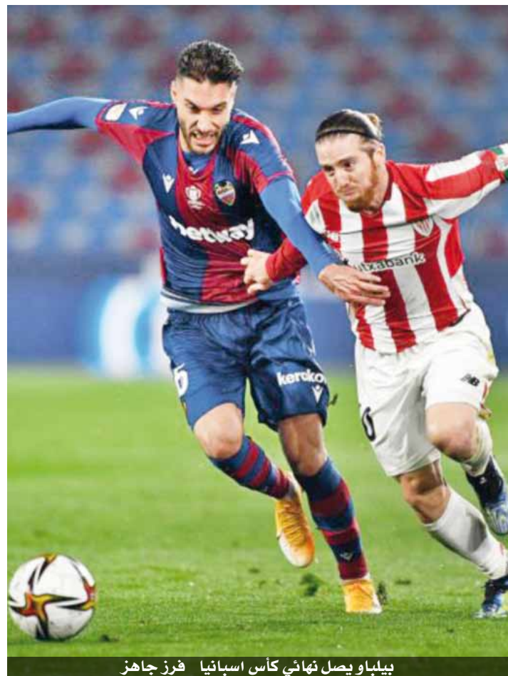
بيلباو يصل نهائي كأس اسبانيا فرز جاهز