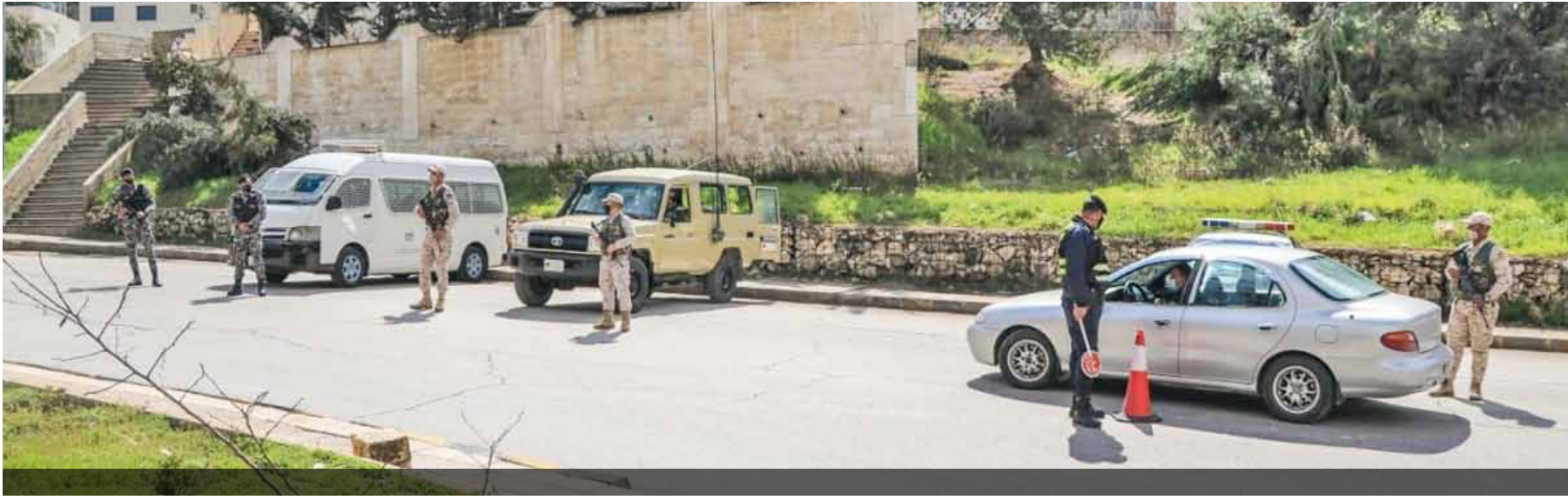
عمان - الرأي

نفذت القوات المسلحة الأردنية-الجيش العربي، ومديرية الأمن العام، خطة فرض الحظر الشامل الذي بدأ منذ الساعة العاشرة ليلية أمس الأول واستمر حتى السادسة من صباح اليوم السبت، وذلك ضمن جهود الحد من انتشار فيروس كورونا وتعزيز الإجراءات الأمنية للمحافظة على أمن وسلامة الوطن والمواطنين. وهدفت عملية الانتشار على مداخل ومخارج محافظات ومدن المملكة، وتفعيل نقاط الخلق، إلى ضمان تقييد المواطنين بتطبيق شروط السلامة العامة والمتعلقة بأزمة فيروس كورونا، وتعزيز جهود فرق التفتيش الوياني للقيام بعملها على أكمل وجه، وبشكل يحفظ صحة وأمن الوطن والمواطن. ويستثنى الحظر ساعة واحدة لأداء صلاة ظهر الجمعة في المساجد سيراً على الأقدام، إضافة إلى الأشخاص المصرح لهم من قبل المركز الوطني للأمن وإدارة الأزمات الذين تقتضي طبيعة عملهم إدامة المرافق العامة للدولة.