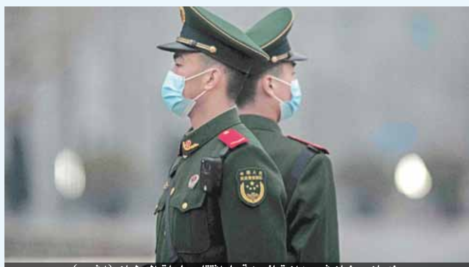
جنديان صينيان في ميدان تيانمين قبيل افتتاح جلسات البرلمان

وبما أن تايوان وبحر الصين الجنوبي يشكلان أولوية للصين يحظى سلاح البحرية بجز كبير من الميزانية العسكرية. مدمرات وحاملات مروحيات تم تعزيز هذا السلاح في السنة المنصرمة بطائرات