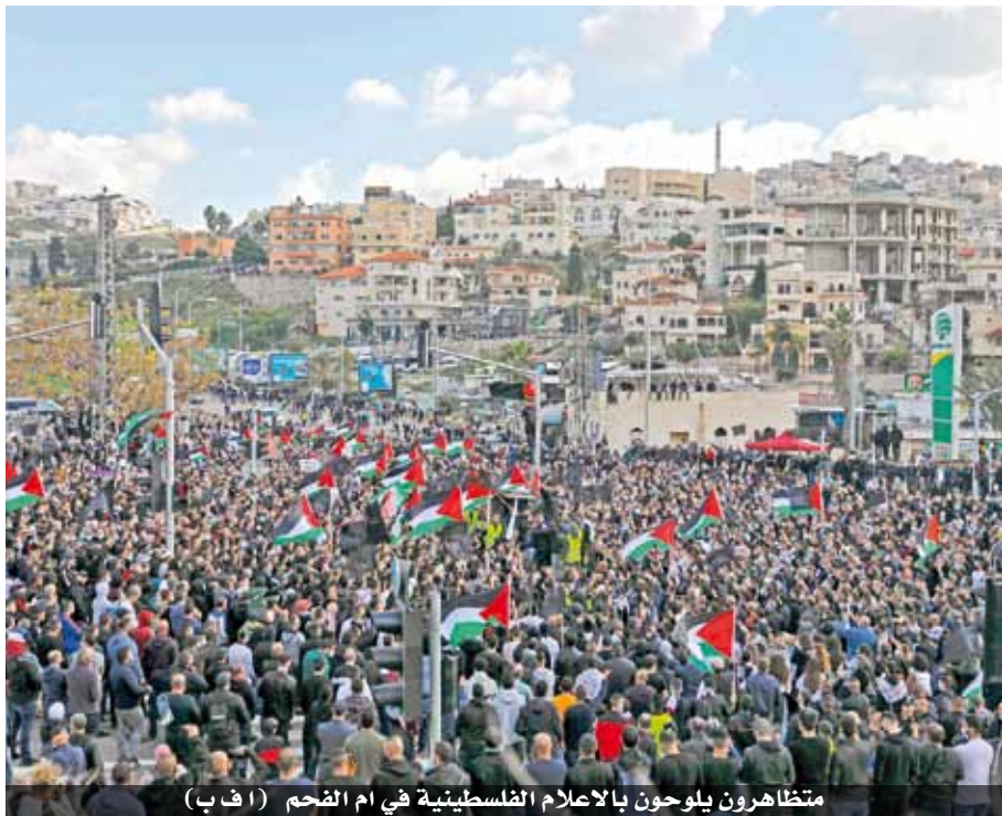
متظاهرون يلوحون بالأعلام الفلسطينية في أم الفحم

العربي. وتوجه المتظاهرون سيرا على الأقدام إلى شارع ٦٥ الرئيسي في مدخل أم الفحم، حيث جرى إغلاق الشارع من كلا الاتجاهين. وتواصلت المظاهرات الاحتجاجية في أم الفحم للأسبوع الثامن على التوالي، تنديدا بالجريمة وتواطؤ الشرطة في لجم الظاهرة التي باتت تهدد مجتمعا بأكمله. وقتل منذ مطلع العام الجديد ٢٠٢١ في البلدات العربية، ١٦ ضحية.