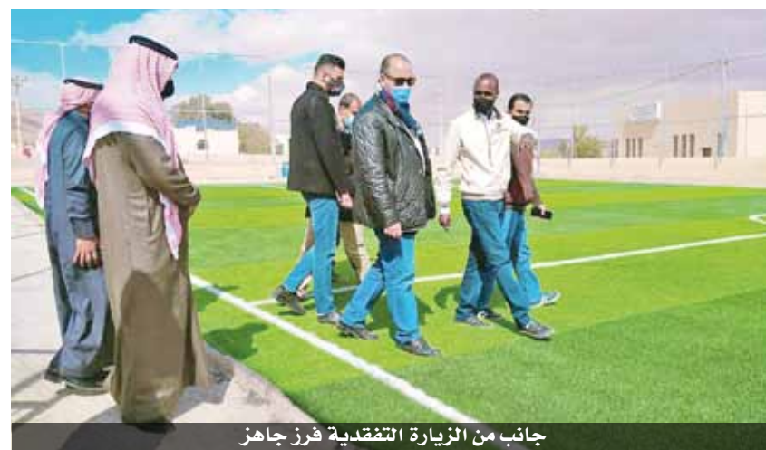
جانب من الزيارة التفقدية لفرز جاهز