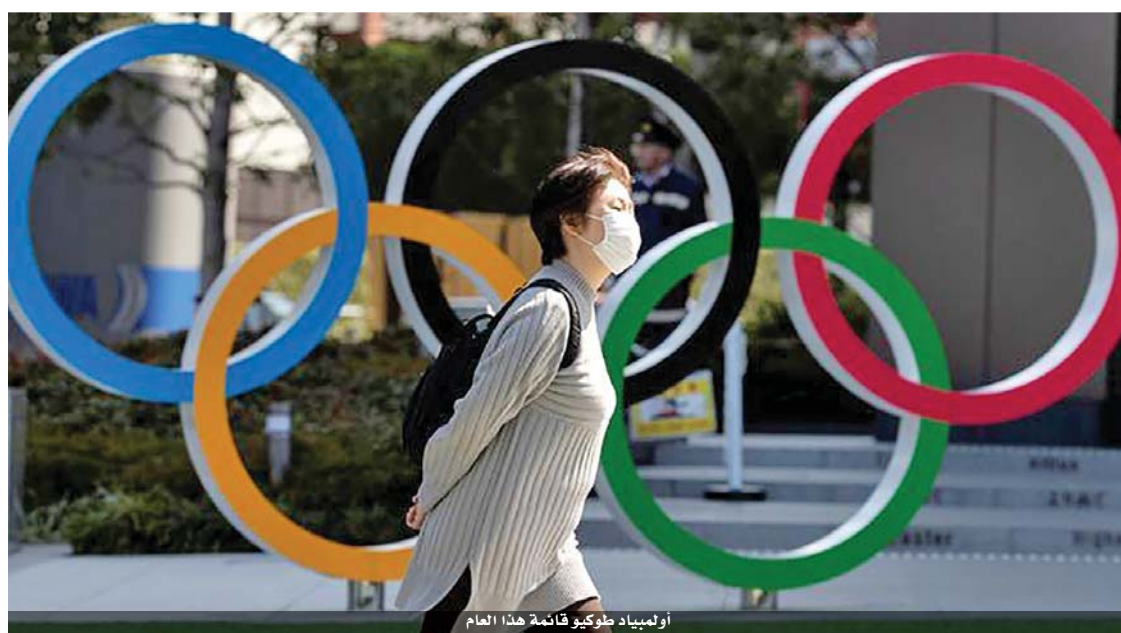
أولمبياد طوكيو قائمة هذا العام

لطمأنة الجماهير بأن الأولمبياد سيقام في بيعة آمنة. وأبلغ رويترز بوجود تصميم مطلق، مضيفاً أن وصول اللقاح وقدرة الرياضيين على الممران تعني أن الموقف أفضل كثيراً مما كان عليه الحال عندما تأجلت الألعاب العام الماضي. وكانت اليابان أقل تأثراً بالجائحة من العديد من الاقتصادات الكبرى الأخرى لكن الزيادة الأخيرة في الحالات أدت إلى غلق الحدود أمام الأجانب غير المقيمين وإعلان حالة الطوارئ في طوكيو ومدن أخرى. وأعلنت اليابان عن أكثر من ألف حالة فيروس كورونا لليوم التاسع على التوالي حتى أمس الخميس وسجلت أكثر من ٢٤٠٠ إصابة في يوم واحد في وقت سابق من الشهر الحالي وهو رقم قياسي. وتوفي نحو ٤٩٠٠ من المرضى في اليابان. وهناك مخاوف عامة من أن قدوم الرياضيين سيشر الفيروس، وأظهرت استطلاعات رأي في الآونة الأخيرة أن حوالي ٨٠ بالمئة من اليابانيين لا يريدون إقامة الأولمبياد الصيف المقبل. وفي مقابلة قبل ظهور تقرير تايمز، قال توشيرو موتو الرئيس التنفيذي لـ٢٠٢٠ إنه يأمل أن يساهم نجاح حملات التطعيم ضد كوفيد-١٩ في ضمان إقامة أكبر حدث رياضي في العالم في ظروف آمنة. وتمثل الأولمبياد خطوة كبيرة لليابان ورئيس الوزراء يوشيهيدي سوجا الذي قال مطلع الأسبوع الحالي إن تنظيم الحدث «سيعيد الأمل والشجاعة للعالم». وأكد سوجا اليوم الجمعة أن الألعاب ستقام في موعدها.