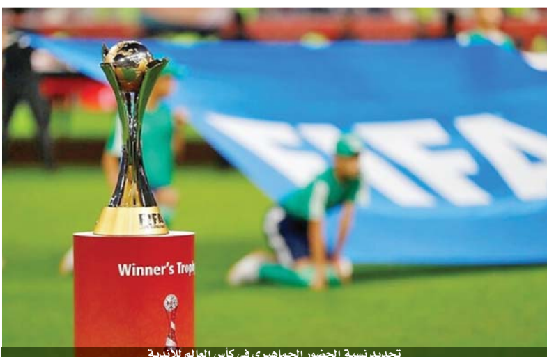
تحديد نسبة الحضور الجماهيري في كأس العالم للأندية

بإمكانهم الحصول على التذاكر، وستعين على جميع المشاركين في مونديال الأندية، إثبات خلوهم من العدوى قبل الوصول إلى قطر، ثم يخضعون لمزيد من الفحوص في المطار، قبل دخول نظام الفعالة الطبية، حسبما أوضح المصلح، ويشكل مونديال الأندية اختباراً للامور التنظيمية، قبل إقامة كأس العالم ٢٠٢٢ في قطر.