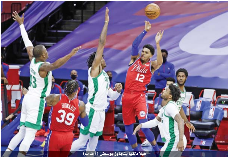
فيلادلفيا يتجاوز يوسطن