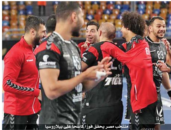
منتخب مصر يحقق فوزاً كاسحاً على بيلاروسيا