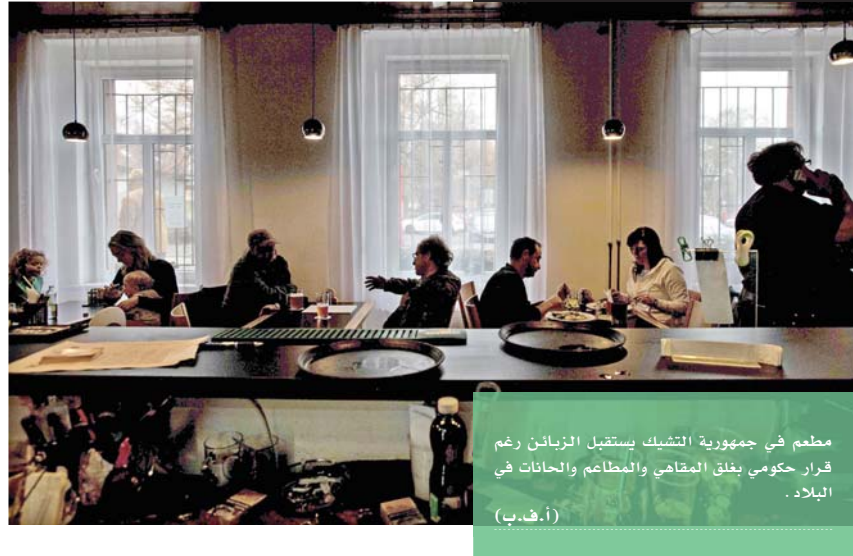
معلم في جمهورية التشيك يستقبل الزبائن رغم قرار حكومي بخلق المقاهي والمطاعم والحانات في البلاد.