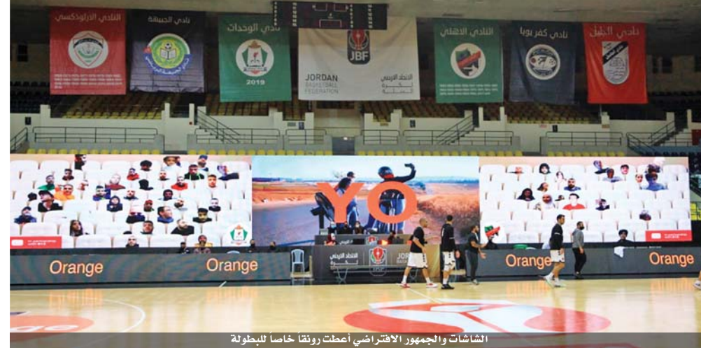
الشاشات والجمهور الافتراضي أعطت رونقاً خاصاً للبطولة