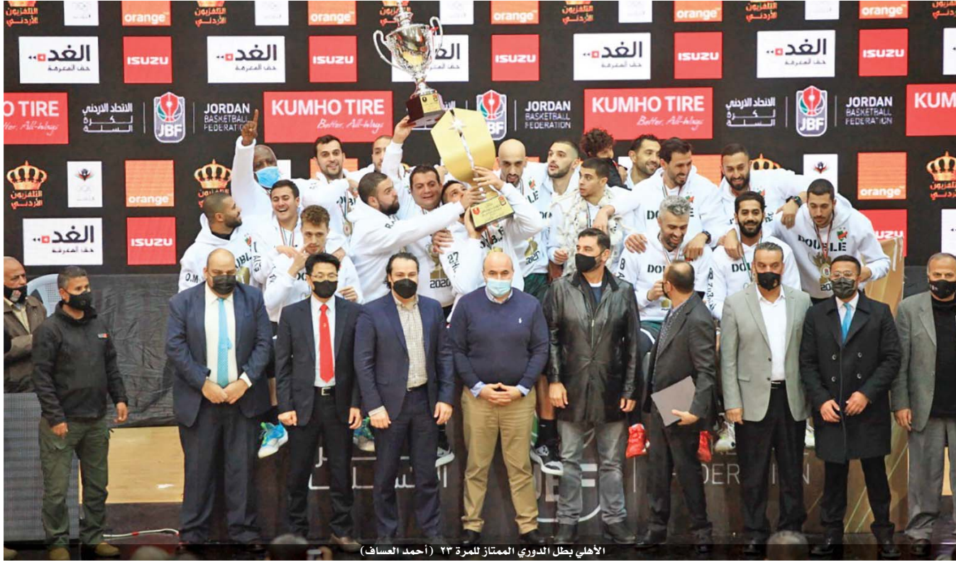
الأهلي يظل الدوري الممتاز للمرة ٢٣ (أحمد العساف)