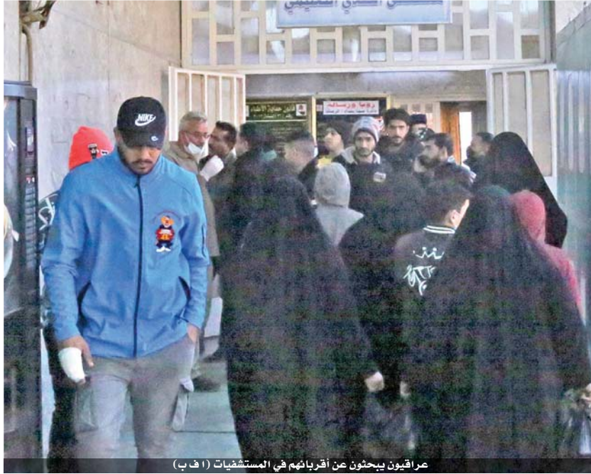
عراقيون يبحثون عن أقربائهم في المستشفيات

قتل ٣٢ شخصاً وأصيب ١١٠ آخرون بجروح امس في تفجيرين انتحاريين في وسط بغداد، في اعتداء أوقع أكبر عدد من الضحايا في العاصمة العراقية منذ ثلاث سنوات. وتقتل أفراد عائلات الضحايا مضجوعين في أروقة أحد مستشفيات بغداد من سرير إلى آخر في محاولة للتعرف على أحيائهم الذين أصيبوا في الاعتداء. في مستشفى الشيخ زايد، تجمعت العائلات على بعد أقل من ثلاثة كيلومترات من ساحة الطيران حيث فجر انتحاريان نفسيهما في الصباح. وقد نقلت ست جثث و١٣ جريحاً يصارعون الموت، إلى المكان. ووقع الاعتداء في مجمع عمال مياومة وسوق الملابس المستعملة في ساحة مزدحمة وسط العاصمة التي يبلغ عدد سكانها عشرة ملايين نسمة.