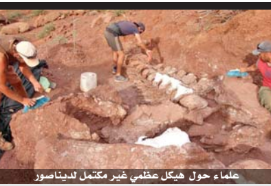
علماء حول هيكل عظمي غير مكتمل لديناصور

وقال دبلوماسي أوروبي إنه قد يتم التوصل إلى اتفاق بشأن أسماء عدة خلال اجتماع وزراء الخارجية في ٢٥ كانون الثاني. وأمام أنقرة مهلة شهرين لانتقاء الاتحاد الأوروبي بحسن نواياها. وسيعرض جوزف بوريل تقريراً حول العلاقات السياسية والاقتصادية والتجارية بين الاتحاد الأوروبي وتركيا وسيقترح خيارات على القادة الأوروبيين خلال قمة تعقد في آذار.