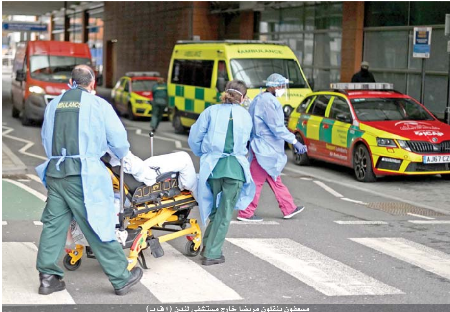
مستوفون ينقلون مريضاً خارج مستشفى لندن (أ ف ب)

وكانت عملية إخلاء حي سكني في وسط شنغهاي بعد اكتشاف ما لا يقل عن ثلاث إصابات بكوفيد-١٩، جارية. وهذه الإصابات هي الأولى المسجلة في هذه