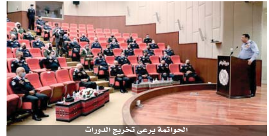
الحوامة يري تخريج الدورات

عمان - الرأي قال مدير الأمن العام اللواء الركن حسين الحوامة، إن الاستراتيجيات الأمنية وكل ما ينضوي تحتها من خطط وبرامج وغايات لا يمكن أن تترجم بالشكل الصحيح والمطلوب دون أن يرافقها برامج تدريبية متخصصة تعمل على تأهيل العاملين. وأضاف، خلال رعايته أمس، حفل تخريج دورتي إعداد رؤساء المركز الأمني ومراكز الدفاع المدني، إن الأمن العام وبعد تحقيق كافة متطلبات الدمج، ينطلق هذا العام نحو هدف التطوير والتحديث في آليات العمل والإجراءات، وبما يضمن التسهيل على المواطنين، مؤكداً أن تطوير مراكز الأمن والدفاع المدني يقف على سلم الأولويات كونها الأقرب والأكثر تماساً لتقديم الخدمات اليومية المؤثرة في المجتمع. ووجه مدير الأمن العام كلمة للخريجين من رؤساء المراكز الأمنية ومراكز الدفاع المدني أكد خلالها أن المراكز الأمنية ومراكز الدفاع المدني هي السبيل والملاذ الأول للمواطن عند الحاجة لهم