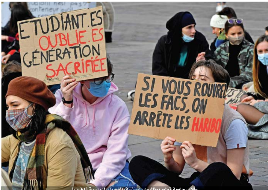
طلاب جامعة تولوز يطالبون باستئناف الفصول الدراسية