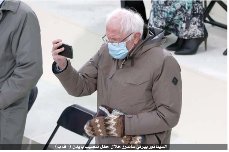
السيناتور بيرني ساندرز خلال حفل تنصيب بايدن

أذهلت مستخدمي الإنترنت. وتسائل البعض عما إذا كان قد طبع بخط كبير لمساعدة بايدين البالغ من العمر ٧٨ عاماً، على قراءته.