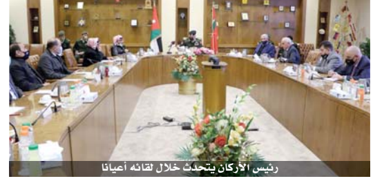
رئيس الأركان يتحدث خلال لقائه أعيان

عمان - الرأي قال رئيس هيئة الأركان المشتركة، اللواء الركن يوسف الحنيطي، إن القوات المسلحة الأردنية تسعى إلى تحسين أوضاع المتقاعدين العسكريين، وتقديم أفضل الخدمات والتسهيلات لهم، من خلال التواصل الدائم معهم للارتقاء بمستواهم المعيشي وتحسين ظروفهم الاقتصادية، إضافة إلى دعم مؤسسة المتقاعدين العسكريين وتطويرها بما يتناسب مع التحديات والظروف الحالية. وأبدى الحنيطي خلال لقائه أمس عدداً من أعضاء مجلس الأعيان المتقاعدين من المؤسسات العسكرية والأمنية، في القيادة العامة للقوات المسلحة، بحضور عدد من كبار ضباط القوات المسلحة ومدير عام المؤسسة الاقتصادية والاجتماعية للمتقاعدين العسكريين والمحاربين والقادمين، مؤكداً أنهم السند الحقيقي للقوات المسلحة في الدفاع عن الوطن وصون منجزاته، مشيداً بدورهم الفاعل في تحقيق الأمن الوطني الشامل في ظل الظروف والمتغيرات الإقليمية المحيطة والتحديات الاقتصادية التي يواجهها الوطن. وأشار أعضاء مجلس الأعيان إلى إيلاء جلالته القائد الأعلى جل اهتمامه ورعايته بالمتقاعدين العسكريين، ودعا خلال خطاب العرش إلى ضرورة دعم القوات المسلحة والأجهزة الأمنية