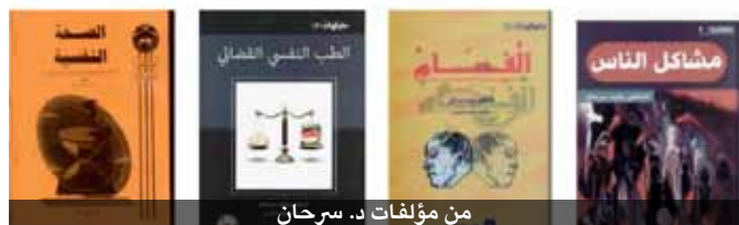
من مؤلفات د. سرحان