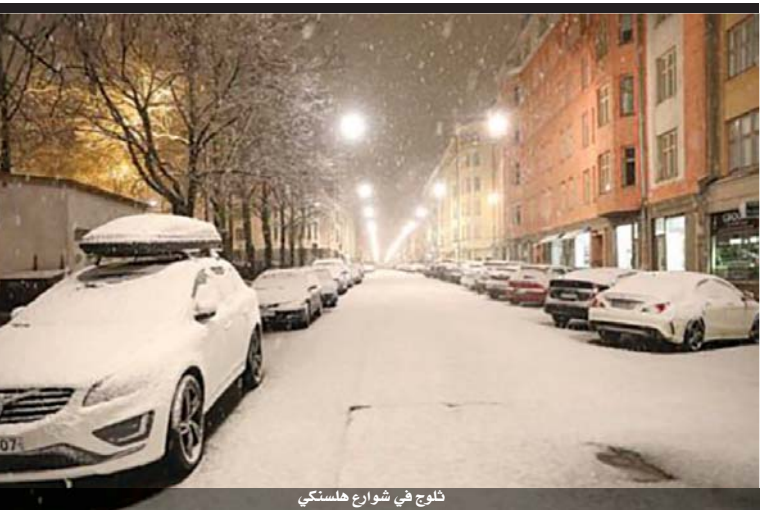
ثلوج في شوارع هلسنكي

وفي لحظة نسي خلالها وجود اللب، اعتمَرَ قبعة «الكابوي» الخاصة به وركض بدون كمامة لإلقاء التحية على العديد من الشخصيات البارزة قبل معانقة الرئيس السابق جورج بوش الابن.