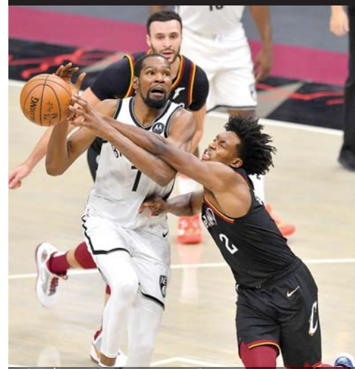
سكستون لاعب كيلفاند يحاول قطع الكرة من دورانت نجم نتس

الحادثتان تركتا مساحة من القلق في منظومة كرة اليد، فالتعامل مع انتشار الفيروس ليس بالأمر السهل، وتعد عدم الجدية بمعالجة ما ظهر فوق سطح منافسات الدوري حالة غير محببة، بل كان من الواجب أن يتم التعامل مع الحادثتين بمنتهى الشدة من اللجنة الأولمبية، باعتبار أنها المسؤولة أمام الحكومة ومركز الأزمات عما يحصل في الاتحادات الرياضية من خلل في تطبيق البروتوكول الصحي والذي تم اعتماده كشرط أساسي لعودة النشاطات التنافسية بعد توقف قارب الأربعة أشهر نتيجة انتشار جائحة كورونا، ما لفت الانتباه، أن اتحاد كرة اليد، لم يتحمل مسؤولية الأحداث التي حصلت رغم أنها بالغة الخطورة، ولو أنها حدثت في أوج الجائحة كان وجد نفسه تحت مسائلة قوانين أوامر الدفاع، وكان سبباً في إعادة إيقاف الأنشطة الرياضية لاعتبارات كثيرة بهدف حصر انتشار الفيروس.. فالإتحاد اكتفى برده على كتاب اعتراض الأهلي بالاستفسار من العربي عن موعد إجراء اللاعب محمد نايف فحص كورونا ومتى ظهرت النتيجة، وفي نهاية خطابه أشار الإتحاد إلى إنه يتابع الإجراءات الصحية وتطبيقها بكامل المسؤولية