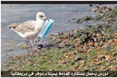
نورس يحمل بمتقارده كمامة يميناء دوفر في بريطانيا

وأوضح البروفيسور غاريدو مدير متحف العلوم الطبيعية في زابالا «نعتقد أننا سنتمكن من إخراج العينة كاملة أو شبه كاملة. سيعتمد كل ذلك على طريقة استمرار عمليات الحفر. ولكن بعض النظر عما إذا كان هو أكبر ديناصور أو لا، فإن العثور على ديناصور مفصل، ديناصور بهذا الحجم، هو أمر استثنائي».