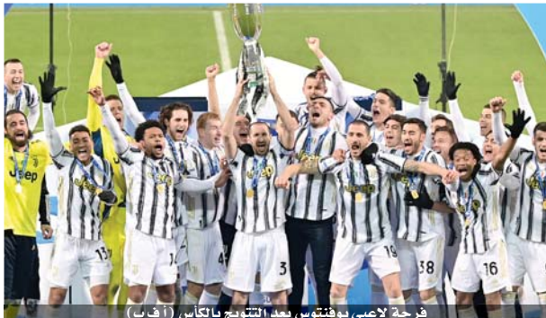
فرحة لاصبي يوفنتوس بعد التتويج بالكأس

وصعد خيتافي الى المركز التاسع برصيد ٢٣ نقطة مقابل ١٢ نقطة لهويسكا صاحب المركز الأخير.