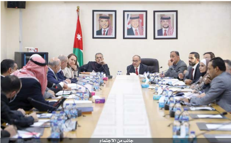
جانب من الاجتماع

أعلنت المؤسسة العامة للضمان الاجتماعي البدء باستقبال طلبات الاستفادة من برنامج استدامة عن شهر كانون الثاني الحالي اعتباراً من امس الخميس الموافق ٢١ كانون الثاني ٢٠٢١. وأضافت المؤسسة، في بيان صحفي امس الخميس، أنه يتوجب على المنشآت الراغبة بالاستفادة الدخول على حسابها على الخدمات الإلكترونية للمؤسسة وتقديم طلب الاستفادة من برنامج استدامة. وأكدت المؤسسة على المنشآت المشمولة