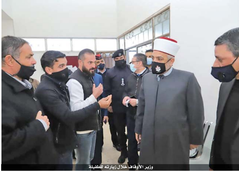
وزير الأوقاف خلال زيارته للطفيلة