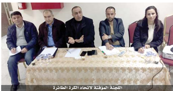
اللجنة المؤقتة لاتحاد الكرة الطائرة

وختم: إذا كانت أندية الدرجة الممتازة غير راضية عن تغيير مسماها هذا الموسم الذي أصبح الدرجة الأولى، رغم أن الأندية المنتسبة للاتحاد هي في الأصل مستنفة بدرجتين، فهذا الأمر قابل للتباحث فيه خلال الاجتماع معها، ويمكن أن يُحاطب وزارة الشباب، لإعلامها بهذا التعديل، من أجل إبقاء حجم الدعم الذي كانت تقدمه للدرجة الممتازة، لتحصل عليه أندية الدرجة الأولى.