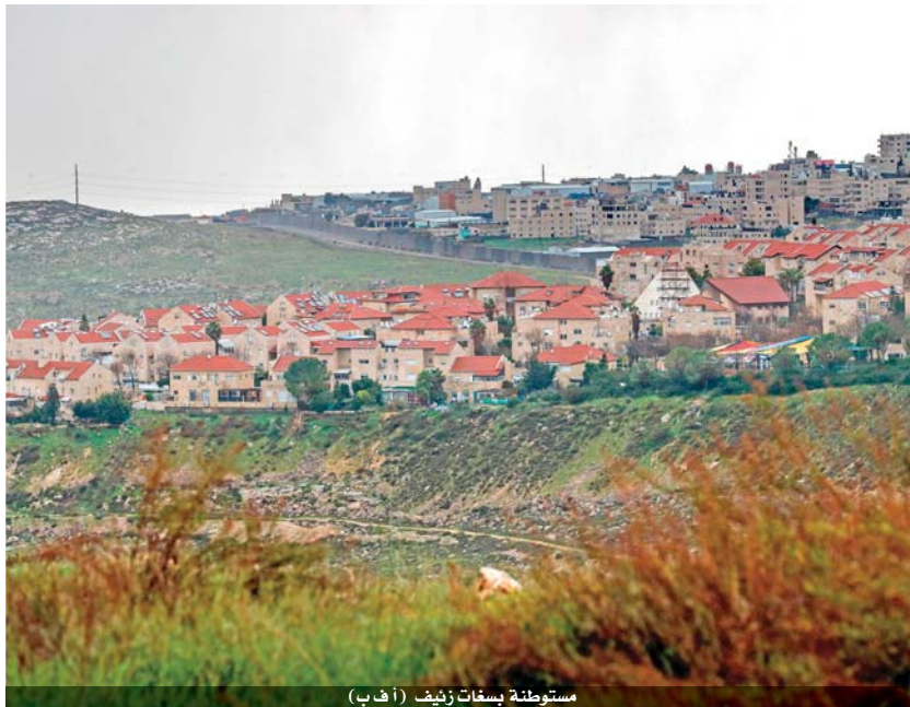
مستوطنة بسغات زينب

وأوضح المجلس امس الخميس، أن اعتداءات سلطات الاحتلال المتصاعدة لا تقف عند ما يجري للمسجد الأقصى المبارك، بل تتعرض المقدسات الأخرى لمواطنين فلسطينياً من مناطق مختلفة في الضفة الغربية المحتلة. وقال نادي الأسير الفلسطيني، في بيان له، إن قوات الاحتلال الإسرائيلي اقتحمت مناطق متفرقة في مدن الخليل وأريحا ورام الله والبريدة وجنين وسط إطلاق كثيف للنيران، واعتقلت المواطنين الـ ١٥ بزعيم أنهم مطلوبون. على صعيد متصل فتحت قوات الاحتلال الإسرائيلي عبارات مياه الأمطار في حي الشجاعية، شرقي مدينة غزة، ما تسبب بإغراق مئات الدونمات الزراعية. وقالت وزارة الزراعة في قطاع غزة، امس إن الاحتلال الإسرائيلي فتح عبارات مياه الأمطار، وتسبب في إغراق مئات الدونمات الزراعية. وأشارت إلى أن هناك خسائر كبيرة وأضراراً مباشرة وغير مباشرة في أراضي المزارعين التي غرقت بالمياه.