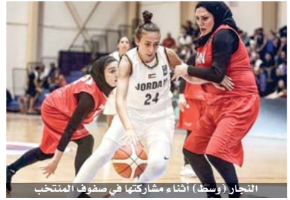
النجار (وسط) أثناء مشاركتها في صفوف المنتخب