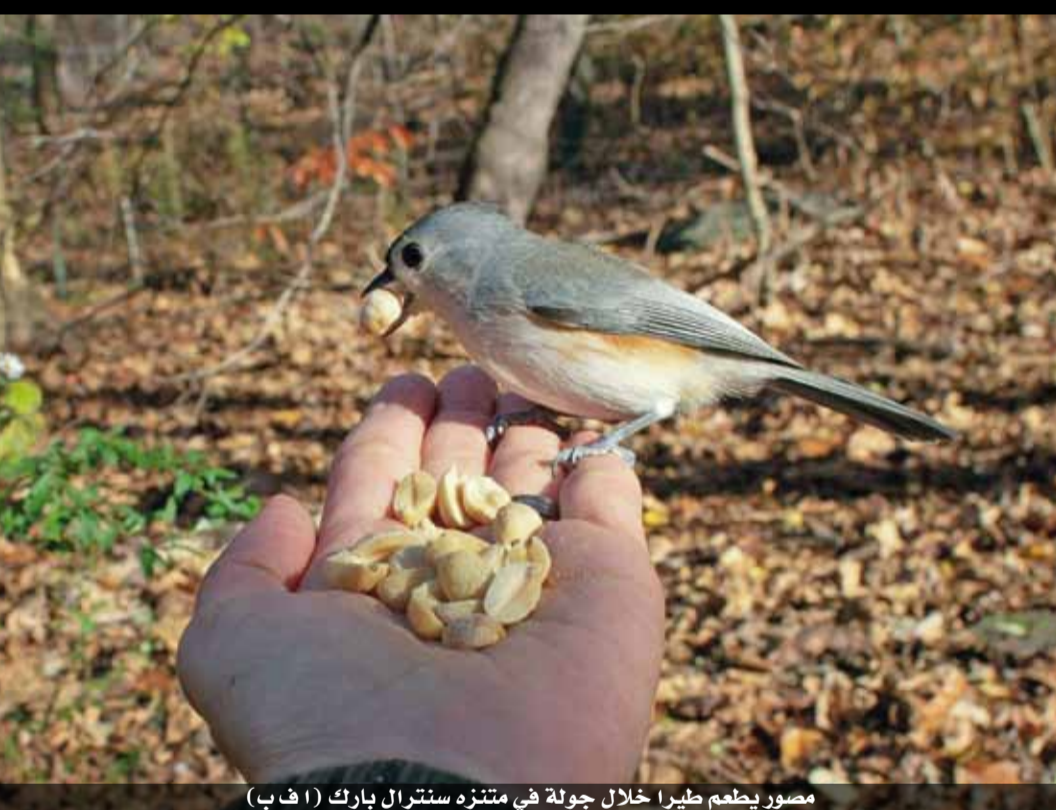
مصور يطعم طيراً خلال جولة في متنزه سنترال بارك

أداء عمل النواب سوف يكون تحت نظر الجميع ويكون الشعب والحكومة له بالمرصاد على حد سواء لإيجاد توازن بين المطالب وبين النتائج في ظل الظروف المحلية والخارجية.