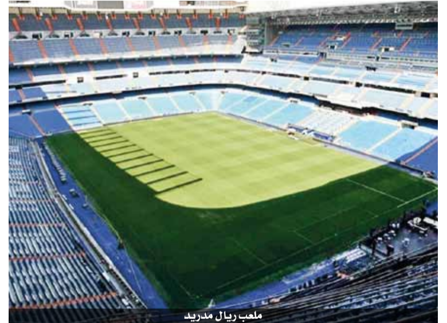
ملعب ريال مدريد

الرأي - اقتربت حجم الخسارة ٩١ مليون يورو. ورغم كل ذلك، أعلن النادي الإسباني في بيان له أنه «في وضع مالي جيد، بفضل وجود صافي ٥٣٣ مليون يورو، و١٢٥ مليون يورو في الخزائنة». أما بالنسبة لموسم ٢٠٢٠/٢٠٢١، فهناك توقعات بخسائر عائدات ٣٠٠ مليون يورو مقارنة بالأعوام السابقة للجانحة. بالمثل، ذكر الريال أن أعمال الإنشاءات في ملعب سانتياجو برنابيو وصلت تكلفتها إلى ١١٣,٧ مليون يورو استمارا تراكمياً، ولتخفيف آثار خسائر العائدات، فقد اتبع النادي «سلسلة من الإجراءات لترشيد الإنفاق». وتقرر استقطاع ١٠٪ من رواتب اللاعبين ومدربي الفرق الأولى في أعاب كرة القدم والسلة، وكذلك رواتب الإداريين الكبار في مختلف الجهات بالنادي، فضلاً عن تقليص النفقات التشغيلية، بـ ٨٪.