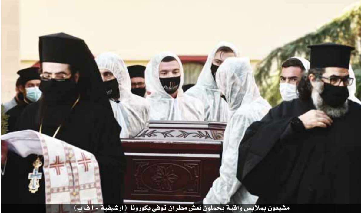
مشيوعن بملابس واقية يحملون نعش مطران توفي بكورونا

الدعوات لتعليق المناولة بأنها في غير مكانها ومبالغ فيها، في حين شبه أسقف كريت وضع رجالا مع العبودية». وأجريت العديد من حفلات الزفاف والعمادة بدون تدابير وقائية خلال الصيف ويشتهر أنها أسهمت في رفع معدل انتقال العدوى. لكن على الكنيسة «أخيراً أن تخضع للعلم، الذي لم تجمعه معه قط علاقات طيبة»، وفق ساكلاريو. ويخشى الأكاديمي في الأثناء من أن يبقى جزء من رجال الدين مشككاً بخطورة الفيروس، موضحاً «إذا ما قرأنا مقالات علماء اللاهوت والكنهنة، نرى بوضوح أن هذا الموقف لا يزال قائماً».