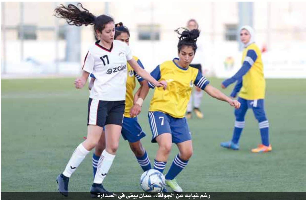
رغم غيابها عن الجولة.. عمان يبقى في الصدارة

وسط تطبيق بروتوكول صحي مشدد، ووفق تعليمات جديدة أقرتها لجنة الطوارئ، لضمان استدامة البطولة، وتحقيق كافة متطلبات السلامة العامة، لدى الاتحاد.