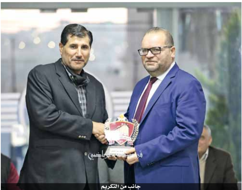
جانب من التكريم