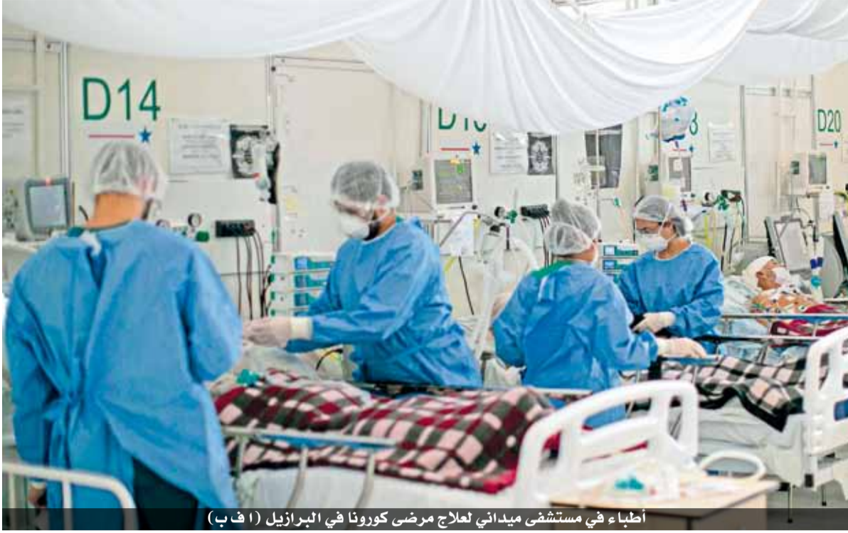
اطباء في مستشفى ميداني لعلاج مرضى كورونا في البرازيل

وحذر مسؤولو الصحة الأميركيين من أن الرحلات التي قام بها ملايين الأميركيين قبل أسبوع بمناسبة عيد الشكر قد تسببت في «تفش للمرض يضاف إلى تشييه حاليا»، كما قال عالم المناعة الذي يحظى باحترام كبير الطبيب أنطوني فاوتشي. ودعي فاوتشي الذي كان هدفا لهجمات