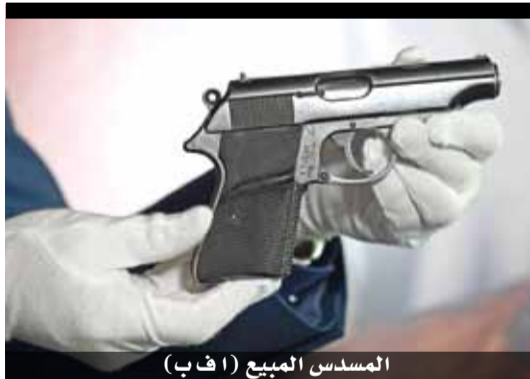
المسدس المبيع

هنا نرى سمو ولي العهد والذي يعتبر قاطرة الحراك الشبابي الدولي، والذي كان دائما ضمن إطار البنية النخبوية الدولية في الدفاع عن حقوق الشباب، ويعتبره كثير من النخبة الشبابية حجر الأساس في صياغة قوانين دولية ومرجعيات أخلاقية إنسانية في التشكيل القادم لمنظومة العلاقات الدولية وبنائها، ونعني هنا أن سمو الأمير قد وقف أمام مجلس الأمن والمؤسسات الدولية كمندافع حقيقي عن آمال وأحلام وروية الشباب الدولي حول مطالبه المباشرة وغير المباشرة، كون الشباب وكما أوضح ولي العهد هي المحركات الجبارة لأحداث التغيير المستعد.