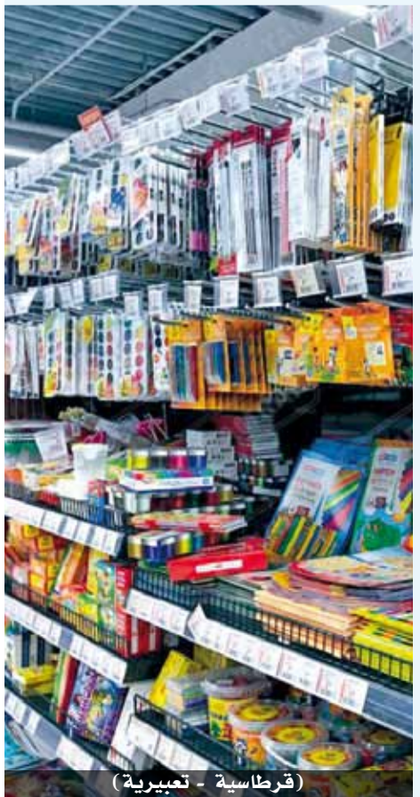
المقبل أم لا؟..

هذا السؤال لم يتم الإجابة عليه بعد، فقطاع أصحاب المكتبات مهدد بالانهيار ما ان استمرت الحكومة بعدم الالتفات لهم وتقديم حلول تخرجهم من هذا النفق المظلم.