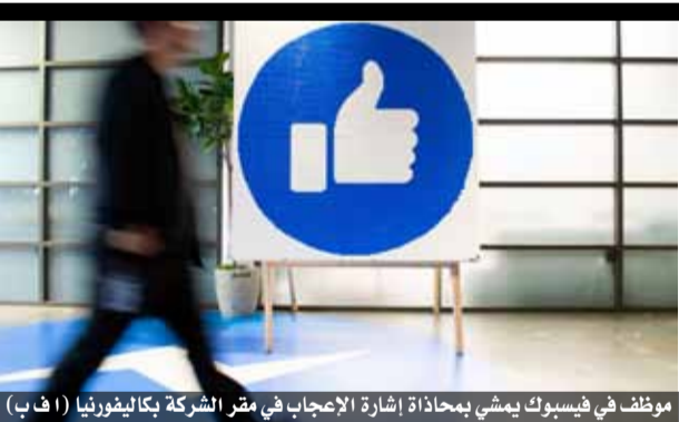
موظف في فيسبوك يمشي بمحاذاة إشارة الإعجاب في مقر الشركة بكاليفورنيا

ويعتبر كثيرون أن شون كونري هو أفضل من أدى دور جيمس بوند على الشاشة. وقد اضطلع كونري بهذا الدور ست مرات، فضلا عن النسخة المكيفة «نيفر ساي نيفر آغين».