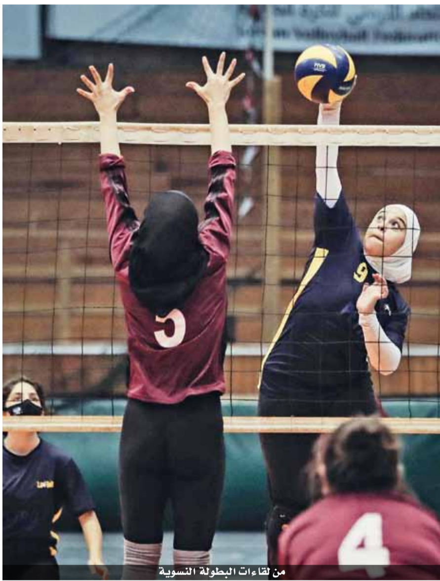
من لقاءات البطولة النسوية

في سياق مُثل، من المقرر أن تكون اللجنة المؤقتة للاتحاد عقدت الليلة الماضية اجتماعاً برئاسة العميد جهاد قطيشات. وكشف مصدر في الاتحاد عن توجه الاتحاد لإقامة مباريات بطولات الموسم القادم بمن حضر، لافتاً إلى أن لائحة الاتحاد تسمح بتسجيل (٢٠)