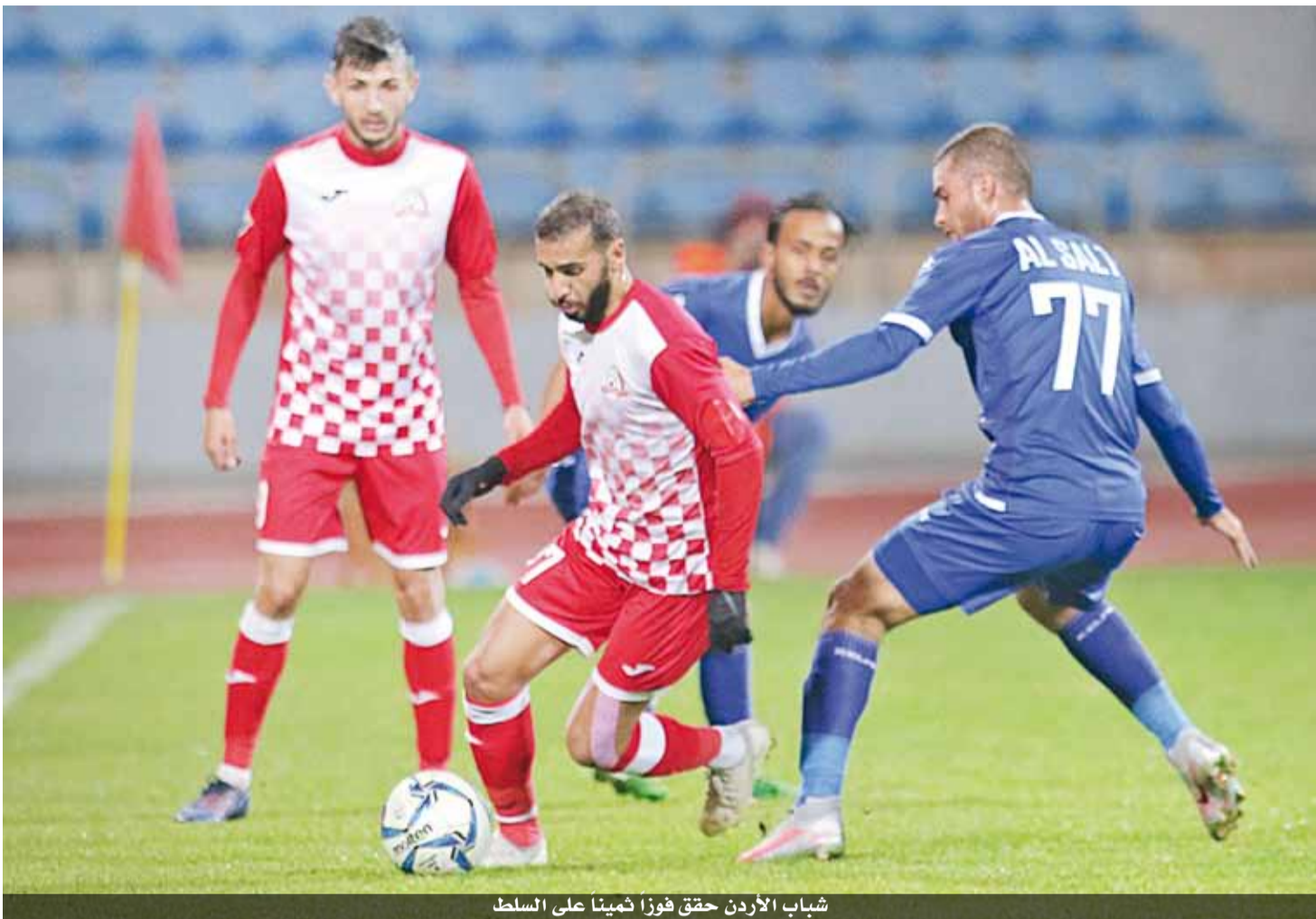
شباب الأردن حقق فوزاً ثميناً على السلط

تعادله الأخير مع الجزيرة أو تفوق ذلك، ضامن مساعيه للتقدم إلى مناطق أكثر أماناً على سلم الترتيب العام. وفي المباراة الأخرى يدرك الرمثا (٢٥ نقطة) والذي يعيش أفضل حالاته نوعاً ما أن الفوز سيحمله ملاصقاً للجزيرة صاحب المركز الثاني وإبقاء الفارق معه نقطة واحدة فقط، ولكنه في الوقت نفسه يعي تماماً أن منافسه معان (١٧ نقطة) سيحاول قدر الإمكان عدم التفريط بفرض رفقته النقطي باعتبار ذلك طريقاً للتقدم إلى مركز أفضل. وكان الرمثا فاز في الجولة الماضية على السلط ١-٢، وبالمقابل تعادل معان مع الوحدات ١-١ في مباراة قدم خلالها أداءً مميّزاً يريد تكراره اليوم. إلى ذلك، شهد الأسبوع الخامس عشر أمس إقامة مباراتين بين الحسين الذي ظهر لأول مرة تحت قيادة المدرب الوطني بلال اللحام خلفاً لعثمان الحسنة