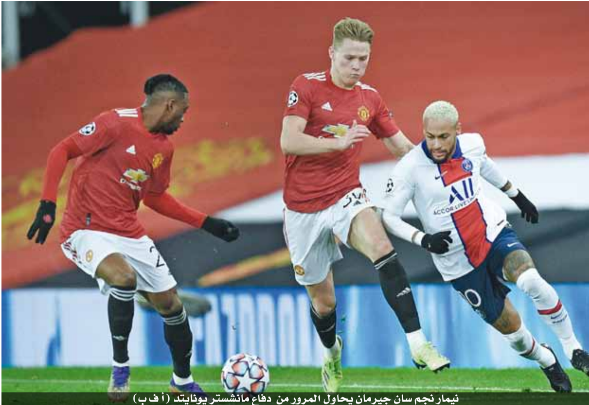
نيمار نجم سان جيرمان يحاول المرور من دفاع مانشستر يونايتد