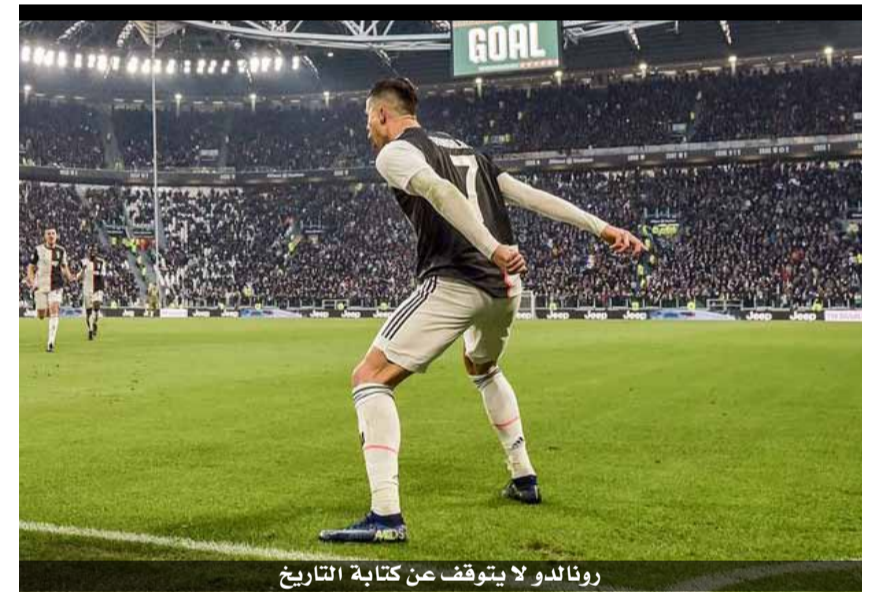
رونالدو لا يتوقف عن كتابة التاريخ