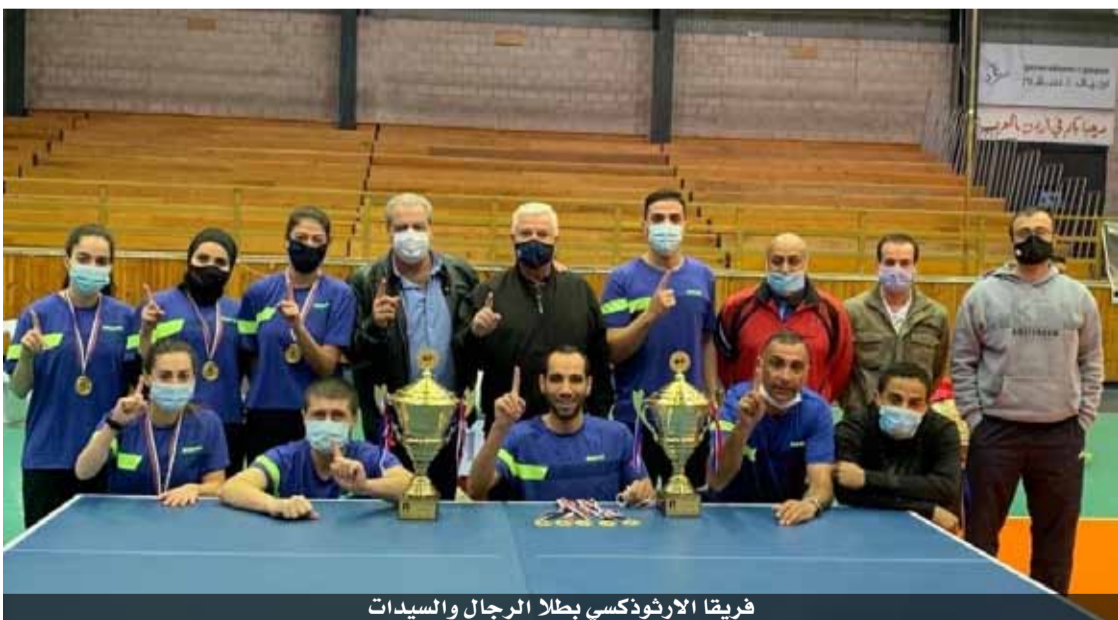
فريقا الارثوذكسي بطلا الرجال والسيدات