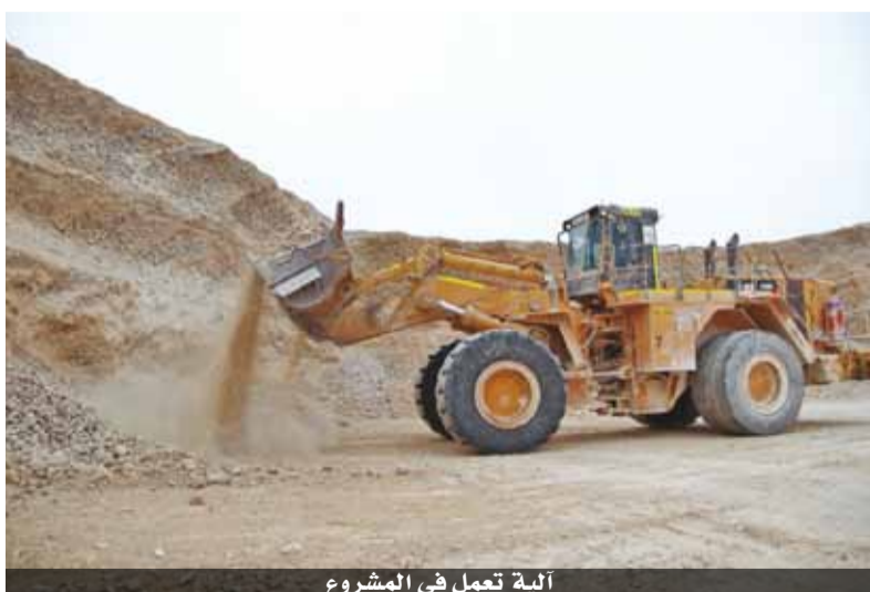
آلية تعمل في المشروع