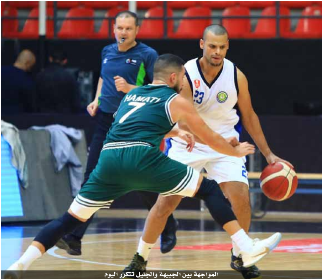
المواجهة بين الجبيهة والجليل تتكرر اليوم