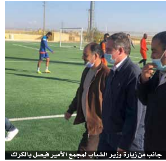
جانب من زيارة وزير الشباب لمجمع الأمير فيصل بالكرك