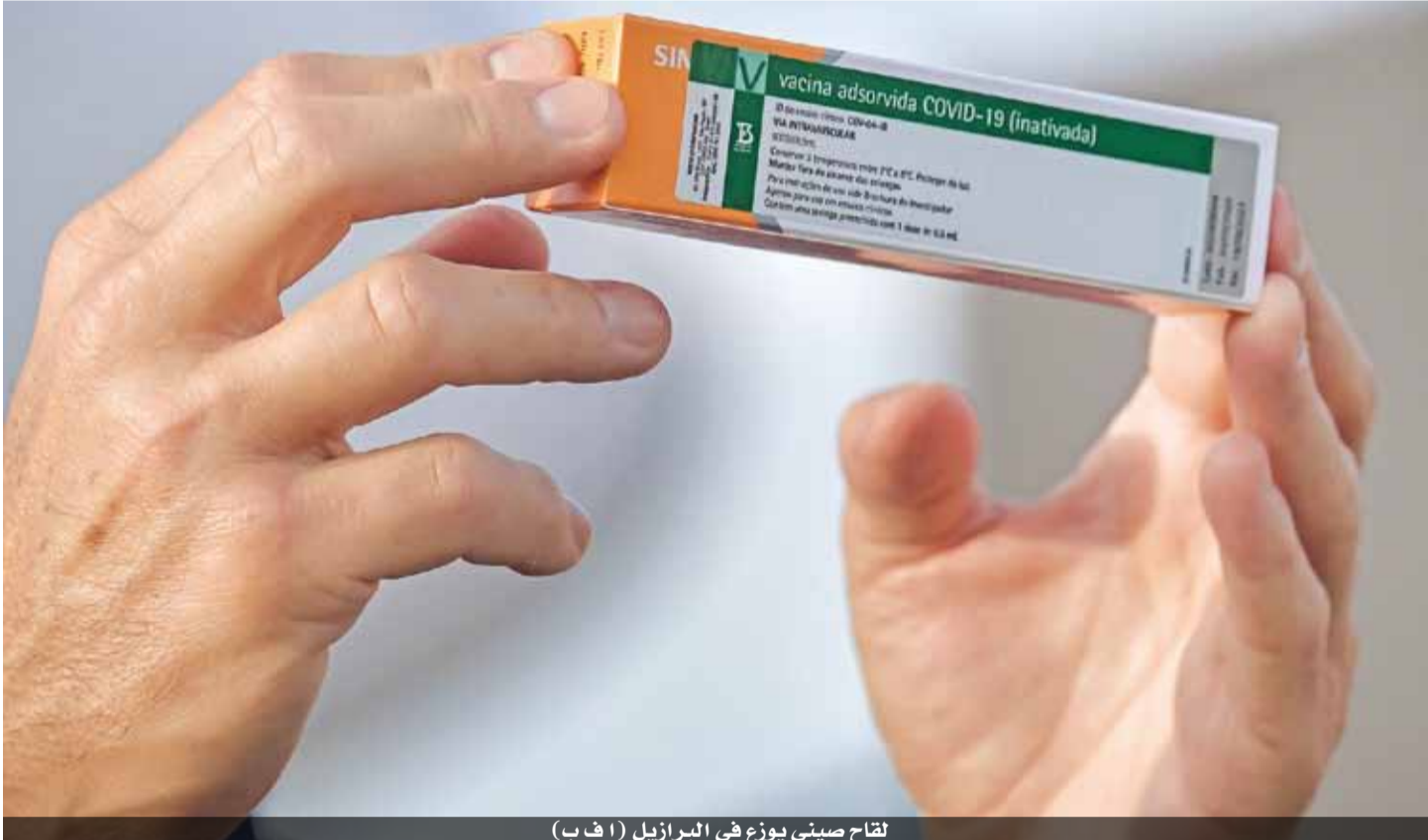
لقاح صيني يوزع في البرازيل