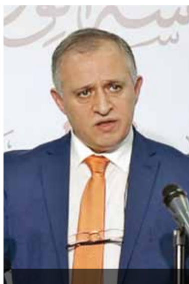
رئيس الوزراء خلال مؤتمر صحفي مشترك امس

وأشار الى برامج إضافية وفرتها المؤسسة العامة للضمان الاجتماعي مثل التوسع في برنامج تمكين اقتصادي ٢ بهدف تحسين مداخيل العاملين أيضاً والاستمرار بتنفيذ برنامج مساند واحد بديل التعطل مع التوسع في منافعه، وان هذه البرامج سيتم شرحها بالتفصيل في الايام القادمة.