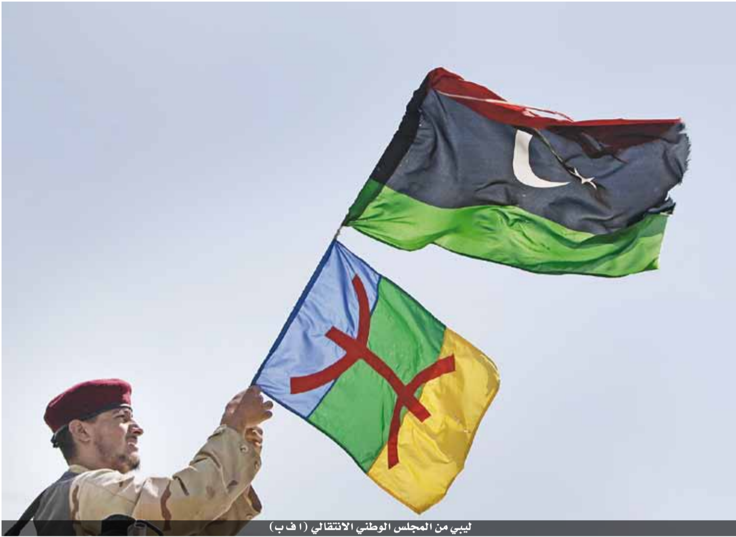
ليبي من المجلس الوطني الانتقالي

وختم «إن الكرة الآن في ملعب السياسيين (...) لإظهار جدية استعدادهم لتقديم تنازلات مؤلمة من أجل إنهاء الانقسام».