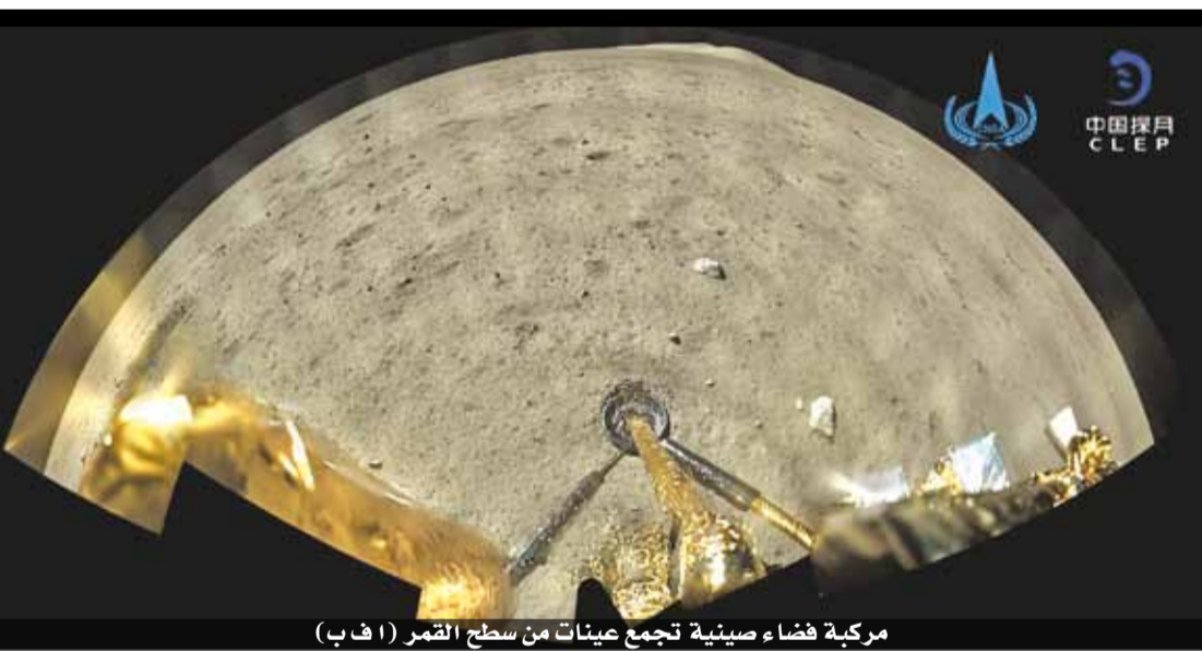
مركبة فضاء صينية تجمع عينات من سطح القمر

الولايات المتحدة - أ ف ب كان سؤال واحد يدور في أذهان الركاب السبعة والثمانين في أول رحلة مخصصة للعاملة لطائرة من طراز بوينغ ٧٣٧ ماكس، بعد السماح باستئناف العمل بهذا النموذج... فكنهم، وهم بغالبيتهم من الصحافيين، كانوا يتساءلون إن كانوا سيصلون سالمين إلى وجهتهم. في تشرين الثاني، أجازت سلطات الولايات المتحدة لهذا الطراز من الطائرات التحليق مجدداً في فضاء البلد إثر حظر