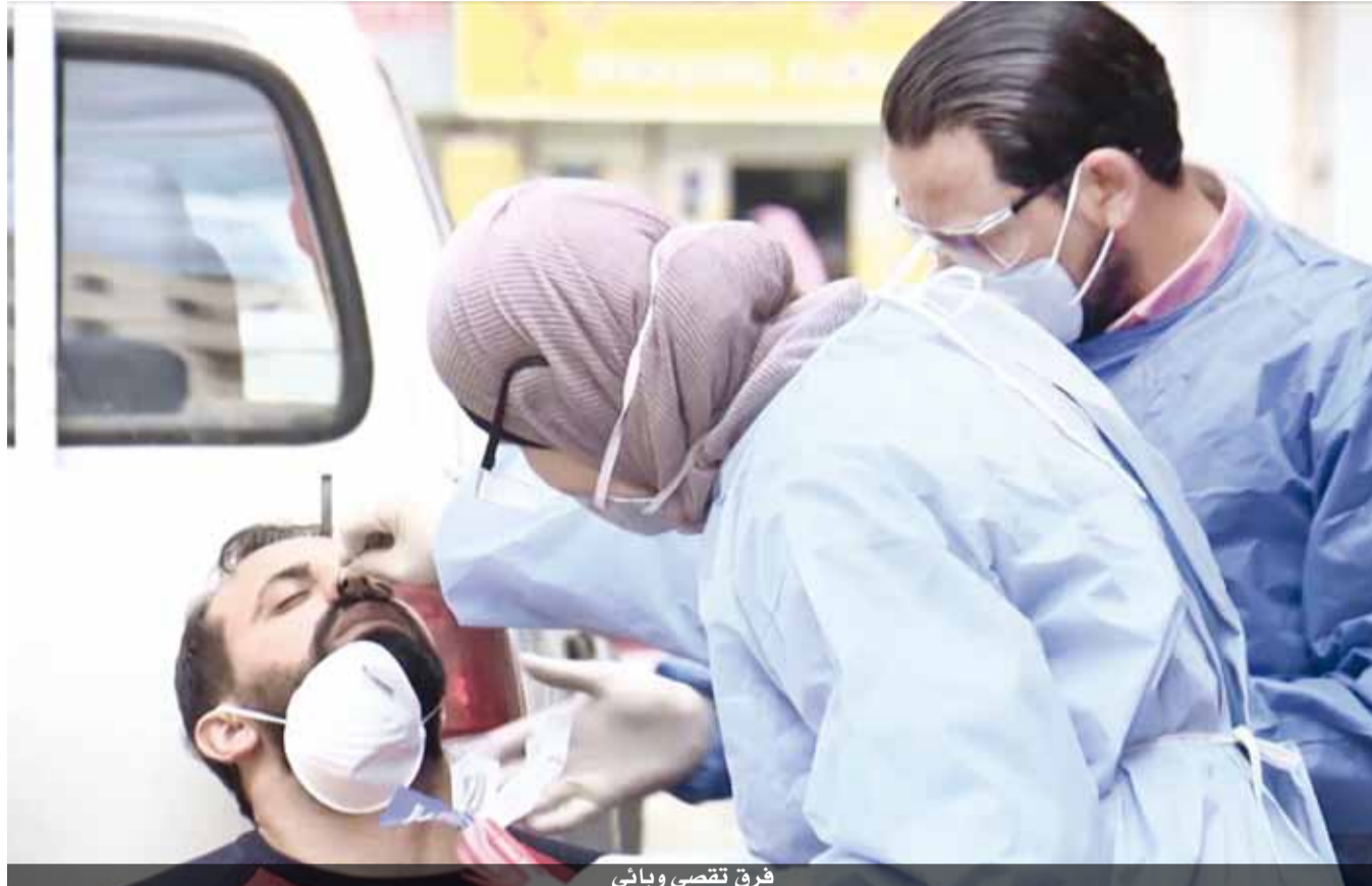
فرق تقصي وبائي

أعلنت وزارة الصحة عن تسجيل ٥٥ وفاة و ٤٠٢٩ إصابة بفيروس كورونا المستجد في المملكة امس، ليرتفع العدد الإجمالي إلى ٢٩٠٩ وفيات و٢٣١٢٣٧ إصابة. وتوزعت الإصابات على ١٣٧٦ حالة في محافظة العاصمة عمان، و٩٠٤ حالات في محافظة إربد، منها ٥١ حالة في الرمثا، و٢٧٠ حالة في محافظة المفرق، و٢٦٦ حالة في محافظة عجلون، و٢٢٦ حالة في محافظة جرش، و٢١١ حالة في محافظة الكرك، و٢٠٣ حالات في محافظة البلقاء، و١٧٧ حالة في محافظة الزرقاء، و١٢٤ حالة في محافظة مادبا، و١٢١ حالة في محافظة العقبة، و١٠٠ حالة في محافظة الطفيلة، و٥١ حالة في محافظة معان، منها ٢٤ حالة في البترا.