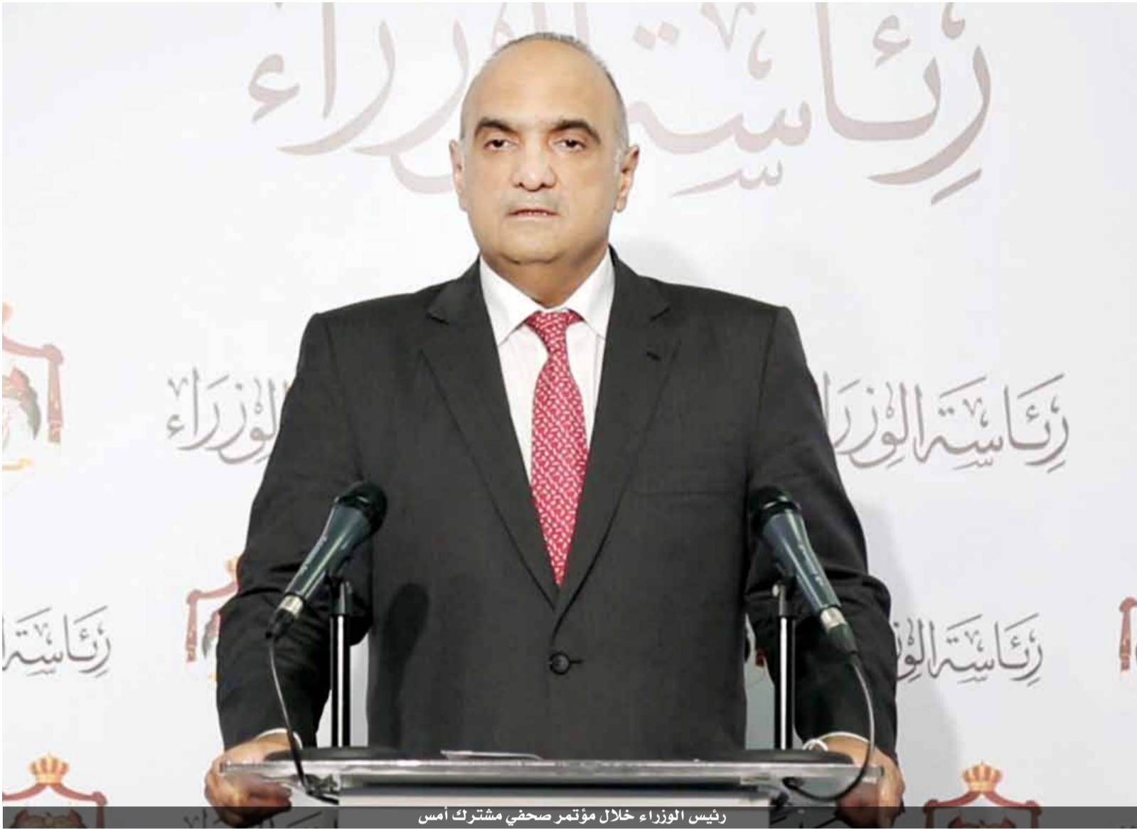
رئيس الوزراء خلال مؤتمر صحفي مشترك امس

أعلن رئيس الوزراء الدكتور بشر الخصاونة عن إجراءات حكومية تهدف للتخفيف من التبعات الاقتصادية والمعيشية على بعض القطاعات المتضررة وتحمل جزءاً من اجور العاملين في القطاع الخاص وتوسيع الحماية الاجتماعية للأسر والأفراد وقيمة إجمالية تصل الى نحو ٣٢٠ مليون دينار. وأكد رئيس الوزراء خلال مؤتمر صحفي في رئاسة الوزراء مساء امس، أن هذه الإجراءات التي تأتي تنفيذاً للتوجيهات الملكية السامية تستهدف زيادة عدد المستفيدين من صندوق المعونة الوطنية (برنامج تكافل ٣) بمقدار ١٠٠ ألف أسرة ليغطي بالإضافة الى هذه الأسر بعض عمال المياومة غير المشمولين بمظلة الضمان الاجتماعي.