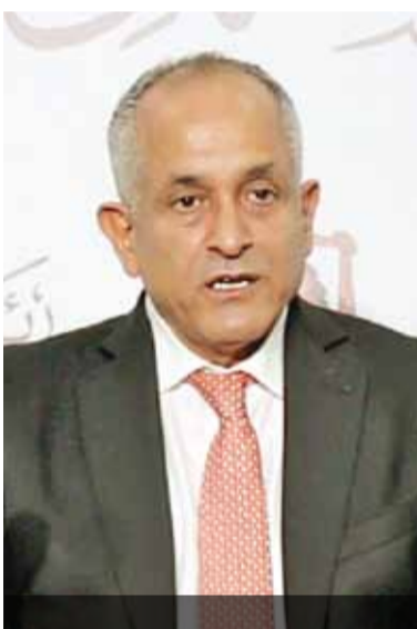
رئيس الوزراء خلال مؤتمر صحفي مشترك امس

وحول استمرار العمل بقانون الدفاع رقم (١٣) لسنة ١٩٩٢، أوضح العايد أن القانون جاء بسبب جائحة كورونا وكانت التوجيهات الملكية للحكومة باستخدامه في أضيق الحدود، مشيراً إلى استمرارية العمل بالقانون لحين زوال الجائحة.