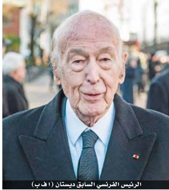
الرئيس الفرنسي السابق ديستان

وكان فاليري جيسكار ديستان يعزف الأكورديون ويحل ضيفاً على موايد الفرنسيين ويستضيف في قصر الإليزيه الرئاسي عمال تنظيفات من مالي على وجبة فطور بمناسبة عيد الميلاد محذراً التواصل الإعلامي الذي كان مغلفاً حتى ذلك الحين. لكن رغم ذلك، كان جيسكار ديستان نتاجاً صرفاً للنخبة الفرنسية. فقد تخرج من معهد بوليتكنيك ومدرسة الإدارة العليا وتميز في صفوف الجيش خلال تحرير فرنسا ومن ثم خلال ثمانية أشهر في ألمانيا وثماناً حتى استسلام ألمانيا. ولد جيسكار ديستان في كوبلنز الفرنسية وهو ينتمي إلى عائلة بورجوازية كبيرة. دخل جيسكار ديستان إلى الحكومة في العام ١٩٥٩ وتولى حقائب وزارية عدة لا سيما الاقتصاد والمال في الستينات والسبعينات. وقد تغلب على جاك شابان ديلماس فارضا نفسه زعيماً لليمين حتى فوزه بالرئاسة العام ١٩٧٤.