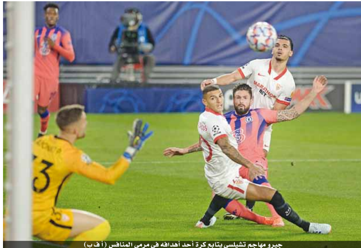
جيرو مهاجم تشيلسي يتابع كرة أحد أهدافه في مرمرى المنافس

ماتيو كوفاشيتش أنهاها وجه الهدف الثالث من ضربة فورتسفاوروش المجري ٢-٠ في الجولة الخامسة قبل الأخيرة من دور المجموعات، فيما فاز يوفنتوس الإيطالي على ضيفه دينامو كييف الأوكراني بالنتيجة ذاتها. وهو الفوز الخامس للفريق الكاتالوني في المسابقة القارية ليرفع رصيده إلى ١٥ نقطة مقابل ١٢ ليوفنتوس، فيما استقر رصيد دينامو كييف وفورتسفاوروش عند نقطة واحدة مع أفصلية للفريق الأوكراني بفارق الأهداف، وستكون مباراة الثلاثاء القادم بينهما حاسمة لمن سينال جائزة الترضية بالانتقال إلى دور الـ٣٢ من الدوري الأوروبي (يورولا ليغ).