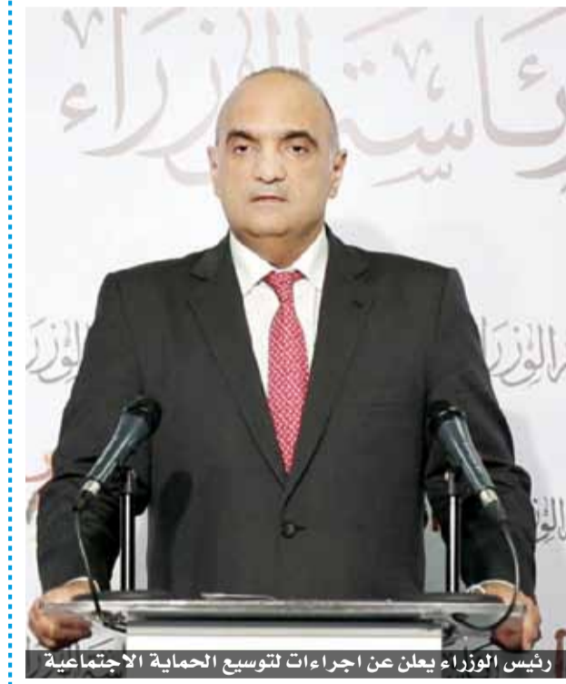
رئيس الوزراء يعلن عن اجراءات لتوسيع الحماية الاجتماعية

تحسن المنحنى الوبائي سيقابل بتخفيف الإغلاقات