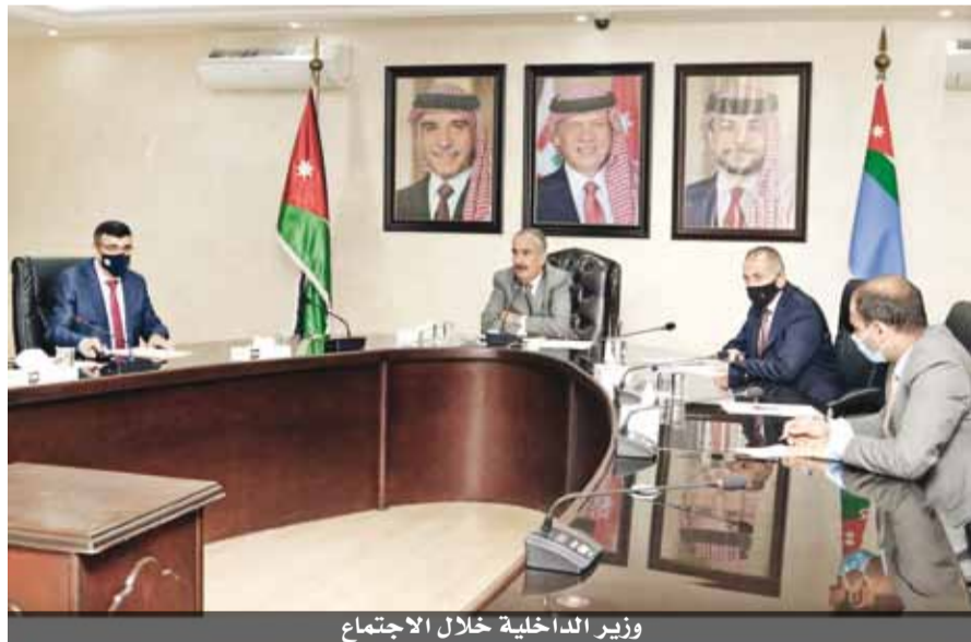
وزير الداخلية خلال الاجتماع