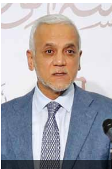
رئيس الوزراء خلال مؤتمر صحفي مشترك امس

وبيّن، أن برنامج تكافل ٣، يستهدف العاملين