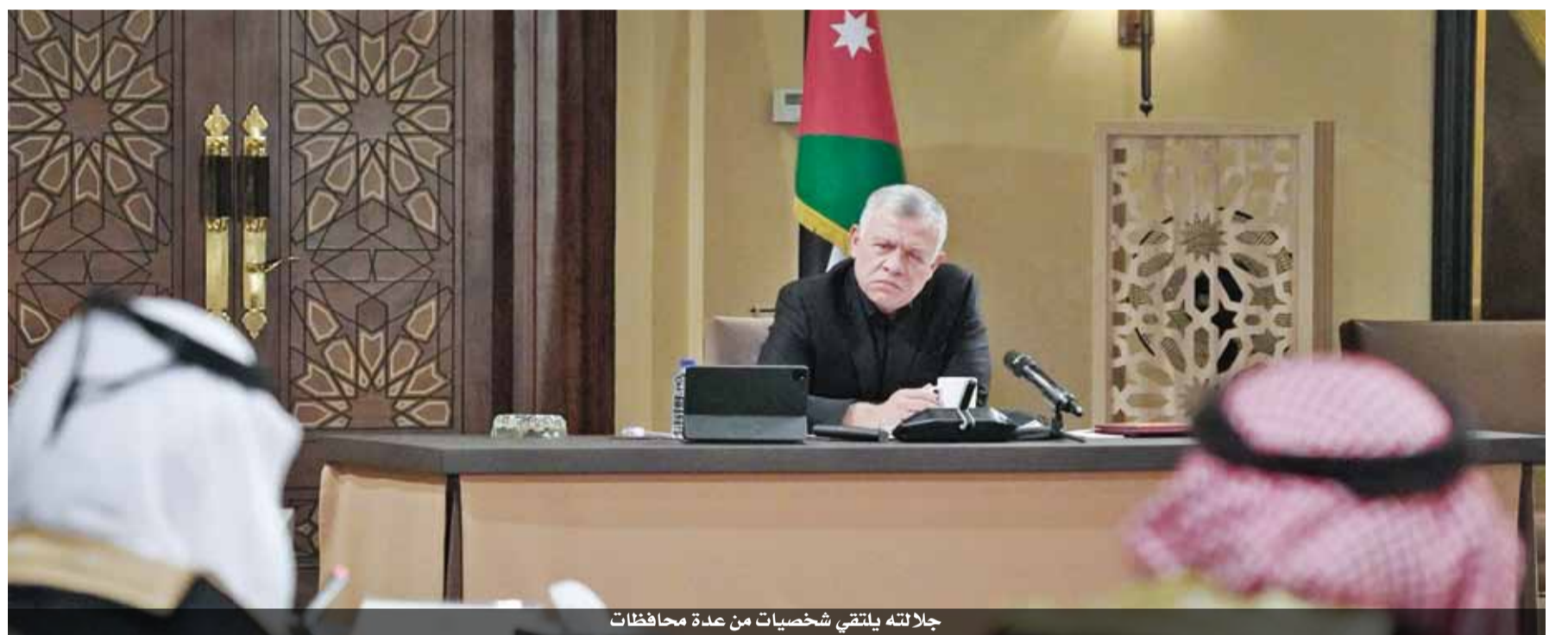
جلالته يلتقي شخصيات من عدة محافظات

ضرورة العمل بشكل جماعي لإنجاح الخريطة الزراعية