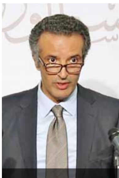
رئيس الوزراء خلال مؤتمر صحفي مشترك امس

وتابع «هناك ايمان كبير من قبل الحكومة بأهمية القطاع السياحي، بالإضافة إلى التوافق بين وزارة السياحة والآثار والضمان الاجتماعي بأن القطاع سيستعيد تعافيه بشكل قوي وسيتمكن من الايفاء بالتزاماته للضمان».