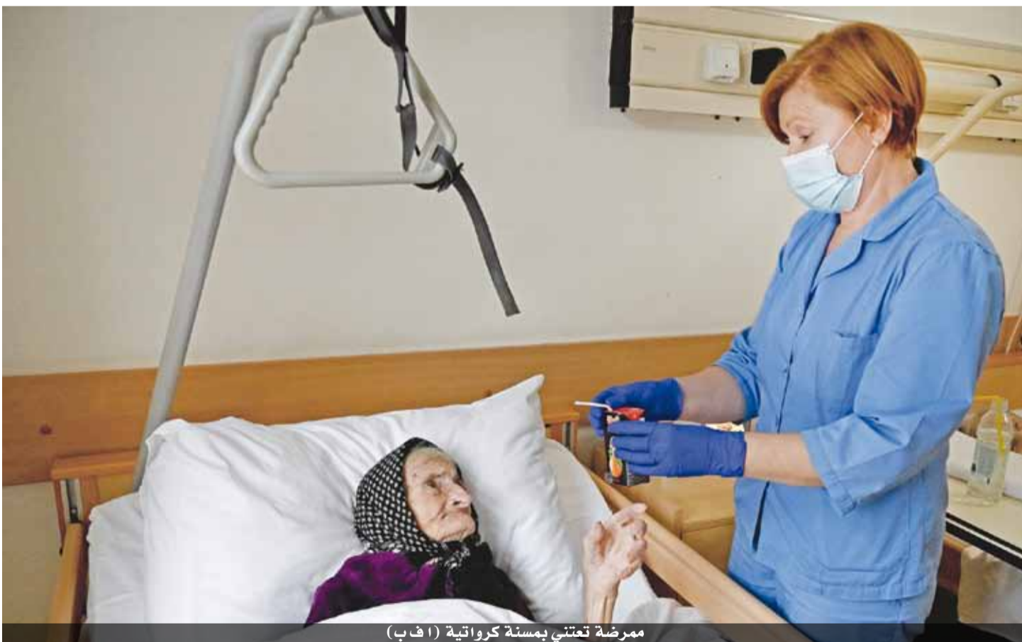
مرمضة تعتمني بمسنة كرواتية

بوتين بدء تلقيح الروس، على نطاق واسع اعتبارا من نهاية الأسبوع المقبل.. وبات اللقاح سبوتنيك-في الذي طوره مركز غاماليا للابحاث في موسكو في المرحلة الثالثة والاخيرة من التجارب السريرية بمشاركة أربعين الف ويؤكد منتجوهُ أنه فعال بنسبة ٩٥ بالمئة مثل لقاح فايزر/بايونتيك.