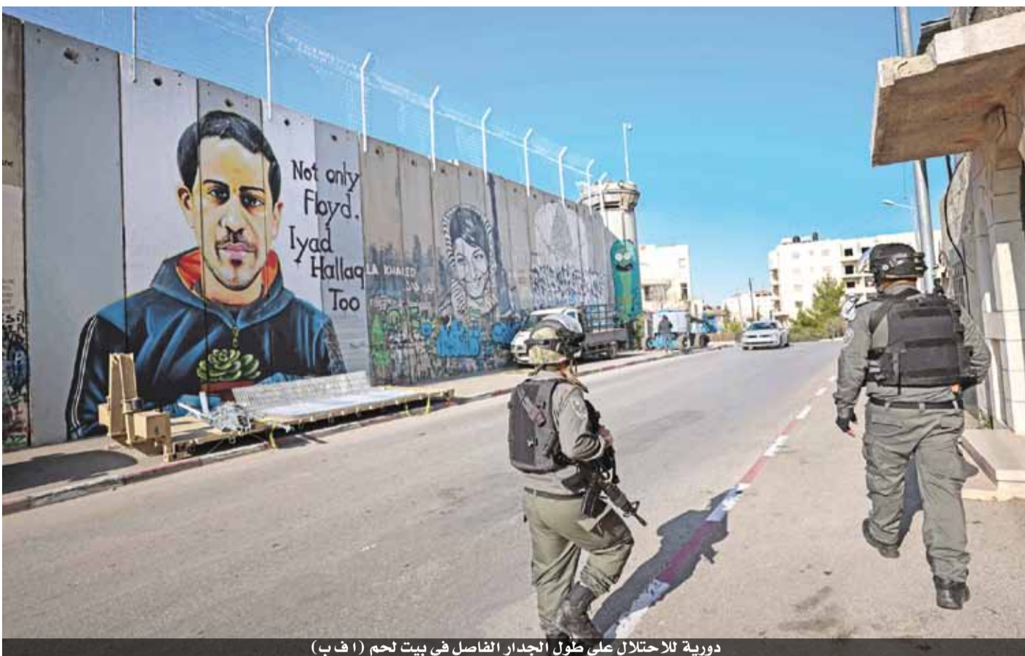
دورية للاحتلال على طول الجدار الفاصل في بيت لحم