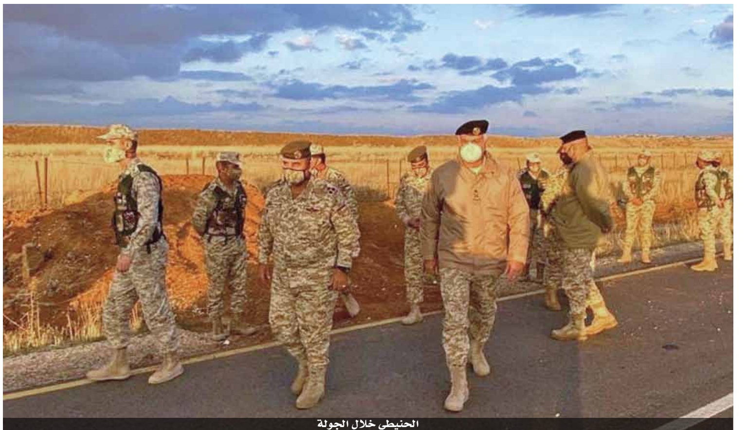
الحنيطي خلال الجولة

العسكرية الشرقية، وكان في استقباله قائد المنطقة. واستمع اللواء الركن الحنيطي إلى إيجاز قدمه قائد الكتيبة، حول سير البرامج والأمور العملياتية والإدارية في الكتيبة، والمهام والواجبات الموكلة إليهم