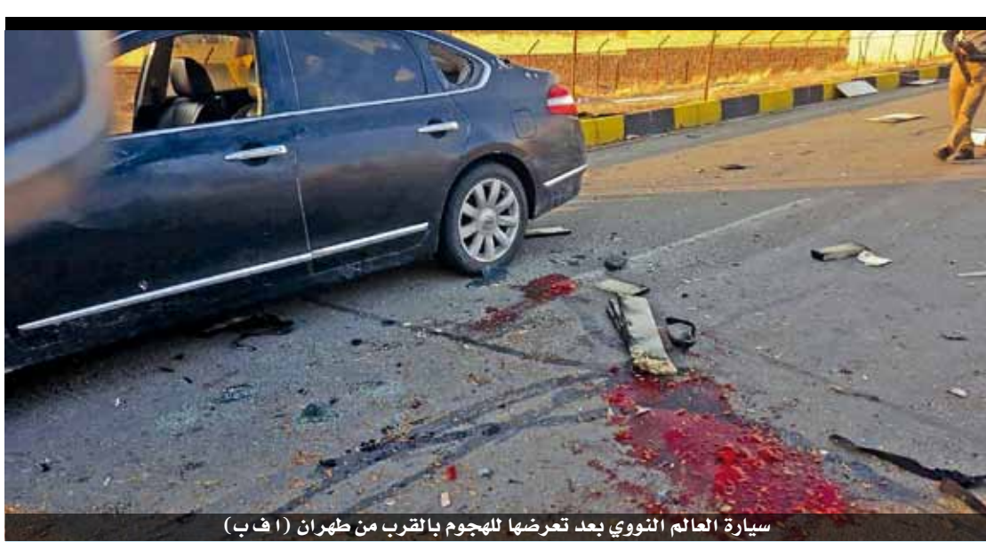
سيارة العالم النووي بعد تعرضها للهجوم بالقرب من طهران

إلى بايدن. ورد ترمب «سيكون من الصعب جدا القبول بذلك، لأننا نعرف جميعا أن عملية تزوير واسعة جرت، في انتخابات الثالث من تشرين الثاني. وفسلت كل الطعون التي قدمها ترمب وردا على سؤال عما إذا كان سيخرج عندما من البيت الأبيض في ٢٠ كانون الثاني يوم أداء الرئيس الجديد اليمين الدستورية، وبعدما قدم الرئيس المنتهية ولايته تهاينة إلى القوات المسلحة بمناسبة عيد الشكر، بادره صحافيون بطرح أسئلة، ولا سيما ما إذا كان سيقتر رسما بهزيمته بعدما يؤكد كبار الناخبين انتقال الرئاسة