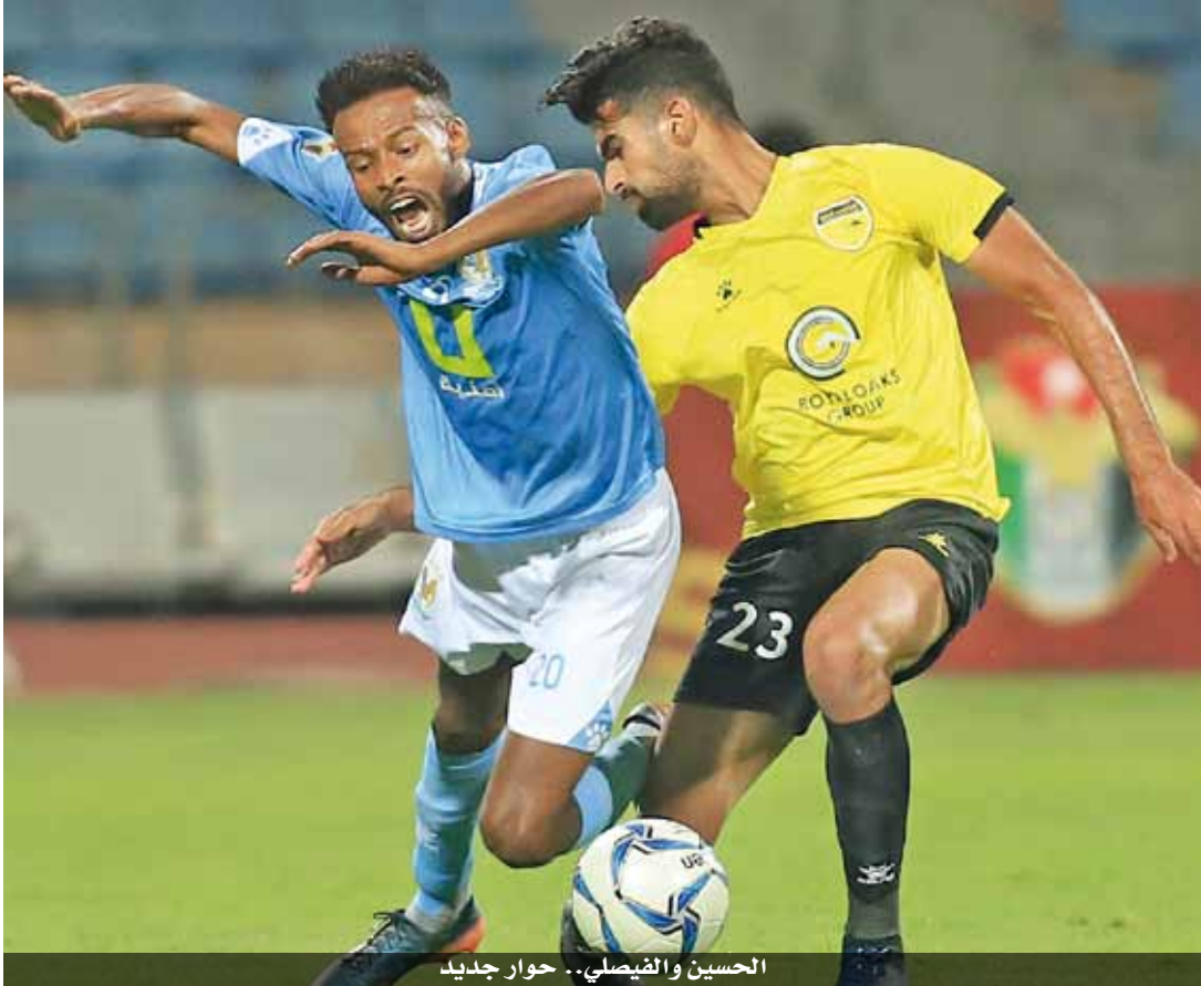
الحسين والفيصلي... حوار جديد

ويسدوره يدرك معان (١٦ نقطة) أن تحصيل ثلاث نقاط جديدة سيحمله يتقدم خطوات كبيرة على سلم الترتيب، ولكنه يعي تماماً أن المهمة لن تكون سهلة قياساً بما يخطط له منافسه وبما يملكه من مؤهلات وحافز. وعند السادسة والنصف مساءً سيكون الحوار مثيراً بين الحسين والفيصلي لاعتبارات عديدة. قبل هذه القمة يملك الحسين ١٩ نقطة بالمركز الرابع، وهو ليس بعيد عن التقدم أكثر، لذا يوجه بوصلته نحو تحقيق الفوز على الفيصلي (١٧) نقطة، والأخير لا يعيش في أفضل حالاته وتعرض لكتيوات متتالية تسببت بتغيير جهازه الفني مجدداً. إلى ذلك التقى أمس الجمعة المرثا مع السلط على ستاد الحسن بباريد، وشباب