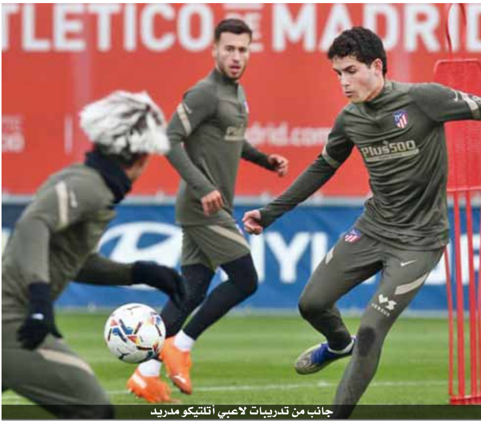
جانب من تدريبات لاعبي أتلتيكو مدريد

إنتر ميلان يستقبل ساسولو.. وبايرن ميونخ يسعى لتخطي شتوتجارت