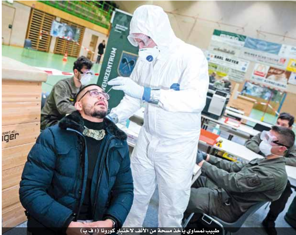
طبيب نمساوي يأخذ مسحة من الأنف لاختبار كورونا