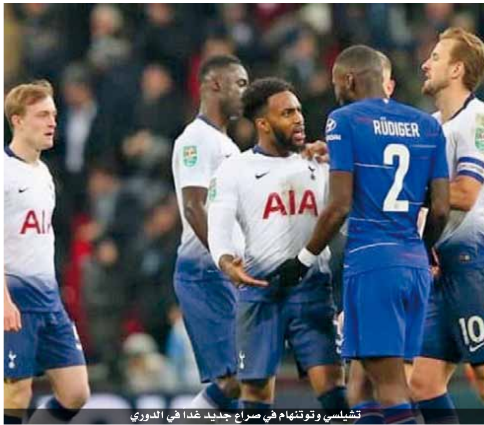
تشيلسي وتوتنهام في صراع جديد غدا في الدوري