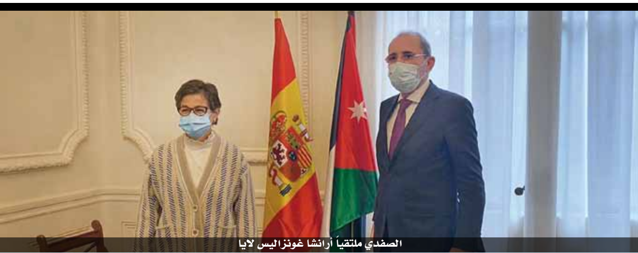
الصفدي يلتقياً أرناسا غونزاليس لايا

وقال الصفدي «لن يتحقق السلام الشامل والعادل القادر على إطلاق طاقات شعبونا في جنوب المتوسط ما لم يحصل الشعب الفلسطيني على