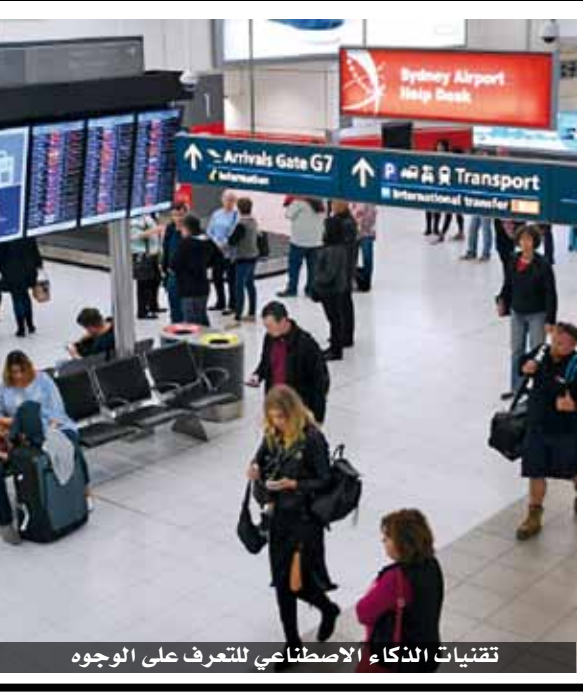
تقنيات الذكاء الاصطناعي للتعرف على الوجوه

وتتنمي هذه الجامايبكية إلى لجنة الأمم المتحدة للقضاء على العنف العنصري المؤلفة من ١٨ خبيرا والتي أصدرت تقريرا عن السبل المتاحة للسلطات للصدى للتمييز العرقي الممارس من قبل قوى الأمن. ولقمت اللجنة خصوصا إلى خطورة الخوارزميات (وهي سلاسل طويلة من التعليمات) المستخدمة في أدوات التنبؤ، أو تلك الخاصة بتقدير المخاطر، المعتمدة في أجهزة الشرطة، كما في محركات البحث ومواقع التواصل الاجتماعي لتوجيه إعلانات موجهة الهدف مثلا. وكانت هذه الأنظمة للمساعدة في الحفاظ على الأمن والتي من المفترض أن تساهم في الحد من الجرائم قد انتشرت بداية في الولايات المتحدة بحدود العقد الثاني من القرن الحادي والعشرين. وهي غالبا