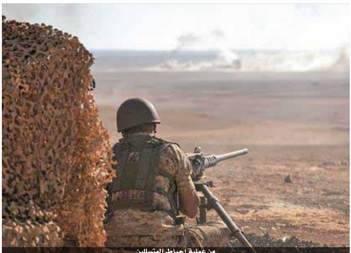
من عملية احباط المتسللين