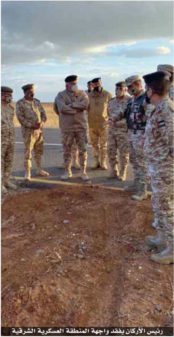
رئيس الأركان يقفد واجهة المنطقة العسكرية الشرقية

تفقد رئيس هيئة الأركان المشتركة اللواء الركن يوسف أحمد الحينيبي، أمس الجمعة، واجهة كتيبة الحسين الآلية (أم الشهداء) إحدى وحدات المنطقة العسكرية الشرقية، وكان في استقباله قائد المنطقة. وأكد اللواء الركن الحينيبي ضرورة بذل أقصى الجهود لحماية الوطن ومقدراته والوقوف صفاً واحداً في وجه كل من تسول له نفسه المساس بأمنه واستقراره. والتقى رئيس هيئة الأركان المشتركة مرتبياً الكتيبة ونقل لهم تحيات جلالة الملك عبدالله الثاني القائد الأعلى للقوات المسلحة، معرباً عن اعتزازه بالمستوى المتميز والكفاءة والاحترافية في تنفيذ الواجبات الموكلة اليهم والمعنويات العالية التي يتمتعون بها. من جانب آخر أحيطت المنطقة العسكرية الشرقية بالتنسيق مع إدارة مكافحة المخدرات، على إحدى وجهاتها، فجر أمس الجمعة، محاولة تسلل وتهريب كمية من المخدرات من الأراضي السورية إلى الأراضي الأردنية.