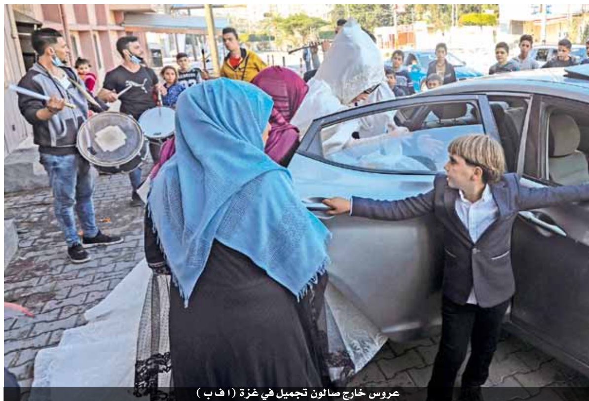
عروس خارج صالون تجميل في غزة