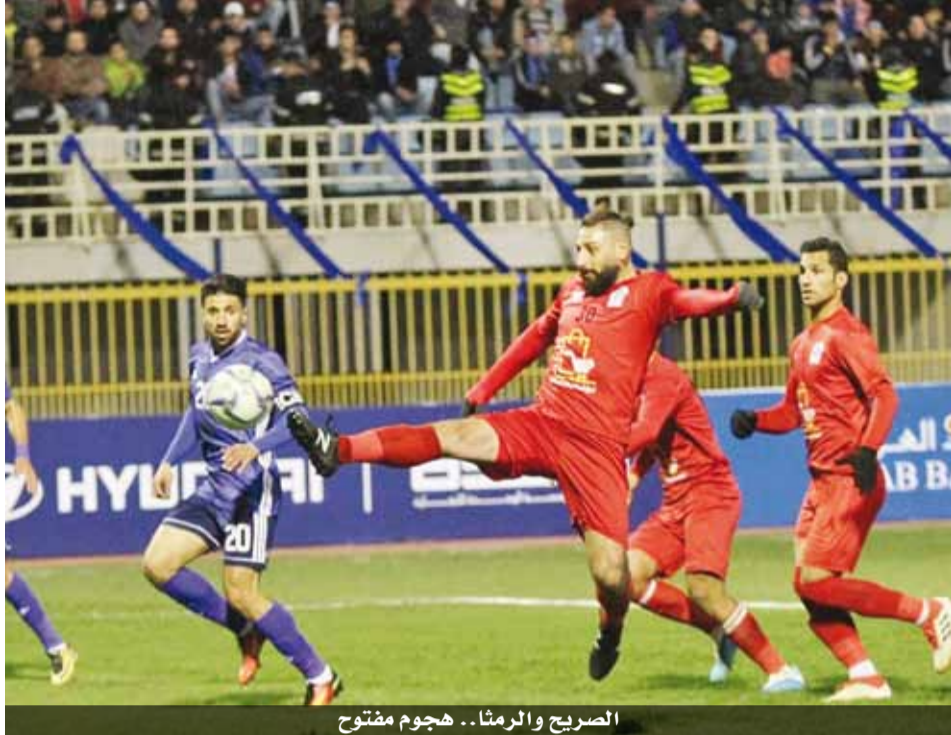
الصريح والرمثا... هجوم مفتوح

يقدم الصريح والرمثا كشف حسابهما بحثاً عن أمل