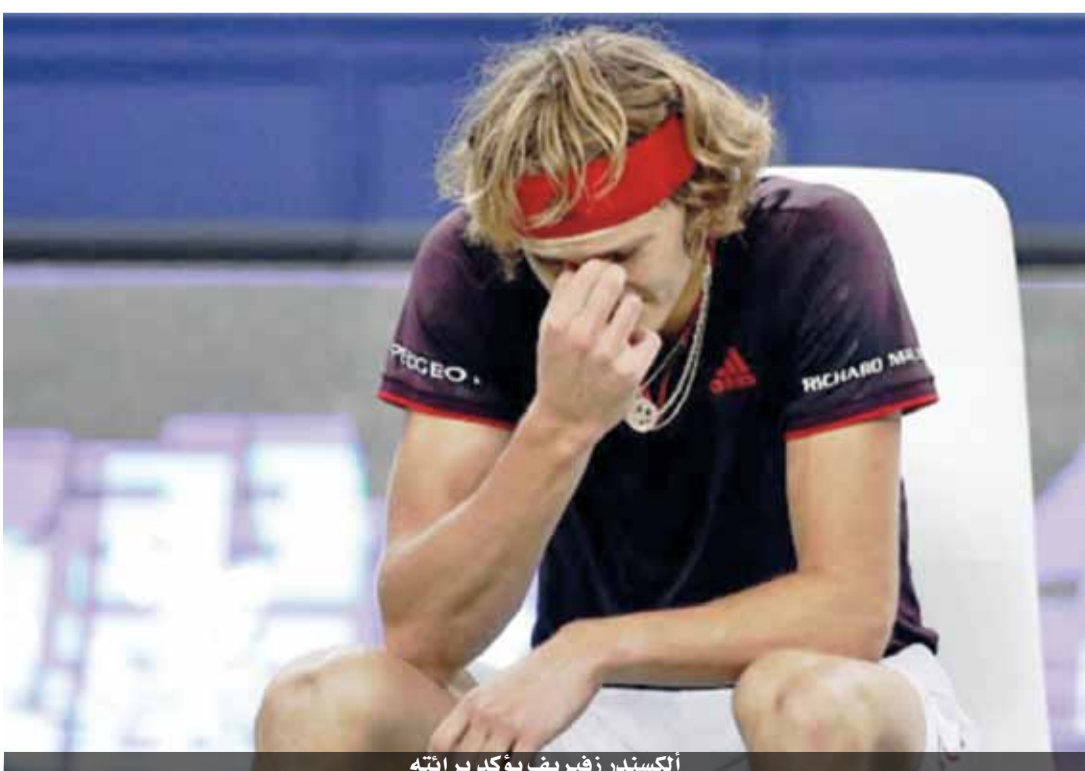
ألكسندر زفيريف يؤكد برأته

تابع «يؤسفني كثيراً أن يصدر منها تعليقات مماثلة، لأن الاتهامات غير صحيحة ببساطة». أردف «أمل في أن نجد كلانا طريقة للتعامل مع الآخر مرة جديدة بطريقة معقولة ومحترمة». تصدر أولجا هذه الاتهامات الان..