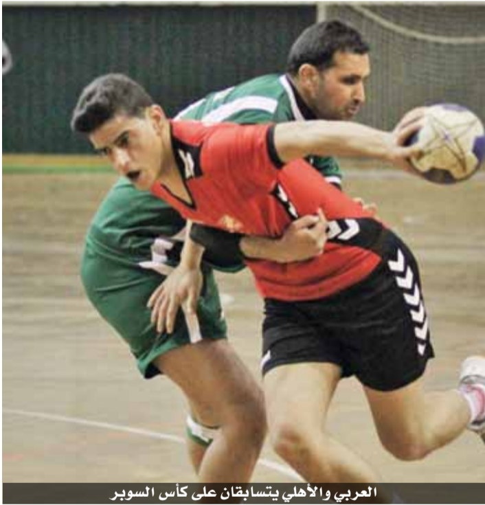
العربي والأهلي يتسابقان على كأس السوبر

على صعيد آخر، تنطلق اليوم مرحلة الإياب لدوري الدرجة الثانية بإقامة ثلاث مباريات لحساب الأسبوع الثامن بقاعة الأميرة سمية تجمع وادي السير وأم جوزهة عند الرابعة وعند الخامسة والنصف ساكب ويرموك البيقة ثم عند الساعة الراهية وعمان. كما يشهد ذات المكان الأسبوع التاسع الثلاثاء المقبل بحوار يرموك البيقة ووادي السير في الخامسة والنصف وعند الساعة الراهية والكتة، ثم السادسة اليوم الذي يليه الأربعاء عمان وساكب.