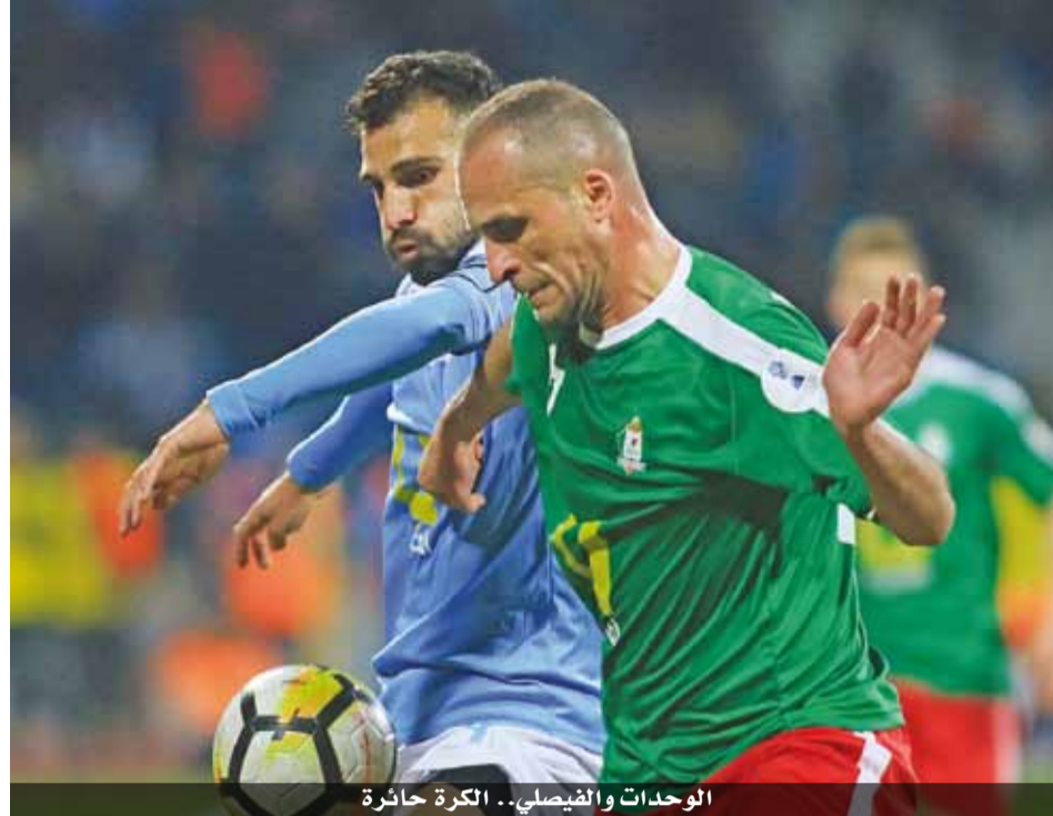
الوحدات والفيصلي... الكرة حائرة