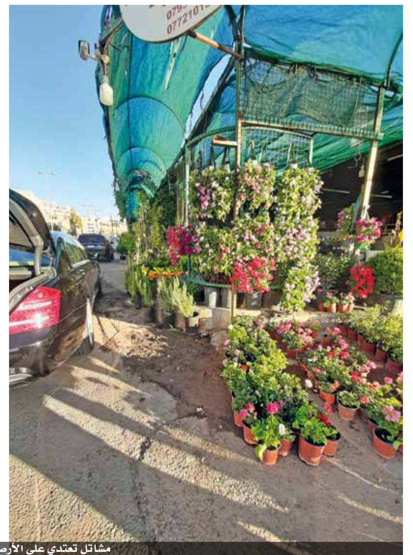
مشاتل تعدي على الأرصفة والطرق في عمان