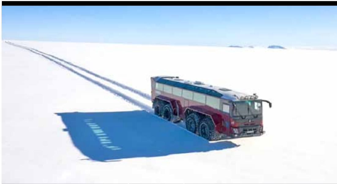
حافلة تسير على نهر جليدي في أيسلندا

بعد شهرين على الكارثة التي ألمت ببيروت، تقدم منصة «شاهد» VIP، للبت التذقي ١٥ عملا قصيرا عن مأس خلفها انفجار المرفأ، في خطوة أثار جدلا منذ انطلاقها. فقد تعرضت هذه المبادرة للانتقاد، إذ اعتبر البعض أن من المبكر جدا عرض صور تنكأ الجراح في بلد لا يزال تحت وقع الصدمة. غير أن هذا المشروع الذي يحمل اسم «بيروت ٢٠١٧»، وهي الساعة التي وقع فيها الانفجار في مرفأ العاصمة في الرابع من آب أبصر النور «لتكريم الضحايا»، على ما يقول المخرج مازن فياض. وهو يؤكد «واجبنا هو أن نبقى ذكراهم حية». وقد شارك في المشروع ١٥ مخرجا أعدوا أفلاما مدة كل منها عشر دقائق تقريبا، تروي، من خلال شخصيات ومواقف متعددة، مآسي خلفها الانفجار الذي أسفر عن أكثر من مئتي قتيل و٦٥٠٠ جريح وقضى على أحياء بكاملها في بيروت. ويخبر فياض وهو شريك في مجموعتي الإنتاج «ذي بيغ بيكشر ستوديوز» و«إيماجيك»، اللتين كانتا وراء هذه الفكرة، لم نذهب للبحث بعيدا، فالقصص كانت أمامنا وكأنا نسمع عنها يوميا». ويروي فيلمه القصير الذي شاركت ناديا طيارة في إخراجه قصة شاب يبيح عن والده وسط الأناض في المرفأ، وهو كان قد تشاجر معه قبل بضع ساعات. وتكشف التكريرات التي يسترجعها عن مكنونات عائلة شيعية متواضعة الحال فيها والد، شارك سابقا في القتال خلال الحرب الأهلية (١٩٧٥-١٩٩٠)، مستاء من تصرفات ابنه. ويظهر فيلم آخر من توقيع كارولين لبيكي عناصر الإطفاء في بيروت يحتفلون بعيد ميلاد، قبل إيفادهم إلى المرفأ حيث اندلع حريق. وتم احتواء الحريق قبل أن تصل التياران إلى مستودع خزنت فيه أطنان من نترات الأمونيوم كان انفجارها ليحدث كارثة، بحسب ما ورد في نشرة الأخبار المتخيلة في الفيلم.