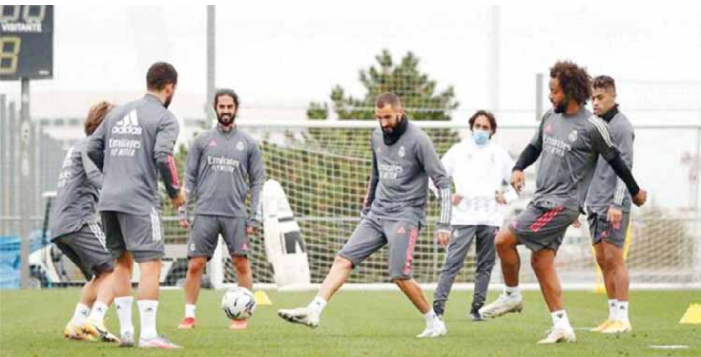
جانب من تدريبات لاعبي ريال مدريد

ويلتقي سامبدوريا بقيادة كلاوديو رانييري، الذي يتساوى في النقاط مع يوفنتوس وأتالانتا، مع جنوى، متطلماً إلى زيادة انتصاراته إلى أربع مباريات.