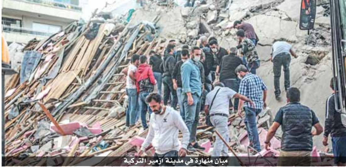
مبانٍ منهارة في مدينة إزمير التركية

تركيا. وفي مشهد آخر، علت صيحات بلدة كارلوفاسي بجزيرة ساموس. وغالبية الأضرار في تركيا سجلت في مدينة إزمير ومحيطها والبالغ عدد سكانها قرابة ٣ ملايين نسمة. وفي لشبكة سي إن إن تورك، أن ٢٠ مبنى انهار، وقال المسؤولون إنهم يركزون جهود الإنقاذ على ١٧ منها. وأفادت وكالة إدارة الكوارث التركية عن مقتل ١٢ شخصا وقالت إن أكثر من ٤٠٠ شخص أصيبوا بجروح، فيما لقي في اليونان مراهقان حتفهما عندما كانا عاندين من المدرسة إلى المنزل في ساموس حين انهار جدار.