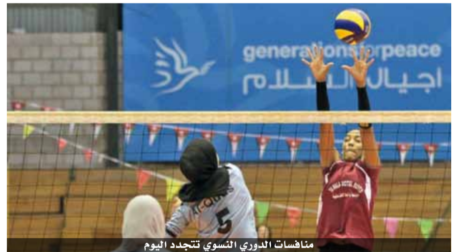
منافسات الدوري النسوي تتجدد اليوم