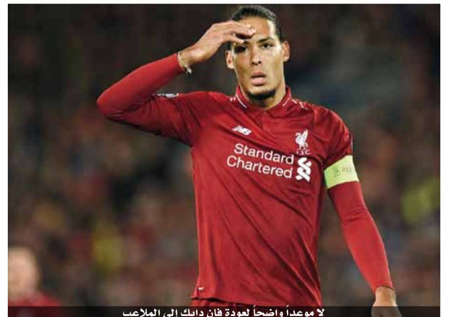
لا موعداً واضحاً لعودة فان دايك إلى الملاعب