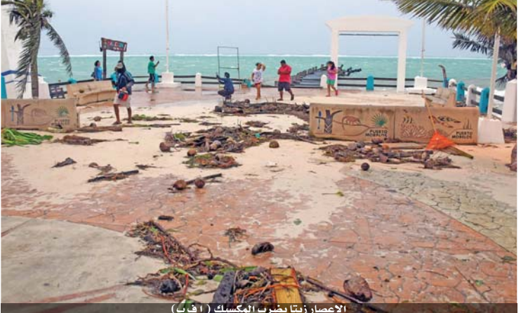
الإعصار زيتا يضرب المكسيك

تعرضت قوة الإعصار زيتا في منطقة البحر الكاريبي من عاصفة استوائية إلى إعصار من الفئة الأولى، الأضعف على مقياس من خمس درجات، لكنه فقد قوته عندما تحرك فوق اليابسة واتجه نحو خليج المكسيك. وذكر المركز الوطني الأميركي للأعاصير ومقره في ميامي بولاية فلوريدا كانت العاصفة بالقرب من الساحل الشمالي شبه جزيرة يوكاتان، وترافقه رياح تبلغ سرعتها القصوى ١١٠ كلم في الساعة. قال الحاكم كارلوس خواكين إن ولاية كوينتانا رو في جنوب شرق المكسيك، موطن المنتجعات الشاطئية في تولوم وكاكتون، نجت على الأرجح من أضرار جسيمة أو خسائر بشرية. وتابع أن المطارات لا تزال تعمل، فيما لم تتأثر المستشفيات بمرور الإعصار. وأضاف خواكين "يجري العمل على استعادة الخدمات العامة المنقطعة في بعض المدن والأحياء". طلبت السلطات من السكان والسياح البقاء في الداخل وفتحت ملاجئ للأشخاص الذين شعروا بعدم الأمان في بيوتهم. كاثكون - أ ف ب تسبب الإعصار زيتا في هبوب رياح قوية وأمطار غزيرة في الساحل الكاريبي للمكسيك قبل أن يتراجع ليصبح عاصفة استوائية ويتجه صوب الولايات المتحدة. ولم ترد تقارير عن سقوط قتلى أو أضرار جسيمة بعد وصول زيتا إلى اليابسة بالقرب من منتج تولوم في وقت متأخر من مساء الاثنين، وهو ثاني إعصار يضرب شبه جزيرة يوكاتان هذا الشهر.