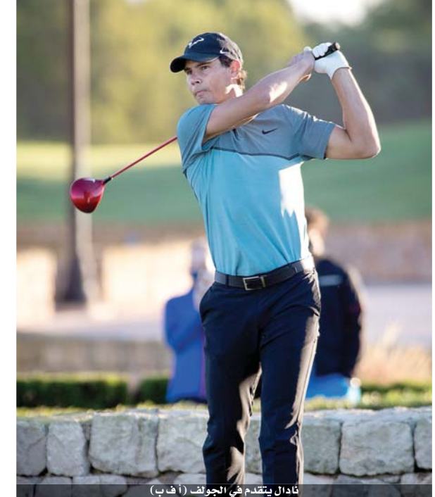
نادال يتقدم في الجولف

أكد لاعب التنس الإسباني رافاييل نادال المصنف ثانياً عالمياً علو كعبه في رياضة الجولف أيضاً بحلوله سادساً في دورة مايوركا أمس الأول. فبعد أسبوعين من تعزيز رقمه القياسي في عدد الالقاء في بطولة فرنسا المفتوحة على ملاعب رولان غاروس عندما ظفر بها للمرة الثالثة عشرة رافعاً رصيده إلى ٢٠ لقباً في الجرائد سلام ومعادلاً السويسري روجيه فيدرر، شارك نادال، على مدى ثلاثة أيام، في المركز السادس الشهر الماضي.