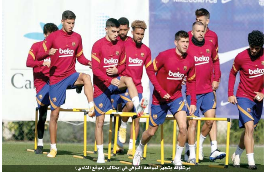
برشلونة يتجهز لموقعة اليوفي في إيطاليا (موقع النادي)

الموسم، فإن نظيره كومان سيخوض الثانية بعد خسارته الكلاسيكو، وهو مطالب بإعادة ترتيب الأوراق لوضع النادي الكاتالوني على السكة الصحيحة في سعيه إلى الظفر بلقب المسابقة للمرة الأولى منذ ٢٠١٥. ويبدو يملك برشلونة الاسلحة اللازمة لحسم مقته مع يوفنتوس خصوصاً هجومه الناري بقيادة ميسي والواعد أسنو فاتي والبرازيلي فيليب كوتينيو والذي سيشكل ضغطاً كبيراً على دفاع يوفنتوس حيث يحوم الشك حول مشاركة قطب دفاعه وقائده ليوناردو بونوتشي لصابته في المباراة ضد فيرونا، فيما يغيب قطب دفاع النادي الكاتالوني جيرار بيكيه لطرده في المباراة ضد فرنتسفاورس المجري ١-٥.