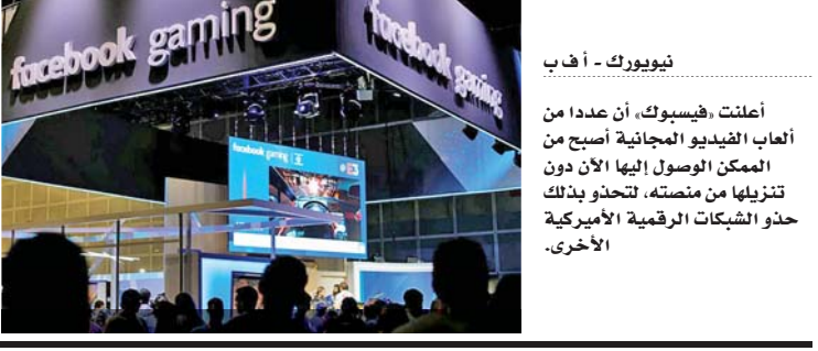
نيويورك - أ ف ب

على عكس «غوغل»، و«امازون»، لا تقدم «فيسبوك» خدمة منفصلة متكاملة لكنها توفر لمستخدميها إمكان الوصول إلى ألعاب معينة بفضل الحوسبة السحابية من خلال تطبيق الشبكة على الهاتف المحمول أو متصفح الإنترنت الخاص بهم. وأوضح روبن جايسن نائب رئيس قسم الألعاب في «فيسبوك»، في منشور على مدونته، ليست هناك حاجة إلى أجهزة ولا وحدة تحكم، أيديكم هي وحدات التحكم، لأننا بدأنا بألعاب تم تطويرها خصيصاً للهواتف الذكية، وستتوافر خمس ألعاب عند الإطلاق التجريبي لـ«فيسبوك غيمينغ» في الولايات المتحدة هي «أسفال ٩»؛ «ليدجنز»؛ و«بي جي إيه تور غولف شوتاون»؛ و«موبايل ليدجنز»؛ و«دفنشر»؛ و«سوليتير»؛ و«أرثرز تايل»؛ و«دبليو دبليو إي سوبر كارد». هذه الألعاب مجانية لكنها تحتوي على خيارات شراء داخل التطبيق بالإضافة إلى إعلانات. ويمكن الوصول إليها على الإنترنت والأجهزة المزودة بنظام «أندرويد»، من «غوغل»، لكنها غير متوافرة حالياً على نظام «آي أو إس» التابع لشركة «آبل».