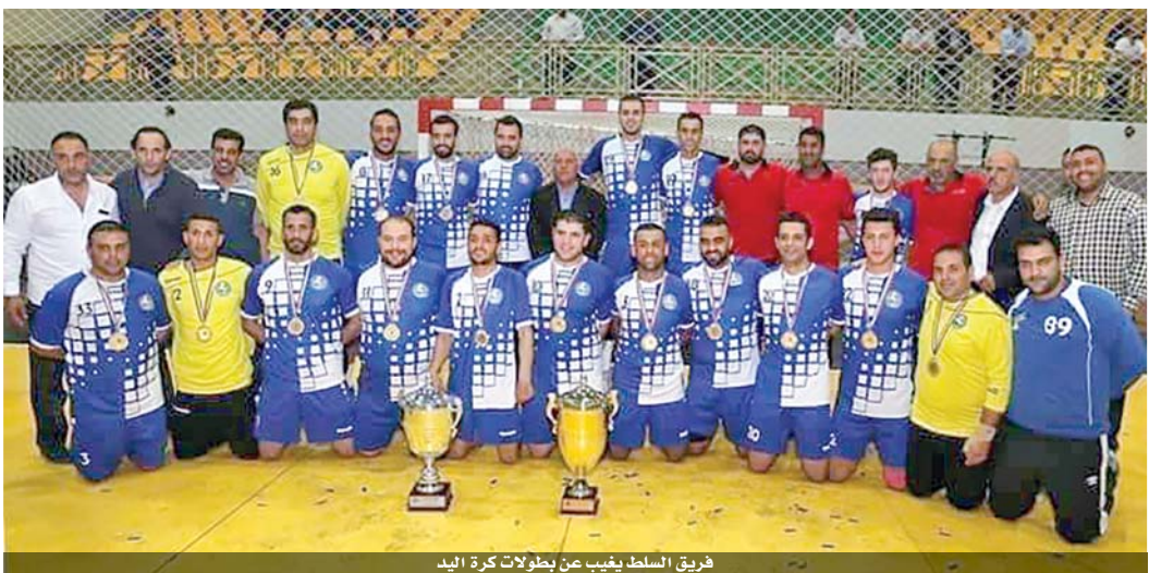
فريق السلط يقب عن بطولات كرة اليد

وإحدى مباريات امس من البطولة بسبب إصابة لاعب من شباب الحسين بفيروس كورونا وكان مقرراً أن يلقي فريقه الوحدات، واصاب التأجيل أيضاً البقعة مع ملج، والعودة مع عبرا.