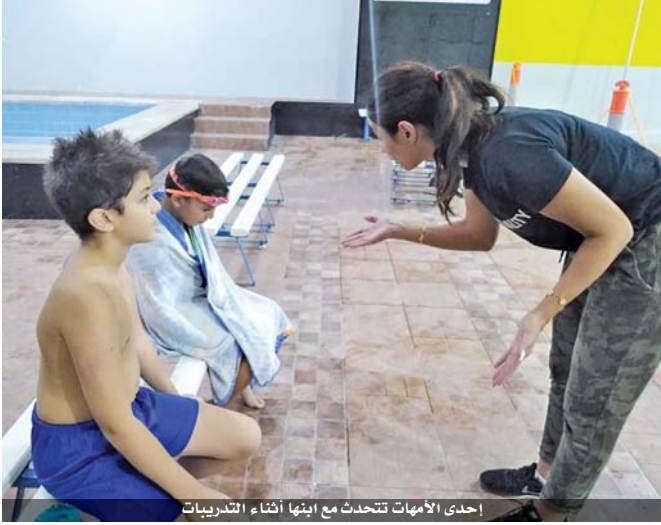
إحدى الأمهات تتحدث مع ابنها أثناء التدريبات