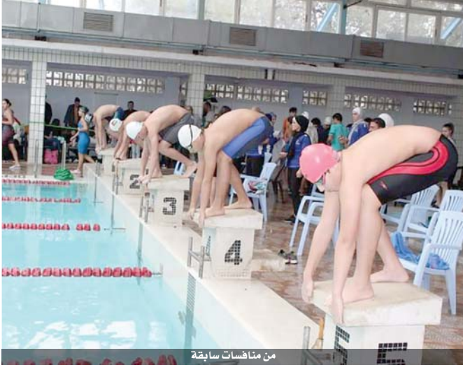
من منافسات سابقة

وأكد: جميع المدربين لا يرغبون بحضور الأهل ويرفضونه لأنه يؤدي إلى تدخل الآباء وإضافة لكون التدريبات تحمل صفة الخصوصية، وأن لكل مدرب رؤية معينة يريد إيصالها للاعب والتي قد تتأثر بتواجد ذوي اللاعبين خاصة عند تحديثهم مع المدرب مما يسبب عدم تركيزه من ناحية وإلحاق الضرر بباقي اللاعبين من ناحية أخرى.