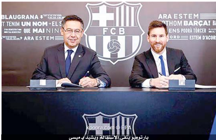
بارتوميو يتلقى الاستقالة ويشهد ميسي

نبدأ مشروعاً جديداً مع كومان، مع لاعبين جدد، وليو ميسي هو مفتاح هذا المشروع الجديد، وأضاف «أفهم أنه كان غاضباً، لكننا بحاجة إلى ميسي، نحن بحاجة إليه في برشلونة». وأردف قائلاً «أتمنى في الأشهر المقبلة، أن يقول ميسي إنه سعيد ببقائه في برشلونة، وأنه سيجد عقده (الذي ينتهي في حزيران ٢٠٢١) وأنه سينيهي مسيرته في النادي». وتابع «لقد قلنا دائماً، وقالها ليو ميسي بنفسه عدة مرات، أن رغبته كانت الاعتزال هنا. أعتقد أنه الخيار الأفضل، القرار الأفضل وأعتقد أن ذلك سيكون مثالياً للجميع بما في ذلك ليو ميسي». وأوضح بارتوميو أنه مع هذا الفريق الحالي، مع المدرب، واللاعبين الجدد، هناك مشروع جيد جداً يتم بناؤه، ليس فقط للمستقبل، ولكن أيضاً للحاضر، مؤكداً أن «الأمم والرغبة موجودان وعندما ينتهي الموسم تكون قد فزنا بأكثر من لقب». وبشأن رحيل ميسي المهجض في نهاية أب الماضي، أشار بارتوميو إلى أن «الموعد النهائي لإنهاء العقد من جانب واحد كان ١٠ حزيران. لقد انقضى هذا التاريخ واليوم لا يزال ميسي لاعباً في النادي».