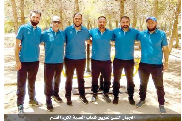
الجهاز الفني لفريق شباب العقبة لكرة القدم