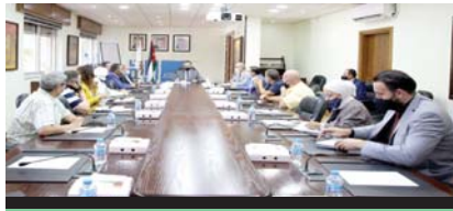
وزير السياحة يلتقي ممثلي القطاع في محافظة العقبة