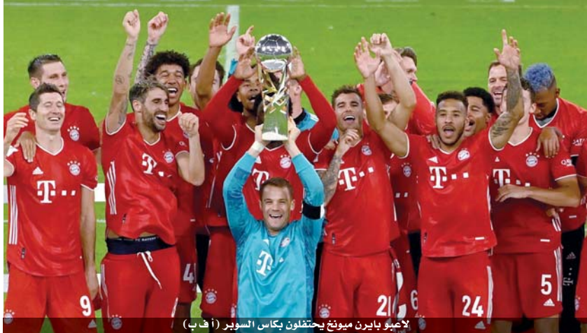
لاعبو بايرن ميونخ يحتفلون بكأس السوبر