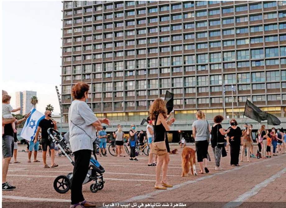
مظاهرة ضد تلتايهاو في تل أبيب