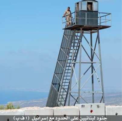
جنود لبنانيون على الحدود مع إسرائيل