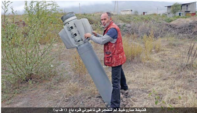
قذيفة صاروخية لم تنفجر في ناغورني قره باغ

من ١٣٠ شخصاً. وفي دعوة مشتركة، حضر الرئيس الروسي فلاديمير بوتين والأميركي دونالد ترامب وماكرون الطرفين على العودة إلى المفاوضات الهادفة إلى تسوية هذا النزاع القديم.