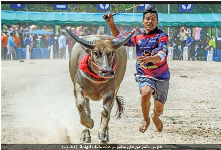
فارس يقفز من على جاموس عند خط النهاية

وقالت الخارجية الأميركية في بيان «من خلال التركيز على إنهاء الصراعات التي تؤدي إلى النزوح في العالم الأول، ومن خلال تقديم المساعدة الإنسانية في الخارج لحماية ومساعدة النازحين، يمكننا منع الآثار المزمنة للاستقرار على البلدان المضطربة وجيرانها». وناشد المفاوضون عن اللاجئين إدارة ترمب لزيادة أعداد اللاجئين المقبولين لمواجهة الصراعات العالمية وعدم الاستقرار الجديد بسبب الوباء.