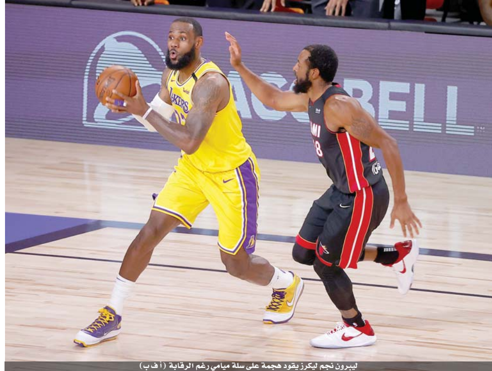
ليبرون نجم ليكرز يقود هجمة على سلة ميامي رغم الرقابة

أورلاندو - أ ف ب كشر لوس أنجلوس ليكرز بطل المنطقة الغربية عن أنيابه مبكراً بفوزه الكبير على ميامي هيت بطل المنطقة الشرقية ١١٦-٩٨ في المباراة الأولى للمحترفين في أورلاندو. وتقدم ليكرز بفوز في السلسلة النهائية التي يحسمها الفريق الذي يسبق منافسه إلى حسم أربع مواجهات من أصل سبع ممكنة، وتقام المباراة الثانية اليوم الجمعة. ويدين ليكرز الساعي إلى اللقب السابع عشر في تاريخه ومعادلة الرقم القياسي في عدد الانتصارات المسجل باسم بوسطن سلتيكس الذي خرج على يد ميامي هيت في الدور نصف النهائي (نهائي المنطقة الشرقية)، إلى نجميه أنطوني ديفيس وليبرون جيمس.