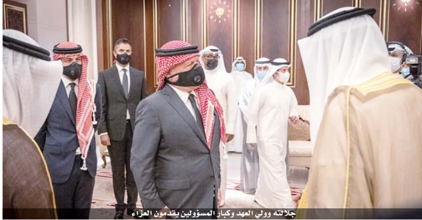
جلالته وولي العهد وكبار المسؤولين يقدمون العزاء