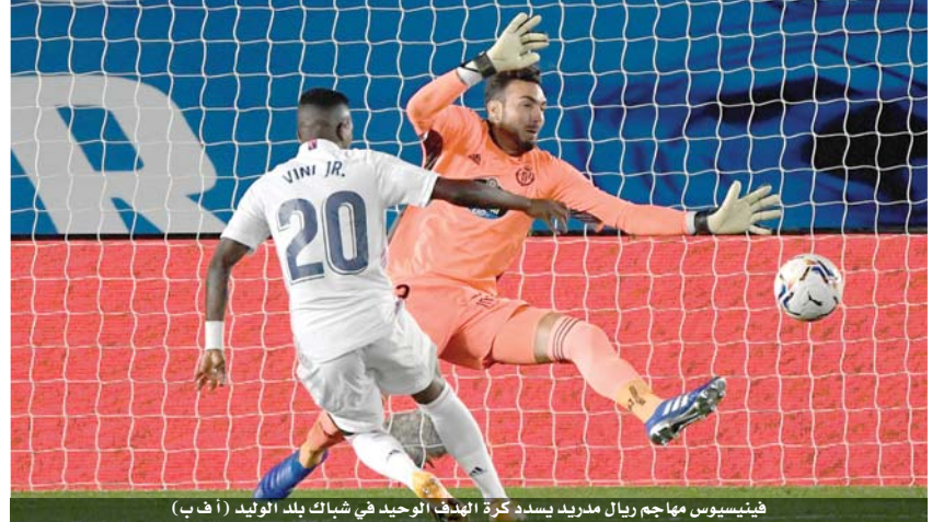
فينيسيوس مهاجم ريال مدريد يسدد كرة الهدف الوحيد في شباك بلد الوليد

الموسم والثاني على التوالي بعد خسارته أمام ضيفه قاشن الصاعد بدوري حديثا إلى دوري النخبة ١-٠ في المرحلة الثانية، فرجع رصيده إلى ثلاث نقاط في المركز السادس عشر. أما أتلتيكو مدريد فسقط في تعادل للمرة الأولى هذا الموسم في ثاني مباراة له فقط بعد فوزه الكاس على ضيفه غرناطة ١-٠ الأحد بينها ثنائية وتمرية حاسمة في ٢٤ دقيقة لتتجه الجديد الدولي الأوروغوياني لويس سواريس الذي لعب أساسيا اليوم على حساب دييغو كوستا دون أن ينجح في هز الشباك. وفي مباراة ثانية، استعاد فياريال توازنه بعد خسارته المذلة أمام مضيعة برشلونة الـ ٤-٠ الأحد في المرحلة الثالثة، بفوزه ضيفه الألفيس ١-٣. وفرض المهاجم الدولي باكو أكاسير نفسه نجما للمباراة وصيف بطل الموسم الماضي، بتسجيله ثنائية (١٣ ٢٧).