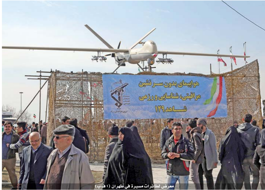
معرض لطائرات مسيرة في طهران