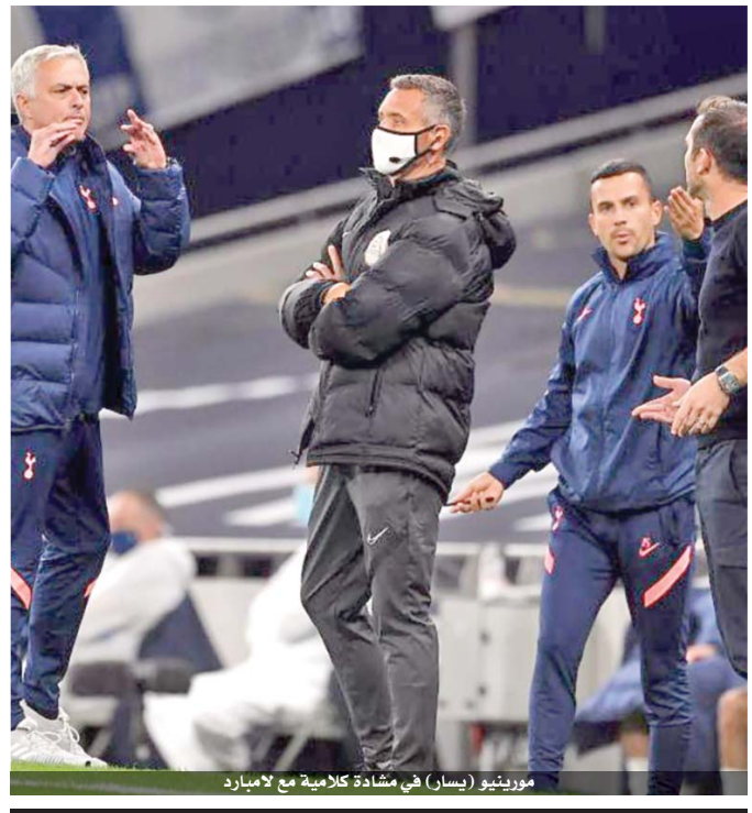
مورينيو (يسار) في مشادة كلامية مع لامبارد