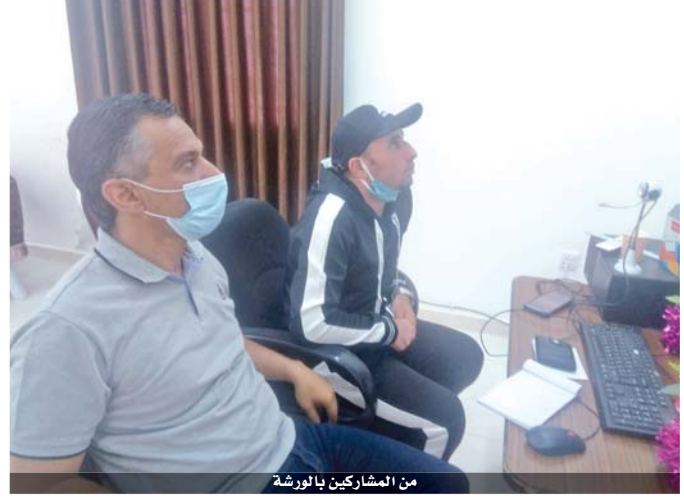
من المشاركين بالورشة

وجرى سحب القرعة للمرة الأولى عن بُعد نظراً لتطبيق البروتوكول الصحي في ظل جائحة كورونا التي عطلت الكثير من النشاطات الرياضية، وتحت إشراف أمين سر الاتحاد د. زين العابدين بني هاني وحضور مندوبي الفرق التي تم توزيعها على مجموعتين، ضمت الأولى: كفرسوم، العربي، يرموك البقعة، كفرنجة، الحسين، الرابطة، الكتة، وفي الثانية: السلط، عمان، القوقازي، ساكب، يرموك الشونة، الأهلي، أم جيزة، وادي السير. ويلتقي السلط وعمان ٢٦ الجاري عند الخامسة