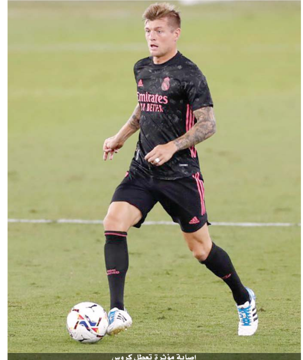
إصابة مؤثرة تعطل كروس

أصدر نادي ريال مدريد حامل لقب بطل الدوري الإسباني لكرة القدم، أمس، بيانا كشف فيه النقاد عن طبيعة إصابة لاعبه الألماني توني كروس والمدة التي سيغيبها عن الملاعب. وقال ريال مدريد في البيان المنشور على موقعه الرسمي: بعد إجراءات الفحوصات الطبية على توني كروس لتشخيص