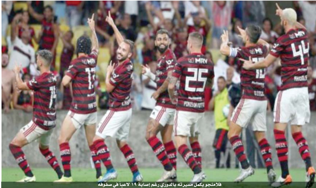
فلاننجو يكمل مسيرته بالدوري رغم إصابة ١٩ لاعبا في صفوفه