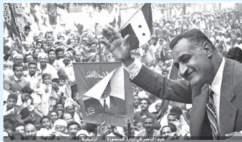
عبد الناصر في زيارة للمنصورة ارضينية