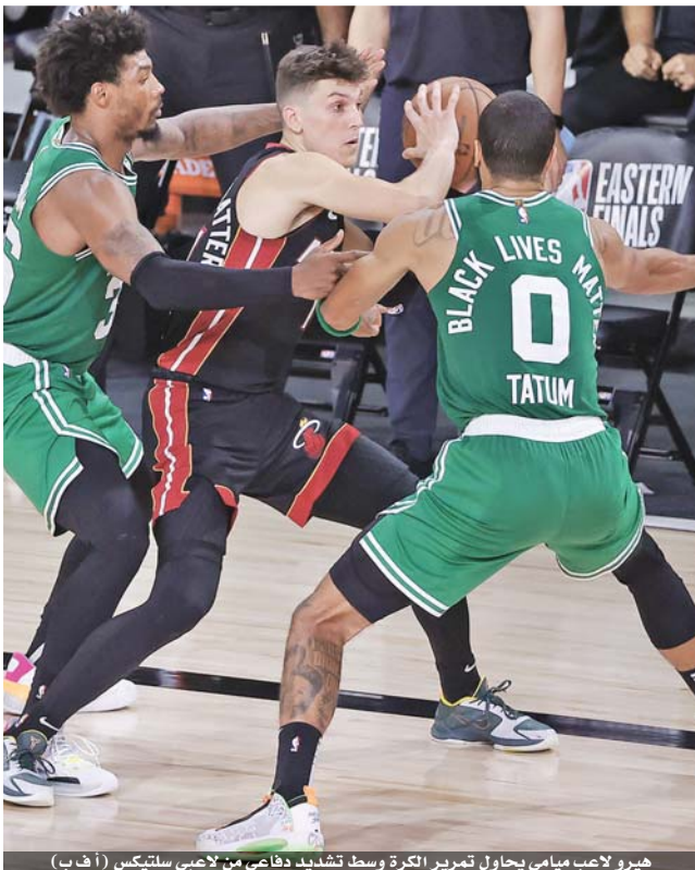
هيرو لاعب ميامي يحاول تمرير الكرة وسط تشديد دفاعي من لاعبي سلتيكس

وحاول براون انعاش امال سلتيكس في العودة عندما سجل ثلاثية قبل ١٦ ثانية، لكن رميات حرة لباتر وهيرو بخرتها.