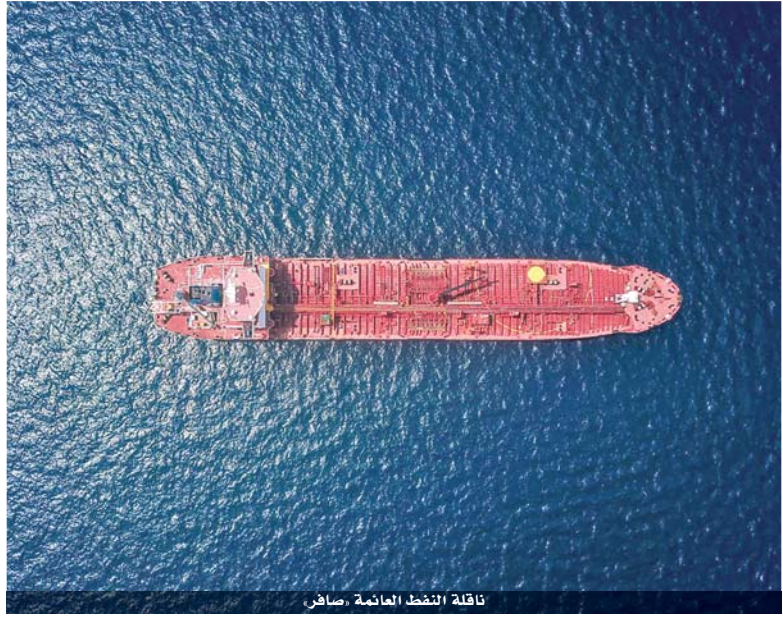
ناقلة النفط العملاقة صافر

الرياض - أ ف ب حذرت السعودية في رسالة وجهتها إلى مجلس الأمن ونشرت أمس من «بقعة نفطية» شوهدت غرب ناقلة نفط مهجورة منذ سنوات قبالة الساحل اليمني. وقال المعلمي في رسالته أن «خبراء لاحظوا أن أنبوباً متصلاً بالناقلة ربما انفصل عن الدعامة التي تثبتها في القاع ويطفو الآن فوق سطح البحر». وأكد المعلمي أن الناقلة «وصلت إلى حالة حرجية، وأن الوضع يشكل تهديداً خطيراً لكل الدول المطلة على البحر الأحمر خاصة اليمن والمملكة». وبحسب المندوب السعودي فإن «الوضع الخطير يجب ألا يتكرر دون معالجته». وكان مجلس الأمن عقد في تموز الماضي جلسة غير اعتيادية أعرب خلالها عن قلقه من وضع الناقلة المتهاكلة. ودعا المجلس المتمردين الحوثيين إلى السماح بالوصول إلى الناقلة. وفي حزيران طلب الحوثيون ضمانات بأن يتم إصلاح الناقلة وأن تحوّل عائدات النفط الموجود على متنها لتشديد رواتب موظفين يعملون في إدارات تخضع لسلطتهم. بالمقابل دعت الحكومة اليمنية المعترف بها دولياً إلى إنفاق أي مبلغ يتأتى من بيع هذا النفط على مشاريع صحية وإنسانية.