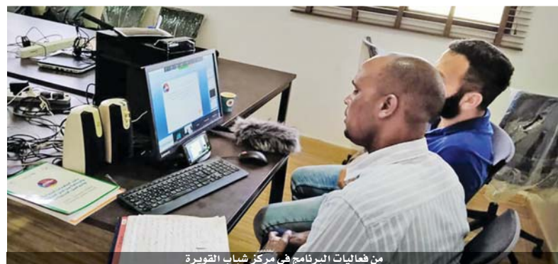
من فعاليات البرنامج في مركز شباب القوية

بدأت في مراكز شباب العقبة والريشة ورحمة والقوية بمحافظه العقبة أعمال برنامج المهارات والمشاركة المدنية «مهاري»، للفترة العمرية (١٦-١٨ عاماً). ويهدف البرنامج الذي تنظمه وزارة الشباب والتشباب مع منظمة اليونيسف وهيئة أجيال السلام إلى بناء ورفع قدرات الشباب، عن طريق رفدهم بعدد من البرامج التدريبية وتزويدهم بالمهارات والمعارف الحياتية المتنوعة، إلى جانب توفير فرص للشباب واليافعين للمشاركة في أنشطة تفاعلية ممنهجة تعمل على اكسابهم المهارات الحياتية والمهارات المعالية والرقمية بالإضافة لمهارات الابتكار والرياضة من أجل السلام. كما يهدف البرنامج إلى دعم الشباب من