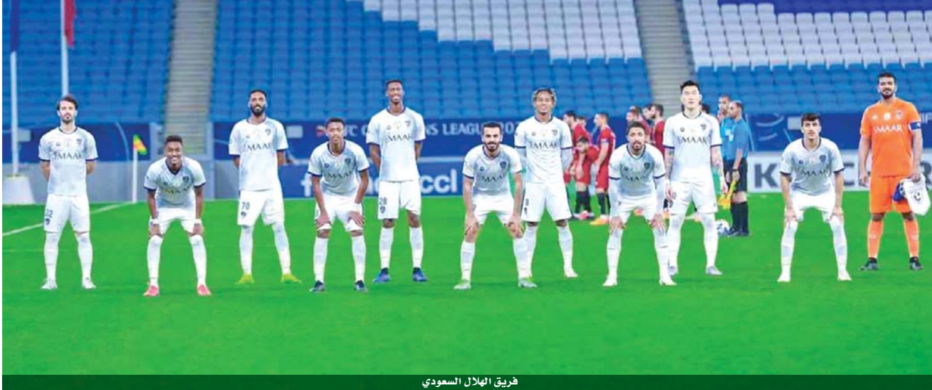
فريق الهلال السعودي