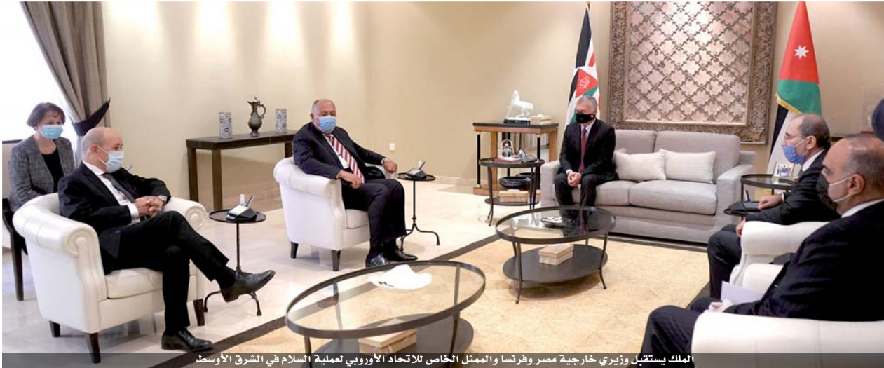
الملك يستقبل وزير خارجية مصر وفرنسا والممثل الخاص للاتحاد الأوروبي لعملية السلام في الشرق الأوسط

وحضر اللقاء وزير الخارجية وشؤون المغتربين، ومستشار جلالته الملك للسيسات.