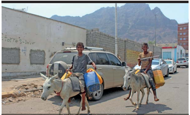
سطلان على ظهر حمارين في عدن

وعادت سفينة المسح التركية التي شكلت محور التوتر إلى الساحل الاسبوع الماضى للصيانة والتلنؤن. وأشار أردوغان إلى أن السفينة ستعاود عملها، مؤكداً في المقابل أن بلاده تعمدت سحب السفينة.