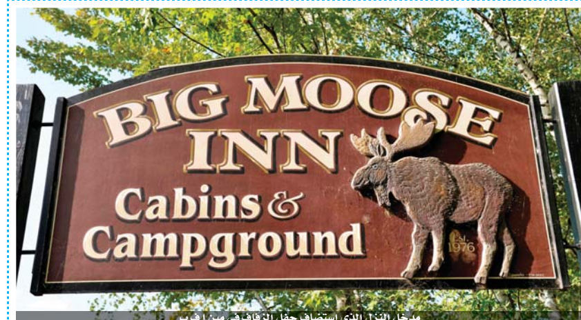
مخيل المنزل الذي استضاف حفل الزفاف في مين أ ف ب

تحول حفل زفاف أقيم الشهر الماضي في ولاية مين الأمريكية الصغيرة قرب كنذا إلى بؤرة كبيرة لتفشي كوفيد-١٩ إذ تسبب بسبع وفيات وما لا يقل عن ١٧٧ إصابة، في تذكير بمخاطر الفيروس في منطقة كانت تظن أنها تخلت أسوأ مراحل الجائحة. وأقيم الزفاف في ٧ آب الفائت بمشاركة ٦٥ شخصاً (وهذا في ذاته مخالف للحد الأقصى المسموح به رسمياً وهو ٥٠ شخصاً).