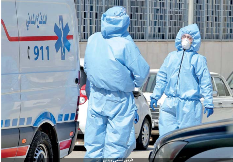
فريق تقصي وبائي

وفي واقعة في الاولى من نوعها على مستوى المملكة سجلت امس إصابة (كلب) بالفيروس في الرمثا، كاول حالة مسجلة لحيوان، مما ادت الى البحث عن صيغ للتعاطي مع احتمالية إصابة الحيوانات