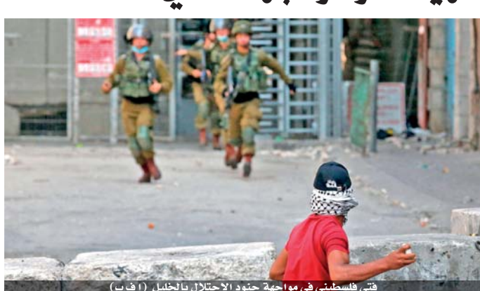
قتى فلسطيني في مواجهة جنود الاحتلال بالخليل

الأراضي الفلسطينية - كامل إبراهيم وقمع الاحتلال فعاليات عديدة في الضفة الغربية أمس إذ اعتدى الاحتلال على الفلسطينيين في باب الزاوية، وسط مدينة الخليل. الى ذلك فرض جيش الاحتلال الإسرائيلي مساء أمس، الطوق الأمني على الضفة الغربية وأغلق مدينة القدس الشرقية المحتلة وأغلق معابر قطاع غزة بحجة الأعياد وأطلقت قوات الاحتلال قنابل الصوت صوب الفلسطينيين بالقرب من حاجز برطعة جنوب غرب جنين، وفق ما أفادت به وزارة الصحة.