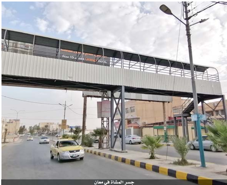
جسر المشاة في معان

توفير أجواء آمنة للطلبة وأولياء الأمور ما يتطلب إكمال تجهيزه لئتم استخدامه بالشكل الأمثل وأشار أن هناك حاجة ماسة لوضع حواجز كما باقي الجسور في المملكة في الجزيرة الوسطى لمنع الطلبة من قطع الشارع والالتزام باستخدام الجسر كونه أكثر أمنا وقدم البزايعة لوزارة الأشغال وكل الجهات التي ساهمت بوجود