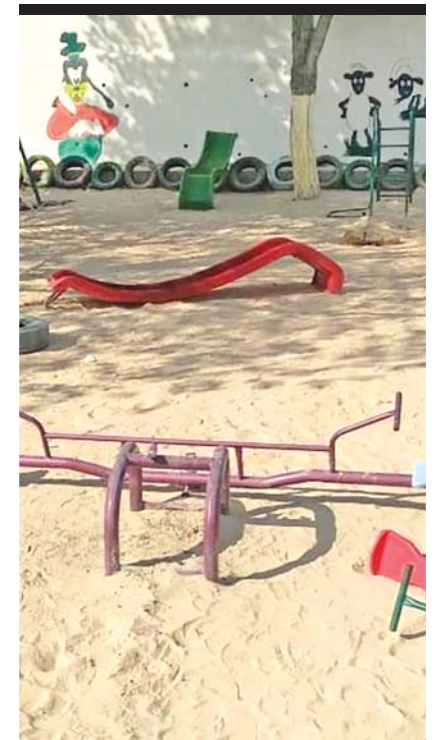
الشار تخريب في الحديقة

اما بالنسبة للجزر اوضح انه في مرحلة انتقالية تقل فيها الكميات بشكل طفيف قبل بداية الانتاج في بعض المواقع المتوقعة خلال ٢٠ يوماً وتدرس الوزارة ادخال كميات مستوردة تكميلية نتيجة ارتفاع أسعار الجزر وذلك استناداً إلى السياسة العامة للوزارة بالتدخل عند انخفاض المعروض من اي صنف من الكميات المطلوبة أو بسبب ارتفاع الاسعار بحد أعلى من المقبول علماً أن محصول الجزر قد حقق نسبة اكتفاء تجاوزت ٩٣٪ هذا العام وهو ضمن خطة الوزارة برفع نسب الاكتفاء من كافة المحاصيل العجز اي التي لا تكفي كميات انتاجها الاحتياجات الفعلية.