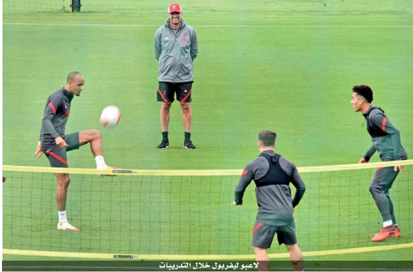
لاعبو ليفربول خلال التدريبات