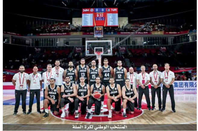
المنتخب الوطني لكرة السلة