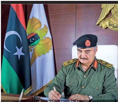
خليفة حطتر

ويع أن جذران الموقع باتت تنتفت بيته داخل الأنفاق المتداخلة، فإن المجمع كان في الواقع معلماً ذا هندسة معقد، يضم قاعات كثيرة معدة لمقاومة القنابل الذرية بزنة ٢٠ ألف طن وفيها غرف للقيادة العسكرية وأجهزة الاستخبارات العامة والقضاء وعمليات التجسس، وفق ما يوضح العسكري المتقاعد أشريت إيميري البالغ ٦٧ عاماً.