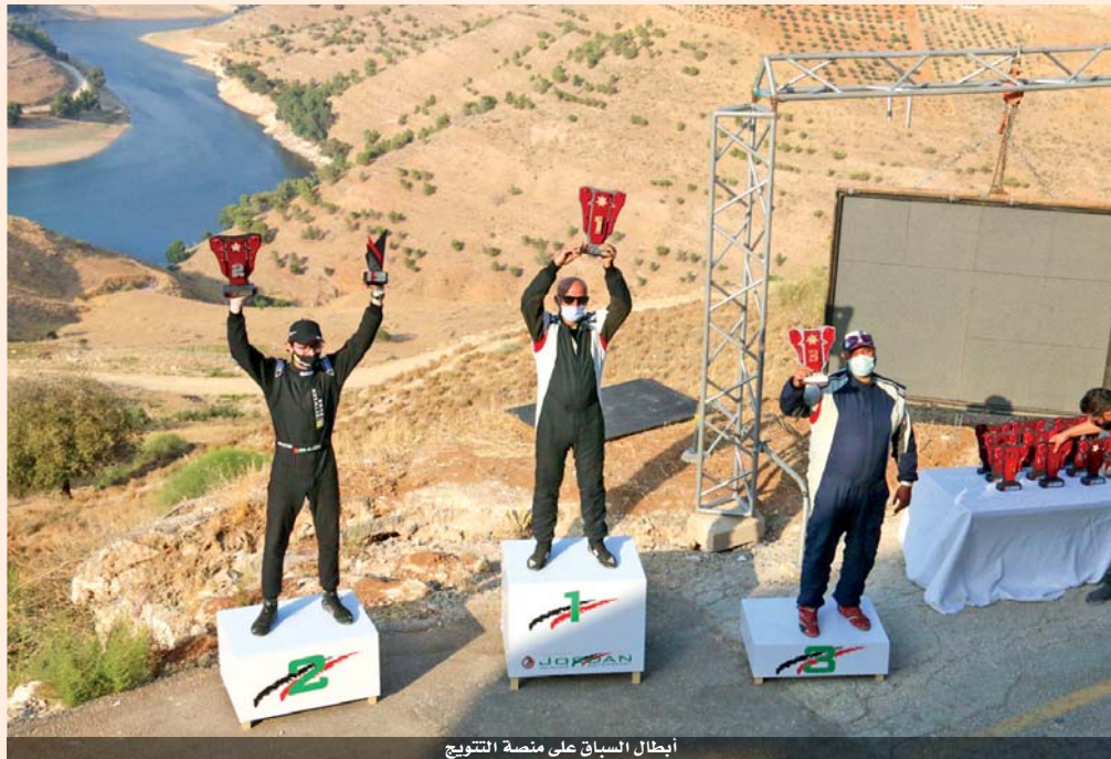
أبطال السباق على منصة التتويج