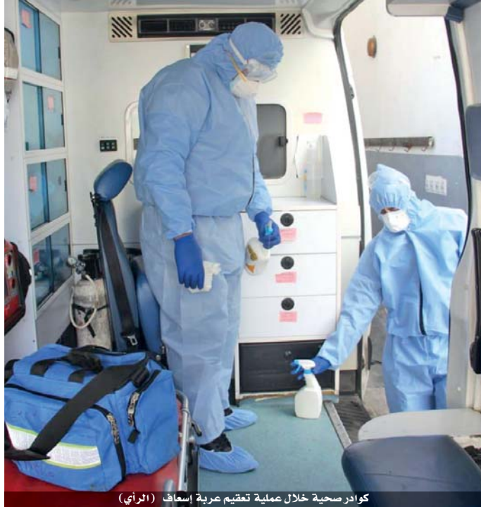
كوادر صحية خلال عملية تعقيم عربة إسعاف

إصابة «كلب» بالفيروس.. و«الأوبئة» تقلل من خطر انتقال العدوى للانسان منطقة حرجية في إربد لعزل الحيوانات المصابة