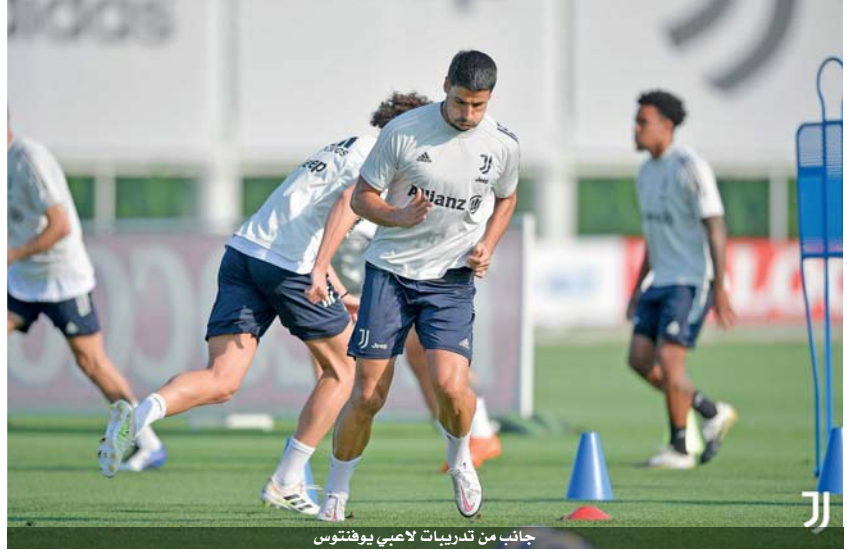
جانب من تدريبات لاعبي يوفنتوس

ليون الفرنسي، تاركا المهمة لتنج الوسط السابق أندريا بيرلو. ويأمل إنتر الإيفاء من التغيير الفني في فريق «السيدة العجوز»، من أجل إزاحته عن العرش والظفر باللقب للمرة الأولى منذ ٢٠١٠ حين أحرز ثلاثية تاريخية (الدوري والكأس المحليين ودوري أبطال أوروبا) بقيادة المدرب البرتغالي جوزيه مورينيو. ويخوض إنتر موسمه الثاني بقيادة لاعب وسط ومدرب يوفنتوس السابق أنتونيو كونتي الذي بدأ في طريقه للرحيل عن «نيرانسوري»، رغم قيادته الى نهائي الدوري الأوروبي «يوروبا ليغ»، حيث خسر أمام إشبيلية الإسبانية، وذلك لأن الإدارة الصينية للنادي لم تظهر دعمها له أو للاعبين بحسب ما تذرهم.