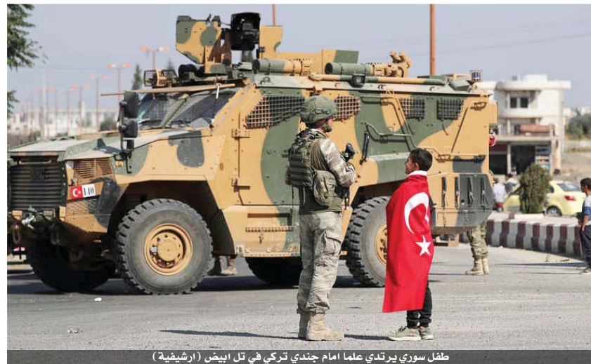
طفل سوري يرتدي علما امام جندي تركي في تل ابيض (الرشيدة)

وسيمت الإغلاق خلال ما يسمى بيوم الغفران، ويبدأ من منتصف الليل بين يومي السبت والأحد حيث سيتم رفعه في منتصف الليلة بين يومي الاثنين والثلاثاء. وأقام جنود الاحتلال بعد ظهر أمس حاجزاً عسكرياً على مدخل بلدة تقوع الى الشرق من بيت لحم الشمالي وقام الجنود بتوقيف المركبات وتقييد حركة المواطنين وقد ادى هذا الحاجز الى حدوث اختناقات في حركة السير. وقال نشطاء من البلدة ان جنود الاحتلال يتعمدون ويشكل مستمر على اقامة هذا الحاجز بهدف التضييق على المواطنين وعرقلة حركتهم بشكل انتقامي واستنزائي.