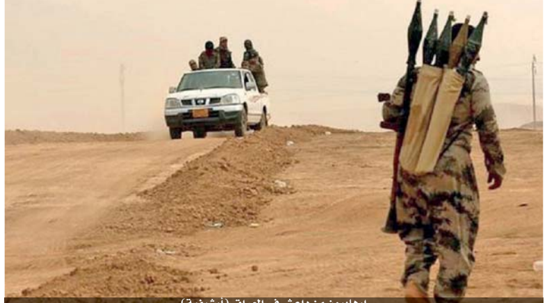
إرهابيون من داعش في العراق (أرشيفية)

عشرين فصيلاً بين فرع وشبكة، وتابع إن التنظيم يحقق نتائج متفاوتة، لكنه يسجل أداءه الأقوى في إفريقيا، وفق ما أظهره هجوم النيجر.