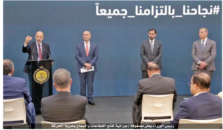
رئيس الوزراء يعلن مصفوفة إجراءات لفتح القطاعات والسماح بحرية الحركة