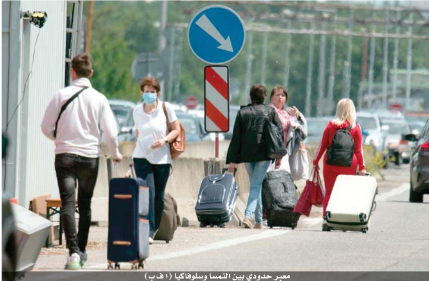
مغبر حدودي بين النمسا وسلوفاكيا

وتعتزم ألمانيا وبلجيكا القيام بذلك في ١٥ حزيران. من جهتها أعلنت هولندا عن تخفيف التحذير من السفر الى عدة دول أوروبية اعتبارا من ١٥ حزيران أيضا. وأعلنت إسبانيا انها ستفتح حدودها البرية مع فرنسا والبرتغال في ٢٢ حزيران.