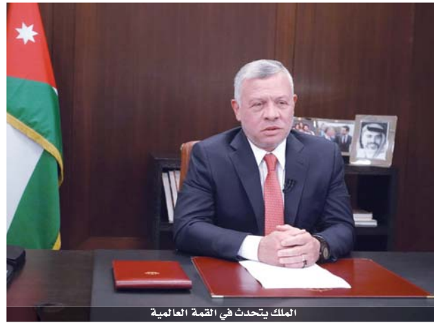
الملك يتحدث في القمة العالمية

منذ بداية هذا الوباء، دعا الأردن إلى المساواة في الوصول إلى الأدوية للقاحات، وقد بات من الواضح الآن، أنه لا يمكن التحلي عن أي دولة في هذه الأزمة. ضمان المساواة في الحصول على الأدوية والمطاعيم، ليس مطلباً أخلاقياً وعادلاً فحسب، بل هو في مصلحة المجتمع الدولي بأكمله، لأنه سيساهم في استعادة حرية الحركة المطلوبة بين الدول، لضمان انتعاش اقتصاداتها.