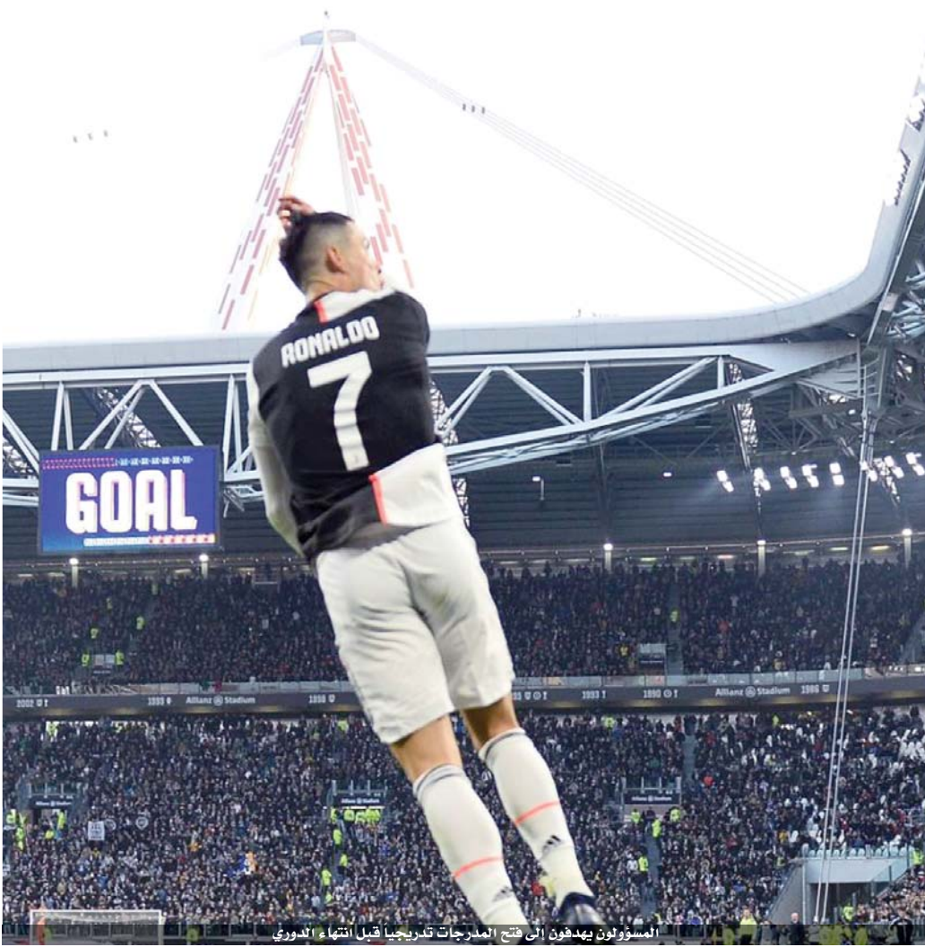
المسؤولون يهدفون إلى فتح المدرجات تدريجياً قبل انتهاء الدوري