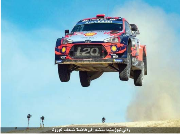
رالي نيوزيلندا، ينضم إلى قائمة شحايا كورونا

سبع سنوات، وبحزننا عدم التمكن من الذهاب إلى هناك هذه السنة، وتم تأجيل السباقات الأخرى التي كان من المقرر إقامتها بين نيسان وحزيران (الارجلتين ليس قبل الفصل الأخير من ٢٠٢٠ وإيطاليا)، فيما ألغى رالي البرتغال. وأصبح رالي تركيا الأول على جدول البطولة، ومن المقرر أن يقام بين ٢٤ و ٢٧ أيلول.