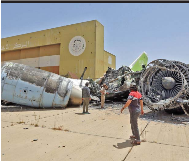
مسلمو الوفاق يعاينون الدمار في مطار طرابلس الدولي

ويزداد القلق بشأن نفوذ تنظيم داعش الارهابي في غرب إفريقيا وأفغانستان. واتهمت الولايات المتحدة التنظيم المتطرف بالمسؤولية عن هجوم دام الشهر الماضي على مستشفى لولاية في كابول، قائلة إن المسلحين أرادوا إفساد عملية السلام الناشئة بين أفغانستان وحكومة كابول.