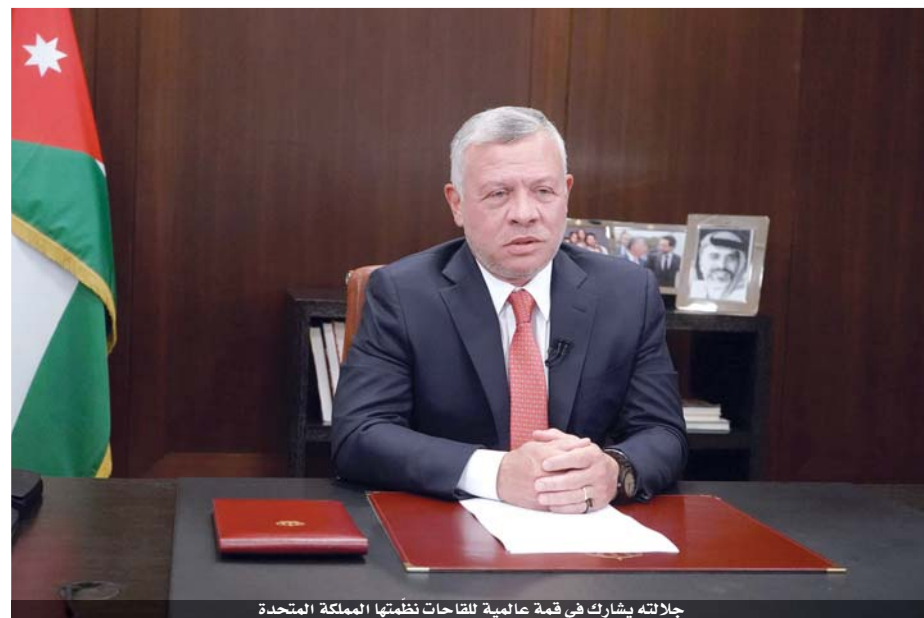
جلالته يشارك في قمة عالمية للقاحات نظمها المملكة المتحدة