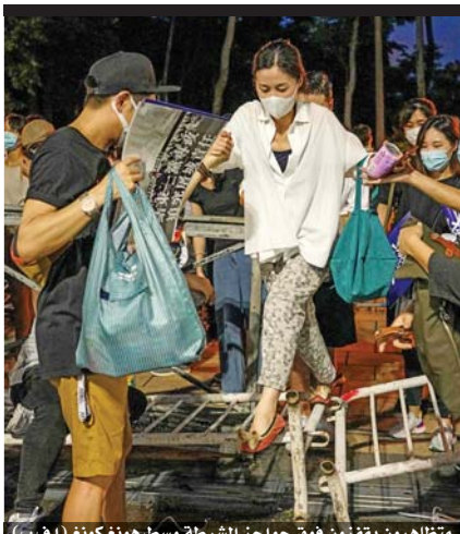
متظاهرون يتفقدون فوق حواجز الشرطة وسط هونغ كونغ

ومنذ إطلاق حكومة الوفاق الوطني عملية «عاصفة السلام»، مدعومة بطائرات تركية بدون طيار نهاية إدوغان، أكبر داعية.