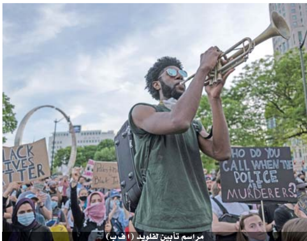
مراسم تأبين لـجورج فلويد ( أ ف ب )

وتابع «أنا القانون والنظام... هم ليسوا كذلك».