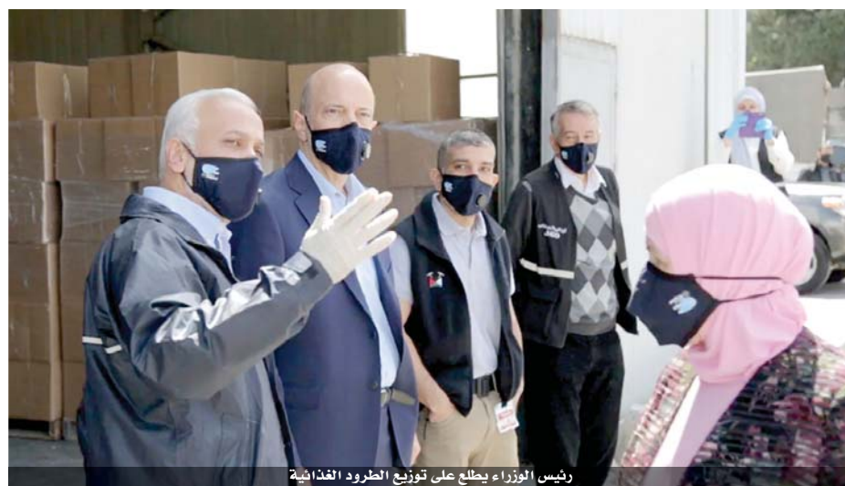
رئيس الوزراء يطلع على توزيع الطرود الغذائية