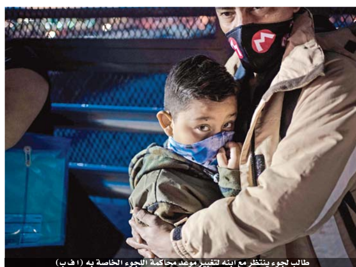
طالب لجوء ينتظر مع ابنته لتغيير موعد محاكمة اللجوء الخاصة به