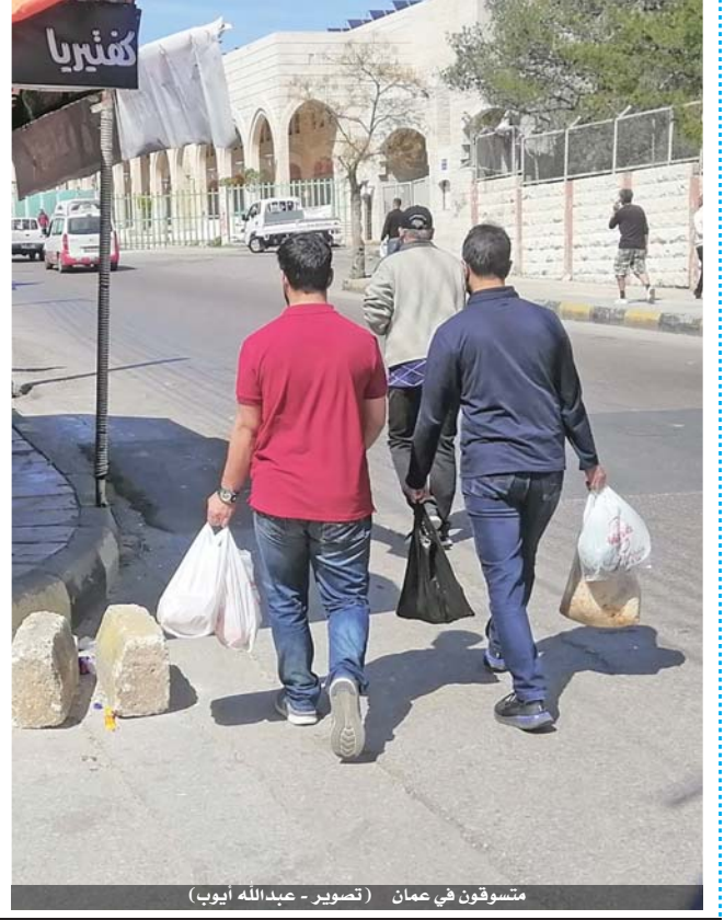
متسوقون في عمان