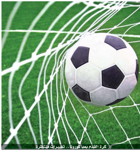
كرة القدم بعد كورونا.. تفسيرات منتظرة

تتدفق الأخبار والمعلومات، بشأن تغييرات واسعة ستشهدتها المنظومة الاقتصادية حول العالم، عقب التخلص من جائحة كورونا، في ظل الأزمة المالية والآثار السلبية المتوقعة، وبعد عودة الحياة إلى طبيعتها تدريجياً خلال الأشهر القادمة. ومع اعتبار كرة القدم، صناعة اقتصادية ضخمة بامتياز، ومنظومة مالية عالية الموارد، فإنها ستتأثر بلا شك، وبشكل مباشر، بتداعيات المرحلة الماضية وما تخللها من اختلالات في حصول الموارد التسويقية، من ريع المباريات، وحقوق البث التلفزيوني، إلى جانب دفعات الرعاية والمعلنين، مع الالتزام في الوقت ذاته، بصرف رواتب كبيرة للاعبين والمدربين والموظفين في مختلف الأندية. تلك الأزمة التي تلوح بالأفق، دفعت بعض اللاعبين والمدربين، للمبادرة في تخفيض رواتبهم، بهدف ضمان الاستقرار المالي للأندية، وتجنب مراحل صعبة وعواقب وخيمة، في حال استمرار الصفر الكبير، وتوقف العوائد بشكل تام، الأمر الذي قابله الاتحاد الأوروبي، بإعلان تعليق العمل بـ «قانون اللعب المالي النظيف» في الموسم القادم، تجنباً لفاضي عقوبات على الأندية التي تجاوزت مصروفاتها قيمة إيراداتها في العام ٢٠٢٠، ما يعني ضمناً إمكانية الاقتراض لتجاوز هذه الظروف العصيبة، بهدف ضمان استمرارية الكيانات الرياضية، دون النظر إلى التوازن المالي في هذا الوقت،