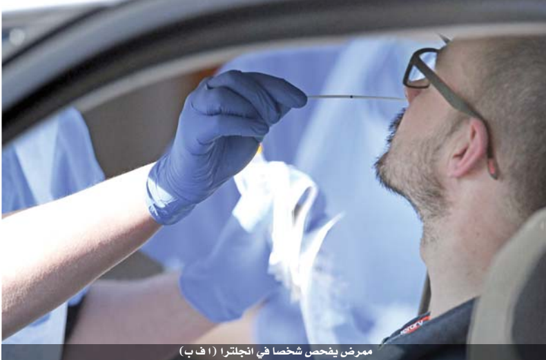
مرض يفضح شخصاً في إنجلترا