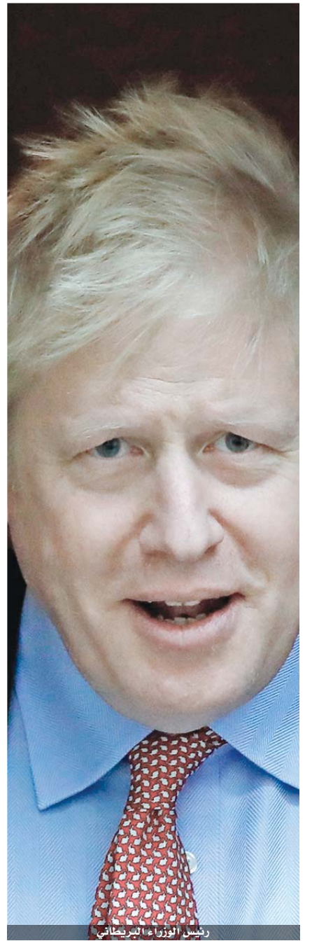
رئيس الوزراء البريطاني