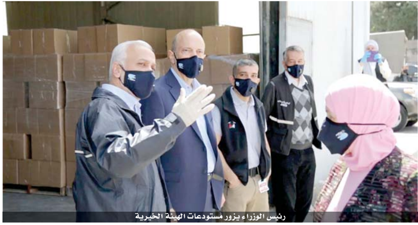
رئيس الوزراء يزور مستودعات الهيئة الخيرية

بجهود الجميع وإن شاء الله من خلال الإرادة المشتركة نستطيع الوصول إلى كل مواطن محتاج أينما كان على تراب الوطن». وقالت وزيرة التنمية الاجتماعية بسمة اسحاقان إن رئيس الوزراء شكل فرقا لمواجهة أزمة فيروس كورونا المستجد، مشيرة إلى أن فريق الحماية الاجتماعية أوكلت له مهام لحماية الفئات الهشة والضعيفة في المجتمع التي تأثرت نتيجة انتشار الفيروس. وأوضحت أن الفريق عمل على مدار الأيام الماضية على تنظيم ووضع مظلة لآلية العمل من خلال توزيع أدوار ومهام على أعضاء الفريق كل حسب اختصاصه.