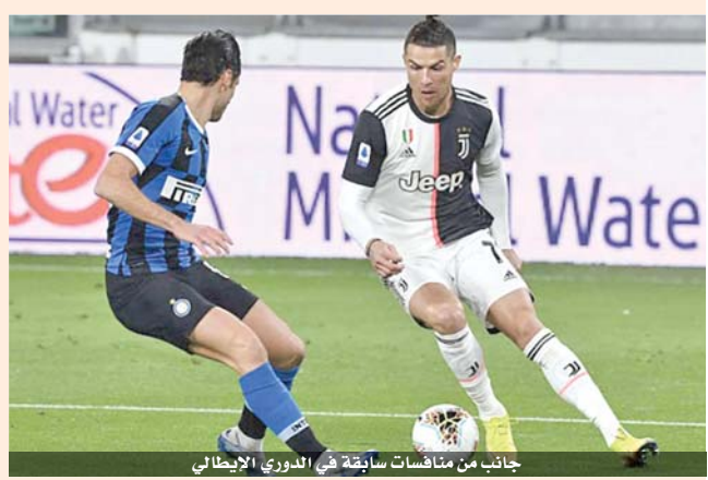
جانب من منافسات سابقة في الدوري الإيطالي