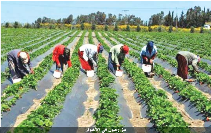
مزارعون في الأغوار

وأضاف الحلق أنه تبين عند معاينتها بأنها مصابة بجرح عميق ما تسبب بالتهاب في المفصل ليمت