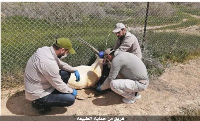
فريق من حماية الطبيعة

البيطرية لغايات تقديم خدماتها البيطرية بشكل يضمن حصول مربى الماشية على حاجاتهم من الخدمات البيطرية والعلاجية لمواشيمهم وتشمل الآلية كافة القطاعات. وقال الخرابشة ان الآلية الجديدة تضمن استمرارية هذا القطاع وديمومته. وتنتشر الرأى الالكترونية جداول آلية حول منح التصاريح.