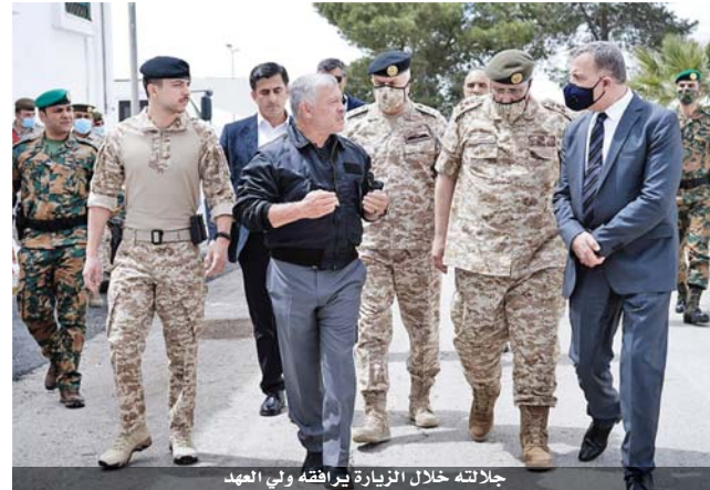
جلالته خلال الزيارة يرافقه ولي العهد