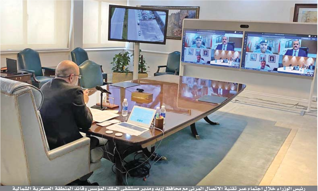
رئيس الوزراء خلال اجتماع عبر تقنية الاتصال المرئي مع محافظ إربد ومدير مستشفى الملك المؤسس وقائد المنطقة العسكرية الشمالية