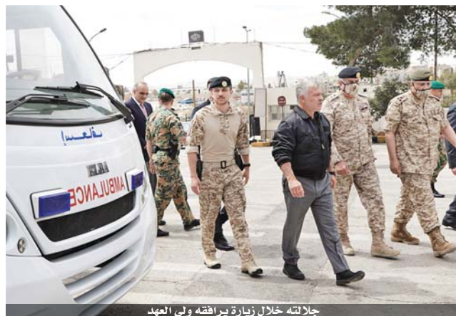
جلالته خلال زيارة يرافقه ولي العهد