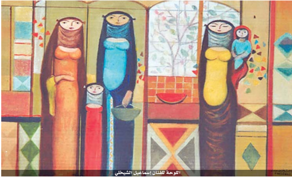
اللوحة للفنان إسماعيل الشبيخي