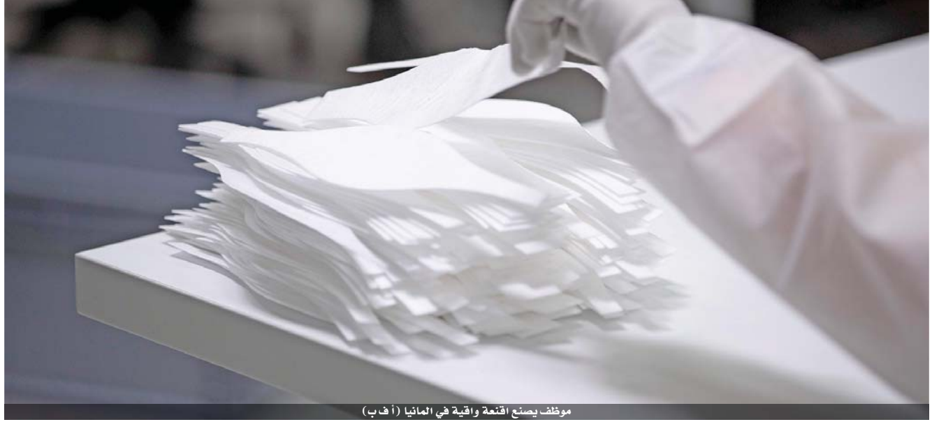
موظف يصنف أقفعة واقية في ألمانيا