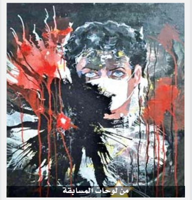
من لوحات المسابقة