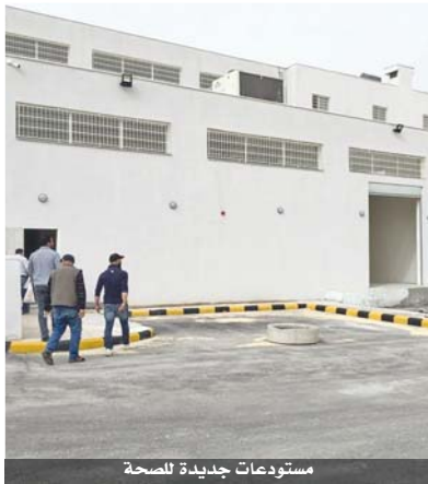
مستودعات جديدة للصحة