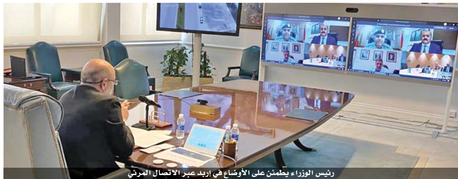
رئيس الوزراء يطمئن على الأوضاع في إربد عبر الاتصال المرئي