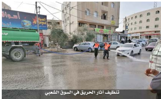
تنظيف آثار الحريق في السوق الشعبي

اتى حريق نشب في سوق تجارية شعبية بمنطقة المرح في مدينة الكرك على جانب كبير من محتويات السوق من المواد التموينية والبضائع المختلفة، وحال تدخل اطفائي دفاع مدني الكرك الذين عملوا على اخماد الحريق دون وصول النيران للمحال التجارية القريبة، وعملت كوادر بلدية الكرك الكبرى بمتابعة من رئيس البلدية ابراهيم الكركي على ازالة مخلفات الحريق من داخل السوق كما نظفت محيط السوق والشوارع المار امامه من آثار الحريق واجرت عملية تعقيم شاملة في الموقع.