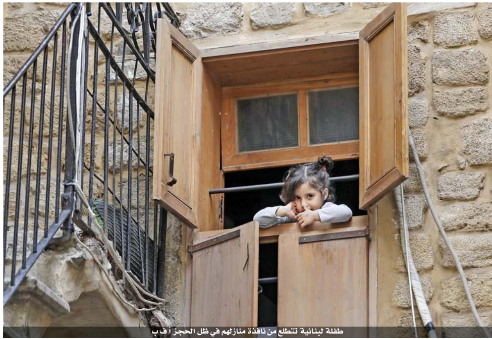
طفلة لبنانية تتطلع من نافذة منازلهم في ظل الحجر

لكوفيد-١٩. ودعا النظم القضائية إلى مواصلة «مقاضاة المعتدين»، مطالباً بشكل خاص بإنشاء أنظمة إنذار طارئة في الصيدليات ومحلات البقالة، وهي الأماكن الوحيدة التي تزال مفتوحة في بلدان كثيرة. وشد غوتيريش على ضرورة «تهيئة سبل أمنة للنساء لاتتماس للدعم، من دون أن يتنبه المعتدون، إلى ذلك». وقالت الأمم المتحدة إنها غير قادرة في هذه المرحلة على تحديد عدد النساء أو الفتيات اللواتي يتعرضن لعنف أسري في العالم نتيجة الحجر المنزلي، لكنها أشارت إلى أن واحدة من كل ثلاث نساء تتعرض للعنف خلال حياتها. وفي ظل الحجر المنزلي الهادف لاحتواء وباء كوفيد-١٩، تجد العديد من النساء أنفسهن محتجزات في المنزل مع معنفهن، وهذه الظاهرة قد تكون موجودة في كل الدول، كما أشارت الأمم المتحدة. وفي الولايات المتحدة، أفادت مدن عدة عن ارتفاع في حالات العنف الأسري والاتصالات التي تلقاها السلطات بهذا الشأن. أما في الهند، تضاعفت أعداد حالات التنميف خلال الأسبوع الأول من فرض قيود على التحرك، بحسب اللجنة الوطنية للنساء. ودعمت ناشطات تركيات من جهتهن إلى توفير حماية أفضل للنساء بسبب ارتفاع عدد عمليات القتل التي تستهدفهن منذ توصية السلطات بالعزل المنزلي