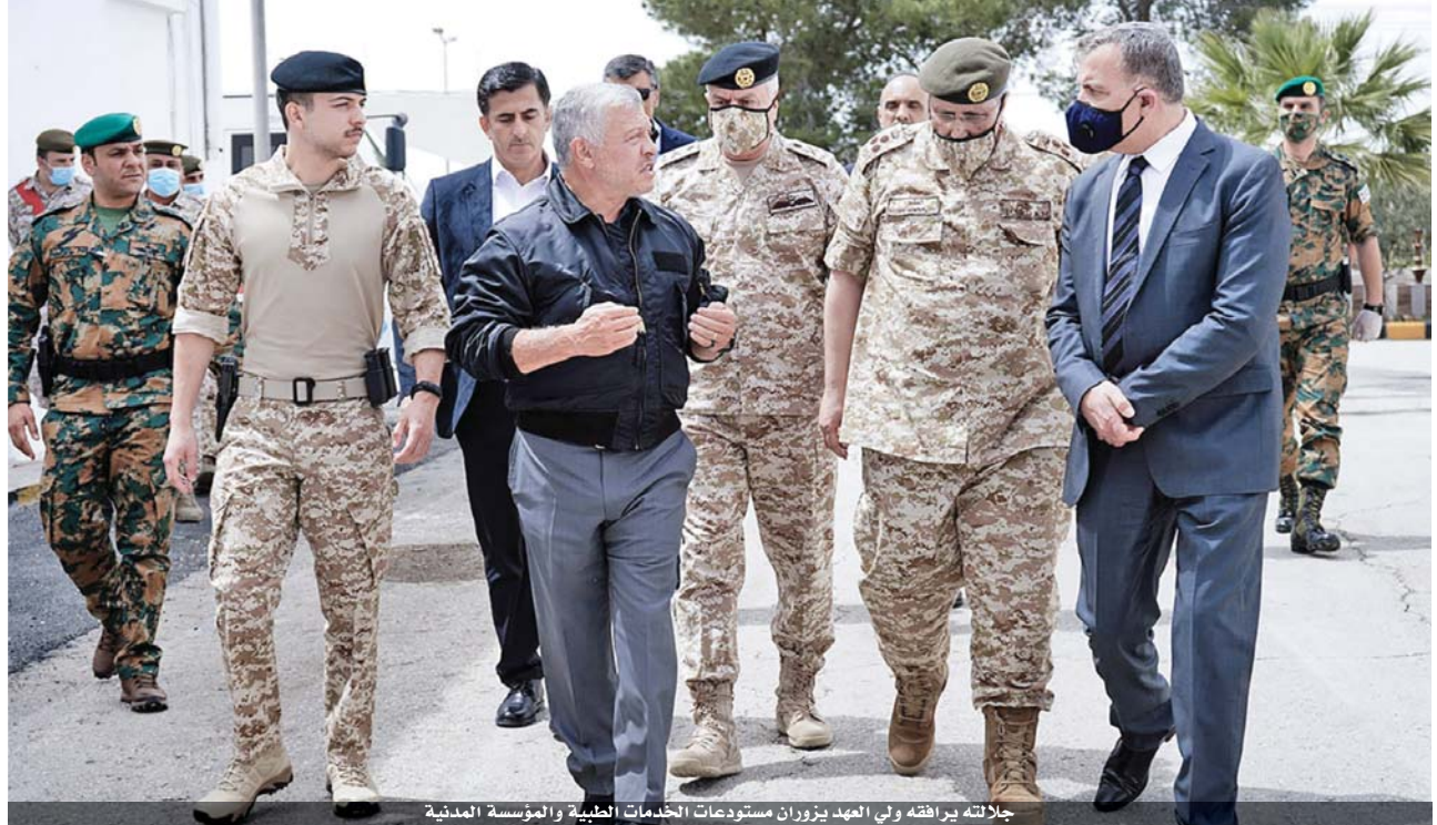
جلالته يرافقه ولي العهد يزوران مستودعات الخدمات الطبية والمؤسسة المدنية