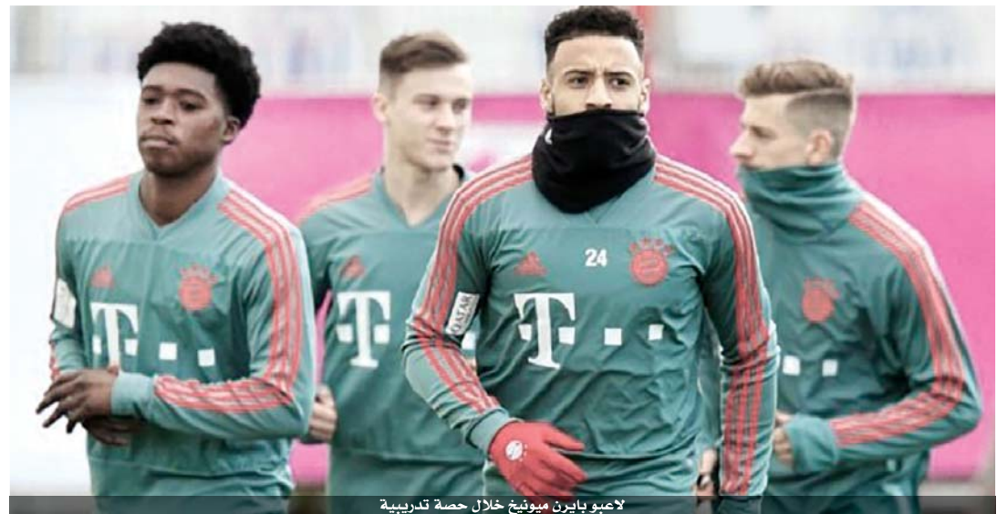
لاعبو بايرن ميونيخ خلال حصة تدريبية

تمارين افتراضية عن بعد للاعبيه عبر تقنية الفيديو، للحفاظ على لياقتهم البدنية بالحد الأدنى استعداداً لاحتمال استئناف المنافسات، على رغم ان أي موعد لذلك لم يحدد بعد، وسيكون مرتبها بطبيعة الوضع الصحي الراهن والقيد المفروضة للحد من تفشي الوباء. وحض بايرن مشجعيه على الالتزام بتعليمات السلطات للحد من تفشي فيروس كورونا المستجد، طالبا منهم عدم الحضور الى مقر التدريب.