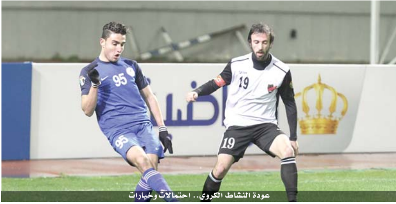
عودة النشاط الكروي... احتمالات وخيارات