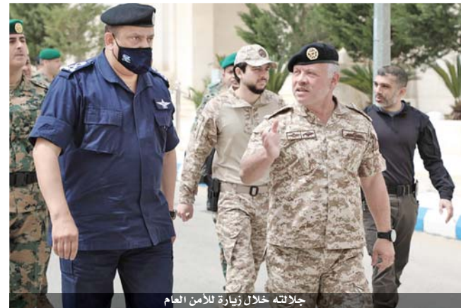
جلالته خلال زيارة للأمن العام