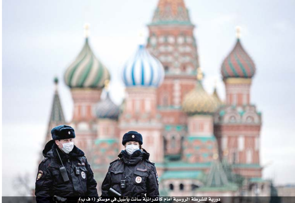
دورية للشرطة الروسية أمام كاتدرائية سانت باسيل في موسكو