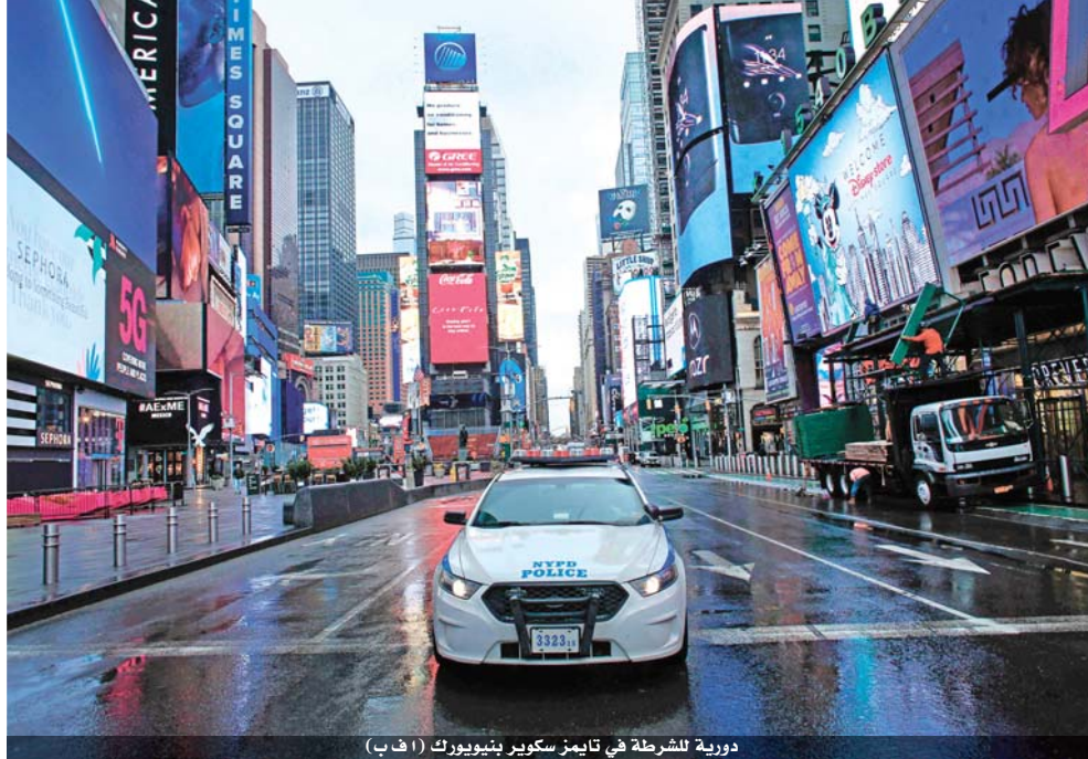
دورية للشرطة في تايمز سكوير بنيويورك

واشنطن تستعد للأسوأ.. وتوقع وفاة ٢٠٠ ألف أميركي