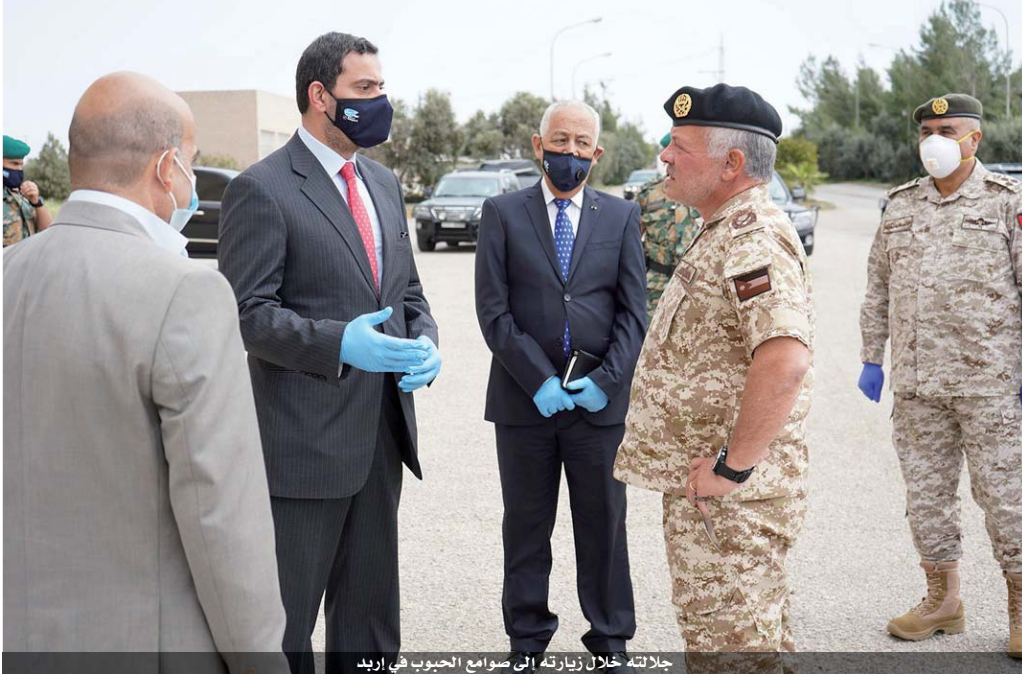
جلالته خلال زيارته إلى صوامع الحبوب في إربد

مخزون السلع والمواد الأساسية ضمن الحد الأدنى ومتابع يوميا