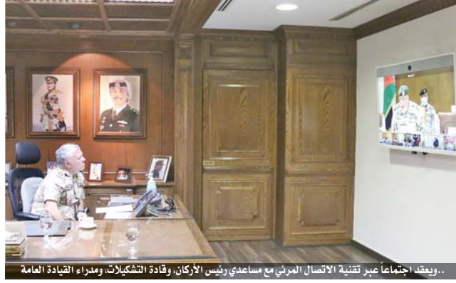
..ويبحث اجتماعاً عبر تقنية الاتصال المرئي مع مساعدي رئيس الأركان، وقادة التشكيلات، ومدراء القيادة العامة

دان رئيس الاتحاد البرلماني العربي رئيس مجلس النواب المهندس عاطف الطراونة، الهجوم الحوثي بصواريخ بالستية استهدفت مدينتي الرياض وجزان في السعودية. أكد الطراونة لقرار مجلس الأمن الدولي الذي يحظر توريد الأسلحة لمليشيا الحوثي. واعرب عن وقوف الاتحاد مع السعودية وثقتة بحكمة قيادتها وفاعلية دبلوماسيتها في مواجهة جميع أشكال الإرهاب، والأخطار البشرية والطبيعية، وضمان أمنها واستقرارها، وسلامة مواطنيها والمقيمين على أراضيها.