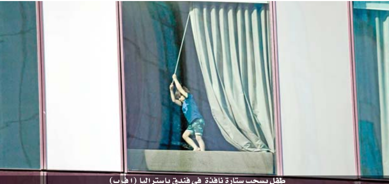
طفلة يسحب ستارة نافذة في فندق باستراليا

أعلنت أستراليا امس تخصيص مئة مليون دولار أسترالي (٦١.٦ مليون دولار) إضافي لمحاربة العنف المنزلي بعدما سجلت الأجهزة المختصة ارتفاعاً في الانتهاكات مع انتشار فيروس كورونا المستجد. وأوضح رئيس الوزراء سكوت موريسون أن محركات «غوغل» سجلت زيادة بنسبة ٧٥% في عمليات البحث عن مساعدة، خلال اجراءات الإغلاق التام للخدمات غير الأساسية في هذا البلد لاحتواء وباء كوفيد-١٩. وأشارت جمعية «ويمنز سايفتي» لمكافحة العنف المنزلي في نيو ساوث ويلز، أكثر ولايات البلاد اكتظاظاً بالسكان، إلى أن أكثر من ٤٠% من العمال سجلوا ارتفاعاً في عدد المشتكين مع ارتباط ثلث الحالات بانتشار الفيروس.