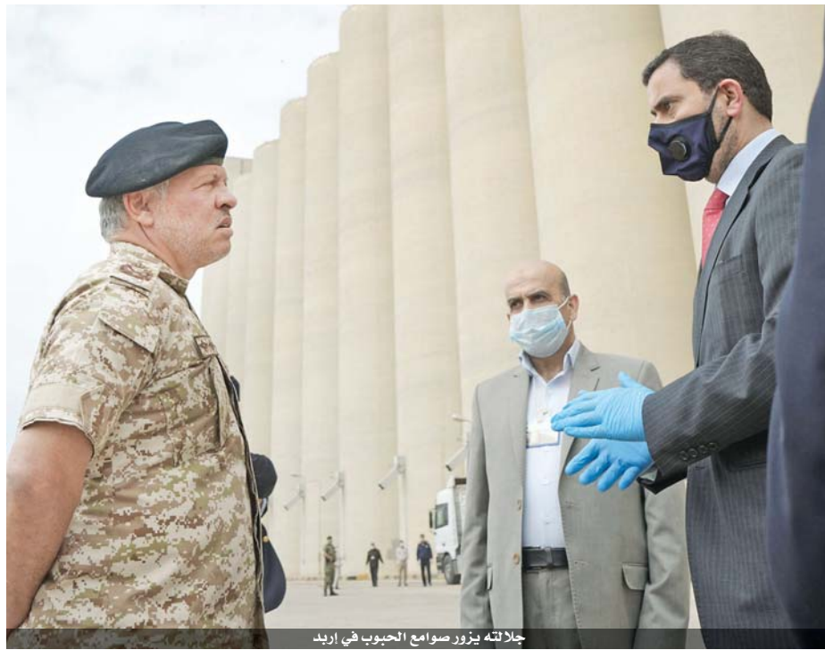
جلالته يزور صوامع الحبوب في إربد

الأداء خلال هذه الفترة كان أنموذجاً يجب أن يستمر تقديم جميع أشكال المساعدة الصحية والعلاجية للمواطنين الاستمرار بتطبيق القانون دون تهاون أو تقصير ضرورة استدامة المخزون الاستراتيجي الغذائي