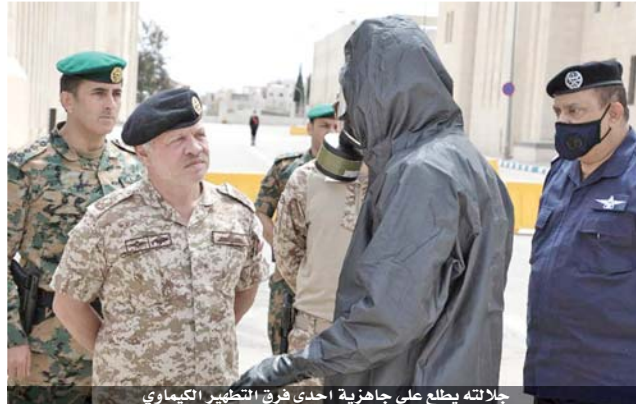
جلالته يطلع على جاهزية إحدى فرق التطهير الكيماوي

وانسيابية الخدمة الامنية المقدمة على مدار الساعة، فضلاً عن آليات الاستجابة السريعة لتلبية احتياجات المواطنين الضرورية والطارئة. واطلع جلالته الملك على جاهزية إحدى فرق التطهير الكيماوي التابعة للدفاع المدني، والمزودة بأحدث الآليات والمعدات التي عملت أخيراً على تطهير وتعقيم عدد كبير من المواقع، إضافة إلى فريق الإسعاف الميداني المجهز للتعامل مع الحالات المشتبته بإصابتها، والمدرب على التعامل مع فيروس كورونا.