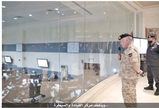
..ويتفقد مركز القيادة والسيطرة