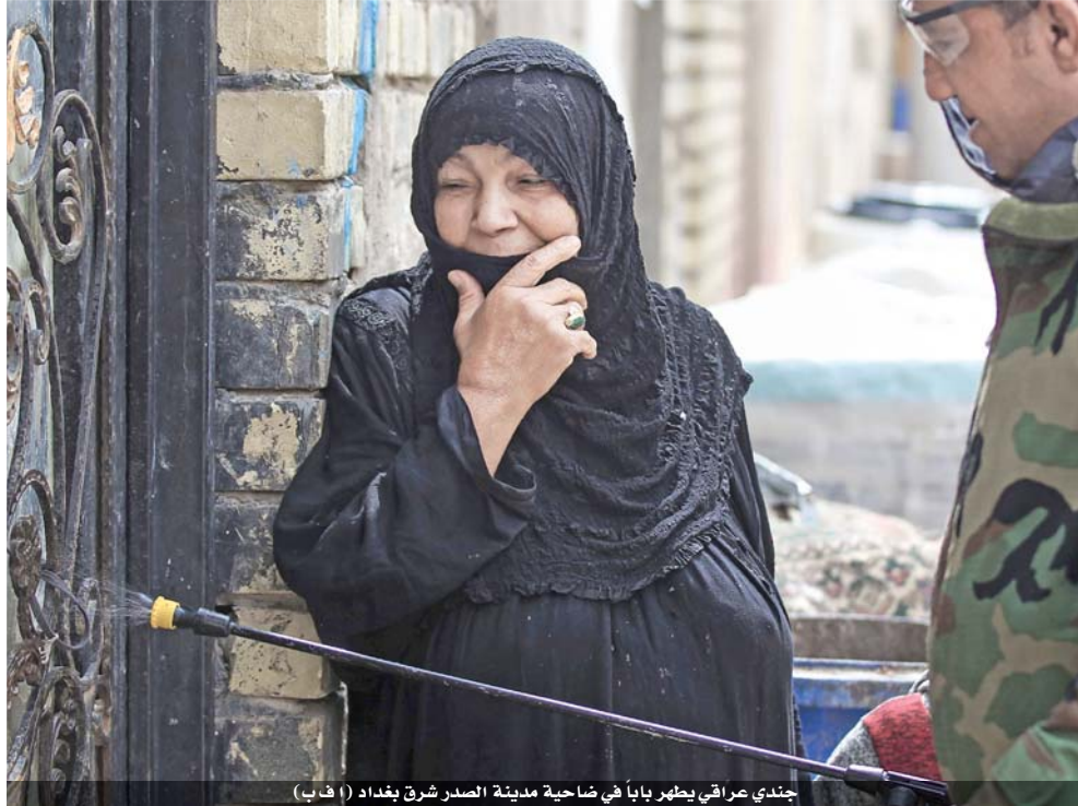
جندي عراقي يطهر بابا في ضاحية مدينة الصدر شرق بغداد