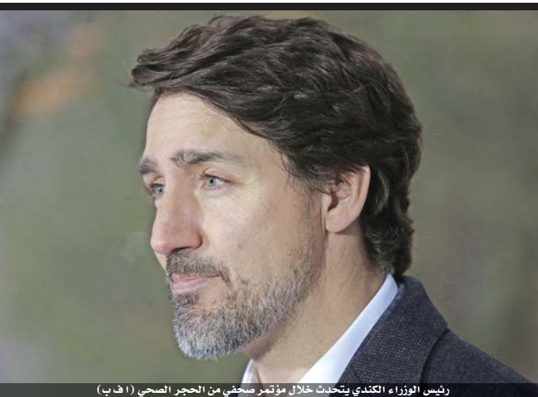
رئيس الوزراء الكندي يتحدث خلال مؤتمر صحفي من الحجر الصحي

وهذه المرحلة الأخيرة في بمشيئة الله تعالى وإبصارنا جميعاً كمواطنين ومقيمين سوف تشكل حبل النجاة والخلص من هذا الوباء الشرس شريطة البقاء في البيوت وتقاضي