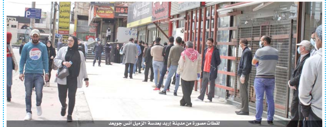
لقطات مصورة من مدينة إربد