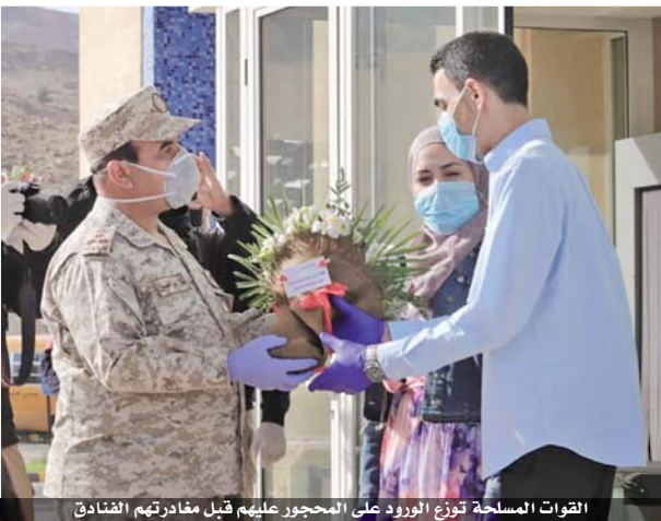
القوات المسلحة توزع الزهور على المحجور عليهم قبل مغادرتهم الفنادق

انتهاء الأزمة وبشكل قانوني سليم. وأكد مراد ان المعلمين في القطاع الخاص يواجهون صعوبات في الحصول على رواتبهم في الوقت المناسب، مما دفعهم إلى التفكير في حلول بديلة. وتعددت الآراء حول كيفية معالجة هذه المشكلة، مع اقتراب حلولها في المستقبل.