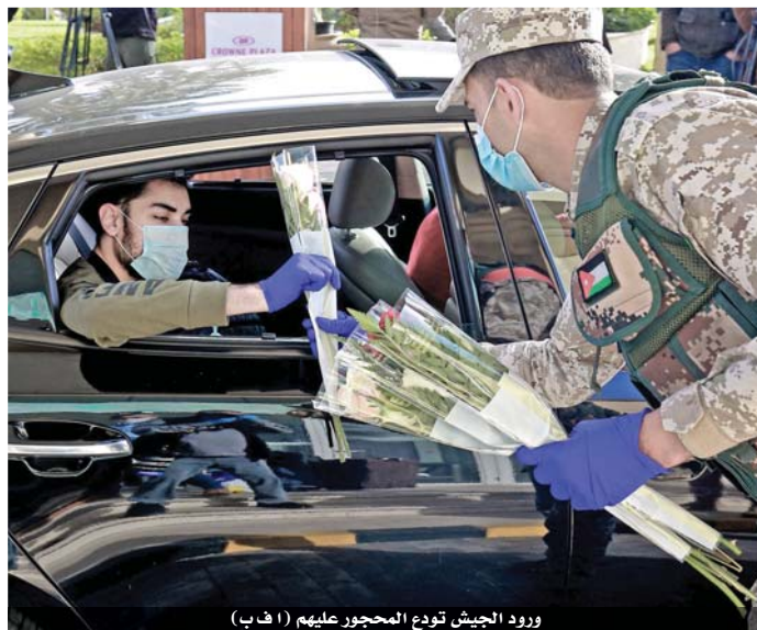
ورود الجيش تودع المحجور عليهم

الحذر مطلوب والالتزام واجب فالخطر ما زال قائماً ارتفاع الوفيات يعكس خطورة الوباء وصعوبة التعامل معه لا إصابات بين مخالطي الطلبة العرب المصابين في إربد تحذير من زيارة الحجر الصحي ومخالطتهم