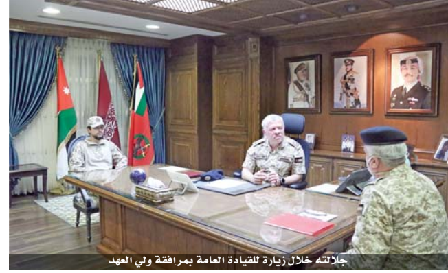
جلالته خلال زيارة القيادة العامة يرافقه ولي العهد

جلالته يطلع على استعدادات الخدمات الطبية لمواجهة «كورونا»