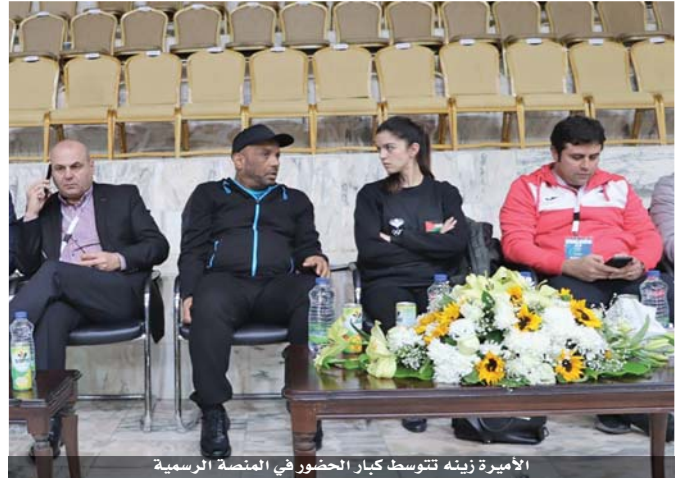
الأميرة زينة تتوسط كبار الحضور في المنصة الرسمية

١١-٦)، وتميزت بالهجوم بالكرات الطويلة من جهة اليسار.