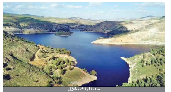
سد الملك طلال

الى قناة الملك عبد الله ونهر الاردن، الى ضرورة اتخاذ الاحتياطات اللازمة، استعداداً للتعامل مع تدفق كميات مياه كبيرة في مجاري الاودية أسفل منطقة السد وتشكل السيول خاصة في المناطق المنخفضة والودية ما يشكل خطورة، في حال عدم الالتزام بتعليمات سلطة وادي الاردن. ونشاند الحبيصة، المواطنين والمزارعين ومربي المواشي لاتخاذ الاحتياطات اللازمة لحماية المزارع والمنشآت، لمنع تدفق المياه اليها من خلال الاجراءات المسبقة المتبعة في مثل هذه الاحوال حفاظاً على مزرعاتهم وممتلكاتهم. وأوضح ان فريقاً من الفنيين والمختصين المعنيين، يراقبون كافة السدود أولاً بأول، ويقومون بالتنسيق مع الجهات المعنية لضمان التعامل مع الظروف الجوية المتوقعة، مشدداً على ان هذه التحذيرات تشمل ايضاً كافة السدود في المملكة، والودية التي تقع اسفلها