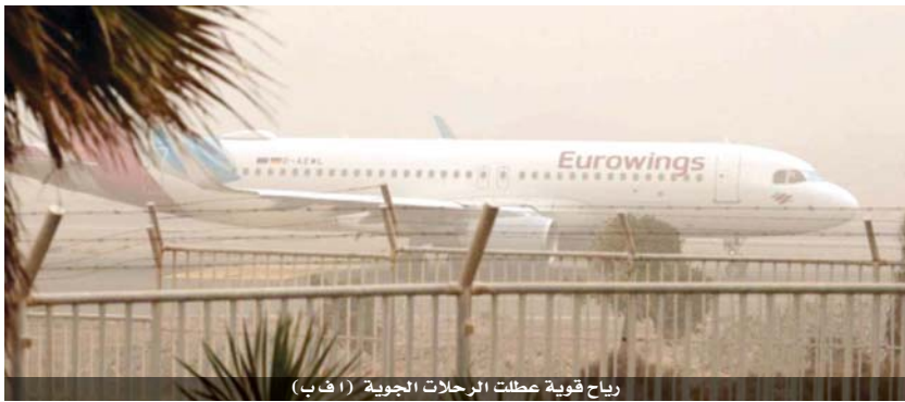
رياح قوية عطلت الرحلات الجوية (أ ب)

السبب بعدما غطت الأجواء رياح قوية تحمل رملاً حمرام من الصحراء، ما اضطر إدارة المطارات إلى إلغاء الرحلات الجوية من جزرتي غران كناريا وتينيريفي وإلبيها. وقال رئيس الحكومة الإقليمية لجزر الكناري أنجيل فيكتور توريس خلال مقابلة مع التلفزيون الأسباني الرسمي، إن أكثر من ٨٠٠ رحلة وآلاف الركاب تأثرت بالأحوال الجوية الأحد، إلا أن بعض الطائرات كانت قادرة الطيران خلال الليل ما ساعد على التخفيف من تراكم الرحلات. وفي مطاري تينيريفي، أمام المسؤولين