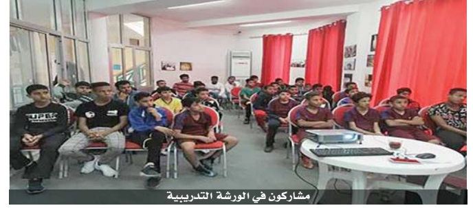
مشاركون في الورشة التدريبية