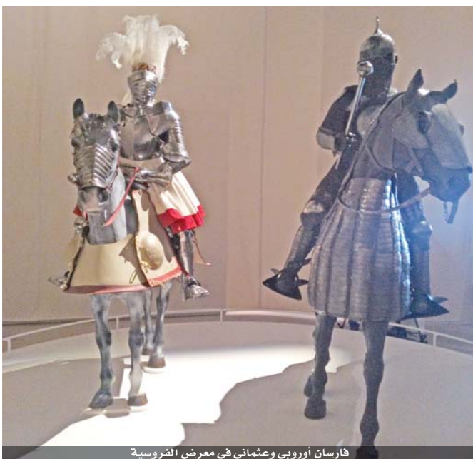
فارسان أوروبي وعثماني في معرض الفروسية

اختار لوفر أبو ظبي القرون الوسطى، لتؤثر على حقيقة زمنية لفعاليات معرضه «فن الفروسية بين الشرق والغرب» الذي افتتح ابوابه للجمهور، الاربعاء الماضي بعد عرض مسبق، أعد خصيصا لصحفيين، قدموا من مختلف أنحاء العالم بينهم الراي الاسبوع الماضي. المعرض، الذي يستمر حتى الثلاثاء من أيار، يحاكي رحلة الفروسية بمعانيها الثقافية والاجتماعية والسياسية، من خلال ١٣٠ قطعة فنية واثرية، تضم اسلحة مستخدمة في حروب العصور الوسطى (اوائل القرن الحادي عشر حتى السادس عشر). يقول مدير لوفر أبو ظبي مانويل زيبانتي: إن المعرض يأتي في إطار رؤية المتحف الثقافية، من خلال مقاربة غير مسبقة، لمفهوم ثقافة الفروسية في العصور الوسطى في العالمين الاسلامي والمسيحي، بصورة الفارس مترشحة في الأذهان، بقم تتمثل في الفروسية كالثجاعة والنبل والكرم والشهامة. ويؤشر المتحفون في حفل الافتتاح الى التعاون بين لوفر أبو ظبي، ومتحف كلوني في باريس، ووكالة متاحف فرنسا ويوكدون «بان لا شي مستحيل في التعاون لانتاج الأفضل». تبدأ أولى الخطوات في المتحف، ليستقبل فارسين على حصانين يرتديان دروعا حديدية، أحدهما اوروبي، من المتحف الحربي في باريس، والأخر عثمانى، من لوفر أبو ظبي، وهذا بداية الاقسام الثلاثة للمعرض، الذي صممه شركة فينستريت كورنو اركتيكيت. وتبدأ قراءة فروسية قرون العصور الوسطى، من خلال معروضات هذا القسم، إذ يتناول المتحفون الثلاثة عن المعروضات، تفاصيل الحياة الاجتماعية للفارس، من خلال القطع الفنية، فطبق يحمل صورة ملك ساساني