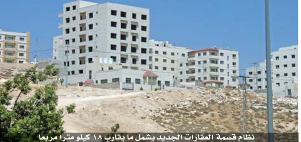
نظام قسمة العقارات الجديد يشمل ما يقارب ١٨ كيلو متراً مربعاً

عمان - بترا عممت دائرة الأراضي والمساحة نظام قسمة العقارات في المناطق خارج التنظيم، «إفراز الأربعات»، الذي وافقت عليه الحكومة أخيراً، على جميع أنحاء المملكة للعمل به في القرى كافة. وأضافت الدائرة، في تصريح صحفي لوكالة الأنباء الأردنية (بترا) أمس، أن النظام الجديد الذي يشمل ما يقارب ١٨ كيلو متراً مربعاً جاء لتمكين الشركاء من الإفراز فيما بينهم، وله أثر إيجابي في إزالة الشبوع، وتنظيم تسجيل الملكية، وتسهيل ممارسة الحقوق المرهقة بها من بيع وفرز ورهن واستثمار.