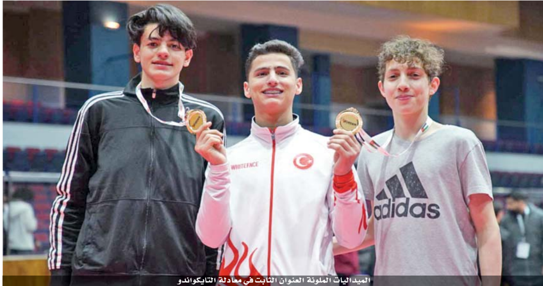
الميداليات الملونة العنوان الثابت في معادلة التايكواندو