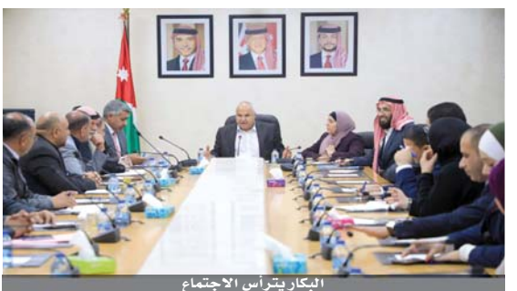
البيكار يترأس الاجتماع

بكتاب يوضح كافة المشاريع المستمرة والسابقة والجديدة لمعالجة الخلل فيها، فضلاً عن مراجعة جميع المشاريع الجديدة. وعرض رئيس وأعضاء مجلس معان، لأبرز التحديات التي تواجههم كانهخفاض الموازنة بنحو ٧٨ بالمئة ما أثر سلباً على عدد من المشاريع، مؤكداً أنهم مطالبون بتسديد ديون وصلت قيمتها إلى ٨ ملايين دينار، فيما بلغ حجم موازنة المجلس نحو ٤ ملايين دينار. كما أكدوا أنه تم إلغاء ١٢٣ مشروعاً بسبب تخفيض حجم الموازنة. وقالوا: إن التخفيض طال عدداً من المشاريع ذات الصلة بالخدمات المقدمة للمواطنين وأهملت الشوارع، وإنشاء مراكز صحية، ومدارس في الشوبك التي يعاني طلابها من الدراسة في الكرفانات.