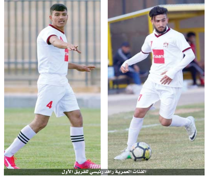
الفئات العمرية رافد رئيسي للفريق الأول