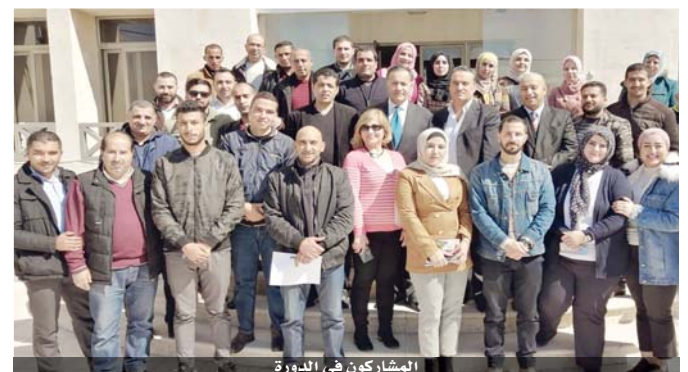
المشاركون في الدورة

انطلقت فعاليات دورة الاستثمار والتسويق للمنشآت الرياضية والشبابية للعلماء في أندية المدن الرياضية وبيوت الشباب بمشاركة ٤٠ مشارك ومشاركة. وتعد الدورة التي ينظمها مركز إعداد القيادات الشبابية بالتعاون مع صندوق دعم الحركة الشبابية والرياضية دورة متخصصة في التسويق والتسويق بالمنشآت الشبابية والرياضية، بهدف بناء قدرات وتعزيز مهارات العاملين في المدن الرياضية وأندية المدن. وتحدث مدير مركز إعداد القيادات الدكتور ياسين الهليل حول سبل التسويق الجيد للخدمات التي تقدمها هذه المنشآت بما تحتويه من مرافق وخدمات نوعية ومساحات شبابية متطورة وعصرية وكذلك خدمة الزبائن من منتهي الخدمة بشكل جيد يتناسب مع الأسس العلمية والمنهجية في استقطاب الزبائن الخرج بجملته من التوصيات.