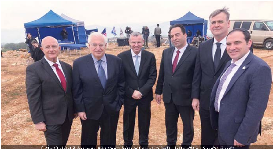
الفريق الأمريكي - الإسرائيلي المشكل لرسم الخرائط المحددة في مستوطنة أرييل

إلى تل أبيب بهدف عقد لقاءات مشتركة مع نظيره الإسرائيلي، حيث من المتوقع أن يلتقي بنيامين نتانياهو رئيس الوزراء الإسرائيلي. وكان بنيامين نتانياهو أعلن اسم الاول، إنه سيتم الانتهاء من رسم الخرائط الخاصة بالحدود وفق الخطة الأميركية «صفقة القرن، هذا الأسبوع.