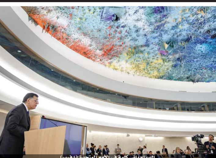
السراج يلقي كلمة في الأمم المتحدة

وقالت الامم المتحدة ان الطرفين سيلتقيان الشهر المقبل لمناقشة تطبيق شروط الاتفاق، ولكن نظراً الى العداوة بين الطرفين، فإن احتمال التوصل الى هدنة دائمة لا يزال غير واضح. وفي كلمة أمام مجلس حقوق الإنسان انتقد السراج حفتر امس ووصفه بأنه «مجرم حرب، مستنكر التقاسم الدولي حول العنف في ليبيا». وقال السراج إن العالم بأسره شاهد تصاعد الأعمال القتالية والهجمات ضد طرابلس منذ ٤ نيسان ٢٠١٩، معرباً عن أسفه انه رغم العدد الكبير من القتلى والجرحى بسبب عمليات حفتر الا ان المجتمع الدولي لم يتحرك. وشن حفتر هجومه على طرابلس في نيسان الماضي ولكن بعد احراز قواته تقدماً سريعاً، توقفت عند مشارف العاصمة. وأدى القتال الى مقتل أكثر من الف شخص وتشريد نحو ١٤٠ ألفا آخرين، بحسب الامم المتحدة، إلا أن حكومة الوفاق الوطني قالت ان الاعداد يمكن أن تكون أعلى من ذلك. وتم التوصل إلى هدنة في ١٢ كانون الثاني، لكنها تنتهك باستمرار. وقال السراج «طالبنا عدة مرات بتشكيل لجان التحقيق في الانتهاكات وعمليات التهجير القسري والاحتجاز التعسفي وعمليات الاعدام الميداني».