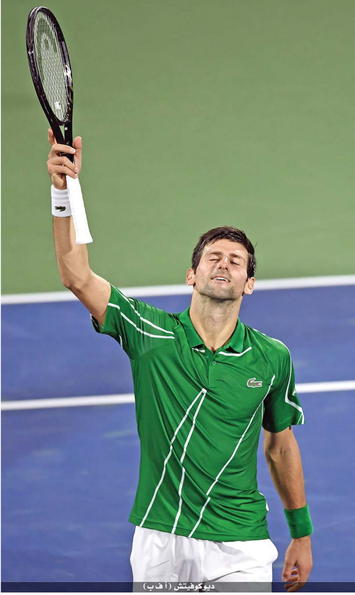
ديوكوفيتش (أ ف ب)

وفي أبرز مباريات الدور الأول أيضاً، التحق بخاتشانوف مواطنه أندري روليف المصنف سادساً، بفوزه على الإيطالي لورنتسو موسيتي ٤-٦ و ٤-٦، بينما قلب الفرنسي ريشار غاسكيه على الجنوب إفريقي لويد هاريس بنتيجة ٦-٧ (٥-٧) و ٤-٦.