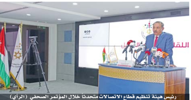
رئيس هيئة تنظيم قطاع الاتصالات متحدثاً خلال المؤتمر الصحفي

عمان - د.هتحي الأخوات قال رئيس هيئة تنظيم قطاع الاتصالات الدكتور المهندس غازي الجبور إن لا تغول شركات الاتصالات على المواطنين. وأشار في مؤتمر صحفي عقده في مقر الهيئة أمس، إلى وجود بعض الملاحظات الإجرائية التي تستوجب التصحيح تتعلق في طريقة التحاسب. وأعلن الجبور أن إيرادات الخزينة من الهيئة بلغت ١٢٣ مليون دينار في العام الماضي. وكشف في المؤتمر عن قرب إنجاز نظام التوثيق الإلكتروني بصمة اليد، لخطوط الهواتف بالتعاون مع الشركات، وقال إن النظام في مراحله الأخيرة.