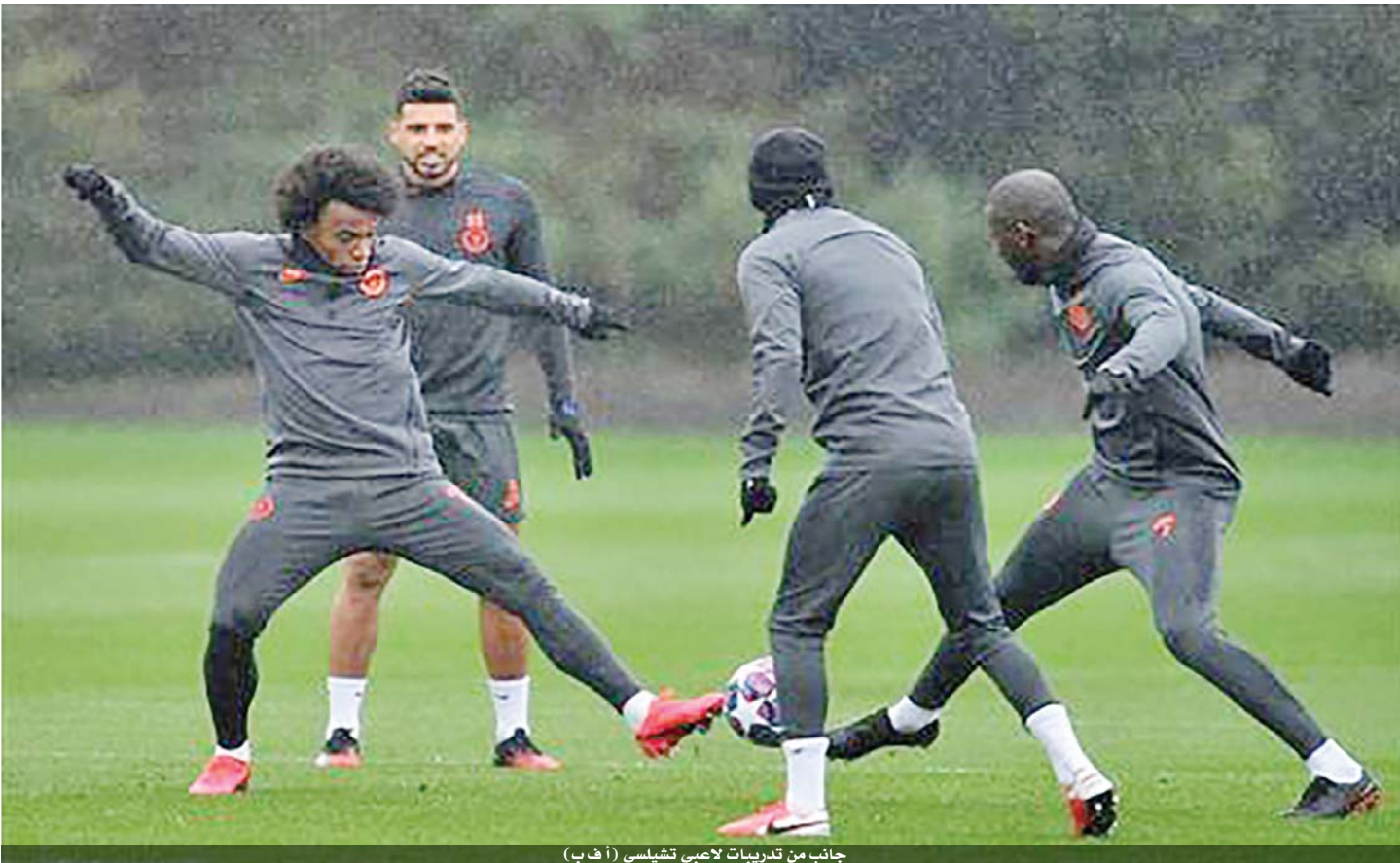
جانب من تدريبات لاعبي تشيلسي

ويبدأ تعويل المدرب الجديد للنادي البافاري هانزي فليك على مولر في المباراة القارية واضحا عندما