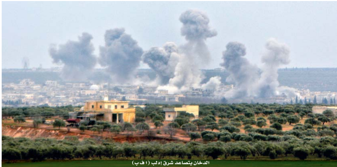
الدخان يتصاعد شرق إدلب