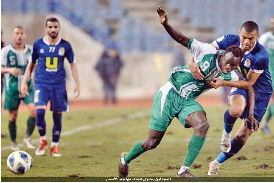
العجاليين يحاول إيقاف مهاجم الأنصار

قبل انصاف زمن الشوط الاول. هدأت الامور بعد هدف التعادل، وانحصر اللعب وسط الميدان، بعد ان اعتمد الفريقين على الكرات الطويلة الغير دقيقة، وعندما كان الشوط الاول يتجه للتعادل، كان للفريق المضيف رأي اخر، حيث تمكن من تسجيل هدفه الثاني.