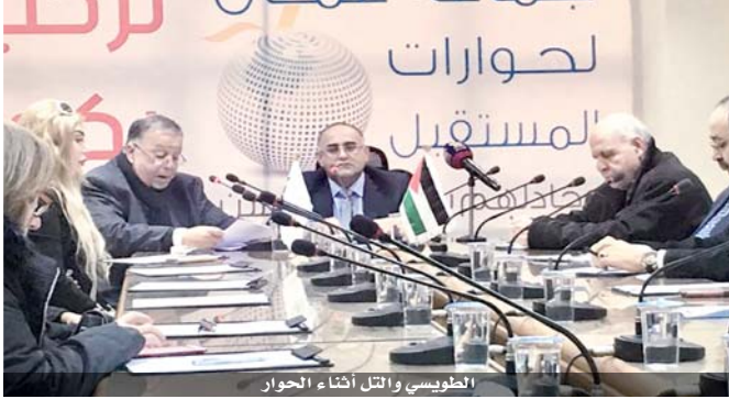
الطويسى والتل أثناء الحواوير

يلقي الباحث والمحلل الاستراتيجي عمر رداد، عند السادسة من مساء اليوم الثلاثاء، في «ملتی الثلاثاء»، بيت الثقافة والفنون جبل الحسين، محاضرة بعنوان: دراسة في سيميائية الصورة في الخطاب الإعلامي للتطبيقات الإرهابية. تقيم مديرية ثقافة الطفل التابعة لوزارة الثقافة بالتعاون مع مجمع اللغة العربية، يوم السبت المقبل، في مقر المجمع، نشاطا تفاعليا للأطفال احتفاء باليوم العالمي للغة الأم. يتضمن فترة حوارات ومسابقات ثقافية وتوزيع أعداد من مجلة وسام، ويبدأ النشاط عند الساعة ١١ والنصف صباحا ويستمر حتى ١٢ والنصف ظهرا.