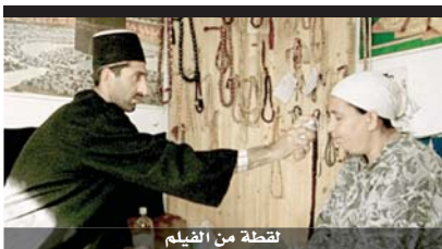
لقطة من الفيلم