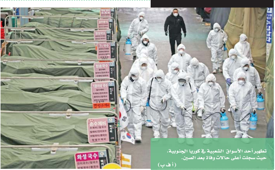
تحضير أحد الأسواق الشعبية في كوريا الجنوبية، حيث سجلت أعلى حالات وفاة بعد الصين. (أ ب)