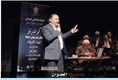
«كونشرتو فنانون الرواد» في «الثقافة الملكي».. اليوم