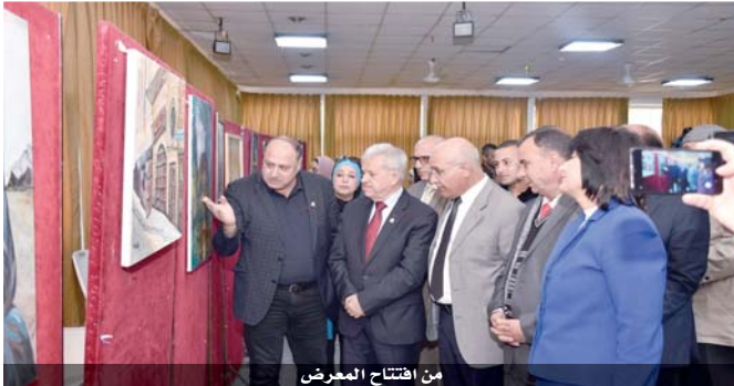
من افتتاح المعرض

في رصد عين الفنان لكثير من المحطات التراثية والأثرية، شكّل المعرض الذي افتتح صباح أمس الأول، بتنظيم عمادة شؤون الطلبة في جامعة اليرموك، مرآة تاريخية لهوية الأردن وعمقها الحضاري، بمشاركة ٣٥ لوحة فنية عبرت عن المواقع الأثرية والمناظر الطبيعية الخلابة في الأردن والعالم العربي، والعادات والتقاليد العربية الأصيلة. المعرض هو الأول من سلسلة معارض تحاكي نفس الموضوع، بحثاً عن استرجاع الأماكن الأثرية وموروثاتها إلى القاعات الفنية لتكون في متناول عين الجمهور، وهو محاولة أولى للوقوف على النمط الفني الذي يسائر هذا الإرث الكبير، فيما ستتبعه محاولات راصدة للوقوف على المكان الأثري بشكل موسع لرسم بانوراما كاملة من خلال زيارة الفنانين للمواقع وعمل ورشات فنية. رصد المعرض الأول الذي شارك في لوحاته