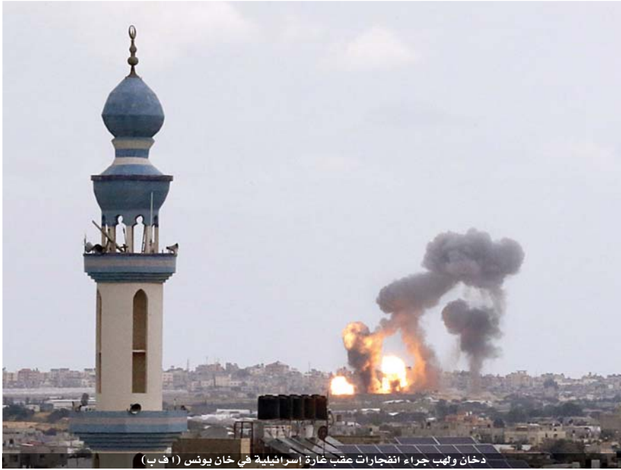
دخان وهبج جراء انفجارات عقب غارة إسرائيلية في خان يونس