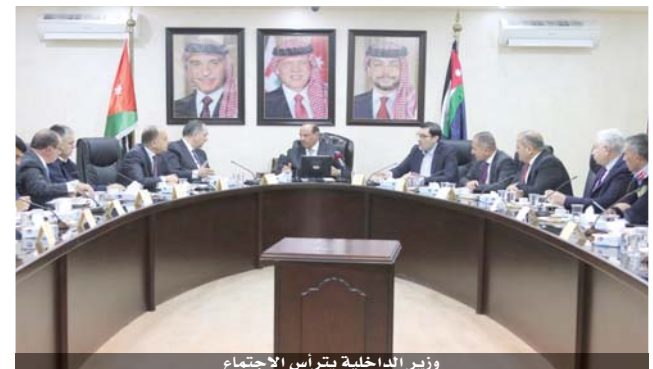
وزير الداخلية يترأس الاجتماع

عمان - يترا قال وزير الداخلية سلامة حماد خلال اجتماع لمناقشة العمر التشغيلي لوسائل النقل العام بحضور المعنيين أن العمر التشغيلي لوسائل النقل العام يكتسب أهمية خاصة، نظراً لأرتباطه المباشر بحياة المواطن وسائقي الحافلات وجميع شرائح المجتمع، ولذلك لا بد من التوصل إلى اتفاق يحقق متطلبات السلامة العامة من جهة ويحفظ حقوق ومصالح مشغلي الحافلات من جهة أخرى. وذلك في غضون ثلاثة أسابيع.