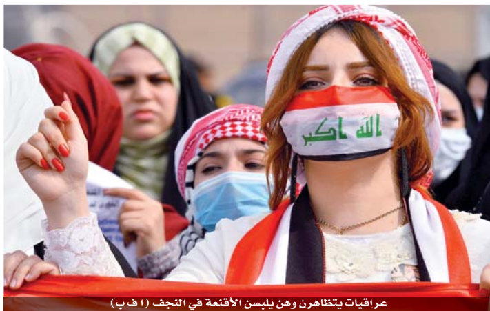
عراقيات يتظاهرن وهن يلبسن الأقمعة في النجف

أعلن مجلس النواب العراقي امس أنه سيعقد جلسة التصويت على منح الثقة لحكومة رئيس الوزراء المكلف محمد علاوي الخميس المقبل، فيما حضر وزير الخارجية الأميركي مايك بومبيو في اتصال هاتفي مع علاوي على حماية الجنود الأميركيين وتلبية مطالب المحتجين العراقيين الذين يتظاهرون منذ أشهر. وفيما يشهد العراق أزمة سياسية تتعلق بتشكيل حكومة جديدة، هدد مقتدى الصدر بتنظيم احتجاجات عند المنطقة الخضراء حيث مقر الحكومة ومجلس النواب في حال عدم منح الثقة للحكومة هذا الاسبوع.