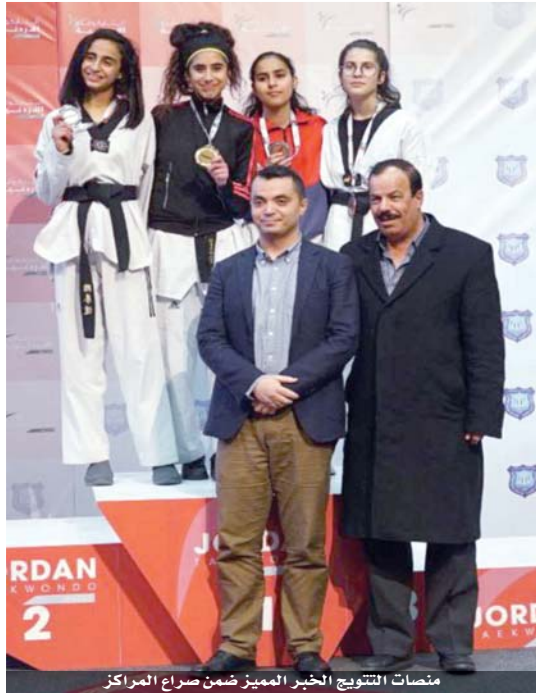
منصات التتويج الخبير المميز ضمن صراع المراكز

قدم دوري الفئات العمرية للتايكواندو الذي اختتم بقاعة الأرينا في جامعة عمان الأهلية الكثير من الفوائد والمكتسبات بحسب ما أكدته الكوادر التدريبية للجهات المشاركة. ومع ختام الجزء الأول من محطة اللعبة التي تصنيفها منجم الذهب، نجح اتحاد التايكواندو في مواصلة ترجمة الخطة المرسومة في السنوات الأخيرة من خلال تدعيم بطولات الكبار وإقامة مثلها للصغار، حيث أن الهدف الرئيسي الأساسي عدم حدوث فراغ في الأعمار وبمعنى أدق كلما اعتزل لاعب أو لاعبة يكون البديل جاهزاً لبداة المواصفات. منتهيات التايكواندو لم تمنع اتحاد اللعبة في رسم السياسة المطلوبة من الألف إلى الياء وفق ترجمة على أرض الواقع، ولعل الهدف الواضح المعالم أيضاً وقف الفجوة بين الأعمار السنوية لتبقى اللعبة مستمرة. دوري الفئات العمرية بفئاته الأشبال والناشئين والشباب جاء في الوقت المناسب وعلى الموعد، إذ أن عام ٢٠٢٠ الحالي يتطلب تواجد كوكبة متنوعة سواء على صعيد الذكور أو الإناث، وما امتازت به المسابقات الأخيرة للتايكواندو التنوع في المحطات والأماكن، فبعد أن كانت المواجهات تقام في مدينة الحسين للشباب، نقلت الجزيئات للجامعات ورصد من المدارس وحراكاً داخل