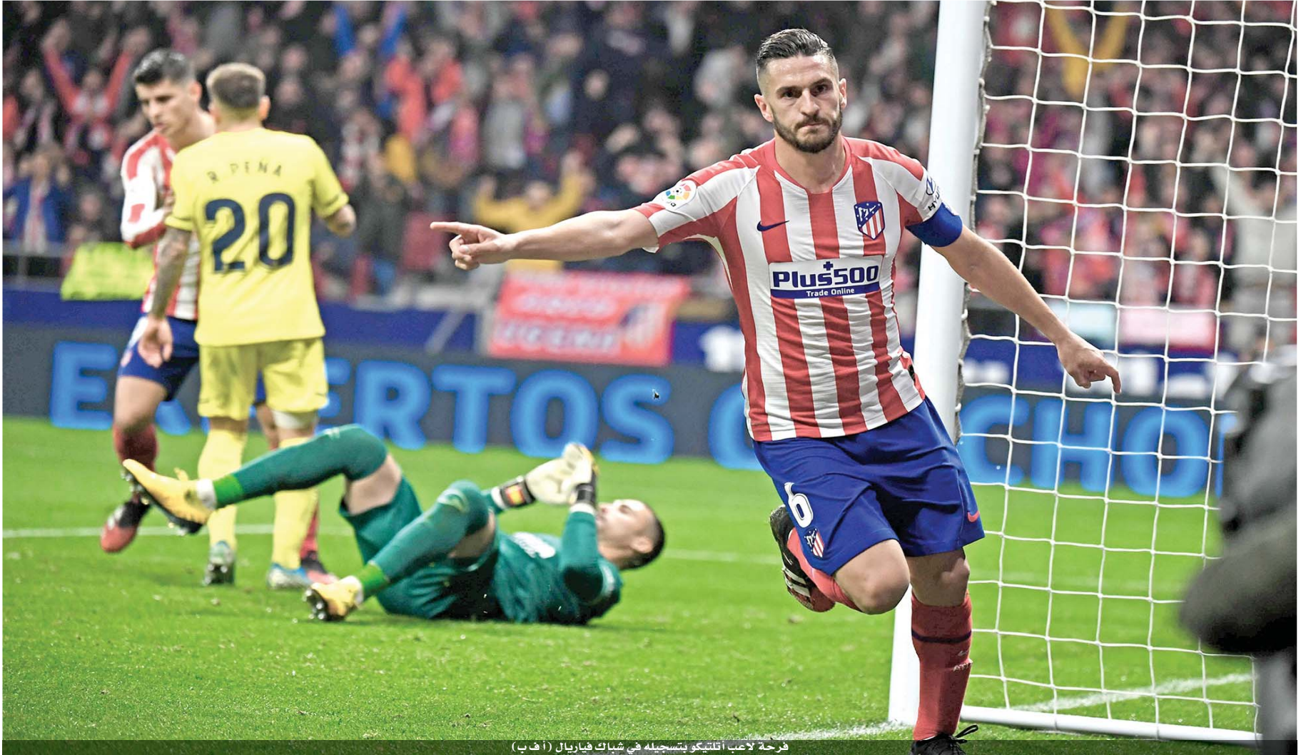
فرحة لاعب أتلتيكو بتسجيله في شباك فياريال

التعادل عن طريق المدافع البرازيلي بابلو كاسترو في الوقت بدل الضائع. وفي الشوط الثاني منح ماركينوس التقدم مجدداً عندما تابع كرة من مسافة قريبة داخل الشباك (٦٣)، قبل ان يضيف كيليان مبابي الرابع رافعا رصيده الى ١٦ هدفاً هذا الموسم ليتساوى في صدارة ترتيب الهدافين مع مهاجم موناكو وزميله في المنتخب الفرنسي وسام بن يدر. وقصص بورودو الشارق عن طريق الاسباني روبين باردو بتسديدة صاروخية من خارج المنطقة سكتت الزاوية العليا لمرمى سان جرمان (٨٣).