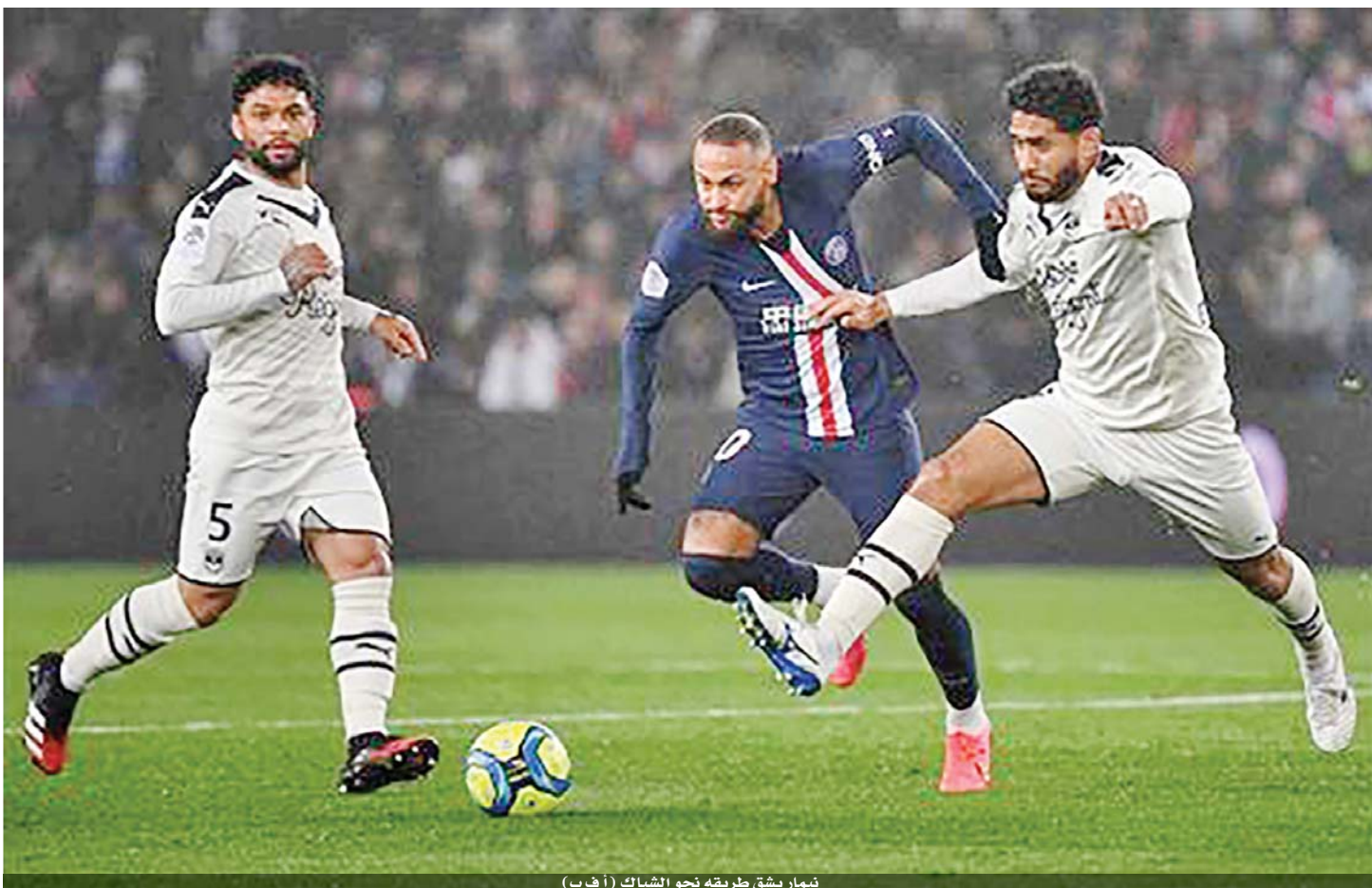
نيمار يشق طريقه نحو الشباك

ودخل خيتافي الى المباراة منتشياً بفوز بنتيجة ٢-٠ على ضيفه اياكس امستردام الهولندي، الذي بلغ نصف نهائي دوري ابطال أوروبا الموسم الماضي، في ذهاب الدور الـ ٢٢ من الدوري الاوروبي «يوروبا، ليج»، فيما خرج اشبيلية بتعادل ١-١ من ارض كلوج الروماني.