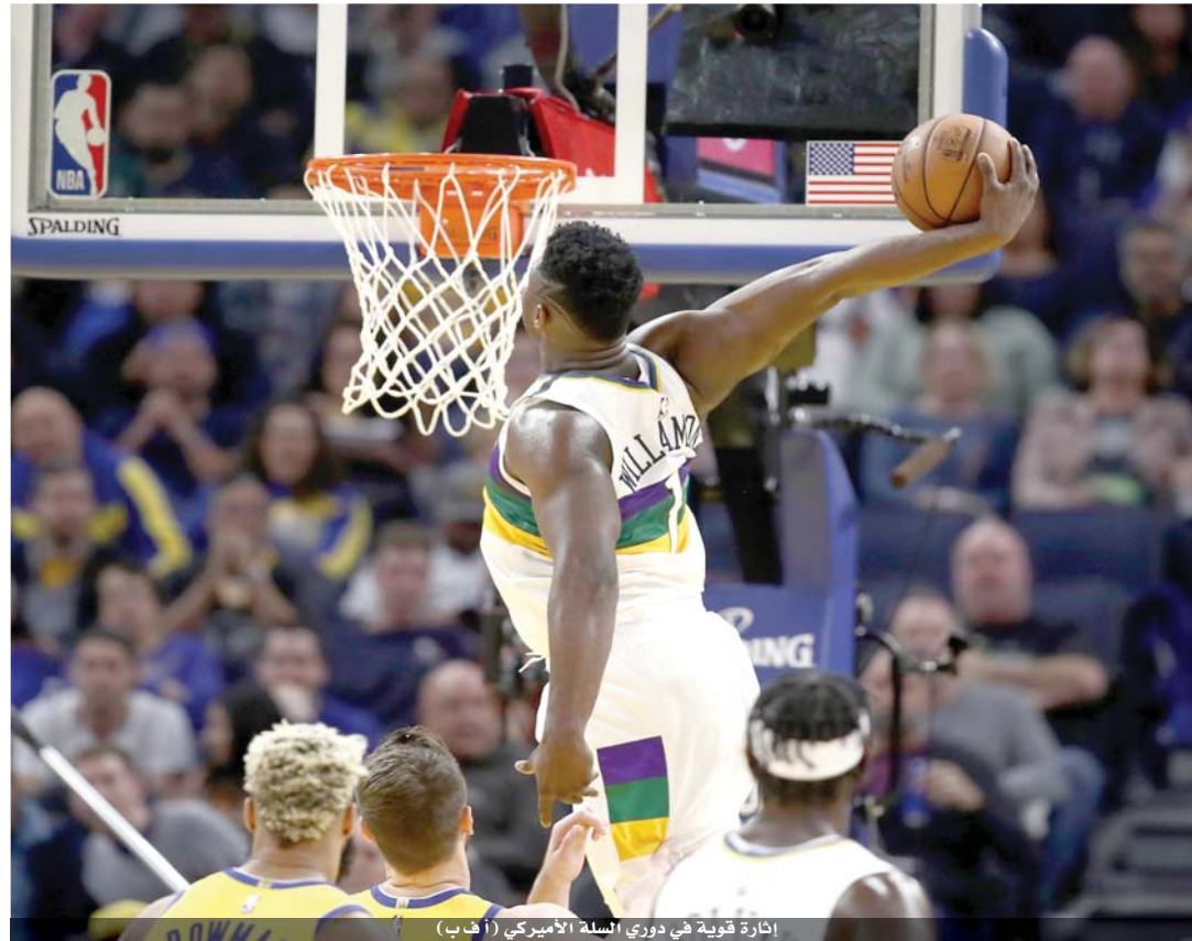
إثارة قوية في دوري السلة الأميركي

وهو الفوز التاسع على التوالي لتوروبتو على أرضه