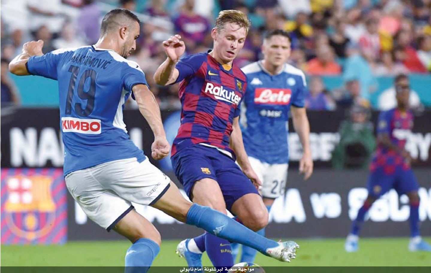
مواجهة صعبة لبرشلونة أمام نابولي