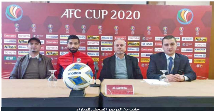
جانب من المؤتمر الصحفي للمباراة

القادسية الكويتي ومضيفه ظفار العماني إلى الانفراد بصدارة المجموعة عندما يلتقيان اليوم في الكويت. ويبدو القادسية الأقرب لتحقيق الانتصار الثاني والانفراد بالصدارة نظراً لما يقدمه من مستويات ونتائج في الفترة الأخيرة، حيث لم يخسر الفريق أي مباراة رسمية ضمن المسابقات المحلية والخارجية هذا الموسم مع الأخذ بالاعتبار أن خروجه من كأس ولي عهد الكويت أمام العربي جاءت بركلات الترجيح بعد التعادل في الوقتين الأصلي والاضافي. في الجهة المقابلة، لا يتوقع أن يكون الفريق العماني صيدا سهلاً نظراً إلى ما يتمتع به من خبرة في المشاركات وما يضمنه من عناصر دولية معروفة بالإضافة إلى الأجنبي.