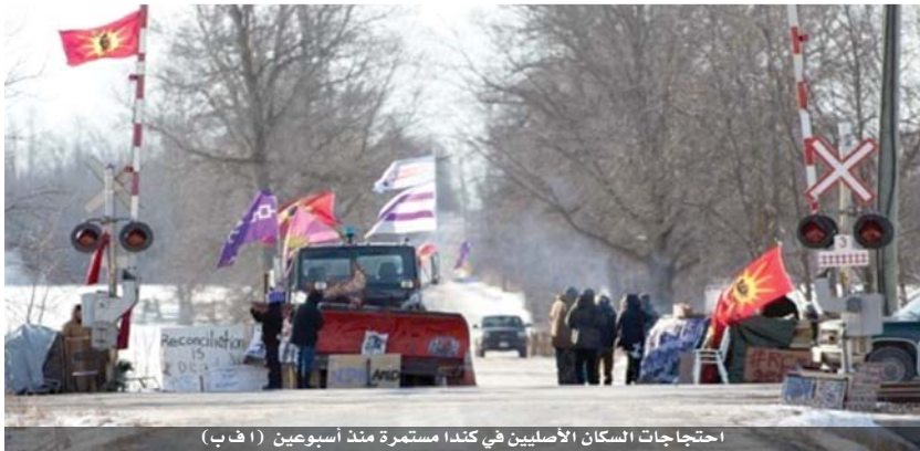
احتجاجات السكان الأصليين في كندا مستمرة منذ أسبوعين

التحرك الذي بدأته مجموعة من السكان الأصليين الذين يعارضون خط الأنابيب يجري يمكن إزالة الحواجز، وأضاف الوزير المسألة يمكن أن تستمر لفترة طويلة، لأن لها تداعيات كبيرة على الاقتصاد الكندي وببلا يمكن أن تؤثر على الناتج المحلي الإجمالي في حال استمرت.