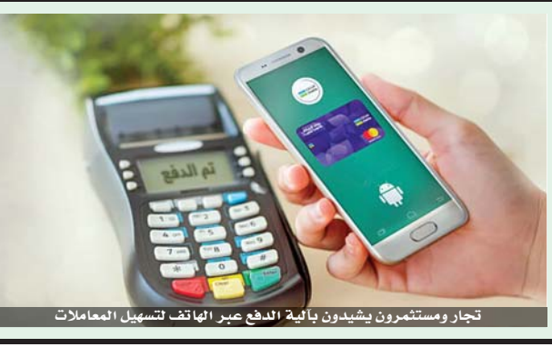
تجار ومستثمرون يشيدون بألية الدفع عبر الهاتف لتسهيل المعاملات الدولية في عمان

استمرت الدراسة التي تحمل اسم «تفسير تقنية الدفع عبر الهاتف النقال لخدمة الجميع: مراجعة لنظام الدفع عبر الهاتف النقال في الأردن، لمدة عام كامل، وبحث في الفرص التي يمكن أن تستفيد منها المملكة، التي تتمتع باقتصاد يعتمد بشكل أساسي على النقد، من الانتشار الواسع لتقنيات الدفع عبر الهاتف النقال، للمساعدة في دعم النشاط الاقتصادي وزيادة فرص العمل في نهاية المطاف. وتستند الدراسة إلى مقابلات أجريت مع تجار من مختلف الخلفيات والمناطق في الأردن، بدءاً من أصحاب الأعمال المنزلية من اللاجئين في المحافظات الريفية، ووصولاً إلى أصحاب المشاريع المتقدمة تكنولوجياً في فروع الشركات الدولية في عمان.