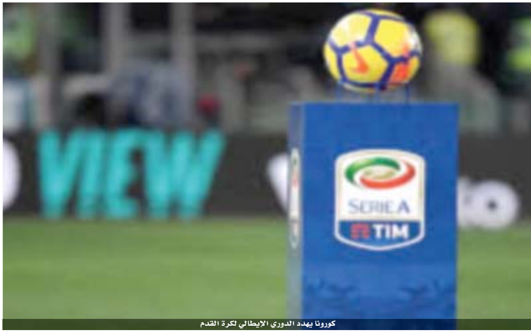
كورونا يهدد الدوري الإيطالي لكرة القدم

الآن من أصل ٧٧ ألف إصابة. وعزلت السلطات بلدات في شمال البلاد لاسيما في منطقة لومبارديا، في خطوة تطال عشرات الآلاف من السكان، خوفاً من تفشي الفيروس. وحضت منظمة الصحة العالمية أمس، على الاستعداد لوباء عالمي محتمل، في وقت دفع تسجيل إصابات ووفيات جديدة في أوروبا والشرق الأوسط وآسيا إلى جهود أكثر صرامة لتقييد لاحتواء الفيروس. وظهرت بؤر جديدة في الأيام الأخيرة، لاسيما في إيران وكوريا الجنوبية وإيطاليا.