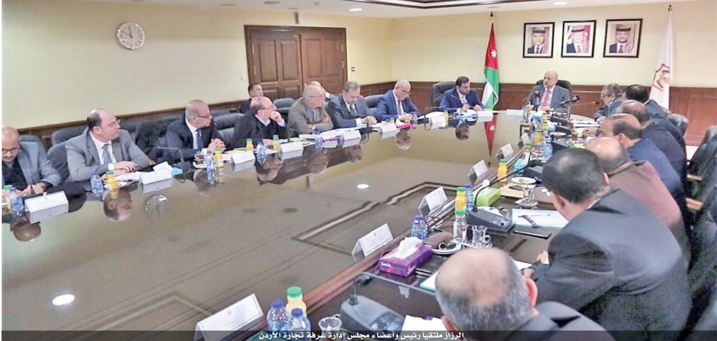
الرزاز ملتقياً رئيس وأعضاء مجلس إدارة غرفة تجارة الأردن