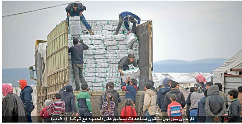
نازحون سوريون يتلقون مساعدات بمخيم على الحدود مع تركيا

عواصم - أ ف ب «من المهم كسر الحلقة المفرغة للعنف والمعاناة، محريباً عن قلقه مع اقتراب المعارك من مناطق ذات كثافة سكانية. بدوره أعرب الرئيس الروسي فلاديمير بوتين أمس في اتصال هاتفي مع نظيره التركي رجب طيب أردوغان عن قلقه بشأن «إساءة استعمال أسلحة» للمسلحين في إدلبي السورية، داعياً على صعيد آخر لتطبيق قرارات مؤتمر برلين في ليبيا. وأكد بيان للكرملين أن الرئيسين اتفقا خلال المحادثة الهاتفية على تعزيز