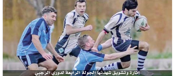
إثارة وتشويق شهدتها الجولة الرابعة لدوري الرجبي

عشاق الرياضة، الذين استمتعوا بالعرض القوي من اغلب الفئات المشاركة، وجاءت نتائج الجولة متنوعة وعلى النحو التالي: • فئة الرجال: سوروقفة (٢٢) قلعة عمان (٢٠)، التوماندر (٢٩) سارسنز (٢٦). • فئة تحت ٢٠ عاماً: قلعة عمان (١٧) التوماندر (١٧)، سوروقفة (٧) قلعة عمان (٠)، سوروقفة (١٧) التوماندر (١٢). • فئة السيدات: قلعة عمان (٢٩) التوماندر (٠)، قلعة عمان (٣٥) سوروقفة (٠)، التوماندر (١٢) سوروقفة (٥).