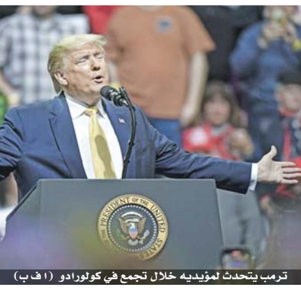
ترمب يتحدث لمؤيديه خلال تجمع في كولورادو

وكتب ترمب على تويتر، هناك حملة تضليل أخرى يطلقها الديمقراطيون في الكونغرس قائلين إن روسيا تفضلتني على أي مرشح لا يجعل شيئاً من الديموقراطيين الذين ما زالوا غير قادرين، بعد أسبوعين، على فرز أصواتهم في أيوا». «الخدعة رقم ١٧». وأعرب المشرعون الديمقراطيون عن قلقهم مجدداً بعد استماعهم في جلسة مغلقة إلى جوزيف ماغواير، مدير الاستخبارات الوطنية السابق، الذي حذر من أن روسيا تتدخل مجدداً أملاً في تعزيز فرص ترمب في الانتخابات. وذكرت صحيفة نيويورك تايمز أن ترمب ويخ ماغواير الذي أقاله هذا الأسبوع، بسبب إحاطته. وجر ترمب في وقت سابق عن غضبه إزاء تقييم أصدرته أجهزة الاستخبارات يؤكد ان روسيا تدخلت في انتخابات عام ٢٠١٦، بما في ذلك من خلال التلاعب بوسائل التواصل الاجتماعي، لدعم ترمب ضد منافسته هيلاري كلينتون. بدورها أدرجت موسكو اسم اتهامات مسؤولين في المخابرات الأمريكية بأنها تتدخل في حملة الانتخابات الرئاسية لعام ٢٠٢٠ بهدف المساهمة في إعادة انتخاب الرئيس دونالد ترمب، في خانة «البارانويا». وقال المتحدث باسم الكرملين دميتري بيسكوف إن «هذا لا صلة له بأي شكل بالحقيقة»، وتندد برسائل جديدة تتصف بالبارانويا ستزداد للأسف مع اقتراب موعد الانتخابات، في الولايات المتحدة.