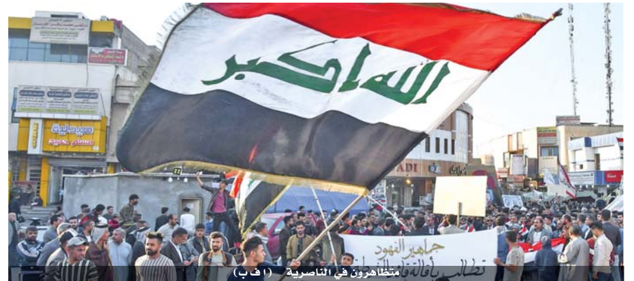
تظاهرة رافدة من المتظاهرين في الناصرية

«وزارة النفط بـ ١٠ مليار (حوالي ٨,٤ ملايين دولار)، من يشتري؟»، وقامت السلطة القضائية بالتحقيق مع الصمديعي، وتسعى لرفع الحصانة عن الصيادي بهدف التحقيق معه في المزاعم التي ذكرها. وكانت حكومة عادل عبد المهدي استقلت على وقع التظاهرات التي تطالب منذ بدايتها في الأول من تشرين الأول الماضي بالتغيير في بلد خسر في ١٧ سنة نحو ٤٥٠ مليار دولار بسبب الفساد المستشري، وفقاً للبرلمان، أي بمعدل ٢٥ مليار دولار سنوياً. ويؤكد علاوي أن حكومته ستكون مستقلة بشكل كامل، لكن القوى السياسية لا تزال تطمح بالهيمنة على المناصب التي تدر عليها المال كجزء من موروث اعتادت عليه منذ تغيير النظام في ٢٠٠٣. ويحسب المحلل السياسي هشام الهاشمي، فإن السياسيين يتبعون التكتيكات ذاتها للسيطرة على المناصب على الرغم من التحركات الشعبية. وشرح أن «مسامرة هذه المملكات هم من فنتين»، الأولى مكونة من نواب وشخصيات قريبة من سياسيين معروفين بفسادهم، تقوم بنقل «السيرة الذاتية إلى الفريق المقرب من المسؤول مقابل مبالغ يتفق عليها بين الطامع بالمنصب والمسار». أما الفئة الثانية، فهي «قادة بعض الكتل (النيابية) وهم معروف عنهم بيع الوزارات بأحدى طريقتين، إما مرة واحدة مقابل مبلغ مقطوع، أو يبيع على أربع دفعات، أي دفعة عن كل سنة في الوزارة». ويعقد هذا الأمر المفاوضات حول تشكيل حكومة علاوي، حيث أن الوزير أو الحزب