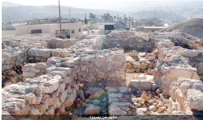
مشهد من بصيرا