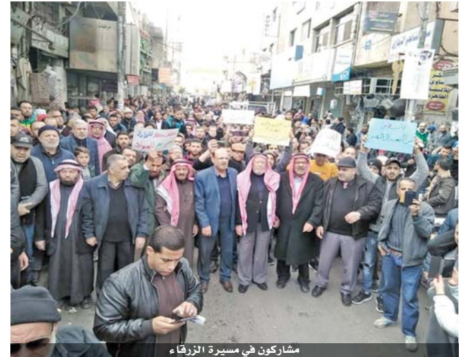
مشاركون في مسيرة الزرقاء

بعرض الحائظ قرارات الشرعية الدولية ذات الصلة فضلاً عن تناقضها مع المبادرة العربية للسلام. وأشاد المشاركون في المسيرة بمواقف الأردن الداعمة للقضية الفلسطينية