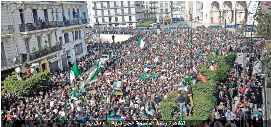
تظاهرة وسط العاصمة الجزائرية

وقالت الباحثة في مركز كارنيغي للشرق الأوسط في بيروت، داليا غانم، «لقد عاد الجنود إلى تكاثفهم، والديمقراطيون في السلطة، وبالتالي هناك وجهة دستورية وديمقراطية ولكن في الواقع هذا هو بالضبط ما كانت نية الأمور عليه من قبل. تبون ليس سوى الوجهة المدنية للنظام الذي يتحكم فيه العسكري». وتابعت «إن قدرة النظام على التبدل دون تغيير وسيتم اختيار صموده في السنوات القادمة». وفي جميع الأحوال فإن الحراك الجزائري، نجح في تغيير اللعبة السياسية في الجزائر، بعد ٢٠ عاماً من رئاسة بوتفليقة، شهدت خلالها إغلاقاً محكماً، وتم إحباط المعارضة الحقيقية بشكل ممنهج أو عرقلتها، أو تكميمها. واعتبرت غانم أن الحراك وحّد الجزائريين الذين تجاوزوا اختلافاتهم الثقافية واللغوية والدينية، وأعلن ظهور «جيل جديد على درجة عالية من التنسيب ويعرف ما يريد». كما نجح الحراك بسلميته في تفادي «مواجهة دموية أو قمع وحشي»، كما أشارت المؤرخة كريمة ديريش، مديرة البحوث في المركز الوطني للبحث العلمي في فرنسا. وستسمح هذه السنة الثانية، كما قالت كريمة ديريش، للجزائريين بشكل جماعي في تحديد ما يريدونه بخصوص حاضرهم ومستقبلهم. وسيستغرق ذلك الوقت اللازم، وأضافت أن البعض «يريدون رؤية الأمور تسير بشكل أسرع وأسرع بكثير، لكنني اعتقد أن هذه التوتيرة مناسبة جداً لهذه الحركة الاحتجاجية غير المسبوقة».