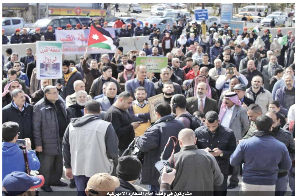
مشاركون في وقفة أمام السفارة الأميركية

وفي الزرقاء، انطلقت مسيرة حاشدة بعد صلاة ظهر أمس الجمعة من أمام مسجد عمر بن الخطاب، وسط المدينة، شاركت