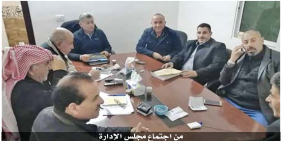
من اجتماع مجلس الإدارة

بالمراكز الأولى، لافتاً الى ان كل جولة تتكون من خمسة اشواط تنافسية، مبيناً بأن عدد المسجلين في اولى الجولات تجاوز الـ ٢٥ فارساً، ونفذت الى ان النادي وجه رفاق الدعوة لشخصيات رسمية ورياضية لحضور فعاليات المهرجان الذي يشتمل على فقرات فنية ويقام الشهر المقبل.