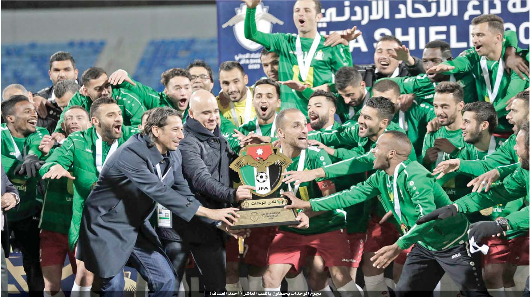
نجوم الوحدات يحتفلون باللقب العاشر (أحمد العساف)