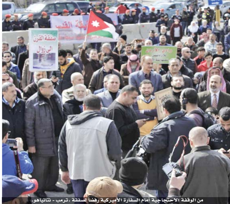
من الوقفة الاحتجاجية أمام السفارة الأميركية رفضاً لصفقة «ترمب - نتانياهو»