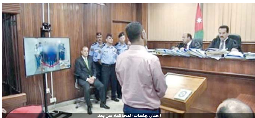
احدى جلسات المحاكمة عن بعد

تم تنفيذها حاليا، والتي مكنت المحامي والمواطن وحتى القاضي من مخاطبة المحاكم والوزارة والاستفسار عن اي دعوى عبر الخلو ما خلق ارتياحا عاما وثقة في اجراءات التقاضي.