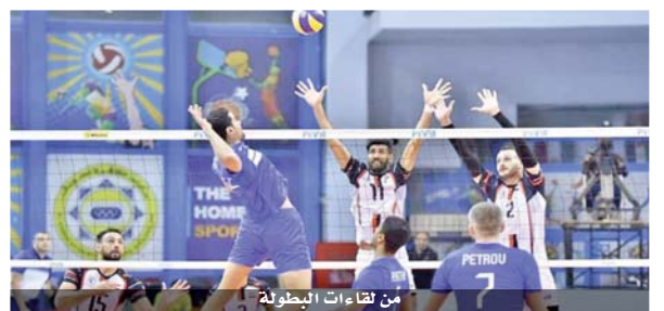
من لقاءات البطولة