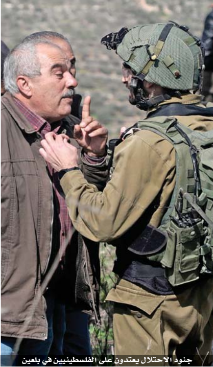
جنود الاحتلال يعتدون على الفلسطينيين في بعين