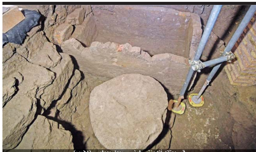
قبر يعتقد أنه ينتمي لمؤسس روما رومولوس (أ ف ب)

عواصم - أ ف ب «من المهم كسر الحلقة المفرغة للعنف والمعاناة، محريباً عن قلقه مع اقتراب المعارك من مناطق ذات كثافة سكانية. بدوره أعرب الرئيس الروسي فلاديمير بوتين أمس في اتصال هاتفي مع نظيره التركي رجب طيب أردوغان عن قلقه بشأن «إساءة استعمال أسلحة» للمسلحين في إدلبي السورية، داعياً على صعيد آخر لتطبيق قرارات مؤتمر برلين في ليبيا. وأكد بيان للكرملين أن الرئيسين اتفقا خلال المحادثة الهاتفية على تعزيز