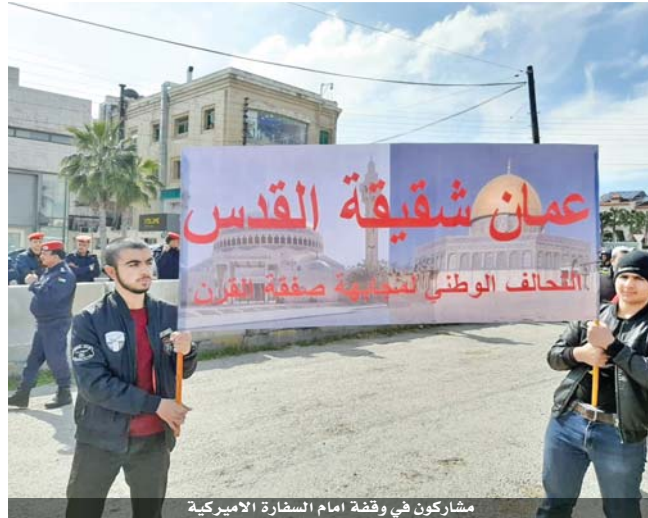
مشاركون في وقفة أمام السفارة الأميركية

وتناول النائب حسني الشياح اتفاق تعزيز التعاون والتنمية بين دول المتوسط، وهو ما يتطلب وضع استراتيجية واضحة، تعنى بمشاريع التنمية ووقف سباق التسلسل الذي أضر كثيراً بالمنطقة. واختتمت في العاصمة اليونانية أثينا أعمال الدورة الرابعة عشر، متضمنة مجموعة من التوصيات ومشاريع قرارات صادرة عن لجنتها الدائمة، كان على رأسها دعم خيار الدولتين والتوصل لتسوية سياسية في ليبيا.