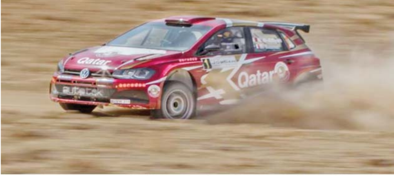
عمان - الرأي

يستضيف الأردن عام ٢٠٢٠ المقبل نشاطين مهمين في رياضة السيارات؛ الأول باها الأردن-كأس العالم للكروس كاوتري، والثاني رالي الأردن للشرق الأوسط. وكشف الاتحاد الدولي للسيارات وفيا، عن روزنامة بطولة كأس العالم للكروس والتي تضم ٨ سباقات؛ يستضيف الأردن منها الجولة الثالثة للمرة الثانية وخلال الفترة من ١٦-١٨ نيسان المقبل.