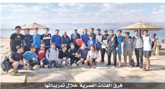
فرق الفئات العمرية خلال تدريباتها