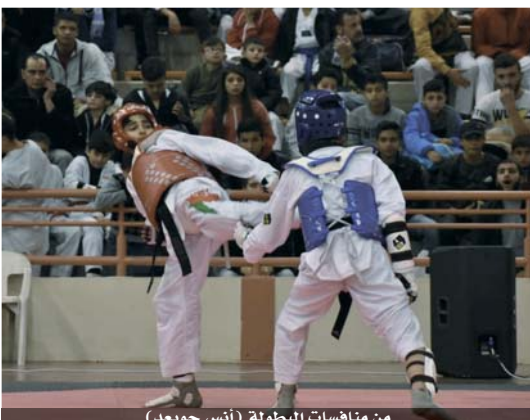
من منافسات البطولة