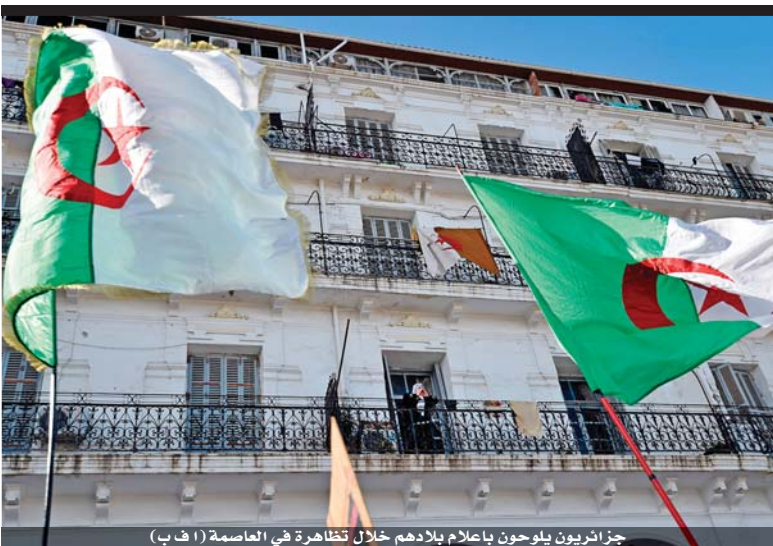
جزائريون يلوحون بأعلام بلادهم خلال تظاهرة في العاصمة

على مدى التاريخ منذ بدء الخليقة والإنسان يعتمد على الإنسان في تأمين مستزمات البقاء، تطور هذا السلوك بتطور الزمن وحاجات الحياة وصارت له مفاهيم جديدة تعرف الآن بالمصالح العليا للدول. المصالح هذه هي التي تحكم العلاقات بين الدول والشعوب في الوقت الحاضر ولكي تكون هذه المصالح مؤمنة وغير مهددة تحتاج إلى القوة، والقوة لا تكفل بعدم الإضرار بمصالح الدول فحسب بل تفري من يمتلكها بالاستيلاء على حقوق الآخرين وهو ما يعرف بأطماع الدول القوية بثروات الدول الضعيفة. العرب أمة مطموع في ثرواتها وخيراتها منذ أزيد من أربعة قرون، فقد تناوبت على استعمارنا ونهب خيرات بلادنا أمة شتى ساعد على دوام هذا الحال قترقنا وانقساماتنا وعدم تعلمنا من الأخطاء، فحنن أمة تجيد البلاغة وتخطئ في قراءة البلاغ وتعرف العبر ولا تعتبر. بلاد العرب شاسعة واسعة تتربع على أهم المواقع الاستراتيجية في آسيا وأفريقيا وبناء العروبة يمدون أرجلهم على شواطئ البحار ومياه القنوات والمضائق وينظرون باسترخاء تام إلى السفن التي تحمل البضائع إلى دول العالم وهي تمر من أمامهم دون أن يحرك المشهد أي تفكير لديهم أو إجراء مقارنة بين تعاملهم السهل واستجاباتهم المجانية للدول التي تحتاجهم وبين الشروط القاسية والاثمان الباهظة التي تطالبهم وتفرضا هذه الدول عندما يلجأون إليها في أي أمر سواء ما يلزمهم