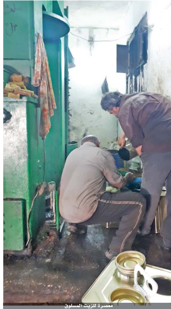
معمصرة للزيت المسلوقة