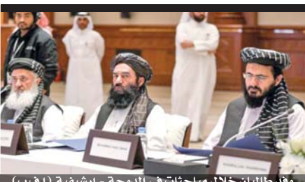
وفد طلابي خلال مباحثات في الدوحة - ارشيفية (أ ف ب)

ليكن رفع الرواتب عادلاً، يجب أن يكون على طريقة الهرم المغلوب تصل الفائدة إلى مليون عامل.