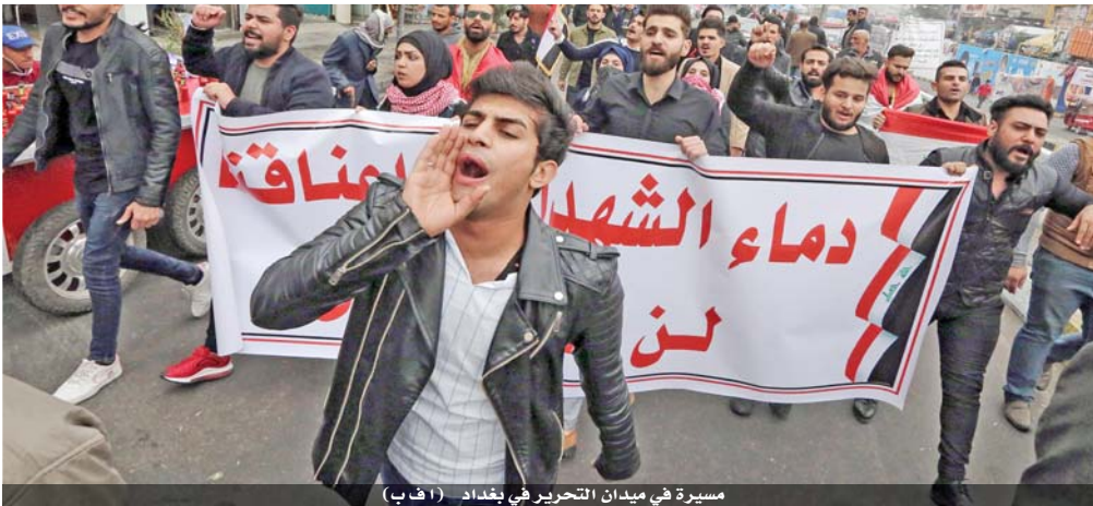
مسيرة في ميدان التحرير في بغداد (أ ف ب)

ويحول الظلام، اسرب متظاهرين خشيتهم ازاء عودة العنف قائلان ان «قوات الامن اغلقت الشوارع المؤدية الى ساحة التحرير ولا يستطيع