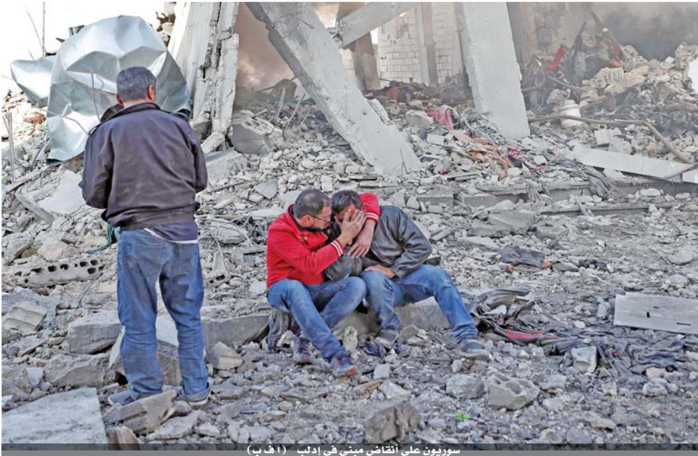
سوريون على أنقاض مبنى في إدلب

ونهاية نيسان، بدأت قوات القوات السورية بدعم روسي عملية عسكرية سيطرت خلالها على مناطق عدة في ريف إدلب الجنوبي وريف حماة الشمالي