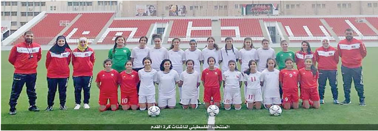
المنتخب الفلسطيني للناشئات كرة القدم

وتقديمها لأداء لافت يليق بجهود اتحاد غرب آسيا المشكورة في تطوير اللعبة. وستنافس المنتخبات المشاركة في البطولة ضمن مجموعة واحدة ووفق نظام الدوري من مرحلة واحدة، وبحيث يتوج باللقب الفريق الحاصل على أعلى عدد نقاط في الترتيب النهائي. وستقابل المنتخب الفلسطيني واللبناني في المباراة الافتتاحية عند الثالثة عصراً بتوقيت الأردن، يوم ١٢ كانون الأول الجاري، فيما ستجمع المباراة الثانية عند السادسة مساءً والأردن عند السادسة مساءً، وعلى يخصص الشهر ذاته المنتخبين الوطني والسوري. وفي ١٤ الشهر ذاته يلتقي «السوري» نظيره الفلسطيني عند الثالثة عصراً، ثم لبنان والأردن عند السادسة مساءً، وعلى يخصص يوم ١٥ للراحة كذلك، لتختتم البطولة بعد ذلك يوم ١٦ بمواجهتين: الأولى بين لبنان وسوريا عند الثالثة عصراً، والثانية بين الأردن وفلسطين عند السادسة مساءً.