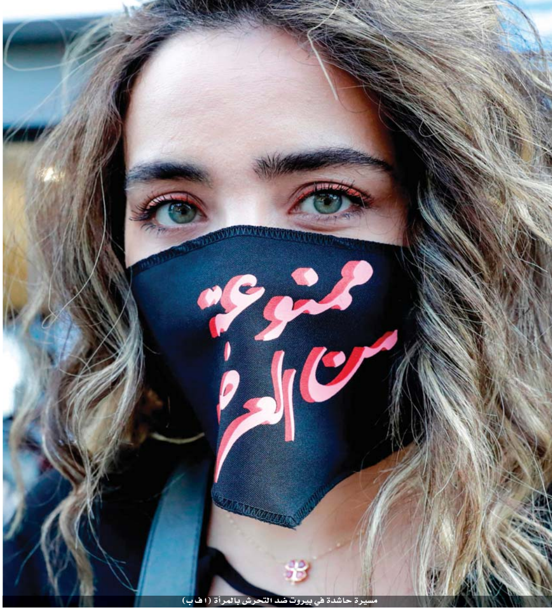
مسيرة حاشدة في بيروت ضد التحرش بالمرأة