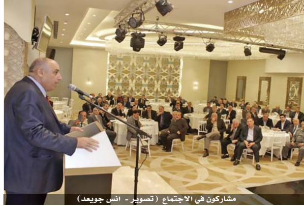
مشركون في الاجتماع

وعرض عدد من المتحدثين لمبادئ واهداف وقيم ورؤية واهداف الميثاق المزمع اطلاقه بعد اكتمال جلسات التشاور بشأنه في بقية محافظات المملكة. وقال النائب مازن القاضي ان الهدف الرئيس من الميثاق هو الدفاع عن المصالح العليا للدولة الاردنية وشوابتها والحفاظ على نسيج الوطن ووحدته وتشكيل ضمير جمعي تحكمه وتغلب عليه الصفات والمواصفات البعيدة عن كل الشبهات واشكال الفساد والوانه والدفاع عن قضايا الوطن والمواطن العادلة والمحقة والمشروعة وتشكيل جبهة قوية بوجه الفساد والفاسدين والعابثين بمقدرات الوطن ومنجزاته في الوقت الذي يكون فيه الجميع شركاء بتحمل المسؤولية والتأثير في الحدث والفعل الذي يخدم الوطن ويقدم برامج اصلاحية ذات جدوى على الصعد كافة.