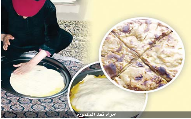
امراة تعد المكمورة