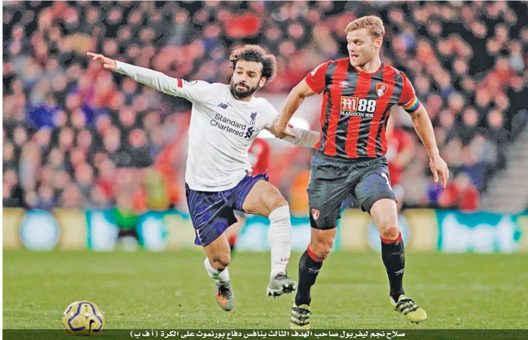
صلاح نجم ليفربول صاحب الهدف الثالث ينافس دفاع بورنموث على الكرة

واستعاد توتنهام بقيادة مدربه الجديد البرتغالي جوزيه مورينيو، توازنه بسرعة عقب الخسارة أمام مانشستر يونايتد (٢-١) في المرحلة الماضية، وفجر جام غضبه بضيئه بيرتلي بحماسية نظيفة حسما في الشوط الأول الذي شهد تسجيل ثلاثة أهداف.