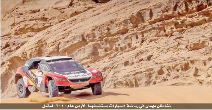
نشاطان مهمان في رياضة السيارات يستضيفهما الأردن عام ٢٠٢٠ المقبل

يستضيف الأردن عام ٢٠٢٠ المقبل نشاطين مهمين في رياضة السيارات؛ الأول باها الأردن-كأس العالم للكروس كاوتري، والثاني رالي الأردن للشرق الأوسط. وكشف الاتحاد الدولي للسيارات وفيا، عن روزنامة بطولة كأس العالم للكروس والتي تضم ٨ سباقات؛ يستضيف الأردن منها الجولة الثالثة للمرة الثانية وخلال الفترة من ١٦-١٨ نيسان المقبل.