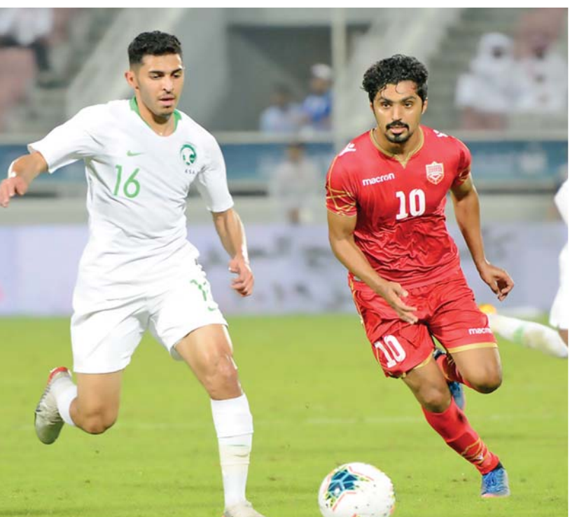
جانب من لقاء السعودية والبحرين في الدور الأول