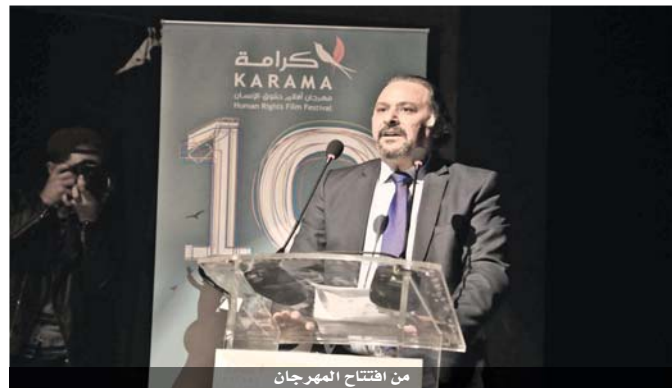
من افتتاح المهرجان

وأشارت إلى جائزة المهرجان لدعم الافلام تحمل اسم «جائزة أنهار الدولية»، وانطلقت عام ٢٠١٦