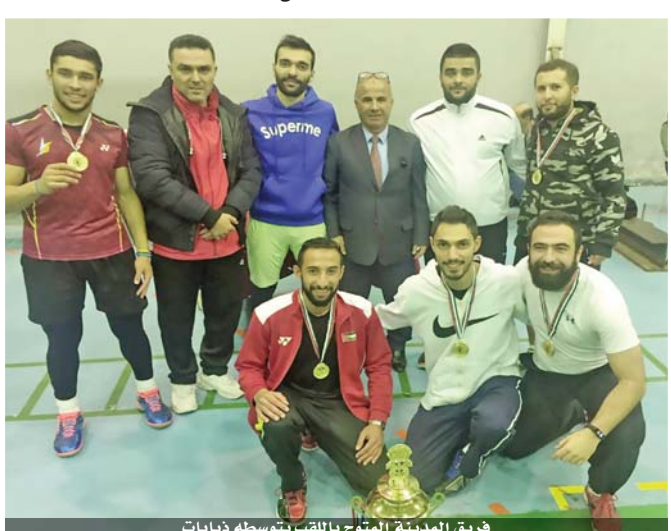
فريق المدينة المتوج باللقب يتوسطه ذيابات