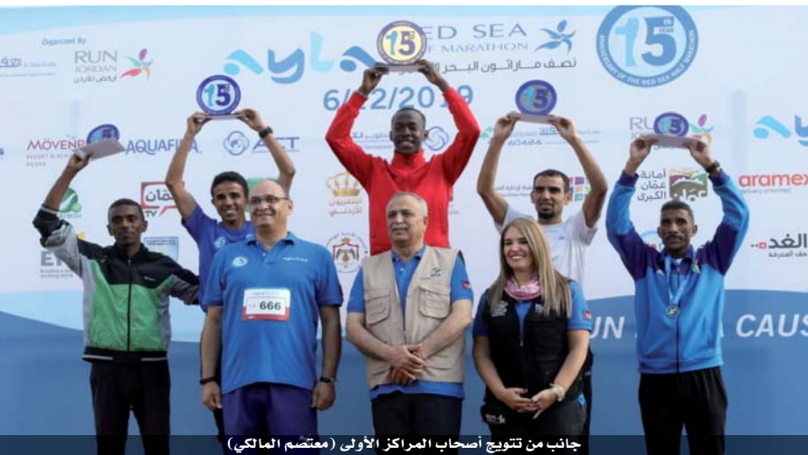
جانب من تتويج أصحاب المراكز الأولى (متمم المالك)

ثانية، والرغم السابق كان في نصف ماراتون عمان ساعة و٨ دقائق، لتسجل هذا الرقم كإنجاز جديد على صعيد رياضة (أم الألعاب الأردنية).