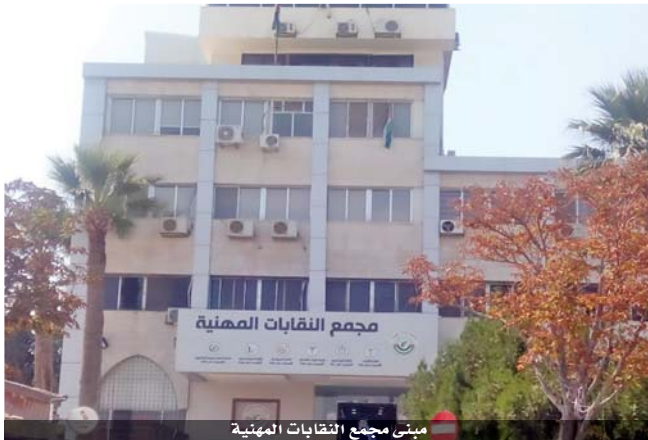
مبنى مجمع النقابات المهنية

وكان النقباء قد شكروا جلالة الملك والحكومة وديوان الخدمة المدنية على ماتم التوصل إليه من تفاهاتهم من شأنها ان تسهم في تحسين الوضع المعيشي لموظفي القطاع العام بين فيهم المهنيين، وخاصة ما يتعلق بالعلاوات التي أعلنت عنها الحكومة وتم رصد المبالغ المخصصة لها في