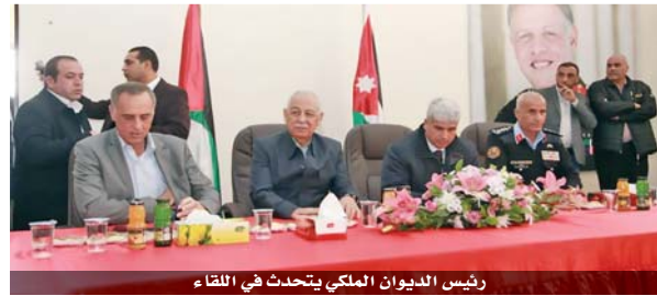
رئيس الديوان الملكي يتحدث في اللقاء

فرص عمل تسهم بالحد من الفقر والبطالة، وإنشاء المشاريع الإنتاجية المصدرة للدخل، وتحسين خدمات النقل، وإنشاء مراكز للتدريب المهني والحرفي بهدف توفير فرص التشغيل، والنهوض بواقع الجمعيات الخيرية والأندية الشبابية والرياضية والثقافية، ودعم الأفكار والمشاريع الريادية التي تسهم بتكسين المرأة والشباب اقتصاديا. كما دعوا إلى إنشاء وتأسيس مراكز لرعاية وتأهيل الأشخاص من ذوي الاحتياجات الخاصة، وإنشاء حدائق ومتنزهات عامة وملاعب رياضية، إلى جانب دعم المشاريع الزراعية والتشجيع عليها، والنهوض بالواقع البيئي، وتأهيل المدارس، وإقامة مدارس جديدة في التجمعات السكانية. وأكد العيسوي أن الدولة الأردنية واجهت العديد من التحديات التي تمكنت من تجاوزها، وواصلت مسيرة الإنجاز، واليوم نحن قادرون بحكمة قيادتنا الهاشمية الحكيمة ووعي الأردنيين وتحويلها إلى فرص حقيقية، لاستكمال مسيرة الإصلاح والتطوير، والنهوض بالوطن وخدمة المواطن، وبناء المستقبل الذي يليق بالجميع. وكان عدد من وجهاء وأبناء عشائر بئر السبع استعرضوا أبرز المطالب المتعلقة بتطوير خدمات الرعاية الصحية، وإيجاد