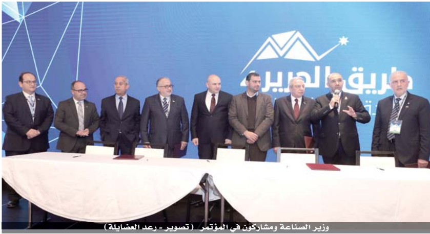
وزير الصناعة ومشاركين في المؤتمر