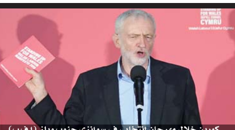
كورين خلال مهرجان انتخابي في سواتزي جنوب ويلز