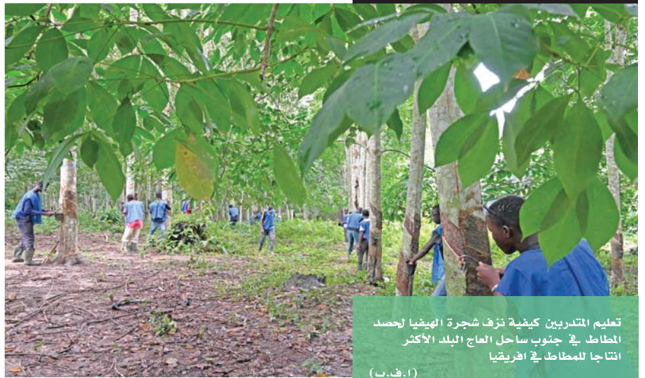
تعليم المتدربين كيفية ترف شجرة الهبضيا لحصد المطاط في جنوب ساحل العاج البلد الأكثر إنتاجا للمطاط في افريقيا