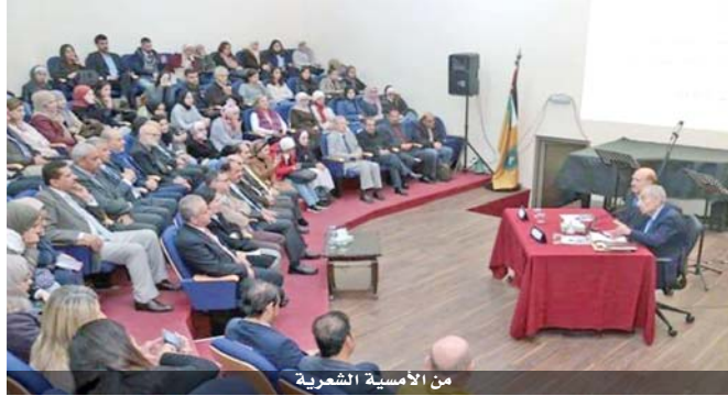
من الأمسية الشعرية