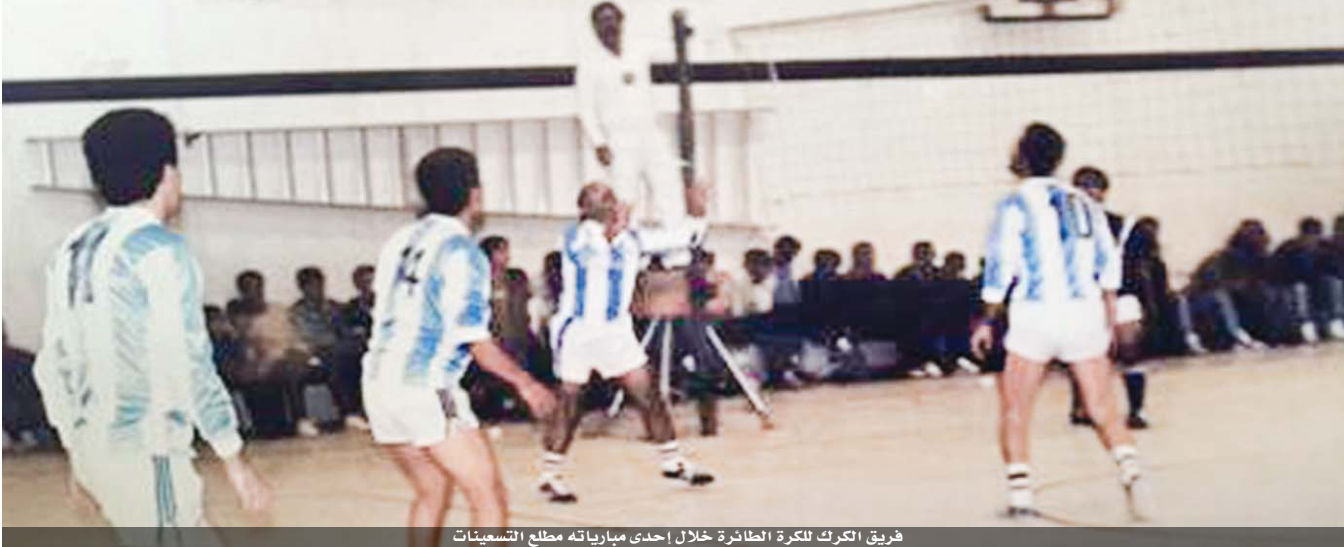
فريق الكرك لكرة الطائرة خلال إحدى مبارياته مطلع التسعينات