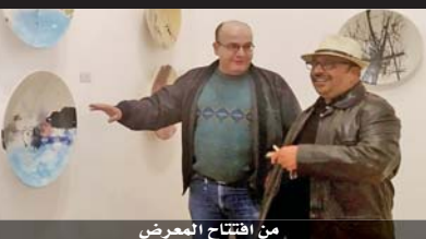
من افتتاح المعرض

وأشار إلى أن المهرجان مستمر حتى الثاني عشر من الشهر الحالي في المركز الثقافي الملكي في عمان، كما ستعطي العروض السينمائية عشر مدن ومحافظات أردنية تحت شعار، جيل كرامة إلى الامام»، كحدث سينمائي دولي يرفع راية قضايا حقوق الإنسان.