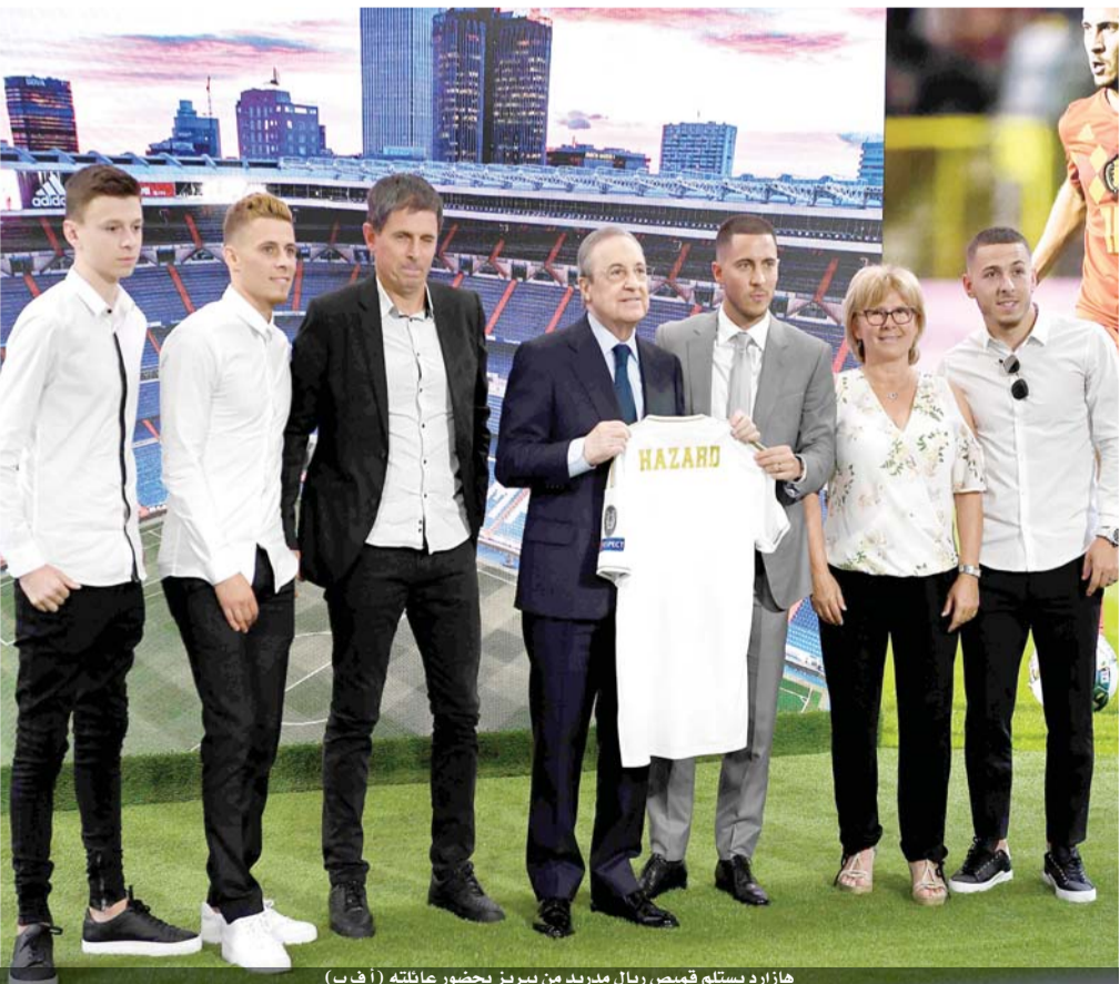
هازارد يستلم قميص ريال مدريد من بيريز بحضور عائلته

وشكر ريال مدريد بيانا جاء فيه «سينضم تاكيفوسا كوبو الى كاستيا الموسم المقبل». وتابع «انه واحد من ابرز اللاعبين الشبان الواعدين في عالم كرة القدم، لاعب خط وسط مهاجم مع تقنية ممتازة ورؤية عظيمة للعبة». وخاض كوبو، الملقب بـ «ميسي اليابان»، مباراته الدولية الأولى مع منتخب بلاده ضد سلطادور مطلع الشهر الحالي وانتهت بفوز منتخب «الساموراي» بهدفين نظيفين، وكان محط انظار العديد من تقنية الأوروبية امثال برشلونة الاسياني وباريس سان جرمان الفرنسي ومانشستر سيتي الانجليزي. واستحق كوبو لقبه بعد انضمامه الى اكااديمية برشلونة للشباب في سن العاشرة، ولكنه عاد الى اليابان عام ٢٠١٥ اثر العقوبات التي فرضها الاتحاد