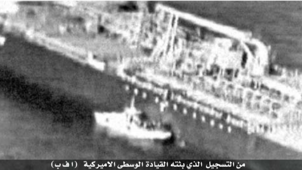
من التسجيل الذي بثته القيادة الوسطى الاميركية (ا ف ب)