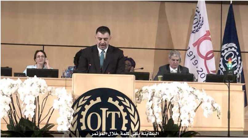
البطاينة ياتي كلمة خلال المؤتمر

فيها منظمة العمل الدولية بمساعدة الأردن في مواجهة التحديات الموهلة وغير المسبوقة نتيجة موجات اللجوء السوري. ورحب البطاينة بتقرير المدير العام عن وضع عمال الأراضي العربية المحتلة، ووافق على كافة التوصيات الختامية الواردة في التقرير، مؤكداً أن أفضل طريقة لتنفيذ هذه التوصيات هي من خلال سلام شامل ودائم يؤدي إلى حل الدولتين. وهنا البطاينة موظفي المنظمة السابقين والحاليين على جهودهم الدؤوبة لتحقيق العدالة الاجتماعية وتعزيز العمل اللائق في جميع أنحاء العالم بذكرى مرور مئة عام على تأسيسها متمنياً ان تحقق اهدافها المنشودة.