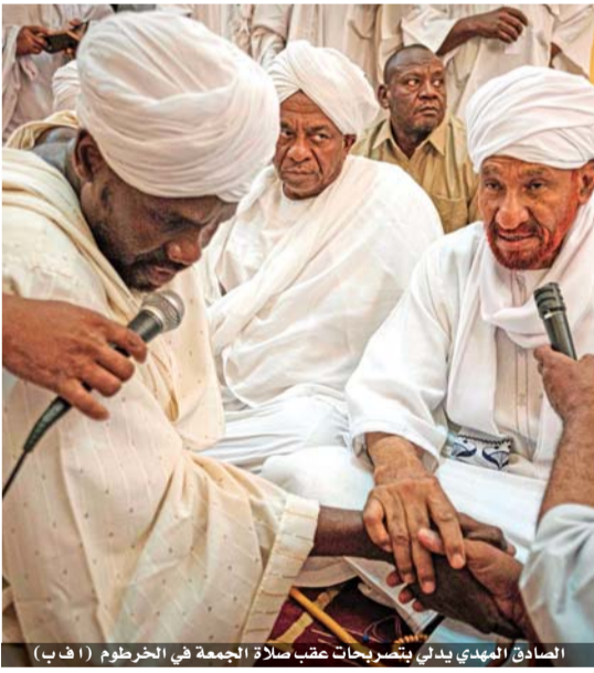
الصادق المهدي يدلي بتصريحات عقب صلاة الجمعة في الخرطوم

طالب مساعد وزير الخارجية الأميركي لشؤون إفريقيا المستقل ودي مصداقية، في عملية القمع التي شهدتها السودان الأسبوع الماضي وأدت إلى مقتل العشرات. ومن أدبيس أياها التي وصلها بعد زيارة إلى السودان استمرت يومين قال مساعد وزير الخارجية الأميركي تيبور نويج إن الولايات المتحدة ترى أن هناك ضرورة لإجراء تحقيق مستقل ودي مصداقية لمحاسبة مرتكبي الفظائع. وأقر المتحدث باسم المجلس العسكري الحاكم في السودان ليل الخميس بأن المجلس هو الذي أمر بفض الاعتصام أمام القيادة العامة للقوات المسلحة في الخرطوم في عملية تسببت بمقتل العشرات.