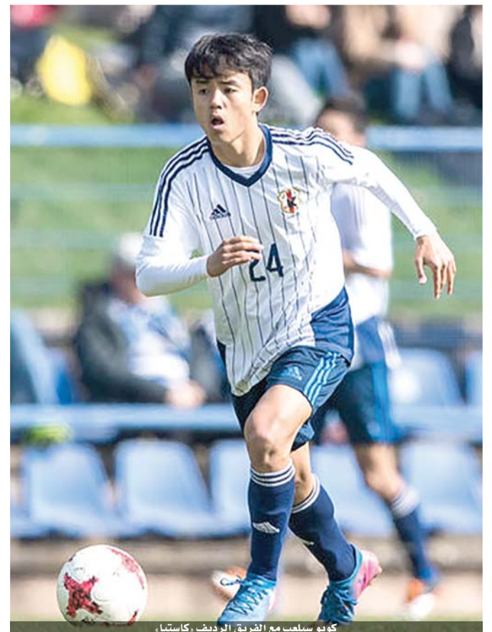
كوبو سيلعب مع الفريق الريدف، كاستيا

قدم نادي ريال مدريد الإسباني لكرة القدم أمس الأول لاعبه الجديد الدولي البلجيكي إدين هازارد على ملعبه سانتياجو برنابيو أمام قرابة ٥٠ ألف مشجع، فيما تمنى لاعب تشيلسي الإنجليزي السابق «الضوز بالكثير من الاقارب» مع فريقه الجديد. وقال هازارد (٢٨ عاما) «أريد فقط بدء لعب كرة القدم خلال شهر مع هذا القمصين الجديد والفوز بالكثير من الاقارب». وامضى هازارد سبعة اعوام مع تشيلسي قبل أن ينتقل الى النادي المديريدي بموجب عقد يمتد حتى عام ٢٠٢٤، فيما أشارت تقارير صحافية ان ريال أنفق حوالي ١٠٠ مليون يورو للتعاقد مع الدولي