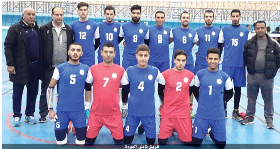
فريق نادي العودة