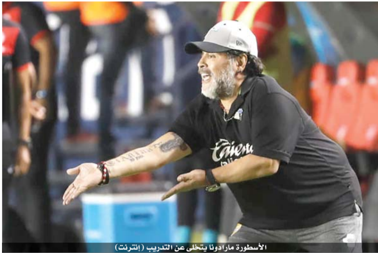
الأسطورة مارادونا يتخلّى عن التدريب

اخيرا اسفر ضغط الفراعنة عن هدف الافتتاح في الدقيقة ٦٤، حين نجح احمد المحمدي في تحويل عرضية البديل احمد ايمن منصور برأسية إلى يسار مانولا. وفي الدقيقة ٧٠ انقذ الحارس البديل محمود عبد الرحيم «جنش»، مرماه من هدف مؤكد للمنتخب التنزاني، بإبعاد الكرة قبل قدمي المهاجم ميوانا ساماتا المفرد تماما بالمرمى، ثم تصدى لتسديدة ساماتا في الدقيقة ٨٨ وأخرجها إلى ركنية بصعوبة.