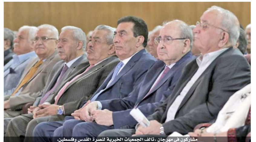
مشاركون في مهرجان «تألف الجمعيات الخيرية لنصرة القدس وفلسطين».