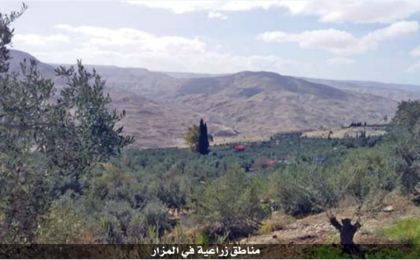
مناطق زراعية في المزار