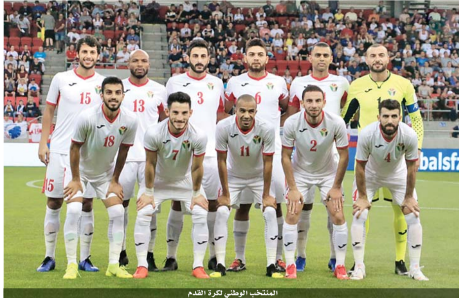
المنتخب الوطني لكرة القدم

عالمياً، حافظت بلجيكا على صدارتها أمام فرنسا بطلنة العالم، فيما فزت البرتغال مركزين