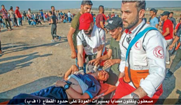
مسعفون ينقلون مصابا بمسيرات العودة على حدود القطاع