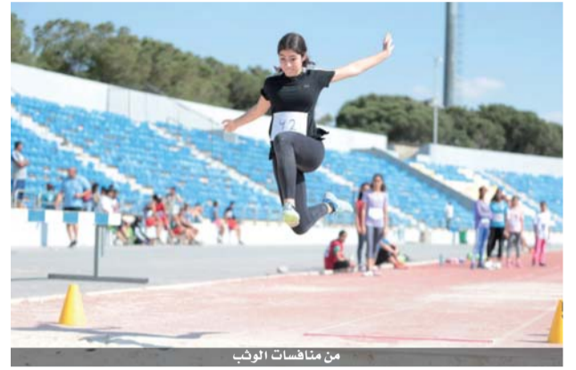
من منافسات الوثب