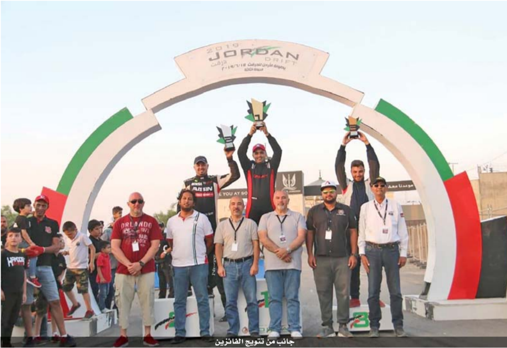
جانب من تتويج الفائزين