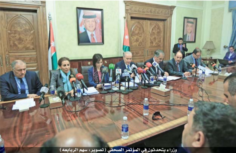
وزراء يتحدثون في المؤتمر الصحفي

الاصابات بحيث يتم تقديم العلاج اللازم حسب طبيعة الحالة. و اضاف ان الوزارة شكلت فريقا لغايات الدعم النفسي لذوي الضحايا، مشيراً الى ان هناك توجهاً لبناء مركز خاص بالطب الشرعي معد ومتطور خارج حرم مستشفى البشير، نظراً لحالة الازدحام التي يمر بها المستشفى من الداخل ومناطق حدوده من الخارج.