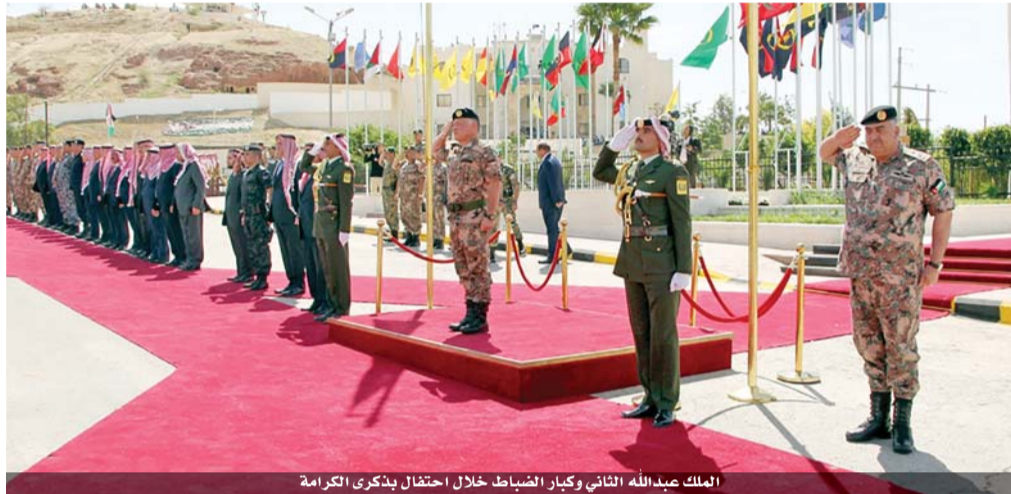
الملك عبدالله الثاني وكبار الضباط خلال احتفال بذكرى الكرامة

خسر الطرفين: قوتنا الباسلة: ٨٦ شهيداً و١٠٨ جرحى، تدمير ١٣ دبابة و٣٩ آلية مختلفة، القوات الإسرائيلية: ٢٥٠ قتيلاً و٤٥٠ جريحاً، تدمير ٨٨ آلية مختلفة شملت ٤٧ دبابة و١٨ ناقلة و٢٤ سيارة مسلحة و١٩ سيارة شحن وإسقاط ٧ طائرات مقاتلة. قائفاً في المعركة إسرائيل فقدت في هجومها الأخير على الأردن آليات عسكرية تعادل ثلاثة أضعاف ما فقدته في حرب حزيران عام ١٩٦٧، وكالفة يونانيته برس يوم ٢٩/٣/١٩٦٨، اعتمد حاييم بارليف / رئيس الأركان الإسرائيلي الأسبق، اعتمد شعبنا على رؤية قواته العسكرية وهي تخرج منتصرة من معركة الكرامة فقد كانت فريدة من نوعها بسبب كثرة عدد الإصابات بين قوتنا ولظواهر الأخرى التي أسفرت عنها المعركة، مثل استيلاء القوات الأردنية على عدد من دباباتها وآلياتها وهذا هو السبب في حالة الدهشة التي أصابت شعبنا. المقدم هارون بيلد قائد مجموعة القتال الإسرائيلية: «لقد شاهدت قصفاً شديداً عدة مرات في حياتي لكنني لم أر شيئاً كهذا من قبل لقد أصيبت معظم دباباتي في العملية ما عدا اثنتين فقط». صحيفة الديبلي لتخرف البريطانية: «لقد قاوم الجيش الأردني المعتدين بضراوة وتصميم وإن نتائج المعركة جعلت الملك الحسين بطل العالم العربي». جون بويرنث/ المراسل الخاص بوكالة يونايتد برس: «لقد أثبت الأردن جشياً وشعباً وحكاماً أنه رغم صفره وضلّة موارده واقتراره إلى الكثير من الأسلحة الضرورية اللازمة، أثبت أنه قلعة صمود وريح تضحية، وأنه كما قال ميليكيم: «مستعد للموت على أرضه».