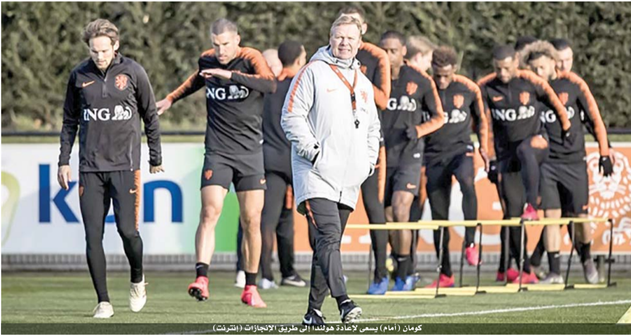
روتردام - أ ف ب

يبدأ المنتخب الهولندي رحلة العودة إلى البطولات الكبرى، اليوم، من روتردام، حين يستضيف نظيره البلغاري في الجولة الأولى من منافسات المجموعة الثالثة لتصفيات كأس أوروبا ٢٠٢٠.