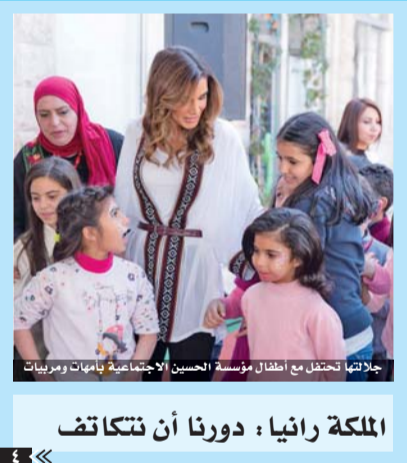
جلالته تحتفل مع أطفال مؤسسة الحسين الاجتماعية بامهات ومربيات