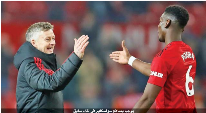
بوجبا يصافح سولسكاير في لقاء سابق

مجدداً لأننا ربما كنا فقدنا ذلك مع النتائج التي كنا نحققها، في مطلع الموسم الثالث لمورينيو مع الفريق. وامتنع بوجبا عن الخوض في تفاصيل علاقته بالبرتغالي، مكتفياً بالقول بشأن ذلك «ربما فقدنا الثقة، ربما سارت الأمور على غير ما يرام. كان ثمة الكثير من الأحاديث في الخارج، ولم تكن معتادين على ذلك..» وتابع «لا أحب الحديث عن الماضي. أحب الحديث عن المستقبل لأنه كل ما يهم. نحن أفضل الآن والنتائج التي نحققها مذهلة..»