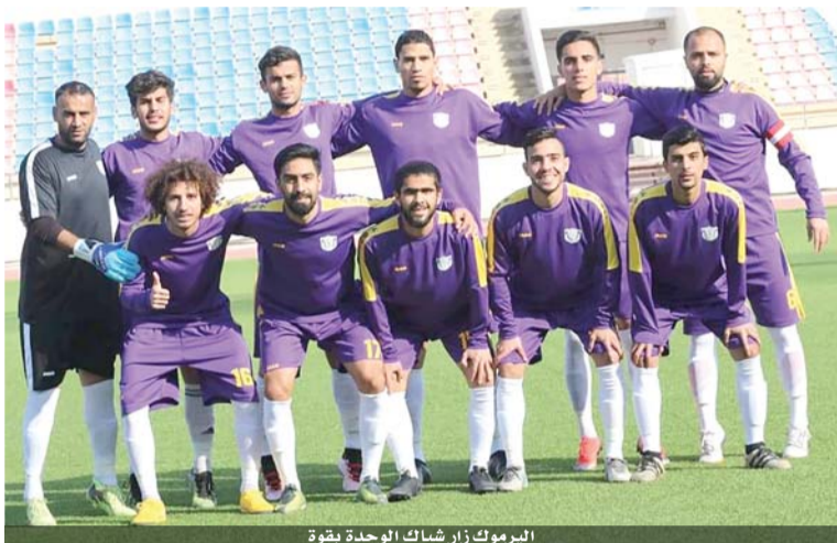
اليرموك زار شبك الوحدة بقوة