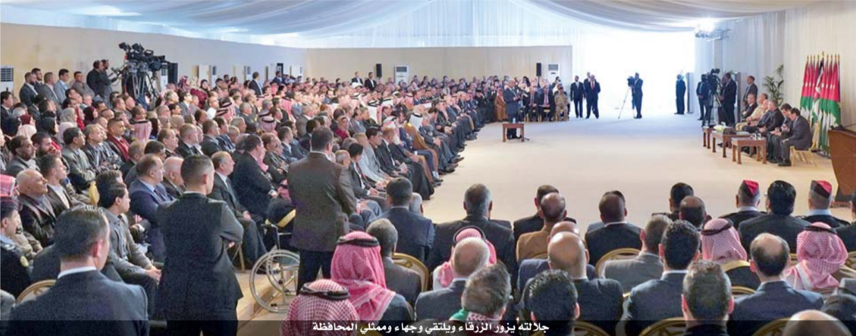
جلالته يزور الزرقاء ويلتقي وجهاء وممثلي المحافظة