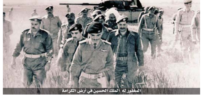
المغفور له الملك الحسين في أرض الكرامة