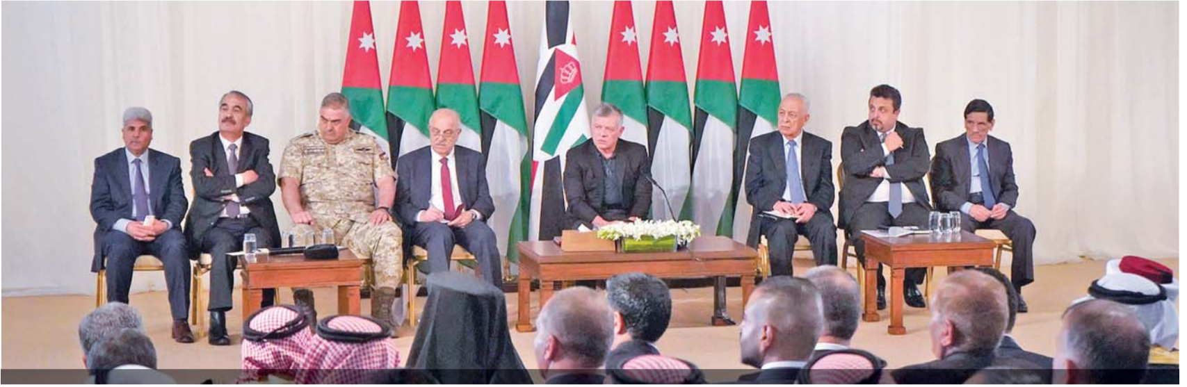
جلالته: خدمت سنوات بين أخواني بالقوات المسلحة في الزرقاء وأعرف الكثير عن تحديات المحافظة