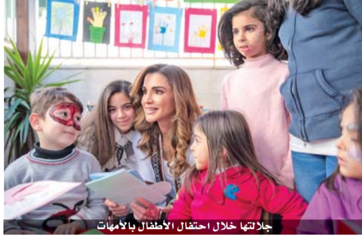
جلالته خلال احتفال الأطفال بالأمهات