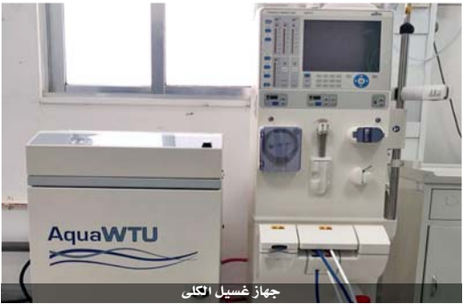
جهاز غسيل الكلى

متنقل لقسم العناية المركزة، وأكد الرواد، ان هذه الاجهزة ستعمل على تقديم خدمات طبية متطورة للمراجعين من ابناء المحافظة، كونها اجهزة حديثة ذات مواصفات خاصة، مقدما الشكر لمنظمة مرسى كور على الدعم السخي والتنوعي، معتبرا ان الدعم كان له أثر كبير لدى سكان المحافظة وخاصة المرضى منهم. وأشار الرواد، الى ان المستشفى استلم قبل شهر قليلة جهاز رنين مغناطسي مقدما من الحكومة اليابانية بكلفة تصل الى مليون ومئتين وخمسين ألف دينار.