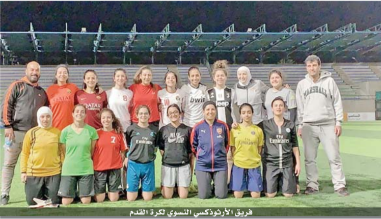
فريق الأرتوذكسي النسوي لكرة القدم

وتم توزيع الفرق المشاركة على مجموعتين وأقيمت مبارياتها بنظام الدوري المجزأ من مرحلة واحدة. وأقيمت البطولة من أجل تصنيف الفرق في مستويين (أول وثاني). حيث تم إسكان الفرق الحاصلة على المركز الأول وحتى السابع في المستوى الأول، فيما تم وضع بقية الفرق في المستوى الثاني، وذلك إستناداً على قرار الهيئة التنفيذية للاتحاد بإعادة هيكلة الكرة النسوية نحو الوصول إلى دوري محترف، كافة من مواليده ٢٠١٦-١٩٩٩ فما دون من كشافات الأندية، لفتح المجال للعديد من الأندية للمشاركة بالبطولات النسوية. وفاز بلقب دوري الموسم الماضي فريق شباب الأردن، وحل عمان ثانياً والاستقلال ثالثاً وجاء الأرتوذكسي رابعاً.