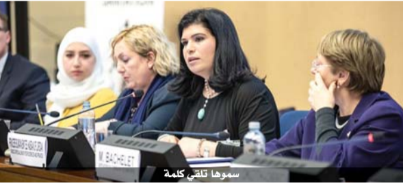
سموها لتلقي كلمة

عن مشروع «تطوير البيئة الزراعية المدرسية». وبلغ عدد الطلبات المقدمة إلى مكتب الجائزة في الأمانة العامة للمجلس الأعلى للعلوم والتكنولوجيا وفق البيان، ٢٢ مشروعاً من قبل ١٧ مؤسسة معنية بالتعليم المهني والتقني. وسيتم تكريم الفائزين بهذه الجائزة، في حفل يُقام تحت رعاية الأمير الحسن رئيس المجلس الأعلى للعلوم والتكنولوجيا، في ١١ نيسان المقبل في المركز الثقافي الملكي.