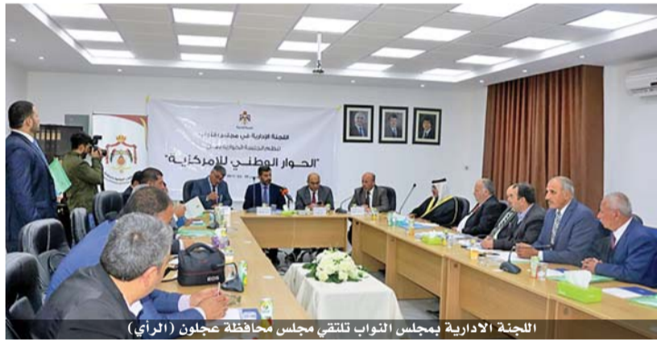
اللجنة الادارية بمجلس النواب تلتقي مجلس محافظة عجلون (الرأي)

قال رئيس اللجنة الادارية بمجلس النواب الدكتور علي الحجاجة «ان قانون اللامركزية يحتاج الى تعديلات في بعض بنوده كالتمييز والفضل بين عمل مجالس المحافظات والمجالس البلدية والاستشارية ومجلس النواب، فتداخل الصلاحيات يعتبر من اكبر التحديات التي تواجه تطبيق القانون.. وأكد الحجاجة خلال لقاء إدارية النواب مع رئيس واعضاء مجلس محافظة عجلون في جامعة عجلون الوطنية أمس، أهمية ان يقوم كل طرف من هذه الاطراف بالمهام المنوطة به والمتمثلة بالدور الرقابي والتشريعي لمجلس النواب والردود الخدمي والمشاريع الاستثمارية وتوفير فرص العمل لمجالس المحافظات، داعيا الى وضع المقترحات اللازمة لتعديل قانون اللامركزية، ليتمكن كل طرف القيام بدوره على أكمل وجه. بدوره، أكد أمين عام وزارة الشؤون السياسية والبرلمانية