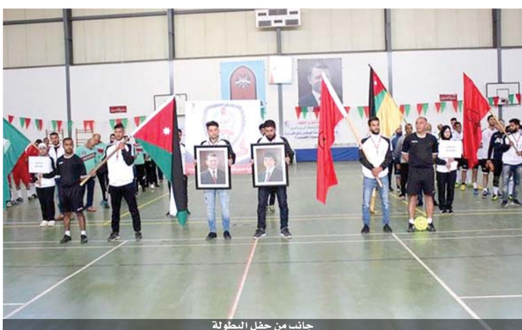
جانب من حفل البطولة