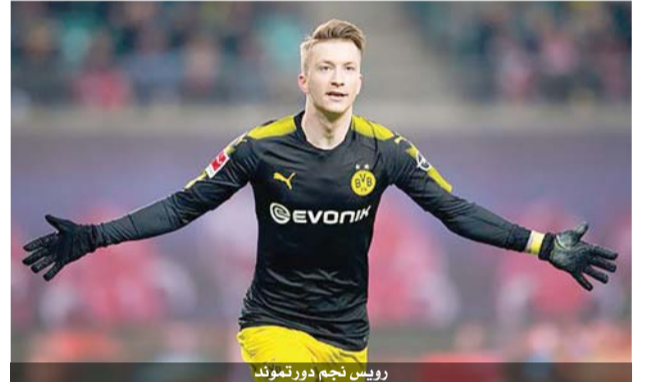
رويس نجم دورتموند