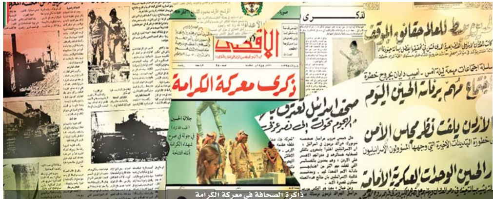
ذاكرة الصحافة في معركة الكرامة

التي لا يقهر، وأحقوا بالعدو أهدح الخسائر، لاقتين إلى أن ذلك كان كله بمعنوياتهم العالية التي استمدتها من جلالة المغفور له، بإذن الله، الملك الحسين بن طلال، طيب الله ثراه، قائد معركة الكرامة وصانع نصرها، حيث أعادوا للأمة الكرامة والأمل. وشددوا على أن معركة الكرامة مثلت نقطة تحول في تاريخ العسكرية العربية، وأضاعت تاريخ الأردن وخلفت بماء الذهب نصر قواته المسلحة وجيشه العربي، وأعدت الأمل والثقة إلى النفوس. وأشار مرسلو البرقيات إلى أن أبطال معركة الكرامة التي سطر فيها الجيش العربي المصطفى ملحمة