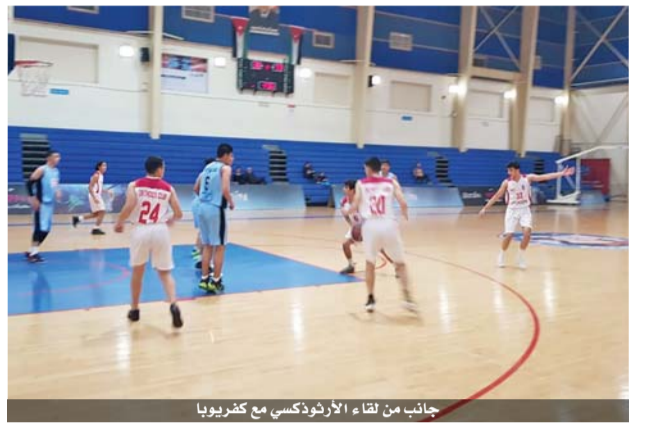
جانب من لقاء الأرتوذكسي مع كفيروبا