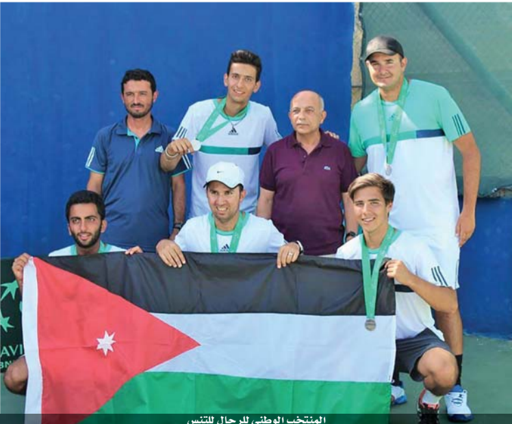
المنتخب الوطني للرجال للتنس