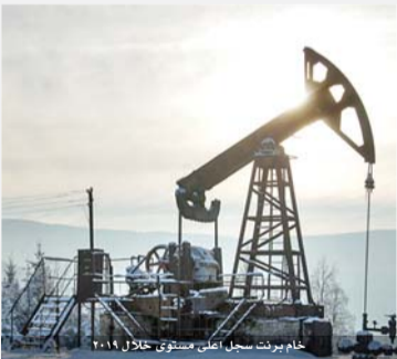
خام برنت سجل أعلى مستوى خلال ٢٠١٨