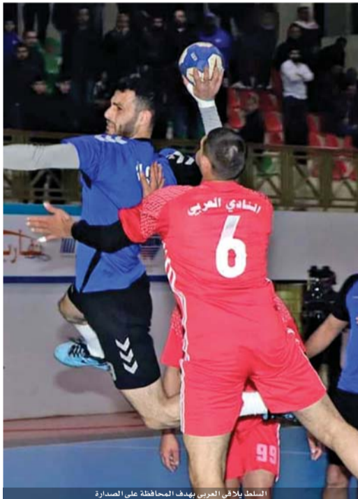
السلطان يلافي العربي يهدف الحافظة على الصدارة.