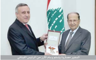
السفير مصاروة يتسلم الأرز من الرئيس اللبناني

ومنح الرئيس اللبناني السفير مصاروة وسام وهو من أرفع الأوسمة في لبنان.