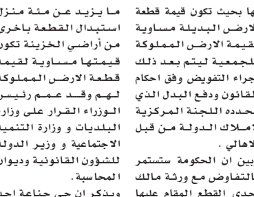
صورة عن كتاب الرزاز حول جناعة

بها بحيث تكون قيمة قطعة الأرض البديلة مساوية لقيمة الأرض المملوكة لجمعية الأصدقاء البيضاء المقام عليها جزء من مساكن حي جناعة بقطعة أخرى وحسب القوانين والأنظمة المعمول بها بحيث تكون قيمة قطعة الأرض المملوكة مساوية لقيمة قطعة الأرض المقامة عليها مساكن في جناعة الزرقاء حتى يتم تسوية قيمة الأرض المقامة عليها مساكن في جناعة الزرقاء مع قيمة الأرض المقامة عليها مساكن في جناعة الزرقاء.