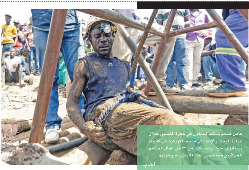
عامل منجم يستعد للدخول في حفرة التعدين خلال عملية البحث والإنقاذ في منجم الكريكت في كادوما زيمبابوي، حيث يوجد أكثر من ٢٣ من عمال المناجم الحرفيين محاصرين تحت الأرض رجع موتهم