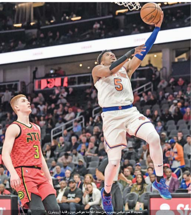
سميت لاعب نيكس يقفتر من سلة أتلاتنا هوكس دون رقابة

وكان وستبروك تجاوز رقما للنجم ويلت تشامبرلاين الذي حقق ٩ ترديل دبل متتالية في عام ١٩٦٨، وبدأ رغم خسارة فريقه متفانلاً حيث قال «لدي هامش كبير من التحسن، أنا شخصياً، لأنني أعرف الى أي حد يمكنني أن أكون جيداً وإلى أي مدى يمكنني أن أساعد الفريق على تحقيق الانتصار». وأصبح وستبروك أفضل مسجل في تاريخ ثاندرو الذي بدأ مشاركاته تحت مسمى سياتل سوبر سونيكس، بعدما رفع وصيده ال ١٨٢٤٧ نقطة، متجاوزاً الرقم السابق لجاري باتون (١٨٢٠٧). وتوقفت سلسلة ثاندرو الناجحة عند خمسة انتصارات متتالية، ليبقى ثالثاً في ترتيب المنطقة الغربية (٢٧ فوزاً وخسارة) في حين يحتل الفائز المركز