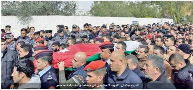
تشيع جثمان الشهيد الجالودي في مسقط رأسه ببلدة ماحص