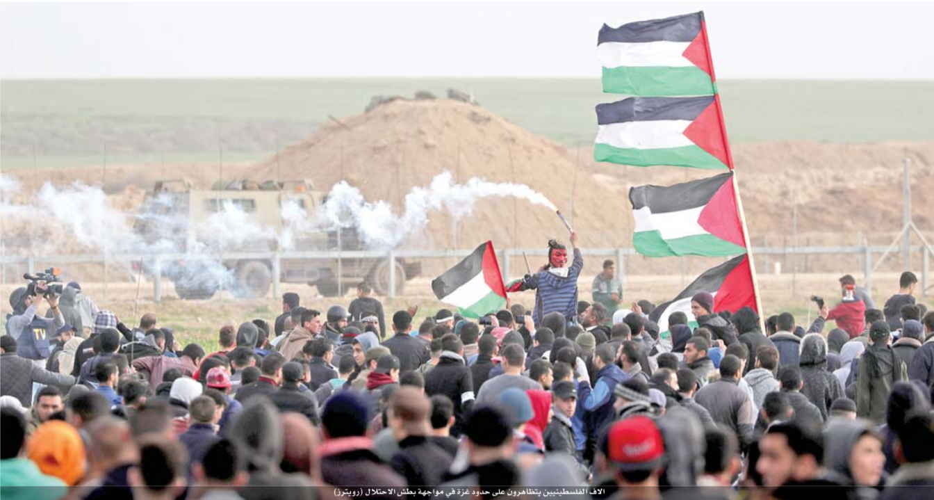
الآلاف الفلسطينيين يتظاهرون على حدود غزة في مواجهة بطش الاحتلال