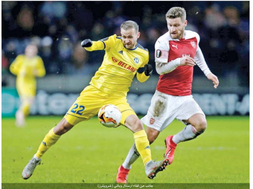
جانب من لقاء إرسال وباتي (شرويتز)