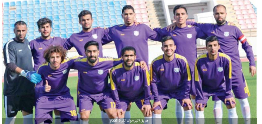
فريق البيرومك لكرة القدم

ويبدو ان شباب الحسين سيكون غداً على الموعد مع ضيفه منشية بني حسن على ملعبه وهما من حقل المملووب وبالتالي تتجه الأنظار صوبهما، الشباب صورته الهجومية فحتت أجواء التقدم إلى الأمام والمنشية يعي ان رحلته فيها الكثير من العناوين وأهمها التخلص من تيار كفرنسوم والتفرغ لصاحب الأرضية.