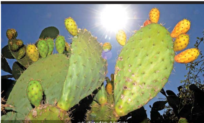
بساتين الصبار في بلدة قرب مراكش

واشنطن - أ.ف.ب. أكد الرئيس الأميركي دونالد ترمب امس انه سيعلن «حال الطوارئ الوطنية»، وهو إجراء استثنائي لتمويل الجدار على الحدود مع المكسيك ما سيؤدي إلى