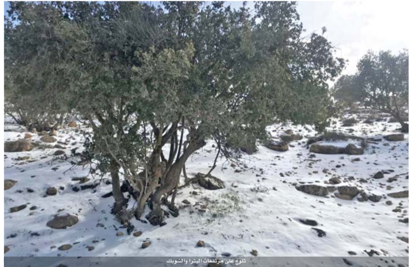
ثلوج على مرتفعات البترا والشوبك

طبيعي واعتيادي في مدينة البترا الأثرية، فيما شكلت منطقة الهيشة مقصدا للعثاق وأطفالهم للاستمتاع والفرح بمشهد الثلوج. كما شهدت المناطق المجاورة من مناطق معان والشراه تساقطاً للأمطار والثلوج بسماكات عادية ومتفاوتة.