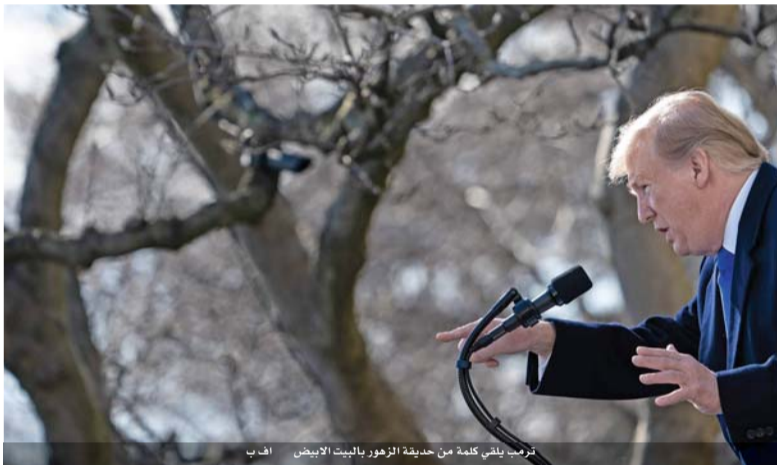
ترمب يلقي كلمة من حديقة الزهور بالبيت الأبيض

الأموال لبناء الجدار لوقف الهجرة غير القانونية، أحد أبرز وعود حملته الانتخابية. وندد قادة المعارضة الديمقراطية فوراً بما اعتبروه «انقلاباً عنيفاً» على الدستور.