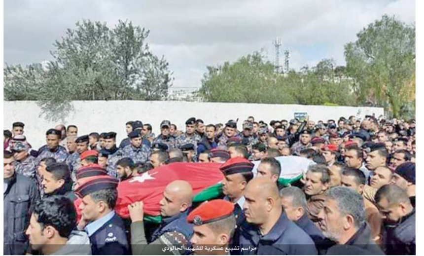
مراسم تشييع عسكرية للشهيد الجالودي

البلقاء. وشارك في تشييع جثمان الشهيد وزير الداخلية سمير المبيضين ورئيس هيئة الأركان المشتركة الفريق الركن محمود هريجات ومديرو وقادة الأجهزة الأمنية وكبار ضباط القوات المسلحة ومحافظ البلقاء نايف هدايات الحجابا