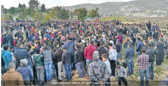
تشيع جثمان الشهيد العتوم في مسقط رأسه ببلدة سوف