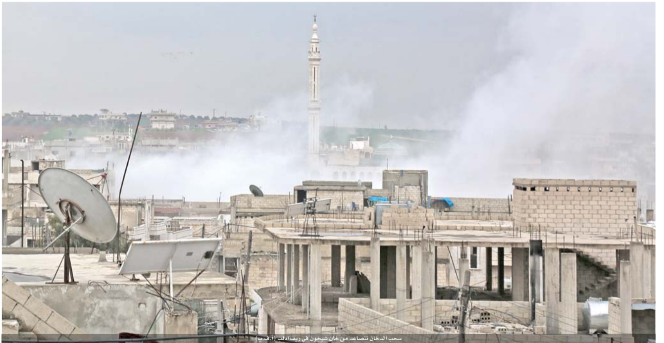
سحب الدخان تتصاعد من خان شيخون في ريف ادب