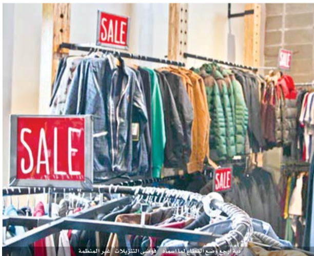
تراجع وضع القطاع لما اسماه «فوضى التنزيلات» غير المنظمة

وطالب الحكومة ضرورة اتخاذ قرارات سريعة تنقذ قطاع الالبسة الاحذية بالمملكة من الضرورية للمواطنين، وبخاصة في ظل عدم وجود صناعة ملابس وأحذية أردنية قد تتأثر. واكد ان ملابس الاطفال وأحذيتهم تعتبر من الاساسيات والضروريات للأسرة الاردنية ما