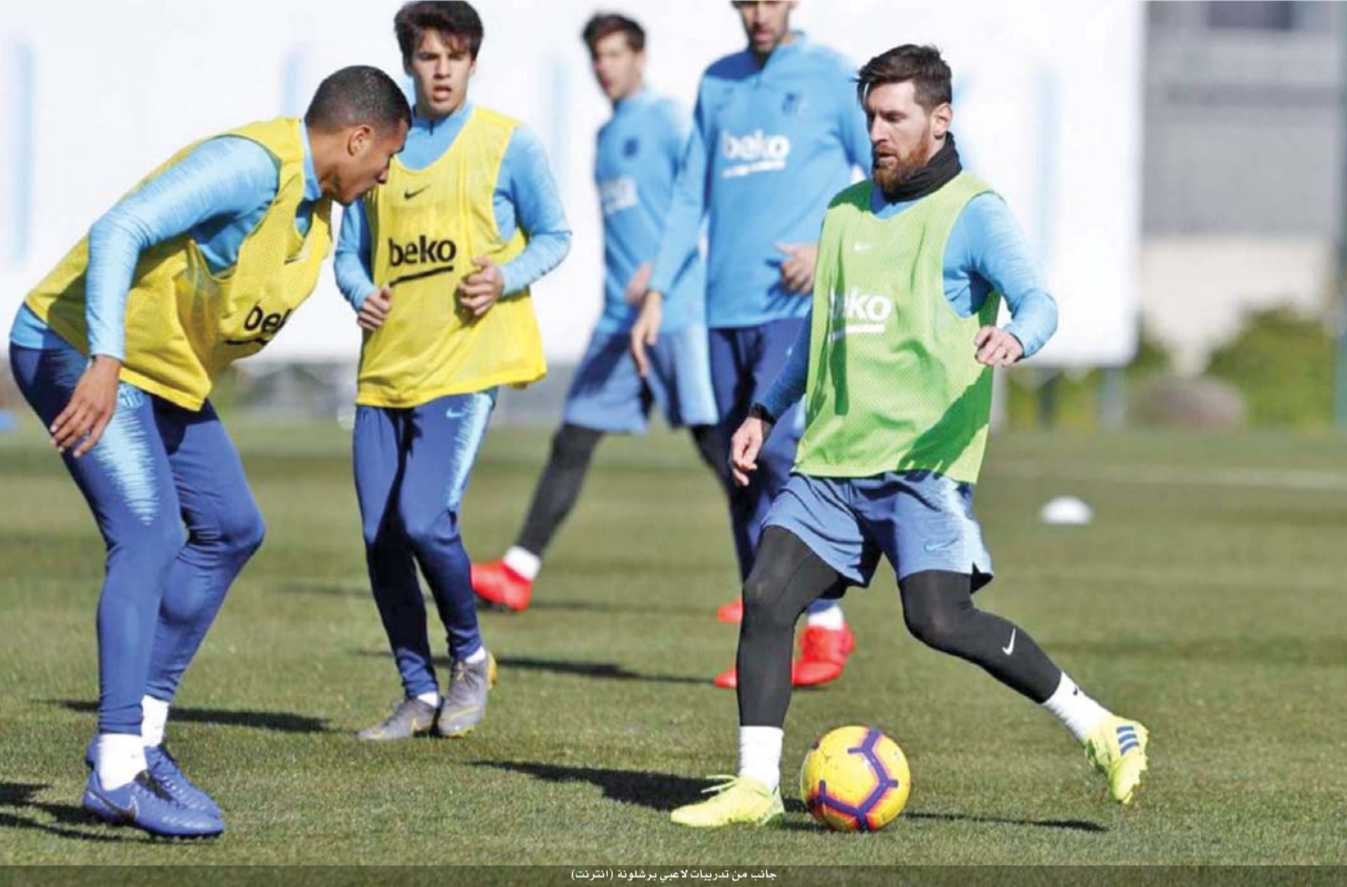
جانب من تدريبات لاعبي برشلونة (الشرتت)

ميلان ضيفا على أتالانتا.. ودورتموند بمهمة سهلة