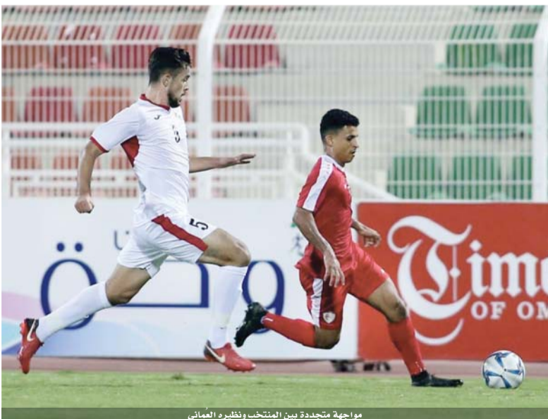
مواجهة متجددة بين المنتخب ونظيره العُماني

راضون عن الملاحظات التي خرجنا بها للعمل عليها في قادم المواعيد والاستحقاقات، وأوضح «باب المنتخب ما يزال مفتوحا لجميع بكل شفافية لاثبات نفسها..