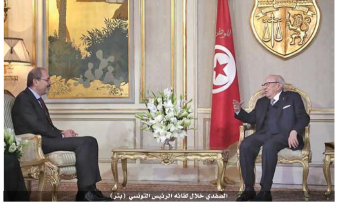
الصفدي خلال لقائه الرئيس التونسي

تناقش اللجنة الوزارية للتشريع الإسرائيلية، غداً الأحد، مشروع قانون «التسوية ٢»، والذي يسعى لـ«شرعنة» عشرات البؤر الاستيطانية المقامة على أراضي الضفة الغربية المحتلة، وبحسب صحيفة «اسرائيل اليوم»، فإن اللجنة الوزارية ستناقش مشروع قانون يعمل عليه عضو البرلمان الاسرائيلي (بنتاليل سموتريتش)، من كتلة «البيت اليهودي»، لشرعنه ٦٦ بؤرة استيطانية. ويتضمن مشروع القانون جدولاً زمنياً يصل حتى سنتين لإنهاء عملية تسوية البؤر الاستيطانية، والسماح للسلطات المحلية الاستيطانية بتقديم خدمات بلدية لهذه البؤر الاستيطانية، وإقامة مبان عامة فيها، وربطها بشبكتي الكهرباء والمياه، وتوفير القروض السكنية للمستوطنين فيها. من جهة اخرى، اندلعت مواجهات في عدة نقاط احتكاك بالضفة المحتلة، امس الجمعة، استجابة لدعوات أطلقت تحت شعار «الوفاء للمقاومة والنار لدماء الشهداء»، وفي قطاع غزة المحاصر، اصيب اكثر من ٨٠ فلسطينياً جراء اعتداء قوات الاحتلال الاسرائيلي على المشاركين في الجمعة ٢٨ لمسيرة العودة شرقى القطاع.