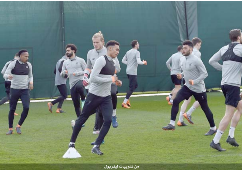
من تدريبات لليفربول

وعلى ملعب الاتحاد، يتواجه مانشستر سيتي مع ضيفه ايفرتون في مباراة يسعى فيها الاول الى استعادة نغمة الفوز بعد ان مني بخسارته الاولى هذا الموسم بسقوطه امام تشلسي ٢-٠ الاسبوع الماضي.