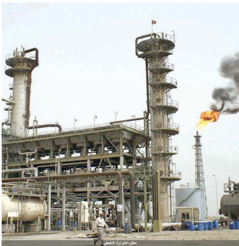
حقل الشراة النفطي