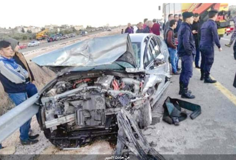
من حادث السير

توفي ثلاثة اشخاص وأصيب أربعة آخرون في حادث تصادم وقع بين مركبتين في منطقة المزار حوفا في محافظة اربد. وقالت إدارة الإعلام في المديرية العامة للدفاع المدني في بيان، أن كوادر الإنقاذ والإسعاف في مديرية دفاع مدني غرب اربد تعاملت عصر امس مع حادث تصادم وقع ما بين مركبتين في منطقة المزار / حوفا ، حيث نتج عن الحادث وفاة ثلاثة أشخاص وإصابة أربعة آخرين بجروح ورضوض في مختلف أنحاء الجسم. وأضاف البيان ، ان فرق الدفاع المدني تحركت الى الفور إلى موقع الحادث حيث عملت فرق الإنقاذ على تحرير الوفيات باستخدام معدات الإنقاذ الخاصة بمثل هذه الحوادث بينما تولت فرق الإسعاف تقديم الإسعافات اللازمة للمصابين ونقلهم وإخلاء الوفيات إلى مستشفى الامير راشد وحالة المصابين العامة متوسطة فيما وصفت احداها بالبالغة.