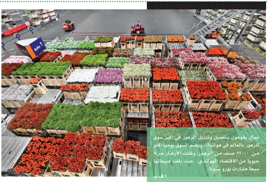
عمال يقومون بتحميل وتزليل الزهور في أكبر سوق للزهور بالعالم في هولندا، ويضم السوق يوميا أكثر من ٢٢٠٠٠ صنف من الزهور، وظلت الأزهار جزءا حيويا من الاقتصاد الهولندي، حيث بلغت مبيعاتها سبعة مليارات يورو سنويا.