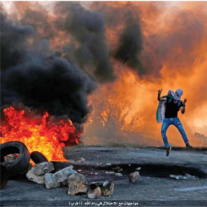
مواجهات مع الاحتلال في رام الله