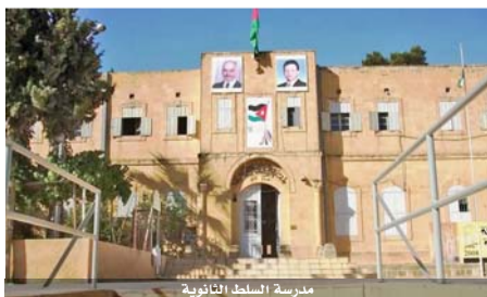
مدرسة السلط الثانوية