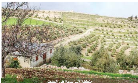
منطقة البيقية في البقاع