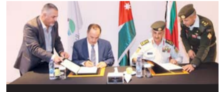
توقيع اتفاقية بين القوات المسلحة الأردنية وشركة البوتاس العربية