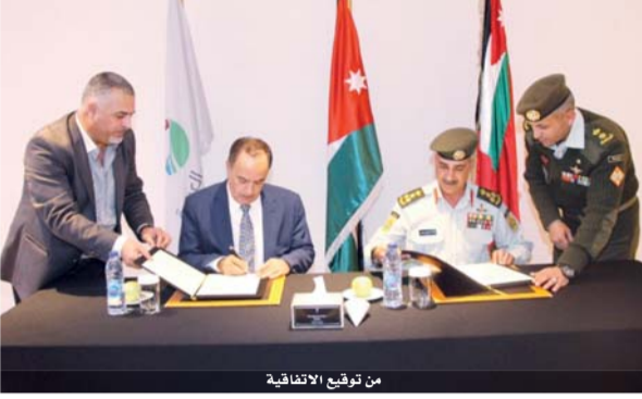
من توقيع الاتفاقية