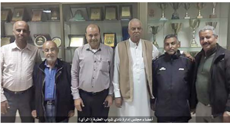
أعضاء مجلس إدارة نادي شباب العقبة