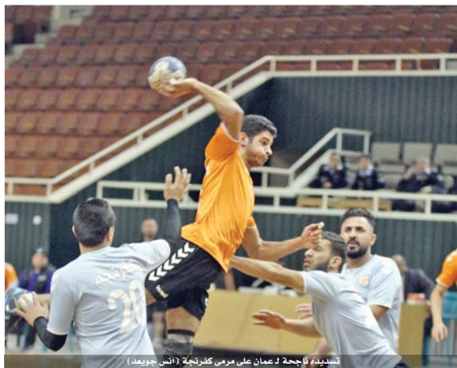
تسديد فاجحة لعمان على مرمرى كفرنجة (أنس جويعد)