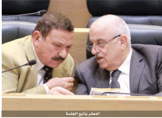
المعشر يتابع الجلسة

من جهته عبر النائب طارق خوري عن تأييده لتشكيل لجنة تحقيق قائلا: «انا مع تشكيل لجنة تحقيق لان اداء البلدية يضر بالزرقاء وتشكيل اللجنة حماية لها، لأن رئاسة البلدية مسكونة بعقلية المؤامرة»، بدوره اعتبر رئيس مجلس النواب المهندس عاطف الطراونة ان تشكيل لجنة تحقيق في البلدية هو من صلاحيات السلطة التنفيذية وعلينا انتظار نتائجها قبل اصدار اي موقف.