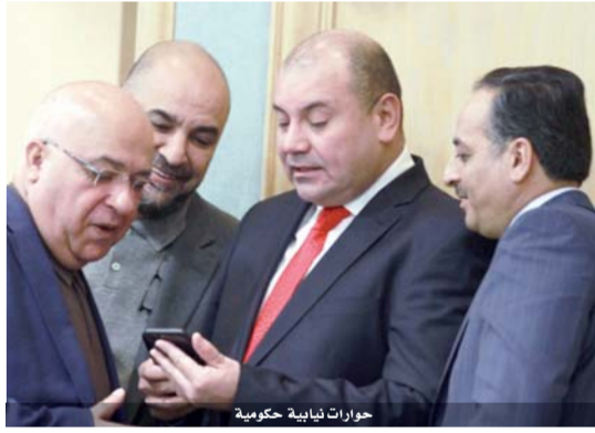
حوارات نيابية حكومية