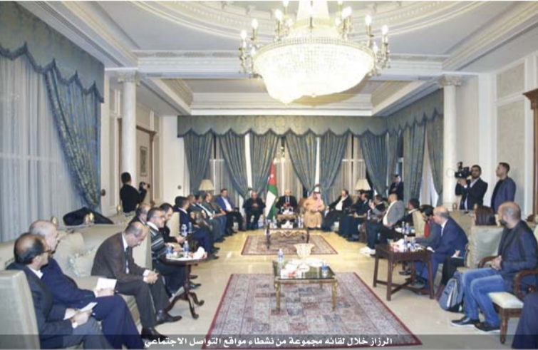
الرزاز خلال لقائه مجموعة من نشطاء مواقع التواصل الاجتماعيين

الحكومة ستسعى لاطلاق سراح الموقوفين اداريا ما لم يثبت عليهم جرم جنائي