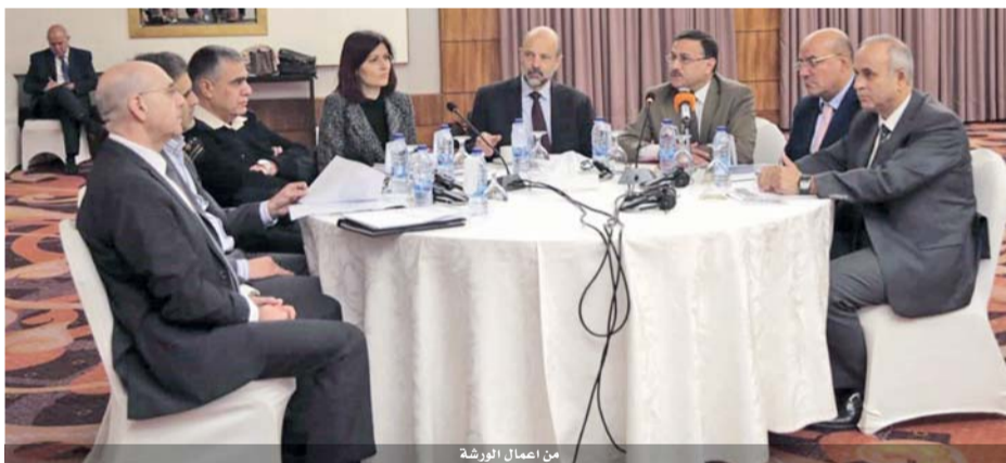
من أعمال الورشة

وتجدر الإشارة هنا إلى أن البنك العربي يقوم بدور رائد في مجال تمويل مشاريع الطاقة المتجددة في الأردن بما يخدم الاستراتيجية الوطنية في هذا المجال، حيث أن قطاع مشاريع الطاقة بشكل عام وقطاع الطاقة المتجددة بشكل خاص هي من القطاعات الرئيسية التي يتميز البنك العربي بقدرته على وضع هيكل تمويل ملائمة لها وإدارة الخدمات البنكية اللازمة لإنجازها.