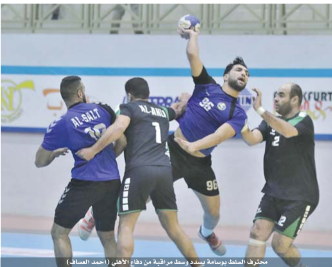
محترف السلط بوسامة يسدد وسط مراقبة من دفاع الأهلي