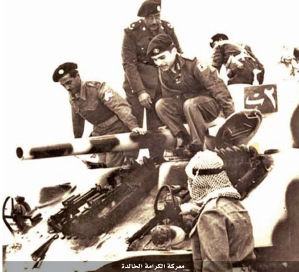
معركة الكرامة الخالدة