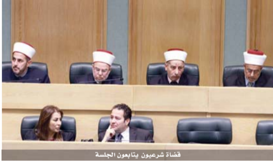
قضاة شرعيون يتابعون الجلسة

وبسبب القانون المعدل فان التعديل السابق والذي كان يسمح باثبات النسب وفق الوسائل العلمية في حالات الاكراه والاعتصاب بان ترك الامور الى المحكمة بان تدرس كل حالة بحالتها.