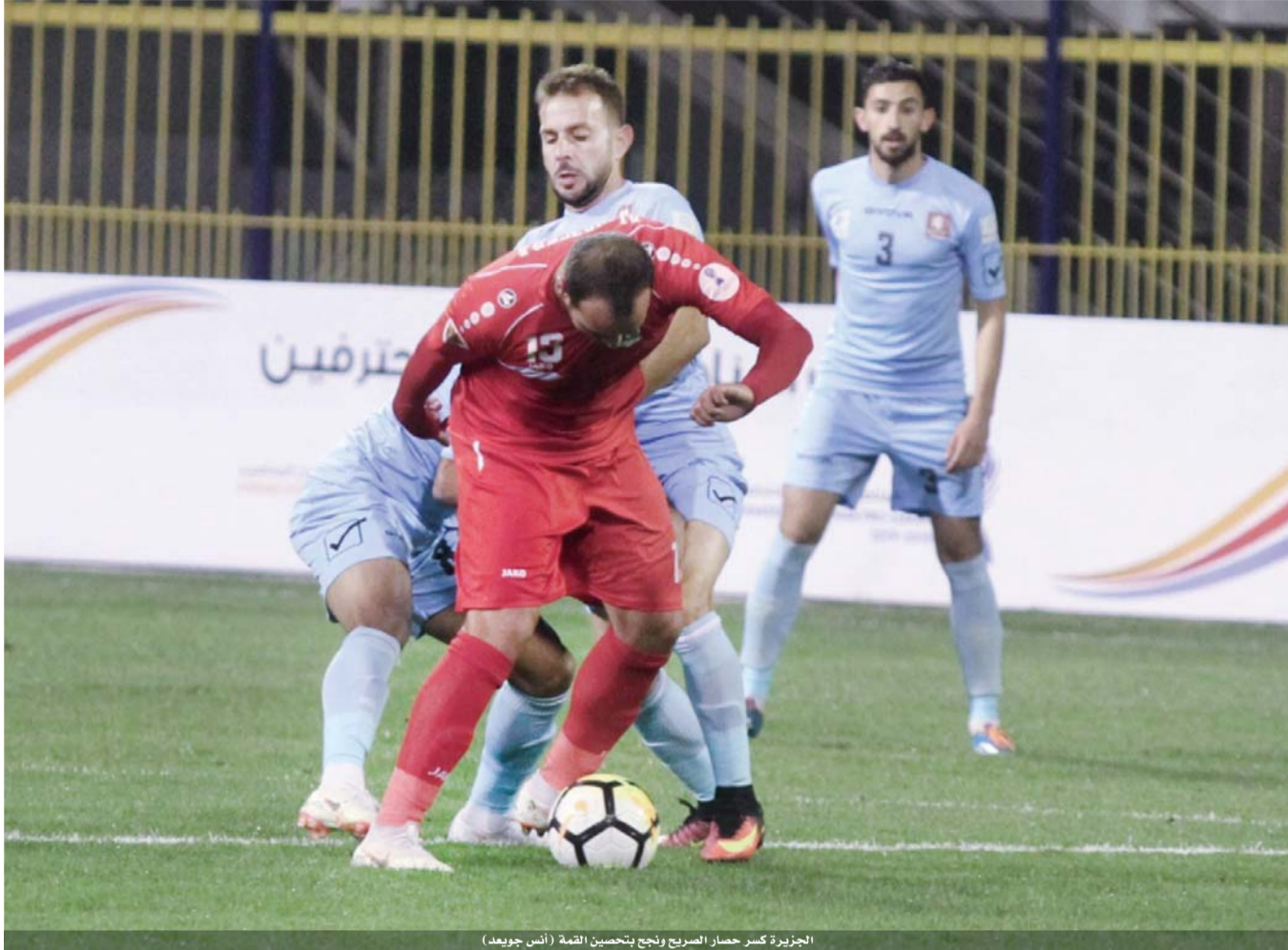
الجزيرة كسر حصار الصريح ونجح بتحسين القمة (أس جويعد)

وتسرد أنباء الشمال، أن الرمثا بثلاثية الحسين حقق العديد من الخطوات المؤثرة بقطانه الفني الجديد القديم العراقي عادل يوسف، «الرجل» يملك اسرار الرمثا وأعاد الحضور الذهني قبل التكتيكي للغزلان، بينما خاض الحسين مباراة