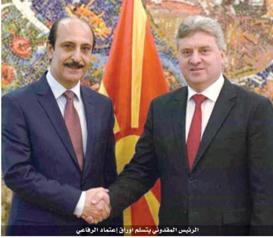
الرئيس المقدوني يتسلم أوراق اعتماد الرافعي