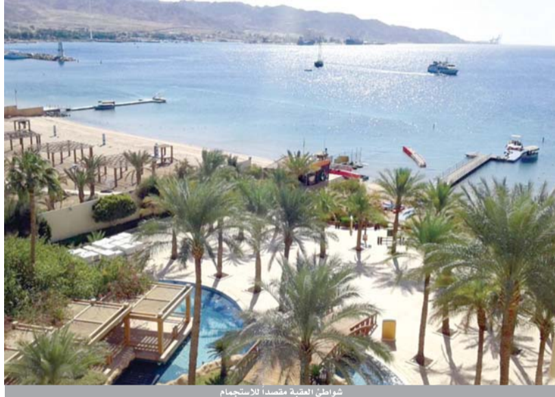
شواطئ العقبة مقصداً للاستجمام

تبدلتها سلطة العقبة الخاصة في العمل والإنجاز، فترى نواهيرها وميادينها الخضراء، ومطاعمها القديمة. ويمكن للزائر الأردني أن يستمتع بفنادق العقبة ذات الخمسة نجوم، ورمال شواطئها الساحرة، وأن يركب الزوارق ليبحر في عرض البحر، وهي مدينة أصبحت نقطة جذب للإستثمارات السياحية العملاقة، كمشروع (أيلة) ومرسى (زايد).