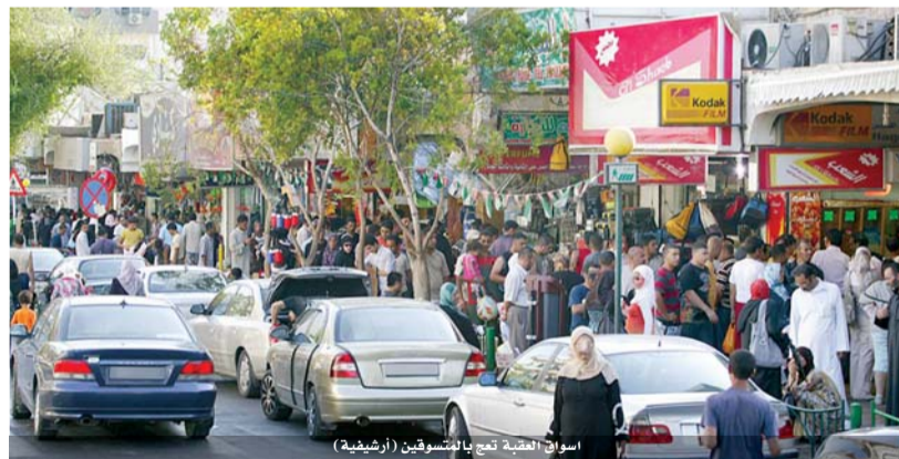
اسواق العقبة تعج بالمستوفين (أرضيية)

استعداد لتذليل أي عقبات يواجهها. وقال نقيب الأطباء الأردنيين الدكتور علي العبوس ان النقابة تدعم اختصاص طب المجتمع والصحة العامة اسوة بالاختصاصات الاخرى مؤكدا ان الوقاية من الامراض تكتسب اهمية بالغة لدورها في الحد من انتشار الامراض ولا سيما السارية. واكد مدير الشبكة الشرق اوسطية للصحة المجتمعية الدكتور مهني التنور دعم الشبكة لبرامج الوبائيات التطبيقية منوها الى اهمية دور القطاعات الصحية والمنظمات التطوعية والدولية في دعم الخدمات الوقائية والصحية التي تقع على كاهل وزارة الصحة. وتناول وزير الصحة الاسبق الدكتور سعد