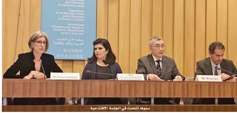
سموها تتحدث في الجلسة الافتتاحية

يذكر أن اليونسكو حددت اليوم العالمي للعلوم من أجل السلام والتنمية في عام ٢٠١٠، ويحتفل به سنوياً في العاشر من تشرين الثاني. ويهدف هذا الاحتفال إلى إبراز أهمية دور العلوم في المجتمع والحاجة إلى مشاركة أكبر عدد من الشعوب في المناقشات حول المستجدات والقضايا المعاصرة ذات الصلة بالعلوم.