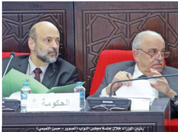
رئيس الوزراء خلال جلسة مجلس النواب