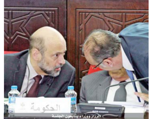
الوزار ووزراء يناقون الجلسة