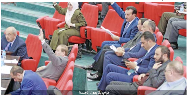
نواب يناقون الجلسة