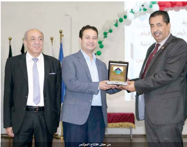
من حفل افتتاح المؤتمر