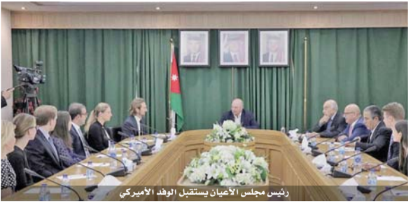
رئيس مجلس الأعيان يستقبل الوفد الأميركي

لاجئ سوري، قدم لهم الخدمات والرعاية اللازمة، رغم شح موارده وشح المساعدات الدولية، فما قدمه الأردن للاجئين السوريين منذ بداية الأزمة وحتى نهاية العام الماضي، تجاوز عشرة مليارات و٣٠٠ مليون دولار، في حين لم يتلق مساعدات لرعاية اللاجئين، إلا ربع هذا المبلغ، الأمر الذي رتب عليه تداعيات اقتصادية كبيرة، أثرت على حياة المواطنين المعيشية، وساهمت في زيادة المديونية.