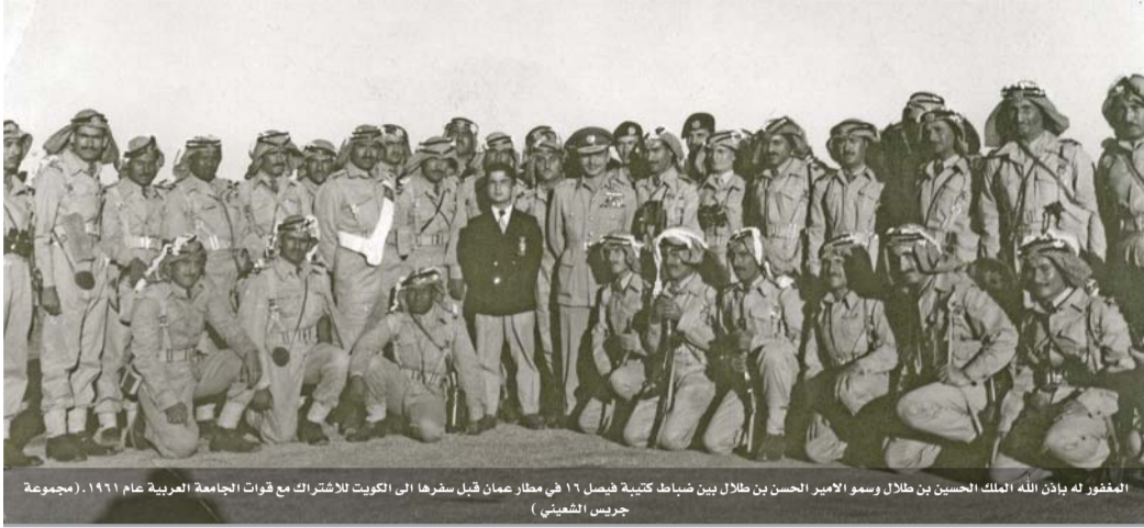
المغفور له بإذن الله الملك الحسين بن طلال وسمو الامير الحسن بن طلال بين ضباط كتيبة فيصل ١٦ في مطار عمان قبل سفرها الى الكويت للاشتراك مع قوات الجامعة العربية عام ١٩٦١.

تنشر أبواب - الراي مجموعة من المقتنيات المهمة من الصور الفوتوغرافية والوثائق التي تقوم علي دراستها وأرشفتها دائرة المكتبة الوطنية، وتشكل مفردات مهمة من ذاكرتنا الوطنية.