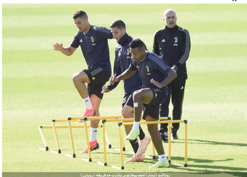
رونالدو (يسار) نجم يوفنتوس يتدرب مع فريقه

وسيكون لاعبو الفريق الملكي مدعوين الى تحويل الدعم الذي أبدوه لمديرهم الجديد، الى أداء وتناجح بعد سقوطه أمام مضيفه أياكس بثلاثية نظيفة في الجولة الأولى، ثم خسارته على أرضه أمام بنفيكا البرتغالي ٢-٣.