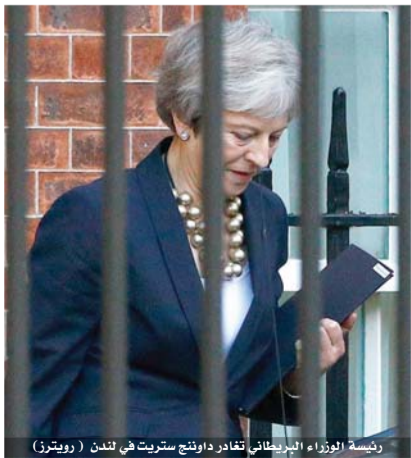
رئيسة الوزراء البريطانية تشار داوننج ستريت في لندن

التوفيق بين مطالب حزبها المحافظ المشكك في الوحدة الأوروبية ووقائع المفاوضات مع بروكسل. وقبول طرح ماي تمديد الفترة الانتقالية لمعالجة مسألة الحدود الأيرلندية بغضب عارم في بريطانيا خصوصا من أعضاء حزبها المدافعين عن بريكست الذين يخشون من بقاء بلادهم مرتبطة لسنين بالاتحاد الأوروبي بعد الطلاق الرسمي. وستقول ماي في كلمتها أمام مجلس العموم حول تقدم المفاوضات وفق مقتضيات نشرها مكتبها «مثلما قلت الأسبوع الماضي، لا يمكننا قبول اقتراح شبكة الأمان (باكستوب) الأول الذي اقترحه الاتحاد الأوروبي». وتفيد الصحافة البريطانية أن نواب الأغلبية المحافظة يستعدون لتحدي قيادة ماي نظراً لعدم رضاهم عن استراتيجيتها حول التفاوض على اتفاق بريكست. لندن - أ ف ب أكدت رئيسة وزراء بريطانيا تيريزا ماي أمس الاثنين أن اتفاق الخروج من الاتحاد جاهز بنسبة ٩٥٪، مع الإشارة إلى معارضتها للحل الذي عرضه الاتحاد الأوروبي لمشكلة الحدود الأيرلندية بعد بريكست. وتتعرض مفاوضات بريكست بين بروكسل ولندن حول مصير الحدود بين مقاطعة إيرلندا الشمالية وجمهورية إيرلندا العضو في الاتحاد الأوروبي بعد الموعد المحدد لخروج بريطانيا في ٢٩ آذار ٢٠١٩، علما أن الطرفين يرغبان في تفادي إقامة حدود فعلية لكن وجهات نظرهما متباينة حول الحل ولم يتمكن من الاتفاق خلال القمة الأوروبية في ١٧ و١٨ تشرين الأول في بروكسل. وتحاول ماي منذ الاستفتاء على خروج بريطانيا من الاتحاد الأوروبي في ٢٠١٦