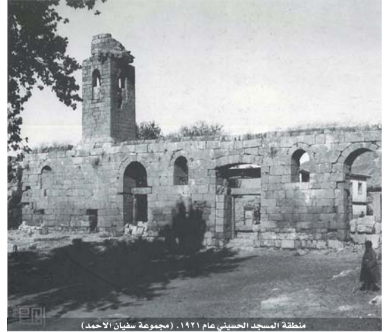
منطقة المسجد الحسيني عام ١٩٢١.

للاستفسار وابداء الملاحظات والتوثيق بالشخصيات والاماكن الواردة في الصور تأمل من القراءة الاتصال مع دائرة المكتبة الوطنية، على الارقام: /٠٦٥٦٦٢٨٤٥ / ٠٦٥٦٦٢٨٤٥ / فرعي ٢٠٩٨ البريد الالكتروني: www.nl.gov.jo