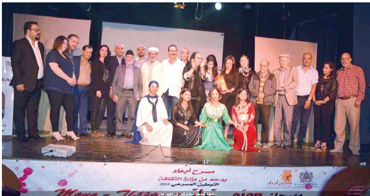
تحت إشراف المشاركين في المهرجان