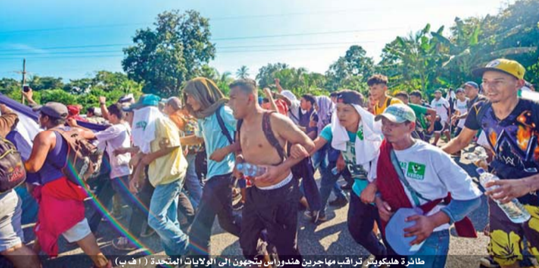
ماتر هليكويتي ترافب مهاجرين هندوراسيين يتجهون الى الولايات المتحدة

واستأنف آلاف المهاجرين من هندوراس الأحد مسيرتهم نحو الولايات المتحدة من مدينة سيوداد هيدالغو في جنوب المكسيك التي وصلوا اليها بعد عبورهم الحدود بين المكسيك وغواتيمالا. وأضاف الرئيس الأميركي «يجب على الناس أن يتقدموا بطلب للحصول على اللجوء في المكسيك أولاً، وإذا لم يفعلوا ذلك فإن الولايات المتحدة سوف ترفضهم. إن المحاكم تطلب من الولايات المتحدة القيام بأشياء لا يمكن القيام بها». وأكد الرئيس الأميركي دونالد ترمب أن إدارته تبذل قصارى جهودها، لمنع آلاف المهاجرين الهندوراسيين المتجهين إلى بلاده سيراً على الأقدام في قافلة باتت في جنوب المكسيك من تحقيق حلمهم بالوصول إلى الولايات المتحدة. وقال ترمب في تغريدة على تويتر إن «قصارى الجهود تبذل لوقف هجوم المهاجرين غير الشرعيين على حدودنا الجنوبية».