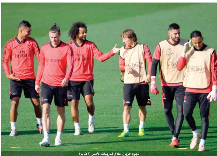
نجوم الريال خلال تدريبات الامس