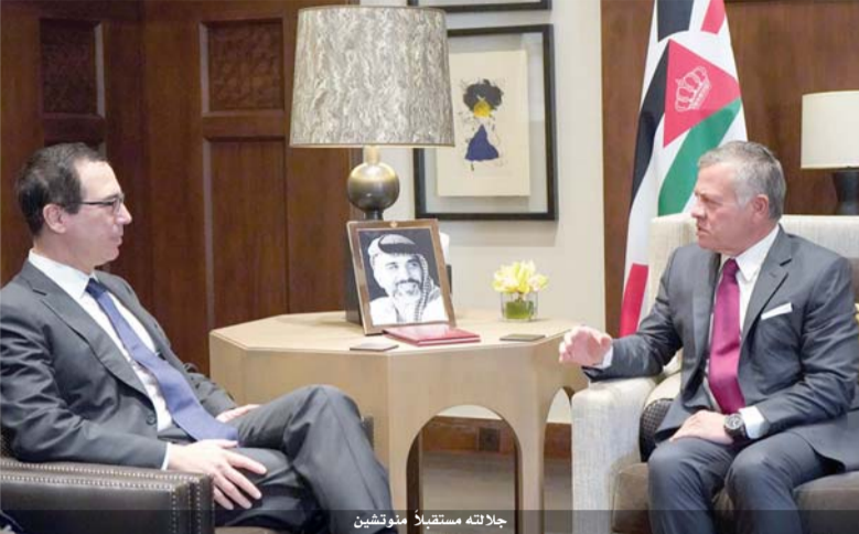
جلالته مستقبلاً منوتشين

يثمن مجلس الأعيان ويكل معاني الفخر والاعتزاز، قرار جلالة الملك عبد الله الثاني بإلغاء ملحقي الباقورة والغمر، من اتفاقية وادي عربة وعدم تجديد تأجيرها لإسرائيل. وأشار في بيان صدر أمس إلى ان المجلس يقدر عاليا الجهود الملكية الدائمة التي هي على الدوام تعزز للحملة الوطنية بين ابناء الشعب الأردني الواحد، فالقرار جاء منسجما مع إرادة الشعب بإعادة الأراضي إلى حضن الدولة الأردنية. وأكد التفاف المجلس ووقوفه خلف جلالتة وسياساته الحكيمة وقراراته الشجاعة التي تعزز سيادتنا الوطنية وقرارنا المستقل، وأكد ان القرار، يشكل رافعة وطنية لكل مؤسساتنا الوطنية، وسلطاننا الدستورية وشعبنا الذي أظهر فرحا وتأييدا لقرار جلالتة بشكل لافت للعالم اجمع، باننا في الاردن موحدون ونقف خلف جلالة الملك في كل قراراته وتوجيهاته. وقال ان المجلس يثمن عاليا