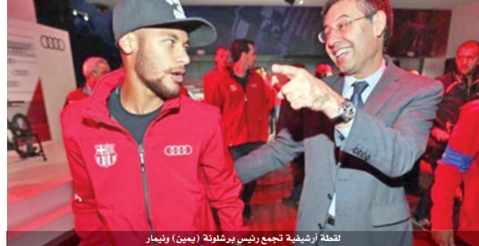
لقطة أرشيفية تجمع رئيس برشلونة (يمين) ونيمار

بجانب ذلك " وجدد بارتوميو ثقته بالمدرّب الذي قاد الفريق في موسمه الأول الى ثنائية الدوري والكأس المحليين. وخلف فاليريدي لويس التريكي بعد نهاية موسم ٢٠١٦-٢٠١٧، ووقع عقداً مع برشلونة لثلاثة مواسم، لكنه يتضرب بنداً يتيح له الرحيل في ختام الموسم الثاني (أي صيف ٢٠١٩).