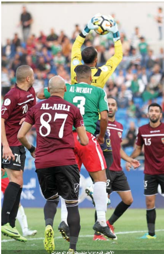
الاهلي قدم اداءً متضبطاً امام الوحدات