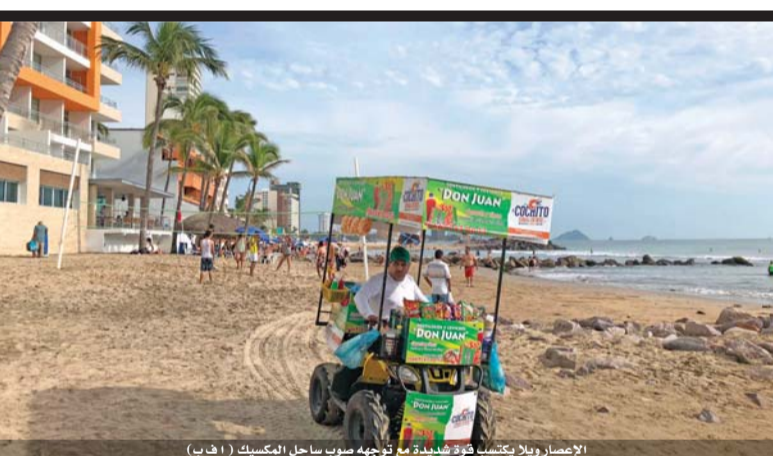
الإعصار ويلا يتكسب قوة شديدة مع توجهه صوب ساحل المكسيك

واستأنف آلاف المهاجرين من هندوراس الأحد مسيرتهم نحو الولايات المتحدة من مدينة سيوداد هيدالغو في جنوب المكسيك التي وصلوا اليها بعد عبورهم الحدود بين المكسيك وغواتيمالا. وأضاف الرئيس الأميركي «يجب على الناس أن يتقدموا بطلب للحصول على اللجوء في المكسيك أولاً، وإذا لم يفعلوا ذلك فإن الولايات المتحدة سوف ترفضهم. إن المحاكم تطلب من الولايات المتحدة القيام بأشياء لا يمكن القيام بها». وأكد الرئيس الأميركي دونالد ترمب أن إدارته تبذل قصارى جهودها، لمنع آلاف المهاجرين الهندوراسيين المتجهين إلى بلاده سيراً على الأقدام في قافلة باتت في جنوب المكسيك من تحقيق حلمهم بالوصول إلى الولايات المتحدة. وقال ترمب في تغريدة على تويتر إن «قصارى الجهود تبذل لوقف هجوم المهاجرين غير الشرعيين على حدودنا الجنوبية».