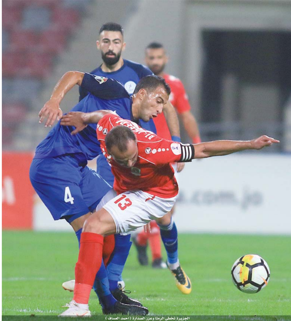
الجزيرة تخطف الرمثا وعزز الصدارة