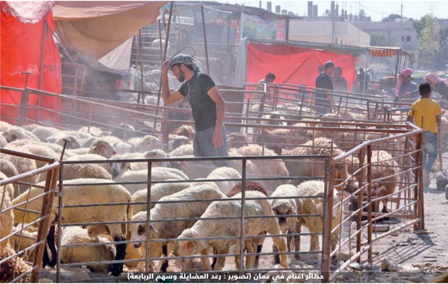
حظائر إقنام في عمان