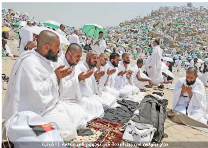
حجاج يبتهلون في جبل الرزمة قبل توجههم إلى مزدلفة (أ ف ب)