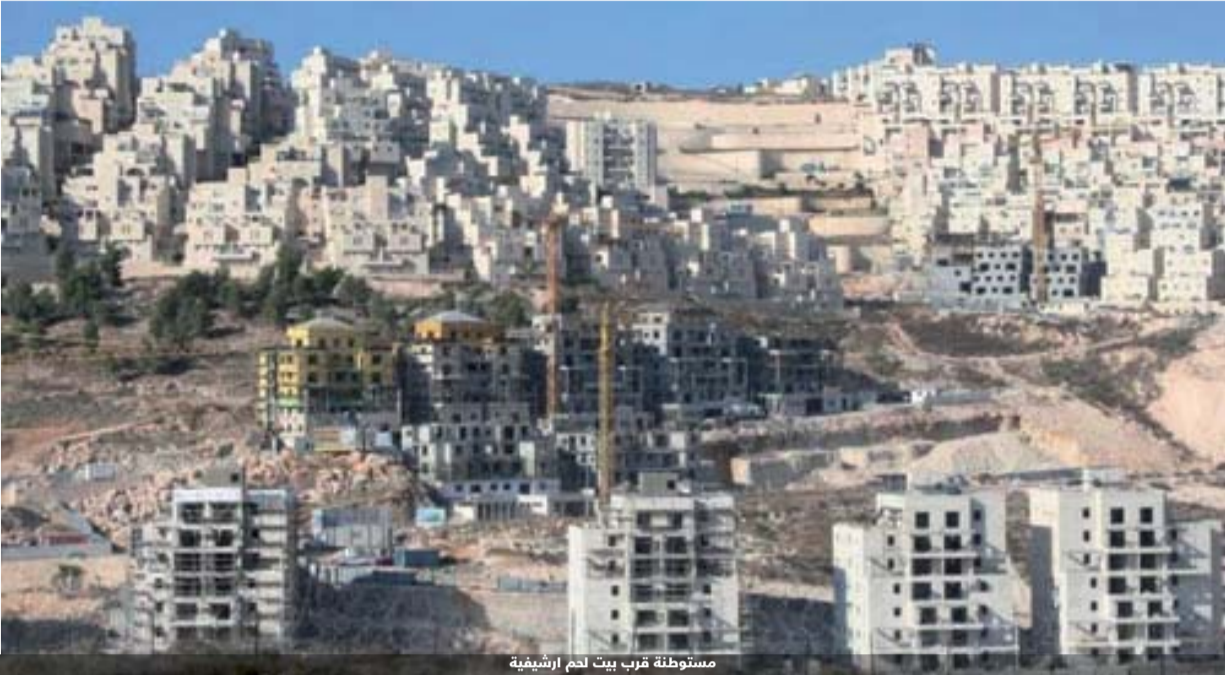
مستوطنة قرب بيت لحم ارشيفية