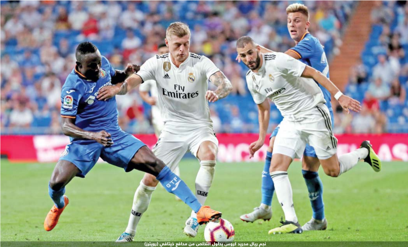
نجم ريال مدريد كروس يحاول التخلص من مدافع خيتافي