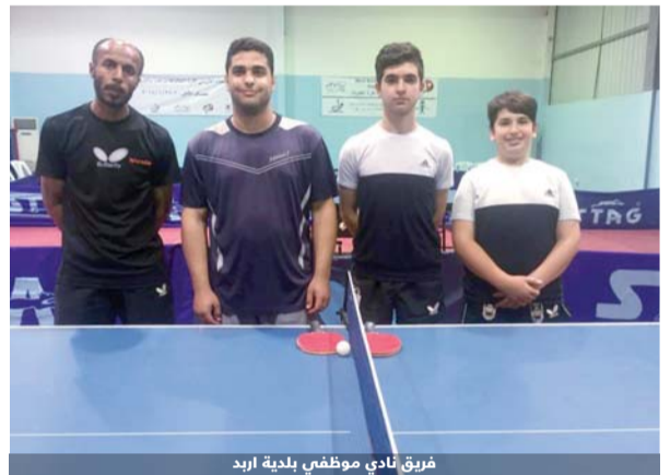
فريق نادي موظفي بلدية اربد