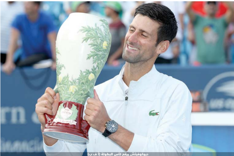
ديوكوفيتش يرفع كأس البطولة

سبق لي اهدار الفوز هنا مرات عدة، بينها ثلاث أمام روجيه (فيدرر)".