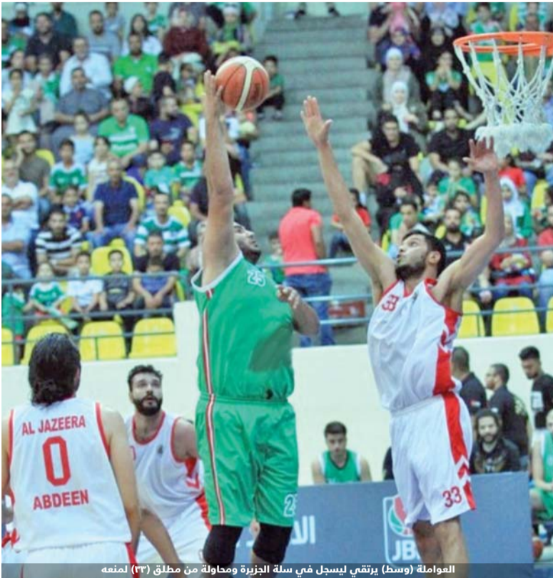
العواملة (وسط) يرتقي ليسجل في سلة الجزيرة ومحاولة من مطلق (33) لمنعه