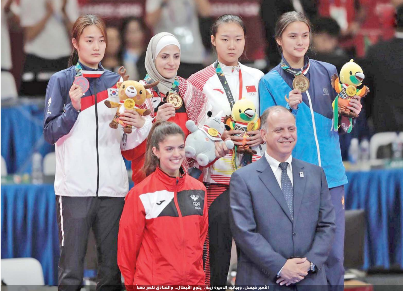
الأمر فيصل، وبجانبه الأميرة زينة، يتوج الأبطال.. والصادق تلمع ذهباً