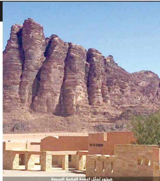
صخور تمثل اعمدة الحكمة السبعة

وادي رم يعتبر شرياناً اقتصادياً ورافعة من روافع الاقتصاد والوطني كما انه محور تنموي فاعل للحد