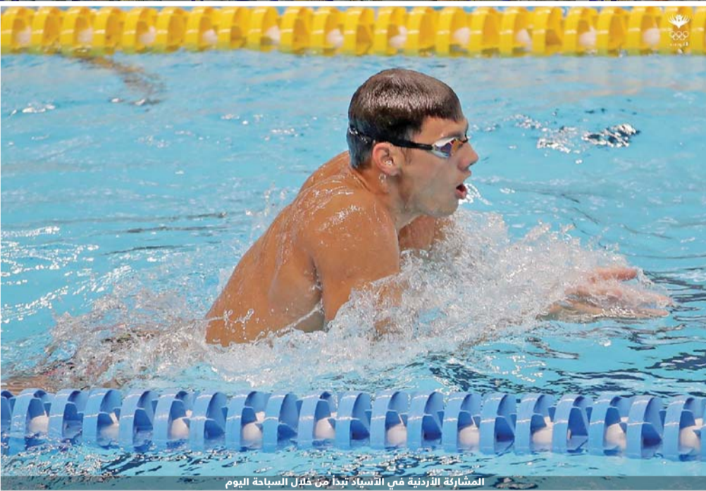
المشاركة الأردنية في التايكواندو تبدأ من خلال السباحة اليوم

وبعد كلمة للشيخ أحمد الفهد توجه فيها إلى الحاضرين في الملعب بالقول "يمكنكم أن تكونوا فخورين ببلدكم أندونيسيا"، أعلن رئيس البلاد بشكل رسمي افتتاح الألعاب التي ستقام وسط إجراءات أمنية مشددة، علماً أنها تأتي في أعقاب سلسلة من الهجمات في البلاد، ومنها اعتداءات ضد كنائس في آبار، أدت لمقتل 13 شخصاً على الأقل.