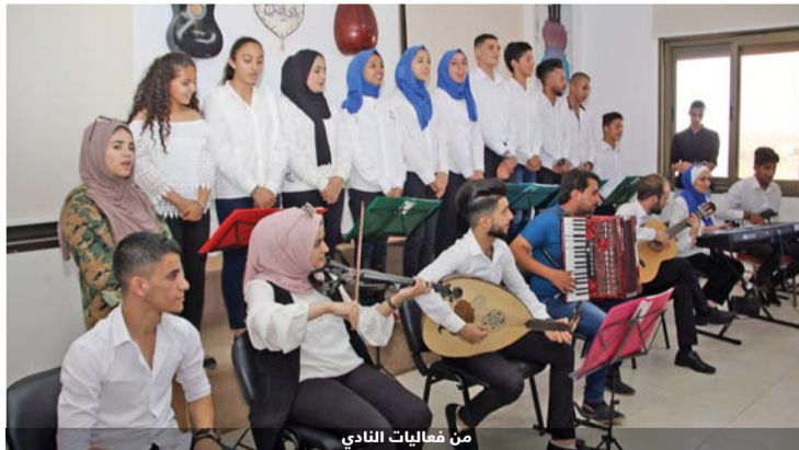
من فعاليات النادي

خصص مجلس محافظة عجلون ضمن موازنته للعام القادم 2019 مبلغ 750 ألف دينار لإنشاء مركز ثقافي لخدمة الهيئات الثقافية. وقال رئيس مجلس المحافظة الدكتور محمد نور الصمادي في تصريح إلى "الرأي" أمس إن المجلس أعطى أولوية ضمن موازنته لإنشاء المركز الثقافي لعدم توفر البنية التحتية لخدمة الهيئات الثقافية التي يزيد عددها عن 50 هيئة مشيراً إلى أن المركز سيقام على مرحلتين الأولى في عام 2019 والثانية عام 2020 ومن الممكن زيادة المخصصات ليكون هذا المبنى شمولياً ومتعدد الأغراض. وثمن الدكتور الصمادي دور وزارة الزراعة في دعم وإنشاء المبنى من خلال تخصيص أرض من الأراضي الحرجية من مبنى المحافظة.