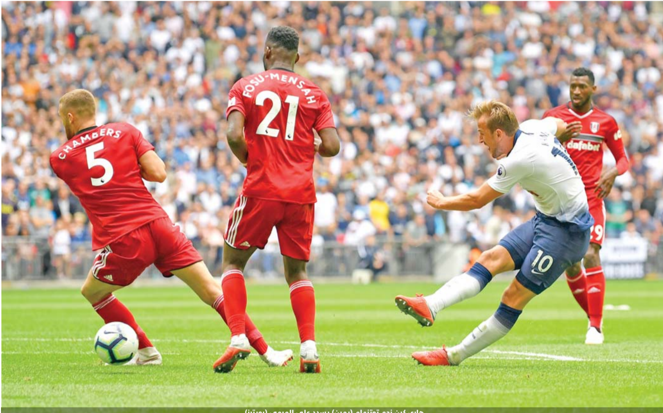
هاري كين نجم توتنهام (يمين) يسدد على المرمى