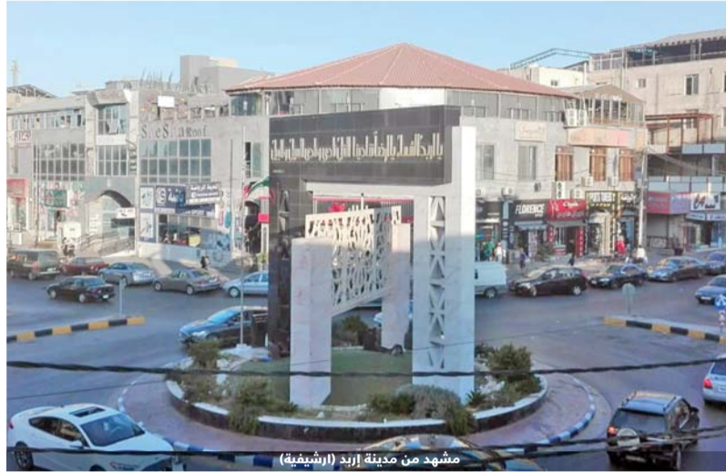
مشهد من مدينة إربد (ارشيفية)

ويقدر متابعون للشأن التعليمي والاجتماعي باللواء، عدد العاطلين عن العمل في اللواء انه يتجاوز (8) الاف شخص، في حين يتجاوز عدد الحاصلين على شهادتي الدكتوراة والماجستير الى 650 شخصا في كافة التخصصات.