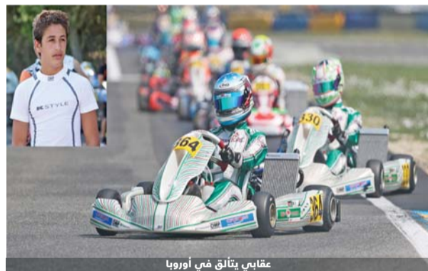
عقابي يتألق في أوروبا