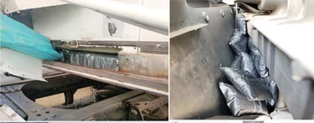
مخدرات مضيوبة في مخابئ سرية

المخدرة وضبط بحوزة الاول كمية من الحبوب والمواد المخدرة وفيما ضبط بحوزة الثاني 100 حبة من حبوب الكيتاجون المخدرة. وفي اقليمى الشمال والجنوب تم التعامل مع اربع قضايا القبيض خلالها على اربعة مروجين وبحوزتهم كميات من الحبوب والمواد المخدرة، والمجهزة والمعدة للبيع، وضبط بحوزة ادهم سلاح ناري اوتوماتيكي.