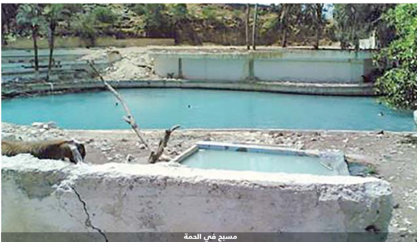
مسبح في الحمّة

وفي الاطار ذاته، اكد مصدر في سلطة وادي الاردن، ان الارض التي تتبع منها المياه وما حولها فيها تدخلت واستملاكات تتطلب اجراء التسويات اللازمة لتبيان ارض المسبح ان كانت مملوكة لصاحبها او للسلطة، لافتا الى المسألة شائكة كذلك لوجود منازل سكنية مقامة منذ عقود من الزمن وليس من الامر البسيط ازالة المنزل، لانه يقع ضمن حدود سلطة وادي الاردن. وفي اطار متصل، اوضح الرواشدة، ان جميع الاجراءات التنظيمية والقانونية وتسويات الاراضي التي كانت عاقلة بين شركة زارة والبلدية وسلطة وادي الاردن تمت تسويتها وياتت جازرة لبناء منتجع سياحي تنوي شركة زارة اقامته في المنطقة.