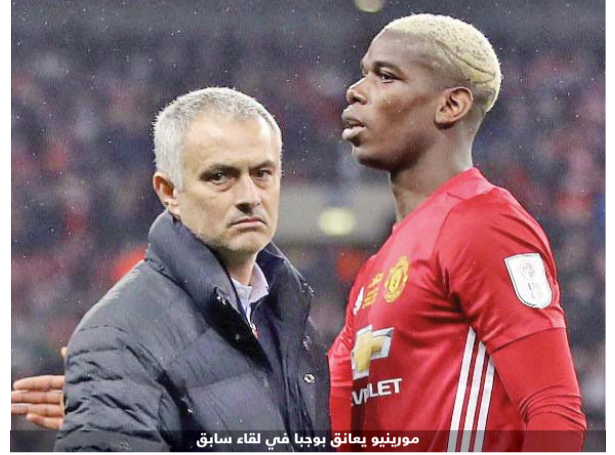
مورينيو يعانق بوجبا في لقاء سابق

منه تقديم المزيد.. يعمل بقوة ويلعب بشكل جيد ... أريده أن يلعب لصالح الفريق وهو ما يفعله. أكرر لكم أن علاقتي به على خير ما يرام.