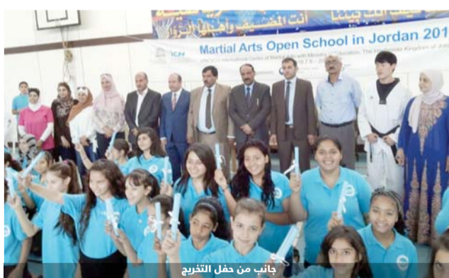
جانب من حفل التخريج