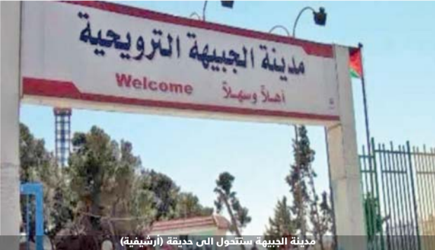
مدينة الجيبة ستحول الى حديقة (ارشيفية)