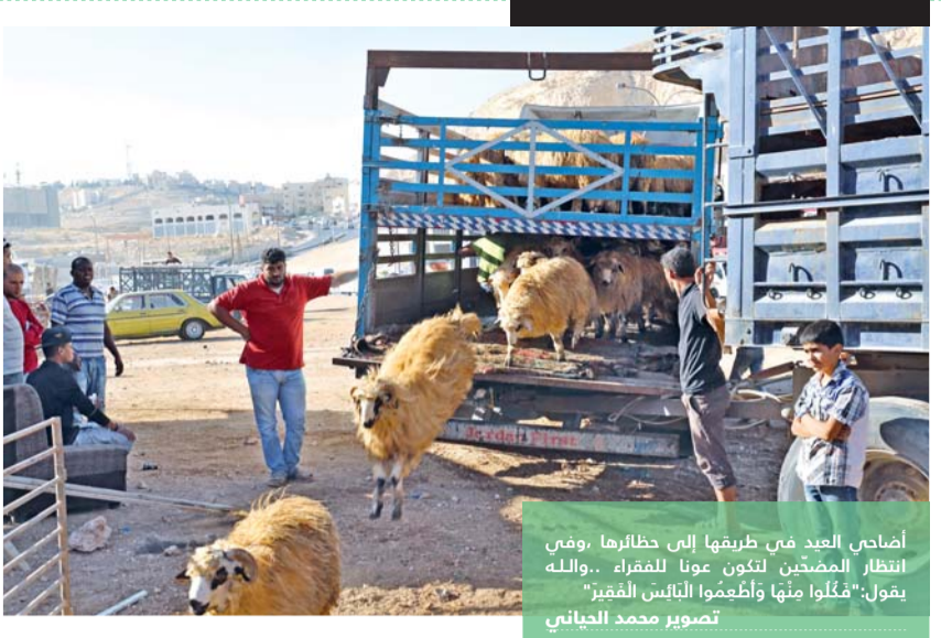
أصحابي العيد في طريقها إلى حظائرنا وفي انتظار المصحين لتكون عوناً للفقراء..والله يقول: "كُلُوا مِنْهَا وَأَطِعُوا الْإِنْسَانَ الْفَقِيرَ"