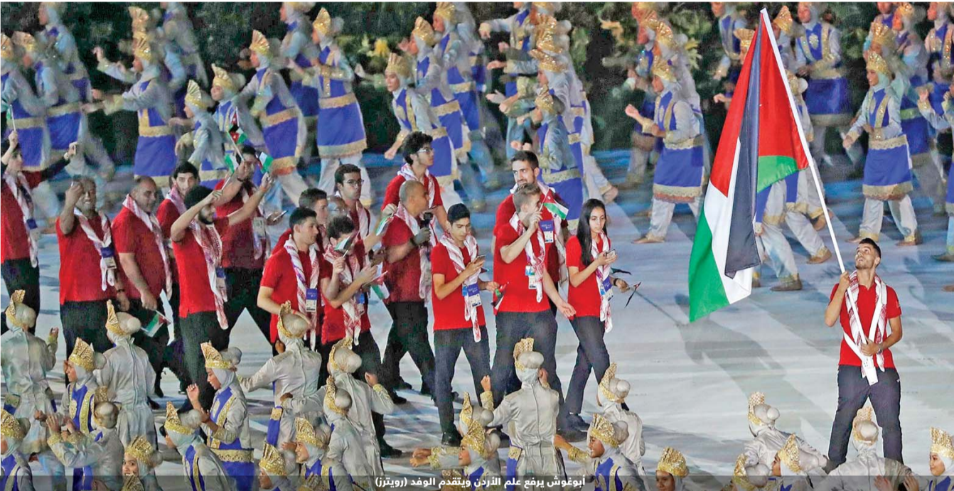
أبو غوش يرفع علم الأردن ويتقدم الوفد