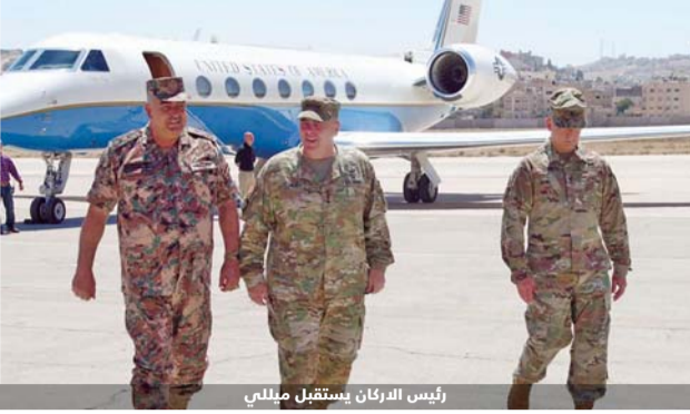
رئيس الدرغان يستقبل ميللي