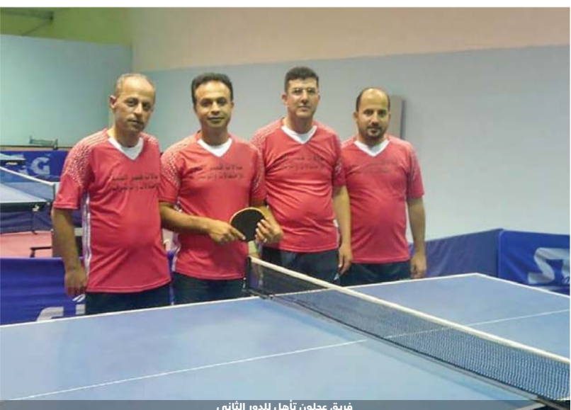
فريق عجلون تأهل للدور الثاني