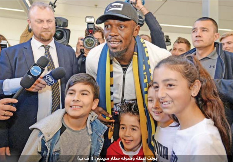
بولت لحظة وصوله مطار سيدني