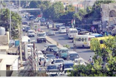
ديار الرأي سعيد

راوحت مطلية استحداث جامعة في لواء الكورة منذ اربعة عشر عاما مكانها دون ان تتحقق على ارض الواقع، وسط حالة من المخاطبات بين رئاسة الوزراء ووزارتي التعليم العالي والزراعة من خلال وجهاء ونواب اللواء على مدى سنوات خدمتهم.