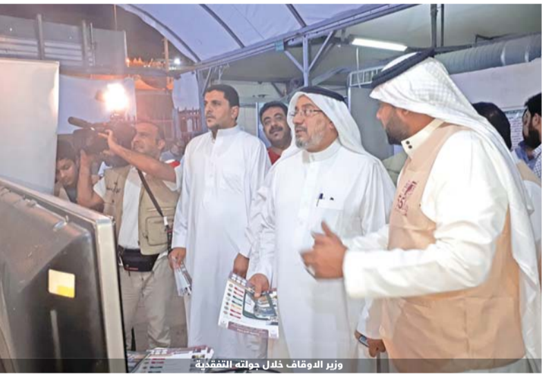
وزير الاوقاف خلال جولته التفقدية

قبيل تصديدهم لعرفات، وأكد وزير الاوقاف استخدام خيم ألمانية سيقم بها الحجاج في عرفات ومصطلحات والعبارات الدالة على الفكر المتطرف أو الحز على كره الآخر وتكفيره، وهذا جهد من الممكن ان يكون عامياً ومن الممكن أن يكون لنا مساهمتنا الداخلية فيه إن لم نجد تجاوباً عالمياً معه.