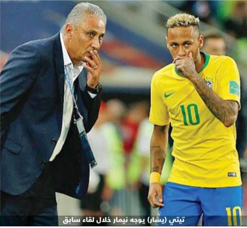
تيتي (يسار) يوجه نيمار خلال لقاء سابق

وأضاف: "لم تواجهني أي مشاكل مع العمل يبدو أسهل كثيراً برفقته خاصة أمور التحكيم وتعرضه للقرعة هو وفيليب كوتيني".