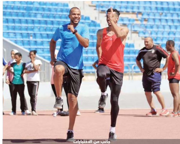
جانب من الاختبارات