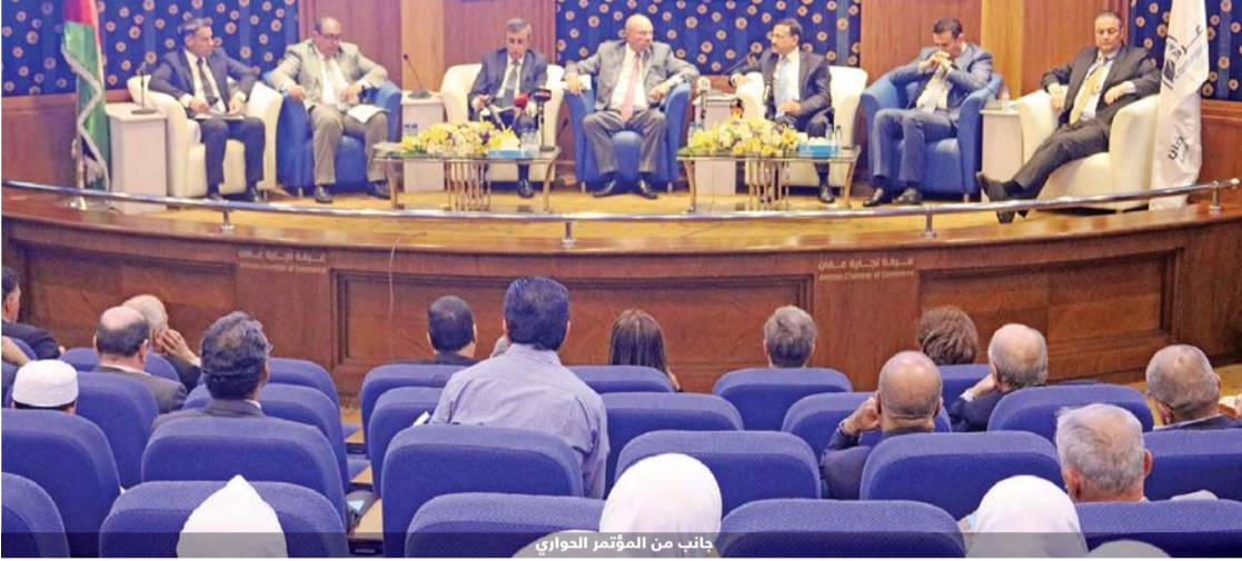
جانب من المؤتمر الحواري

تتوقع الدراسة زيادة حجم تلك الإيرادات إلى نحو (123) مليون عند حد الاعفاء (9 و 18) ألف دينار للفرد والأسرة على