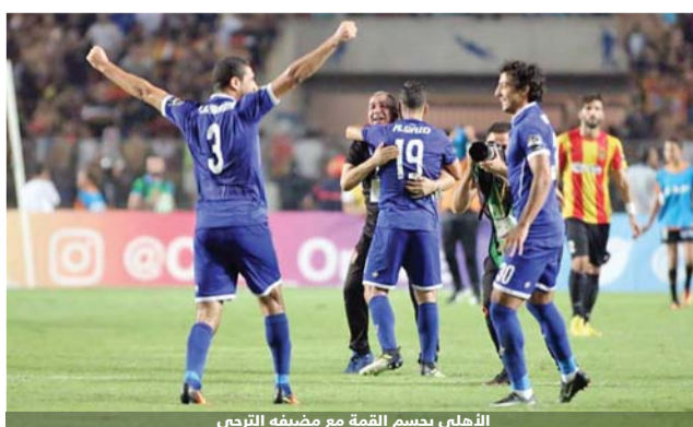
الأهلي يحسم القمة مع مضيفه الترجي

وتراجع لاعبو الأهلي لاستيعاب ضغط الترجي، قبل أن يتمكن أزارو على عكس محريات المباراة، بتسجيل الهدف مستغلا خطأ من الدفاع (32). وأشار مدرب الأهلي الفرنسي باتريس كارتيرون إلى أن لاعبيه "قدموا مباراة كبيرة خاصة في المستوى الدفاعي" وأحسنوا استغلال الفرص، مشيرا إلى أنه الأهلي يعزز اللعب على صدارة المجموعة في الجولة الأخيرة.