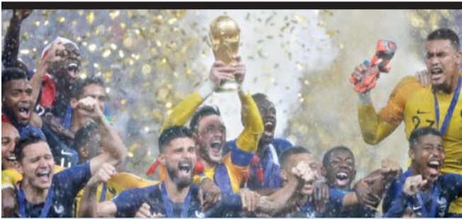
فرنسا بطل كأس العالم للمرة الثانية

قال الأمن العام أن ادارتي السير والدوريات الخارجية ومختلف مديريات الشرطة وشرطة النجدة حرروا 7586 مخالفة استخدام الهاتف النقال أثناء القيادة في اول ايام الحملة في مختلف مناطق المملكة، و اضاف ان كوادر ادارة السير ضبطت 5877 مخالفة و510 مخالفات ضبطتها ادارة الدوريات الخارجية.