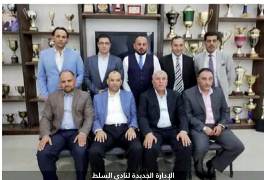
الإدارة الجديدة لنادي السلط