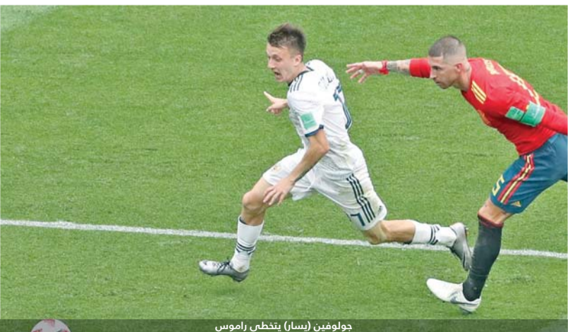
جولوفين (يسار) يتخطى راموس

هيرفينغ لوزانو قدم المنتخب المكسيكي أداءً متمماً في كأس العالم في ظل التشكيلة المتنامية التي يمتلكها الفريق اللاتيني وكان لوزانو أحد أبرز لاعبي منتخب بلاده في البطولة فقد سجل هدف الفوز على منتخب ألمانيا إلى جانب صناعته لهدف آخر ويتميز ذو الـ22 عاماً بقدراته على المراوغة ومشاركته في خلق الفرص ويلعب لصالح فريق إندهوفن الذي كان أحد أهم نجومه في الدوري الهولندي.