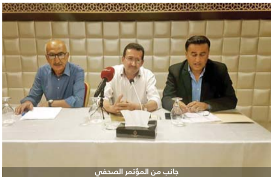
جانب من المؤتمر الصحفي