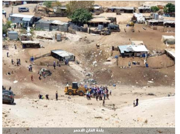
بلدة الخان الأحمر