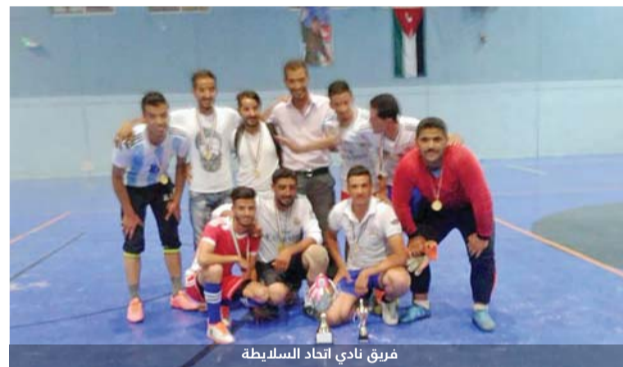
فريق نادي اتحاد السلايطة