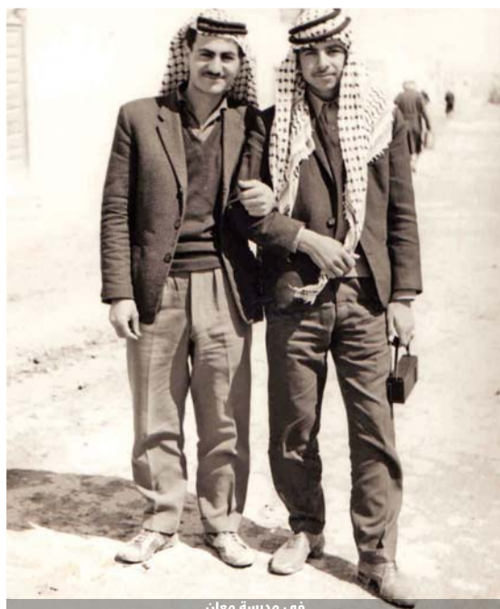
في مدرسة معان