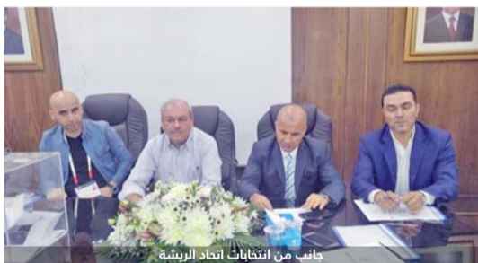
جانب من انتخابات اتحاد الريشة