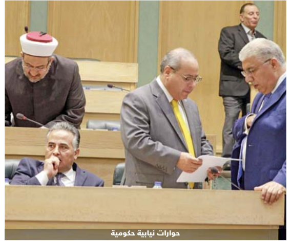
حوارات نيابية حكومية

استراتيجية وطنية لقطاعات المياه والكهرباء والطاقة