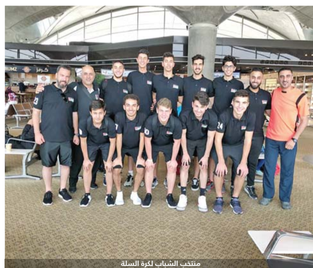
منتخب الشباب لكرة السلة

ويتم خلال الاجتماع الفني للبطولة تحديد نظام البطولة حيث تلتقي الفرق سوياً في الدور الاول وفق نظام الدوري من مرحلة واحدة وفي الدور الثاني الذي يقام في 23 الحالي يلتقي المتصدر مع صاحب المركز الرابع وصاحب المركز الثاني مع صاحب المركز الثالث، ويتأهل