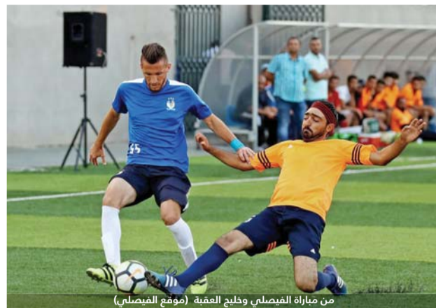
من مباراة الفيصلي وخليج العقبة