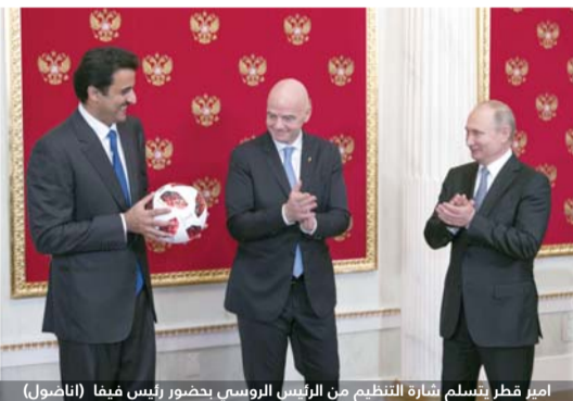
أمير قطر يتسلم شارة التنظيم من الرئيس الروسي بحضور رئيس فيفا