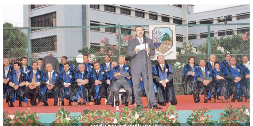
حفل تخرج طلبة جامعة بيروت العربية