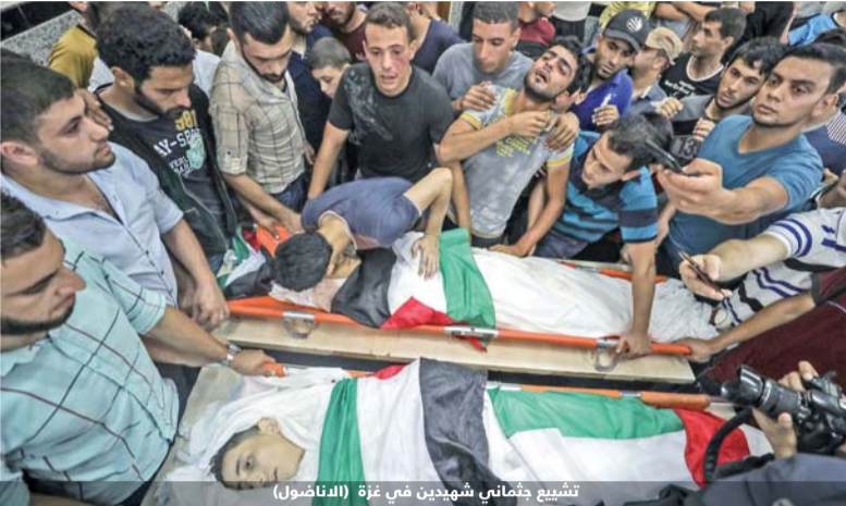
تشيع جثمانى شهيدين في غزة