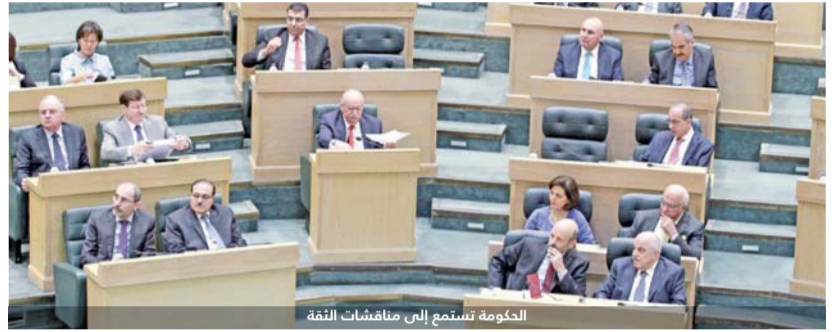
الحكومة تستمع إلى مناقشات الثقة

دعم القطاع الزراعي واستراتيجية وطنية للمياه والكهرباء والطاقة