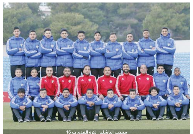
منتخب الناشئين لكرة القدم ت 16