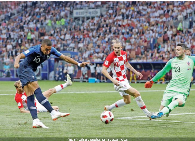
مبابي سجل وازرع مدافعي كرواتيا (رويتز)

توج المنتخب الفرنسي لكرة القدم بلقب كأس العالم لكرة القدم للمرة الثانية في تاريخه، بفوزه على نظيره الكرواتي 2-4 في المباراة النهائية للمونديال روسيا التي أقيمت بينهما على ملعب لوجنيكي في موسكو. وأضاف المنتخب الفرنسي إلى سجله لقب مونديال 2018، بعد 20 عاماً من تتويجه للمرة الأولى على أرضه عام 1998. فيما أخفق المنتخب الكرواتي، في إحراز اللقب للمرة الأولى في تاريخه، لكنه كسب الاحترام بعدما بلغ المباراة النهائية للمرة الأولى أيضاً، ليبقى بذلك مونديال روسيا على نادي الثمانية الذي يضم المنتخبات التي توجت باللقب. ويات مدرب "الدبوك" ديديه ديشامب، ثالث شخص في تاريخ اللعبة يحرز لقب كأس العالم كلاعب ومدرب، بعد البرازيلي ماريو زاغالو والألماني فرانزيس بكنبارو. وكان ديشامب قائد تشكيلة المنتخب عام 1998.