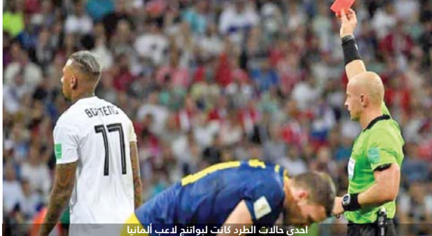
احدى حالات الطرد كانت ليوانج لاعب ألمانيا