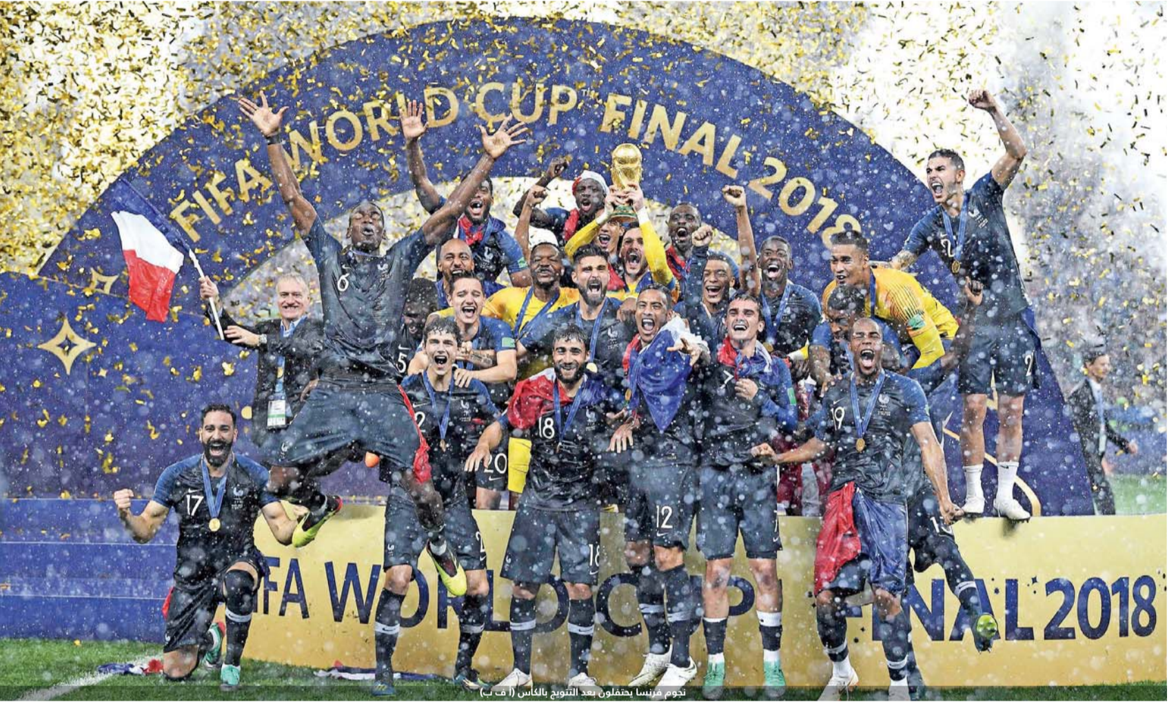
تقوم فرنسا بحفلات بعد التتويج بالكأس