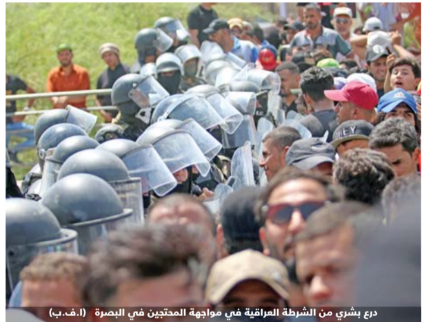
درع بشري من الشرطة العراقية في مواجهة المحتجين في البصرة