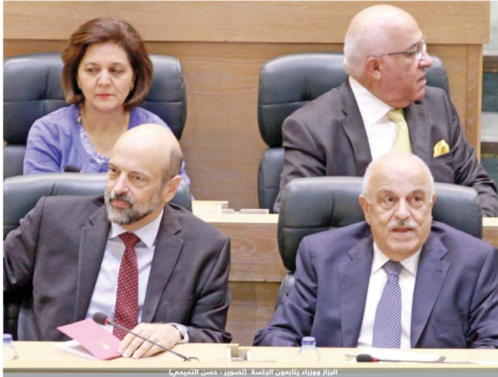
الرزاز ووزراء يتابعون الجلسة

واكدت الكلمات اهمية دعم الحكومة القطاع الزراعي والمزارعين والعمل على إيجاد اسواق للمنتجات الزراعية