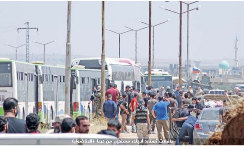
حافلات تستعد لاجلاء مسلحين من درعا