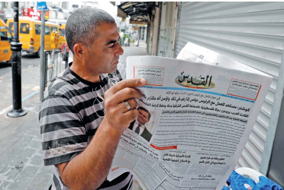
فلسطيني يقرأ مقابلة كوشنير مع صحيفة القدس

قضايا الحل النهائي التفاوضية الواحدة تلو الأخرى وإسقاطها من المفاوضات تماماً، مؤكداً حتمية فشل ما تحاول واشنطن الترويج له وتسوية من مخططات ومؤامرات لتصفية القضية الفلسطينية.