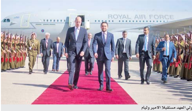
ولي العهد مستقبلاً الأمير وليام