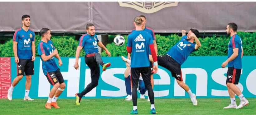
إيسكو (الثاني من اليمين) يناهض زملاءه على الكرة خلال تدريبات المنتخب الإسباني