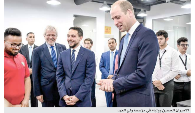
الاميران الحسين ووليام في مؤسسة ولي العهد