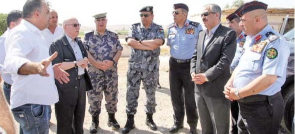
المبيضين والكسبي خلال تفقدهما الطريق

والمطلوبات الموضوعية لتنفيذ هذا المشروع الوطني بحذاقيها وانجازها خلال الفترة الزمنية المحددة مسبقا.