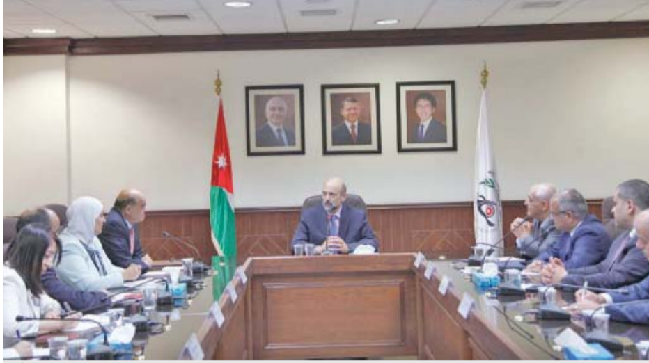
المرزاز خلال زيارته لهيئة النزاهة ومكافحة الفساد