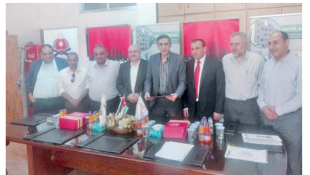
جانب من توقيع اتفاقية التعاون مع مستشفى الخنساء