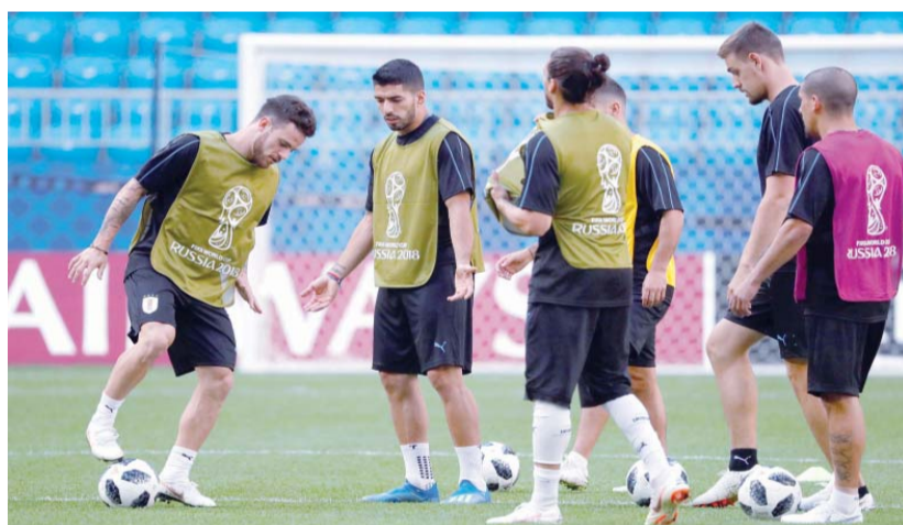
جانب من تدريبات الأوروغواي

ساراما - أ ف ب - بعدما وضعت خلفها الانتقادات وبلغت الدور ثمن النهائي من كأس العالم في كرة القدم للمرة الأولى منذ الأولي الاتحاد السوفياتي، تتطلع روسيا المضيفة الى حسم صدارة المجموعة الأولى عندما تتواجه اليوم الإثنين مع الأوروغواي في سامارا. ضمن المنتخبان تأهلها الى ثمن النهائي على حساب ممثلي العرب مصر والسعودية اللذين خسرا في الجولتين الأولى ودعا النهائيات. وتأمل روسيا التي دخلت النهائيات على وقع الانتقادات والخوف من تكرار سيناريو جنوب أفريقيا، المنتخب المضيف الوحيد الذي انتهى مشاوره عند الدور الأول عام ٢٠١٠، في ان تؤكّد المستوى الذي قدمته في مباراتها ضد السعودية ومصر حين اكتسحت الأولى ٥-٠، وفازت على الثانية ١-٣ بفضل تألق دينيس تشيريتشيف (٣ اهداف) وأرتيم دزويبا (هدفاً). ولقب لاعبو المدرب ستانيسلاف تشيريتشيف الامور رأسا على عقب منذ صافرة بداية النسخة ال ٢١ من المونديال، وخالف المنتخب الذي دخل البطولة كأدنى المصنفين عالميا بين المنتخبات ٣٢٢ المشاركة (٧٠)، التوقعات، لاسيما بعد