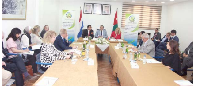
الحنيفات مستقبلاً الوفد الهولندي

السلط - بترا - بحث وزير الزراعة المهندس خالد الحنيفات ومدير المركز الوطني للبحوث الزراعية الدكتور نزار حداد مع وزيرة التجارة الخارجية والتعاون الإنمائي الهولندية سيفريد كاغ والوفد المرافق لها سبل تعزيز التعاون في مجالات القطاع الزراعي وتطوير العملية الزراعية في ظل محدودية المياه.