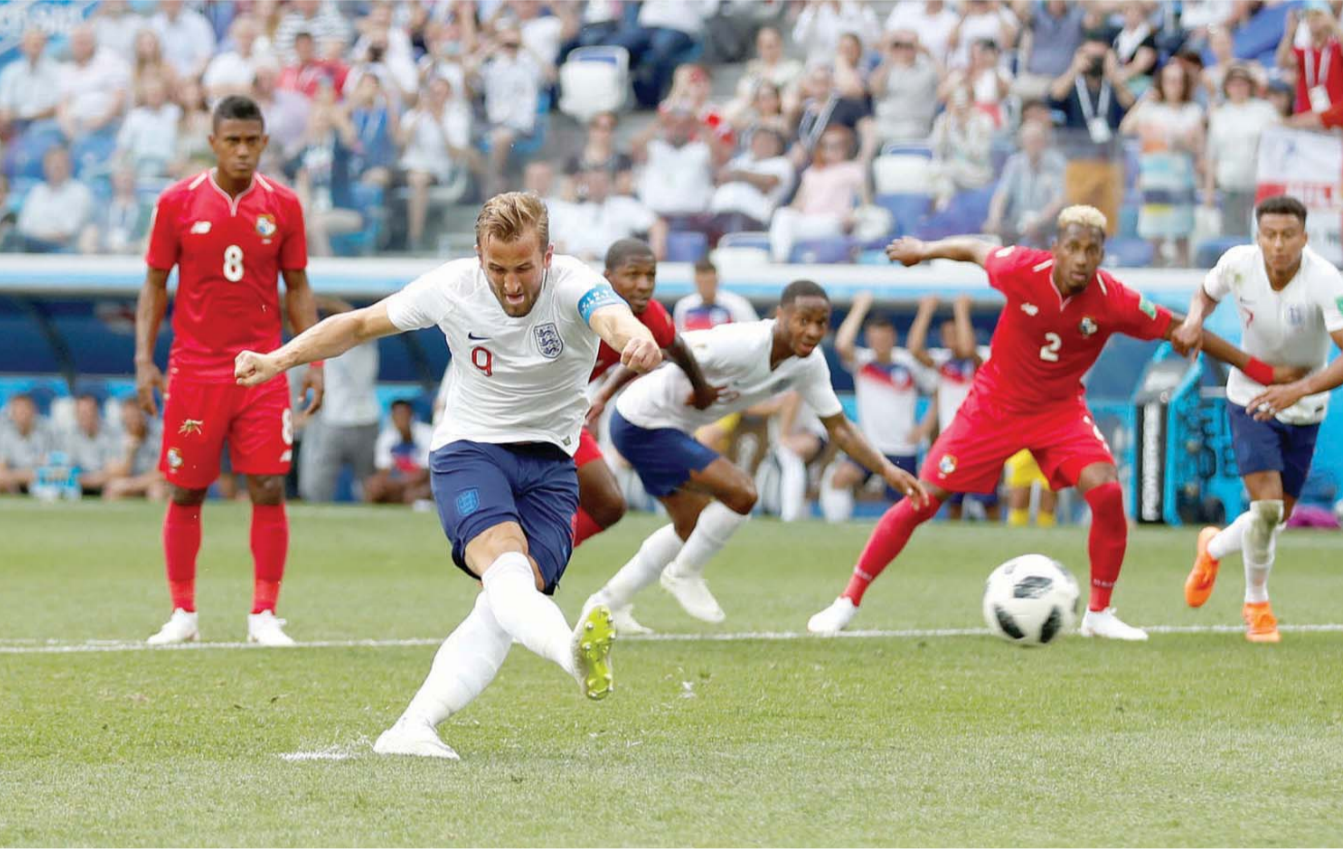
هارى كين يسدد كرة الهدف الثاني في مرمى بنما

لتصدم محاولات هارو كين وتغاطل حارس بنما. واحتسب الهدف لصالح كين، وبه تصدر ترتيب الهادفين. وحققت بنما هدف الشرف في الدقيقة ٧٨، عندما ارتقى فيليبى بالوي الذي دخل قبل تسع دقائق بدلا من جابريال جوميز، ليتابع بالقدم اليمنى ركلة حرة جانبية نفذها البديل الآخر ريكاردو أفيلا.