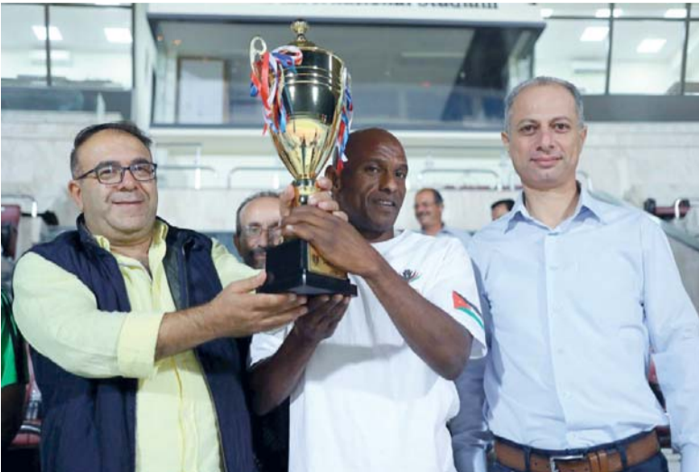
جانب من التتويج

عمان - الرأي - سيطر نادي يرموك البقعة على لقب منافسات الرجال في بطولة الأندية «المطري» لألعاب القوى التي اختتمت فعالياتها الليلة قبل الماضية وشارك فيها (٥٠٠) عداء وعداءة يمثلون (٢٥) نادياً.