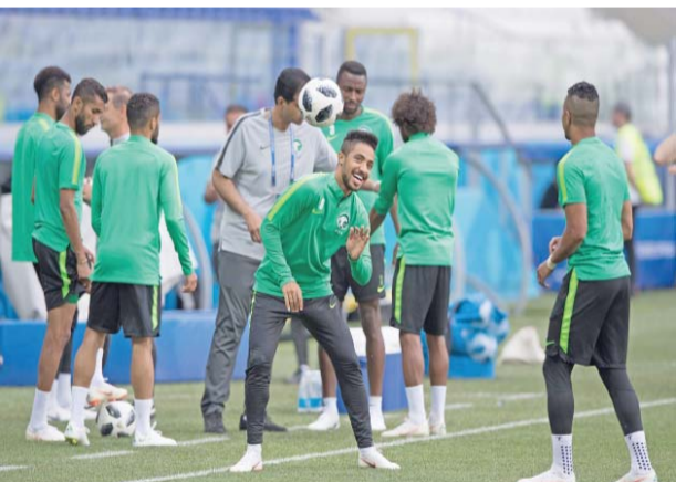
جانب من تدريبات المنتخب السعودي