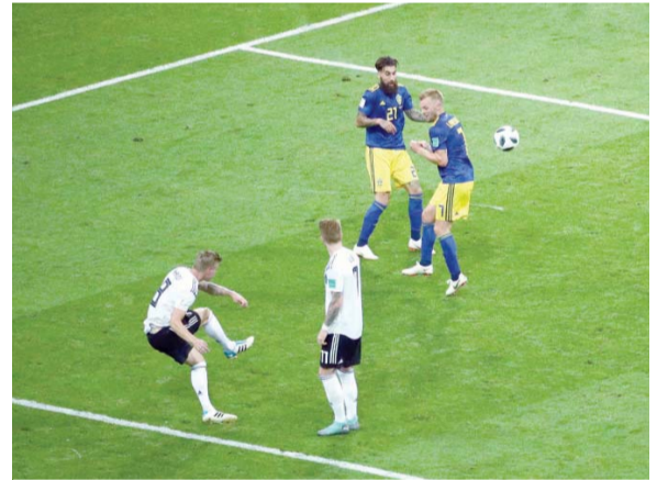
كروس لاعب ألمانيا يسدد كرة هدف الفوز على مرمى السويد

سوتشي - أف ب - أُنقذ طوني كروس المنتخب الألماني لكرة القدم امس الاول من تعادل يطعم الخسارة أمام السويد، مسجلا هدف الفوز لصالح أبطال العالم في الوقت القاتل من المباراة ضمن المجموعة السادسة لمنافسات مونديال ٢٠١٨. وفي مباراة مثيرة في سوتشي، تقدمت السويد عبر أول توفون في الدقيقة ٣٢، قبل ان تعادل ألمانيا عبر ماركو رويس (٤٨) وتنتزع النقاط الثلاث عبر كروس (٥٠٩٠)، ليعوض المانشافت خسارته في الجولة الأولى أمام المكسيك (١-٠)، ويبقى على أماله في بلوغ ثمن النهائي، علما انه أكمل المباراة بعشرة لاعبين بعد طرد مدافعه جيروم بواتنج (٨٢). وتساوت ألمانيا في عدد النقاط (٣) مع السويد الفائزة في الجولة الأولى على كوريا الجنوبية ١-٠، خلف المكسيك التي تتصدر بست نقاط بعد تحقيقها امس الاول ايضا فوزها الثاني تواليا، وذلك على حساب كوريا الجنوبية ١-٢. وستكون الجولة الثالثة الأخيرة التي تقام الأربعاء المقبل، حاسمة في تحديد هوية المتاهلين الى الدور المقبل، فتلقت ألمانيا مع كوريا الجنوبية في قازان، والسويد مع المكسيك في كياترينبورج. وتحتاج ألمانيا للفوز على كوريا الجنوبية بفارق أكثر من هدف لبلوغ ثمن النهائي بصرف النظر عن نتيجة المباراة بين السويد والمكسيك، علما ان أي نتيجة أخرى ستدخل أبطال العالم أربع مرات في حسابات مقعدة. واكتسب هدف كروس قيمة مضاعفة على المستوى الشخصي للاعب ريال مدريد الإسباني، اذ كانت تمريرته الخاطئة سببا في الهدف السويدي. وقال كروس، بالطبع الهدف الأول كان بعد خطأ مني (... الآن علينا ان نتعافى وليس لدينا وقت كثير قبل ان نكون مضطرين للفوز على كوريا، وفيها (المباراة المقبلة) علينا ان نلعب بشكل مقنع.