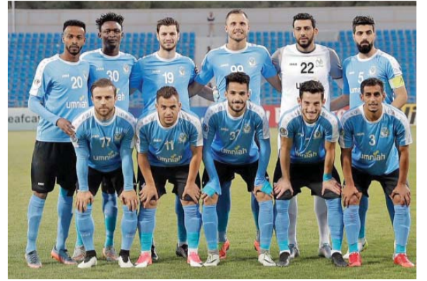
الفيصلي ينطلق بتحضيرات جادة ويتأهب للصفقات