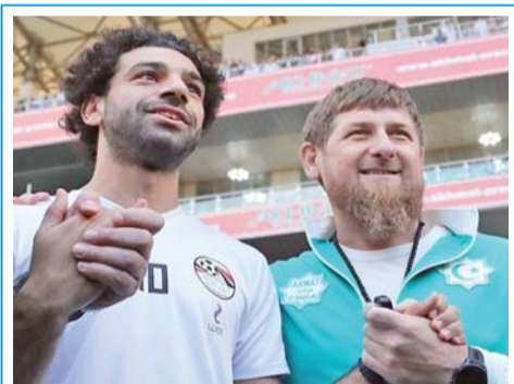
الرئيس الشيشاني والنجم صلاح