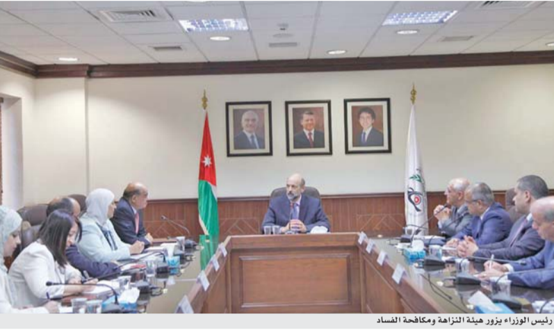
رئيس الوزراء يزور هيئة النزاهة ومكافحة الفساد