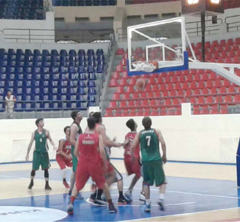
احدى سلات المنتخب الذي هزمت شبك الفريق الضيف