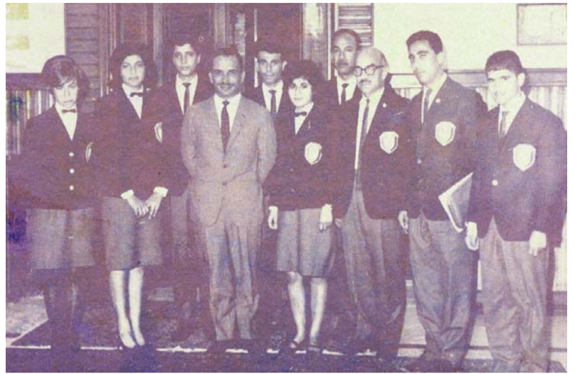
المغفور له بإذن الله الملك الحسين بن طلال في اول بطولة تنس للطلاوة تعود الصورة الى السبعينيات

للاستفسار وابداء الملاحظات والتوثيق بالشخصيات والاماكن الواردة في الصور تأمل من القراء الاتصال مع دائرة المكتبة الوطنية، على الارقام: ٠٦٩٦٦٢٨٥٤ / ٠٦٩٦٦٢٨٥٤ / فريسي ٢٠٩٨ البريد الإلكتروني: www.nl.gov.jo