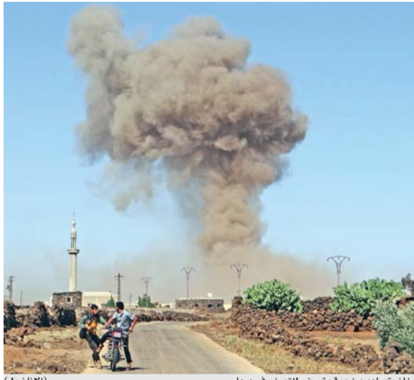
دخان يتصاعد من موقع تعرض للقصف في درعا

عمان - الرأي - وكالات - أكد الأردن أنه لن يتحمل تبعات التصعيد في الجنوب السوري، واستقبال مزيد من اللاجئين، وذلك تزامناً مع تواصل قصف قوات النظام وداعميه مناطق المعارضة في محافظة درعا. وجاء ذلك في تغريدتين متتاليتين لوزير الخارجية وشؤون المغتربين أيمن الصفدي، امس الأحد، على حسابه الرسمي في «تويتر».