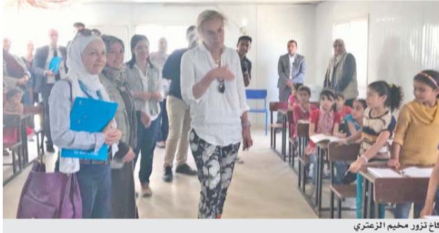
كاخ تزور مخيم الزعتري

المفروق - بترا - قالت وزيرة التجارة الخارجية والتعاون الدولي الهولندية سيجريد كاخ خلال زيارتها امس لمخيم الزعتري للاجئين السوريين «اننا هنا لنرى كيف يجيد الاردن إدارة هذه الازمة بطريقة انسانية تحفظ كرامة اللاجئين السوريين في مخيم الزعتري خاصة في حصولهم على فرص التعليم».