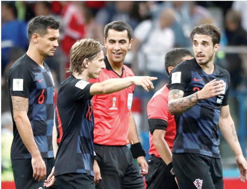
لوفرن يشيد بموطنه مودريتش

من جانبه، رد إيهاب لهيطة مدير منتخب مصر على التقرير قائلا في تصريحات حصرية لموقع «فيجول» المصري: «لم أسمع شيئا عن رغبة محمد صلاح في الاعتزال الدولي عقب كأس العالم. منتخب مصر لا يتحدث عن الأمور بشكل ديني أو سياسي». وأضاف لهيطة «لو أن هناك أي ضيق من وجود معسكر منتخب مصر في الشيشان، فيجب أن يتوجه الناس بالسؤال إلى الاتحاد الدولي وليس لنا. منتخب مصر ليس طرفا في هذه القضية». يذكر أن منتخب مصر قضى معظم فترات تواجه في روسيا بالعاصمة الشيشانية جروزني لتكون مقرا للإقامة والتدريبات، بالتنسيق مع الاتحاد الدولي لكرة القدم.