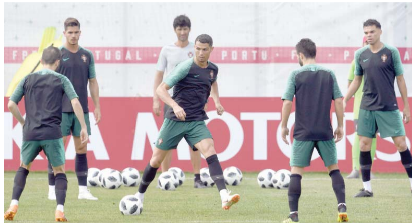
رونالدو (وسط) يحاول السيطرة على الكرة خلال تدريبات البرتغال