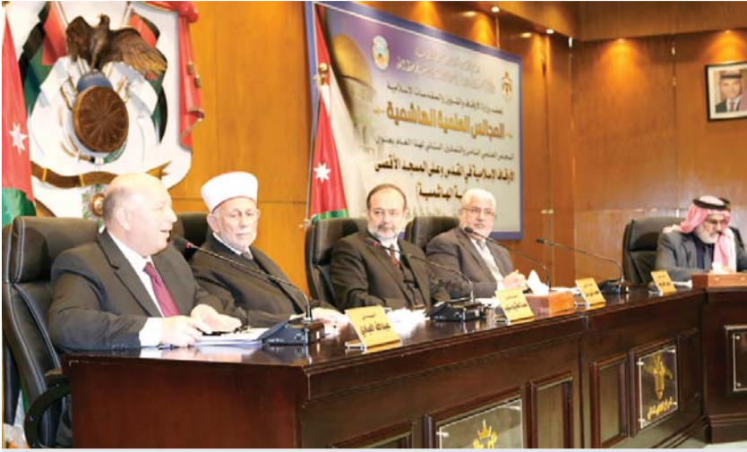
مشاركون في المجلس العلمي الهاشمي الثامن والثمانين (بترا)

مندوباً عن الملك.. الأمير فيصل يري المجلس العلمي الهاشمي الثامن والثمانين