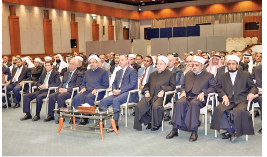
مندوب الملك خلال رعايته المجلس العلمي امس