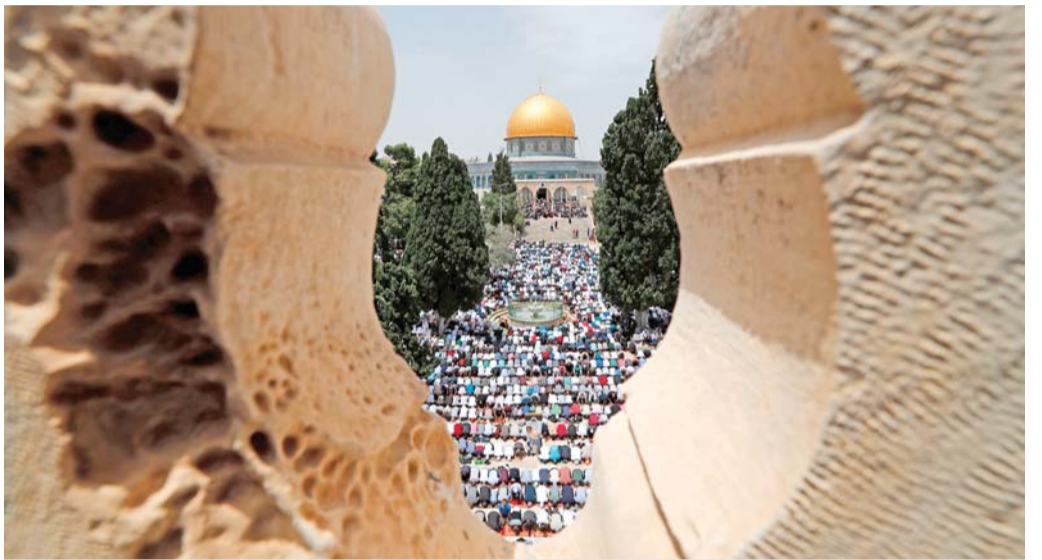
باحات الأقصى تجمع بالمصلين

أيدت فيه استخدام الجيش القوة الفتاكة ضد المتظاهرين الفلسطينيين على الحدود بين غزة والدولة العبرية. وفي حكمه الواقع في ٤١ صفحة والصادر باجماع قضائها الثلاثة رفضت المحكمة التماساً تقدمت به في نيسان منظمات حقوقية إسرائيلية وفلسطينية وتطالب فيه بإجبار الجيش على التوقف عن إطلاق الرصاص الحي على المتظاهرين الفلسطينيين على الحدود بين قطاع غزة وإسرائيل.