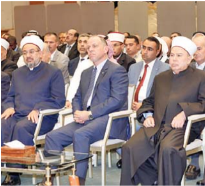
الأمير فيصل يرعى المجلس (بترا)

عمان - بترا - مندوباً عن جلالة الملك عبدالله الثاني، رعى الأمير فيصل بن الحسين، امس الجمعة، المجلس العلمي الهاشمي الثامن والثمانين، الثاني لهذا العام، الذي تنظمه وزارة الأوقاف والشؤون والمقدسات الإسلامية في المركز الثقافي الملكي بعنوان (الأوقاف الإسلامية في القدس وعلى المسجد الأقصى «الرعاية الهاشمية»).