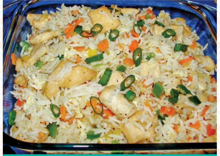
ارز بالدجاج والجبنه

نصف كيلو دجاج مقطع مخلي زبدة بصلة ملح فلفل أسود نصف كوب كريما كوب حليب كوب مرقه جبنه شيدر جبنه بارميزان ٢ فص ثوم مفروم