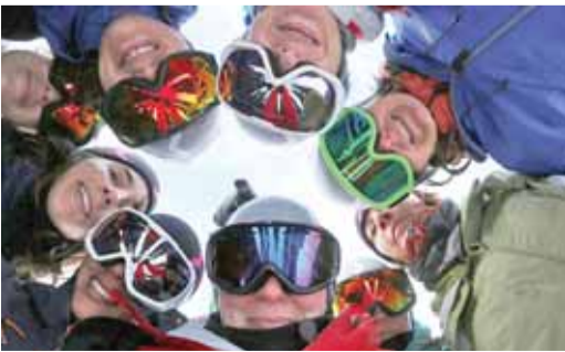
سيدات يعتلين القمة

سوليفانيا، الجدير بالذكر أن الفريق المكون من ١١ سيدة من أوروبا والوطن العربي خطط للرحلة منذ عامين إضافة إلى