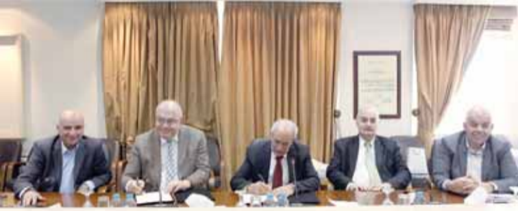
هلسة والساكت يوقعان الاتفاقية

بإعداد وتقديم المحاضرات والدورات التدريبية بمجالات العقود الانشائية والتحكيم وحل النزاعات بهدف تعميم ثقافة التحكيم وبما يمثله من أهمية لقطاع الانشاءات.