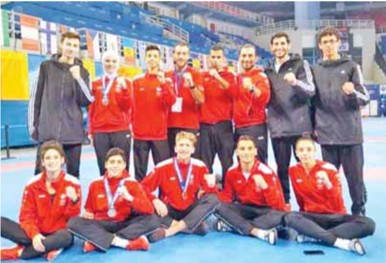
القرار يخدم التايكواندو في قادم الاستحقاقات

عمان - الرأي - قررت لجنة الطعون والعقوبات في اتحاد التايكواندو، بناء على توصية من سمو الأمير راشد الحسن رئيس الاتحاد، رفع العقوبات السارية على منظومة لعبة التايكواندو. جاء ذلك بعد الاجتماع الذي عقدهته اللجنة أمس الأول في مقر الاتحاد برئاسة عضو مجلس إدارة الاتحاد المقدم علاء الجعافرة وحضور أعضاء اللجنة مخلد العساف، طارق أبو سبيتان، فؤاد جروان ومدير الاتحاد وانل أبو رحيم. حيث قامت اللجنة بدراسة جميع اللوائح وحالات العقوبات، لتقرر اللجنة وبالإجماع إصدار لائحة النظام والسلوك والعفو عن جميع العقوبات الصادرة عن الاتحاد سارية المفعول، وذلك لمنحهم الفرصة للمشاركة في نشاطات الاتحاد بما يتوافق مع اللوائح والأنظمة والتعليمات الصادرة عن الاتحاد الأردني للعبة، والتي تتماشى مع اللوائح الدولية. القرار برفع العقوبات السارية عن عدد كبير من أطراف منظومة التايكواندو، لاقي استحسان واسع في أوساط اللعبة حيث جاء بتوصية من سمو الأمير راشد بن الحسن، حين أوعز للجنة الطعون والعقوبات بدراسة لائحة العقوبات السارية، لتواكب التطور والانجازات التي تشهدتها التايكواندو الأردنية على الصعيدين العالمي والعربي والإقليمي، وتجسيدا للنظرة المستقبلية لأسرة الاتحاد بتوفير البيئة النموذجية القادرة على فرز خامات