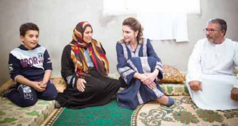
جلالتهما تتفقد أوضاع إحدى الأسر المستفيدة من منح الديوان الملكي للتشغيل

استعرضت مستفيدة منهن مجموعة من التحديات والحلول المقترحة. وعبرت الملكة رانيا عن سعادتها بزيارة المفرق ولقاء أهلها، وقالت أن المفرق لطالما كان لها مكانة كبيرة عند الهاشميين وهي الدرع الحصين الذي يحمي حدودنا وباب الكرم المفتوح بالهمة والعطاء والانسانية، ومضرب مثل في المواخاة والتضحية والايثار.