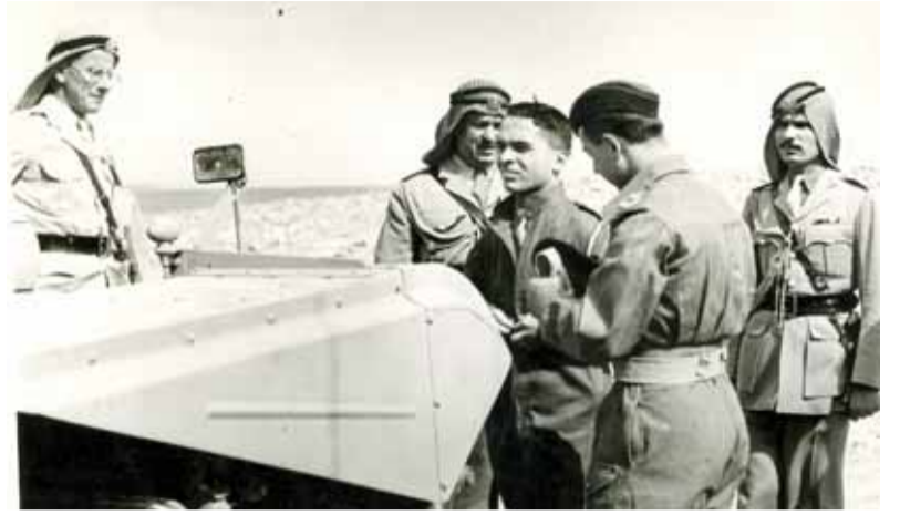
زيارة المغفور له بإذن الله الملك الحسين الى كتيبة الدبابات الثالثة ١٩٥٤/١/٢٦ لتتقد الأليات التي وصلت حديثا يظهر في الصورة نذير رشيد / الملازم عواد الخالدي / الكولونيل دنجويل قائد الكتيبة / العقيد محمد السعدي كبير مرافقي الملك.

للاستفسار وابداء الملاحظات والتوضيح بالشخصيات والاماكن الواردة في الصور نأمل من القراء الاتصال مع دائرة المكتبة الوطنية، على الارقام: ٠٦٥٦٦٢٨٥٥ / ٠٦٥٦٦٢٨٥٤ / فرعي ٢٠٩٨ البريد الالكتروني: www.nl.gov.jo