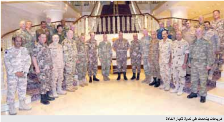
فريحات يتحدث في ندوة لكبار القادة

عمان - بترا - قال رئيس هيئة الأركان المشتركة الفريق الركن محمود عبد الحليم فريحات، إن برنامج إعادة هيكلة القوات المسلحة الأردنية ويتوجهات مباشرة من جلالته القائد الأعلى الملك عبد الله الثاني هدف الى ضمان قدرة القوات المسلحة على مواجهة أي تهديد لاستقرار وأمن الأردن في حدود الموارد المتاحة، والتي تضمن للقوات المسلحة قدرتها على العمل مع حلفائها وشركائها من الدول.