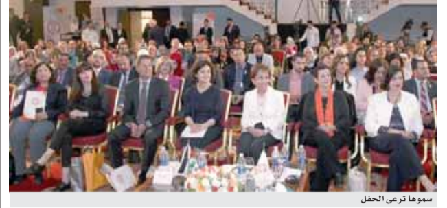
سموها ترعى الحفل

وبحسب إحصائيات رسمية أوردها تقرير هيومن رايتس فإن التسهيلات التي أعطتها الحكومة يستفيد منها ٣٥٦ ألف شخص من أولاد الأردنيات المتزوجات من أجانب، تشمل مجالات العمل والتعليم