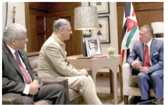
جلالته يستقبل رئيس أركان باكستان

عمان - بترا - استقبل جلالته الملك عبدالله الثاني، في قصر الحسينية امس، رئيس هيئة الأركان المشتركة الفريق للقوات المسلحة الباكستانية الفريق أول زبير محمود حياة والوفد المرافق، في اجتماع جرى خلاله استعراض مجالات التعاون العسكري بين البلدين.