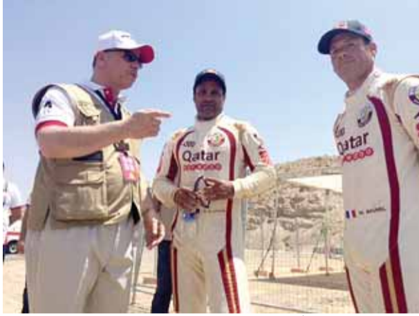
الأمير فيصل يحرس دوماً على متابعة السائقين

ويدخل على خط المنافسة للملاحين متسابق سباق السرعة والرالي غيث وريكات الذي يلعب دور الملاح للمسابقات سلامة القماز، بعد إعلان نجلة الانسحاب من الرالي. المرحلة الاستعراضية ويستفتح الرالي يوم غد الخميس بمرحلة استعراضية تنطلق عند الرابعة حيث تقام المرحلة على ضفاف البحر الميت لتشكّل خلفية رائعة للمتابعين والمصورين وعشاق رياضة السيارات. وستحدد المرحلة الاستعراضية عملية انطلاق السائقين في اليومين الأول والثاني من الرالي فيما يسبق انطلاق المرحلة الاستعراضية المؤتمر الصحفي الخاص بالمتسابقين والذين سيكشفون بتصريحاتهم عن تحضيراتهم وتدريبهم خلال اليومين الماضيين جراء استكشافهم للمراحل التدريبية.