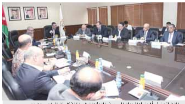
القضاء مترئساً اجتماع الجهات الرسمية والقطاعات المختلفة لاستقبال شهر رمضان

اما الدواجن فتوقع ممثلو قطاع الدواجن إنتاج حوالي ٢١ مليون طير ما يعادل ٢٦ الف طن خلال رمضان، مؤكداً ان هذا الكميات تغطي حاجة السوق لفترة تزيد عن الشهر. واكد مديرا المؤسسات المدنية والعسكرية توفر كافة السلع في الأسواق وخاصة الرمضانية بأسعار مناسبة وفي متناول الجميع، مؤكداً ثبات الأسعار خلال العام الحالي. وقال ان المؤسسات ستطرحان خلال الأيام المقبلة حزمة من العروض المخفضة على مختلف السلع إضافة الى طرح السلع الرمضانية مبكراً. واكد ممثل الجمارك في الاجتماع اتخاذ كافة الإجراءات لضمان انسياب السلع الى الأسواق وعدم التأخير في الإجراءات الجمركية على الحدود. بدوره أكد مدير الموصفات والمقاييس استعداد المؤسسة مبكراً لاستقبال شهر رمضان، مشيراً الى اتخاذ اشد الاجراءات الرقابية على السلع الاستهلاكية لتتأكد من جودتها ونوعيتها. واكد ممثل مؤسسة الغذاء والدواء ان المؤسسة لن تتهاون في اجراءات الرقابة على كافة السلع الغذائية خلال شهر رمضان المبارك. وحضر الاجتماع ممثلو القطاعات التجارية والصناعية والزراعية ومديرا المؤسسات المدنية والعسكرية وممثل دائرة الجمارك ومدير الموصفات والمقاييس وممثل مؤسسة الغذاء والدواء.