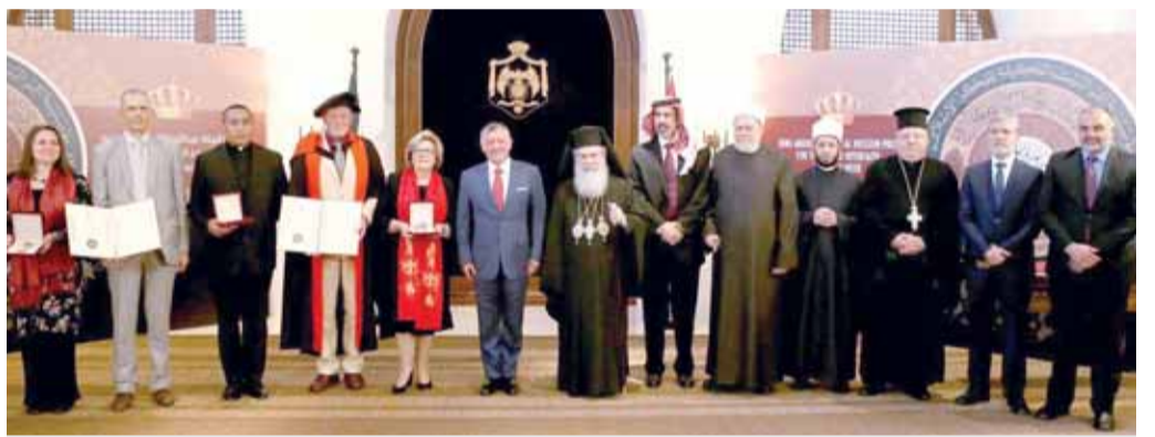
جلالته يتوسط الفائزين بالجائزة

من جهة اخرى، استقبل جلالته الملك، امس، رئيس هيئة الأركان المشتركة القوات المسلحة الباكستانية الفريق أول زبير محمود حياة والوفد المرافق، في اجتماع جرى خلاله استعراض جهود الحرب على الإرهاب.