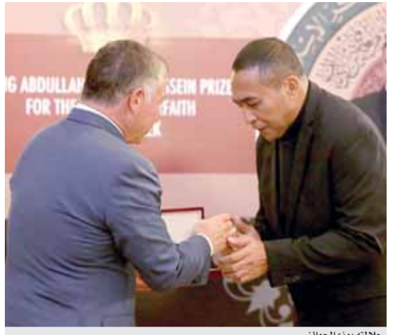
جلالته يوزع الجوائز