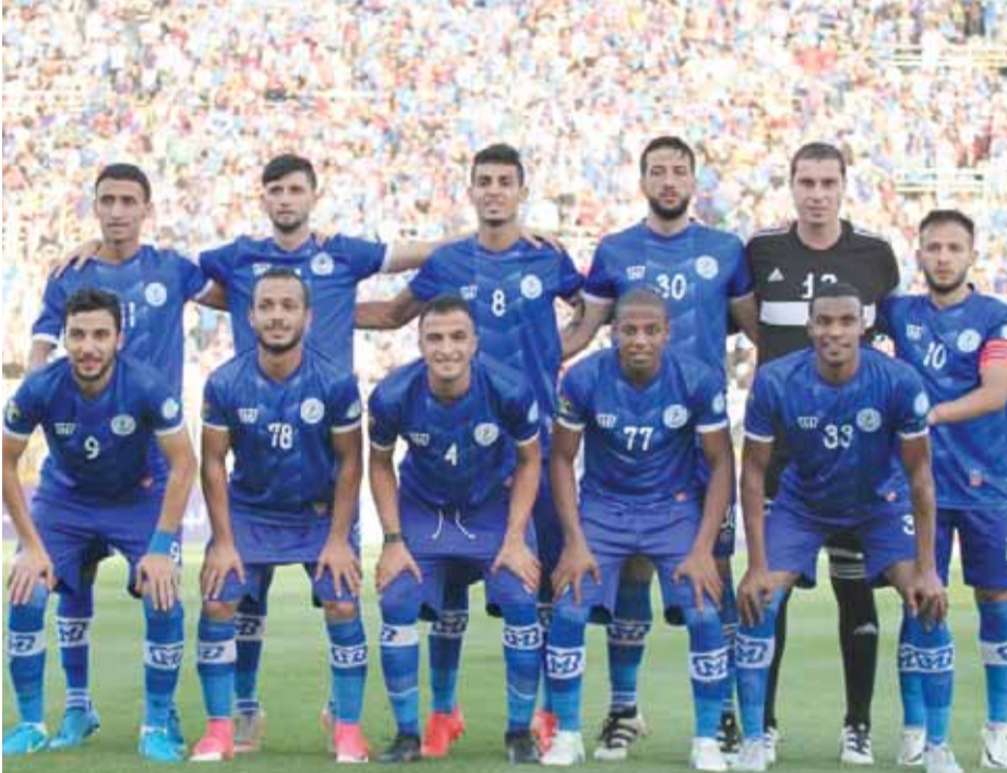
الرمثا ينتظر الظهور العربي