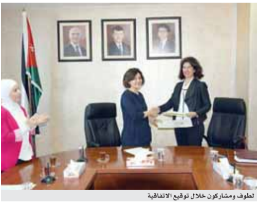
لطوف ومشاركون خلال توقيع الاتفاقية

عمان - بترا - وقعت في وزارة التنمية الاجتماعية امس، مذكرة تفاهم بين الوزاره ( سجل الجمعيات ) وجمعية فيلق