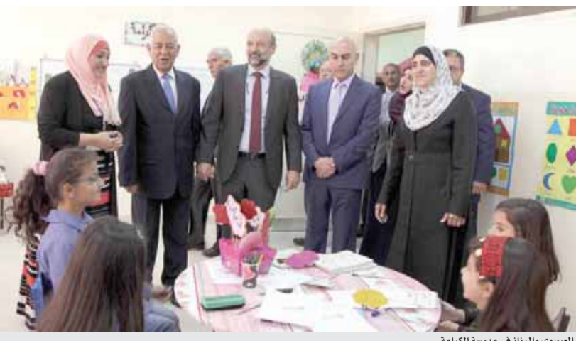
العيسوي والرزاز في مدرسة الكرامة

الواعي والمسؤول، عكس بمجمله أبهى الصور التي تليق بالأردن، شديداً على أن ذلك لا يأتي بمحض الصدفة وإنما بالتصميم والإيمان المطبق لمستقبل هذا البلد وأبنائه. ولفت إلى الإشارة الملكية التي رصدت الاكتشافات في بعض المدارس، فجات الكرامة الملكية لحل مشاكل الطلبة وأولياء أمورهم، عبر إنشاء مدارس نموذجية مجهزة بأحدث التقنيات والمختبرات والمشاغل والمرافق المختلفة.