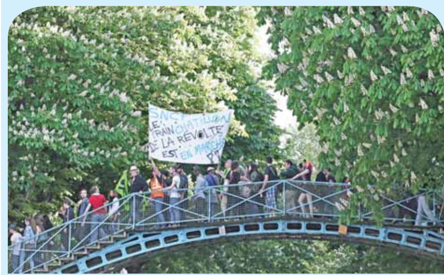
متظاهرون على جسر للشعاع أثناء مشاركتهم في مظاهرة غير رسمية ضد خطط الحكومة الفرنسية لإصلاح شركة السلك الحديدية المملوكة للدولة ودعم عمال السلك الحديدية الفرنسية أثناء قيامهم بجولة خامسة من الإضرابات في باريس.