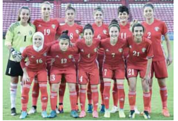
منتخب السيدات لكرة القدم

عمان-الرأي-يلتقي منتخب السيدات لكرة القدم عند الساعة من مساء اليوم نظيره منتخب تايوان على ستاد عمان الدولي ضمن استعداداته للمشاركة في كأس آسيا والتي ستقام في عمان الشهر المقبل.