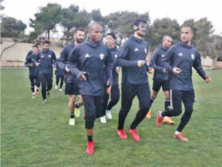
المنتخب الوطني يصعد تحضيراته للقاء فيتنام

عمان - الرأي - يستأنف المنتخب الوطني لكرة القدم صباح اليوم تدريباته البدنية والفنية استعداداً لمواجهة فيتنام عند الخامسة مساء الثلاثاء القادم على ستاد الملك عبدالله الثاني ضمن الجولة الأخيرة من تصفيات كأس آسيا ٢٠١٩.