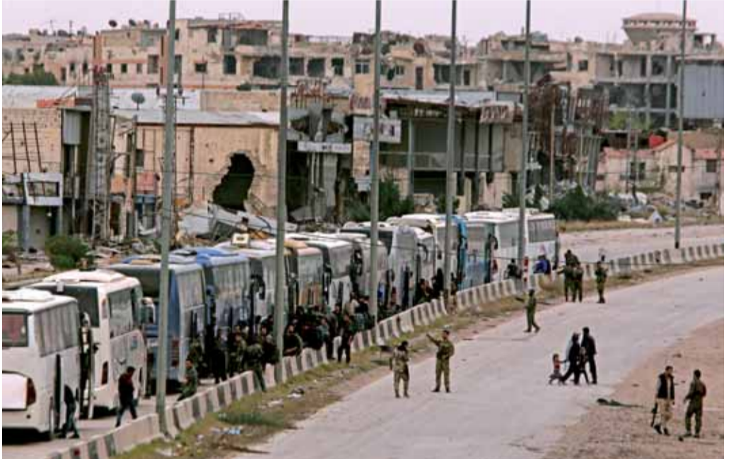
قوات سورية تحيط بحافلات تقل مقاتلين ومدنيين لإجلائهم من حرسنا

بدوره نفى الجيش الروسي امس القاء قنابل حارقة على منطقة الغوطة الشرقية في سوريا، وذلك ردا على ما أورده المرصد السوري لحقوق الانسان. وقالت وزارة الدفاع الروسية في بيان نقلته وكالات الانباء الروسية «ان الطيران الروسي لا يشن ضربات على الاحياء السكنية في الغوطة الشرقية، ولا يستخدم القنابل الحارقة بخلاف ما يقوم به التحالف الدولي بقيادة الولايات المتحدة..»