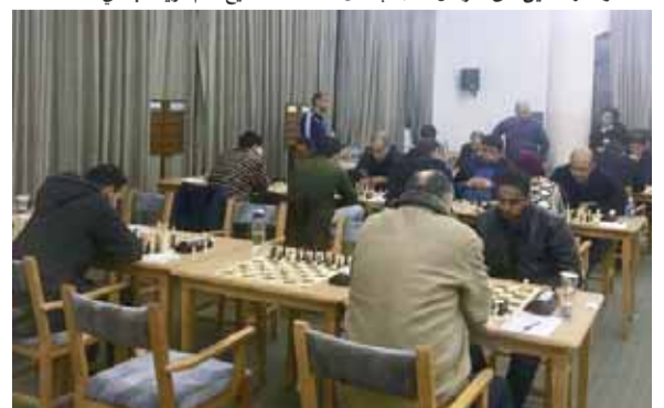
جانب من لقاءات البطولة

عمان - الرأي - توج نادي السيادل، امس الاول بلقب دوري الرجي لفئة ١٥ لاجيا، بعد نهاية مباراة تحديد صاحب المركز الثاني والتي جمعت فريقا النومادز والاهلي على ملعب جامعة البترا. وتمكن النومادز من الظفر بالمركز الثاني واحتلال الوصافة في أعقاب فوزه على الاهلي ٣٠ - ٨ ليضرب موعدا مع السيادل في لقاء الكأس الذي سيجتمع الفريقين يوم ١١ الشهر المقبل على ذات الملعب. وأنتهى السيادل الدوري في صدارة الفرق برصيد ١٧ نقطة، يليه النومادز