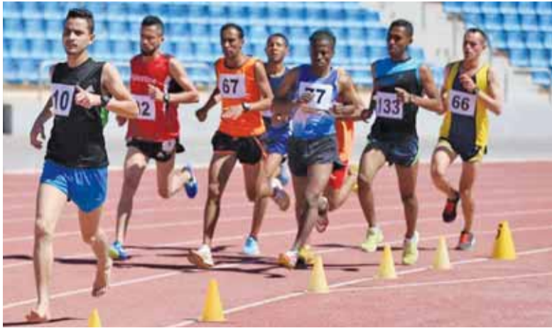
جانب من المسابقات