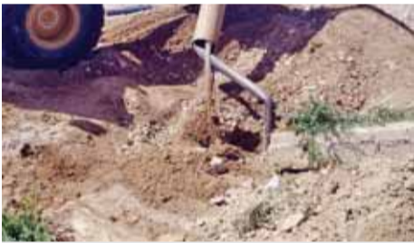
عملية ردم البئر

بردم البئر وتغريم المخالف مبلغ (١٩,٢٠٠) دينار والحبس لمدة عام وتحميله نفقات اعادة الاوضاع حيث تم ردم البئر وصب الاسمنت المسلح واحكام إغلاقه بعد استكمال الاجراءات الفنية المتعلقة بقص المضخة والخط الداخلي». وأضاف المصدر ان هذه البئر كانت سببا رئيسيا في ضعف بعض مصادر المياه المخصصة للمواطنين لغايات الشرب في المنطقة داخل احدى المزارع في منطقة الحسا.