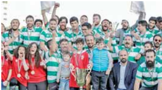
السيادل بعد تسلمه كأس البطولة

عمان - الرأي - توج نادي السيادل، امس الاول بلقب دوري الرجي لفئة ١٥ لاجيا، بعد نهاية مباراة تحديد صاحب المركز الثاني والتي جمعت فريقا النومادز والاهلي على ملعب جامعة البترا. وتمكن النومادز من الظفر بالمركز الثاني واحتلال الوصافة في أعقاب فوزه على الاهلي ٣٠ - ٨ ليضرب موعدا مع السيادل في لقاء الكأس الذي سيجتمع الفريقين يوم ١١ الشهر المقبل على ذات الملعب. وأنتهى السيادل الدوري في صدارة الفرق برصيد ١٧ نقطة، يليه النومادز