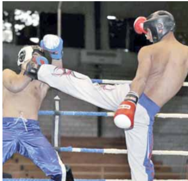
جانب من النزالات الافتتاحية للبطولة

وسيطر التعادل (٢/٢) على مباراتي ذات راس مع اليرموك على ملعب الكرك، والعقبة مع المششية على ملعب العقبة، ليصبح رصيد ذات راس (٤) واليرموك (٢١)، وترتفع نقاط العقبة الى (٦) والمنشية الى (٥).