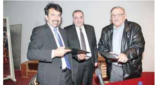
زيينات توسط ابو الطبيب والمجولين

عمان - الرأي - باشرت رابطة اللاعبين الدوليين الترتيبات لبدء العمل في الاتفاقية التي وقعتها مع جمعية العون الصحي الاردنية (الدولية) بما يحقق المزيد من المكتسبات والخدمات لاعضاء الرابطة واسرهم.