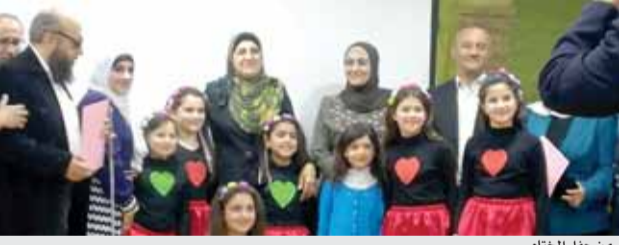
من حفل الختام

مشاركة-الرأي-اختتمت الخميس الماضي فعاليات مهرجان مسرح المنهاج الرابع الذي نظّمته تربيّه لواء ماركا. واشتمل المهرجان الذي استمر لعدة اسبوع، على عروض مسرحية مختلفة متنوعة مستهداة إلى مختلف المناهج الدراسية من المنهاج المخصص للطلبة وتحويلها إلى نصوص قابلة للتطبيق داخل الفرقة الصفية وبامكانيات محدودة الهدف منه وصول المعلومة مسرحيا وبشويق واضح للطلبة وমেمة.