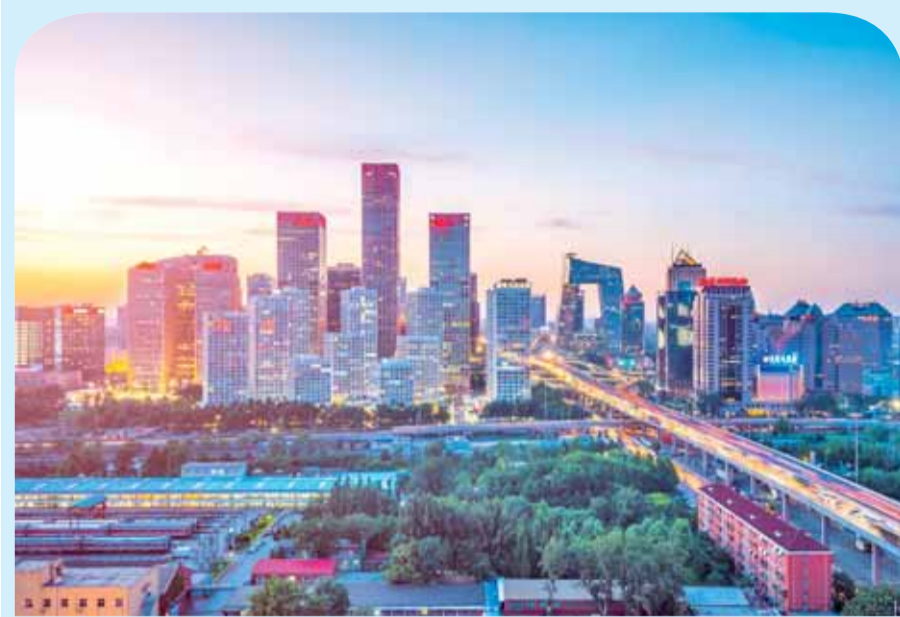
أظهر تقرير مؤشر الابتكار العالمي لعام ٢٠١٨ أن الصين تحتل المرتبة الثالثة عالمياً من حيث الدول الأكثر ابتكاراً، وشمل التقرير آراء أكثر من ٢٠٠٠ مدير تنفيذي عالمي مسؤولين عن البحث والتطوير من ٢٠ دولة ومنطقة مختلفة لقياس تصورهم عن تطور حالة الابتكار، وحثت أميركا بالمرتبة الأولى، بينما جاءت اليابان في المرتبة الثانية. وكالات

وبصراحة فإن الإعلام في هذه المنطقة، أي في العالم الثالث ومن لف لفه، كان ينظر إليه في السابق حتى الناس العاديون نظرة إزدراء ولعل ما تجب الإشارة إليه هنا، أن السائد إن للتندر وإن للإستهزاء، كان هو القول: «كلام صحافة وصحافيين، وكل هذا عندما كانت الغلبة للصحافة الجادة وليس لهذه الصحافة التي تشبه بعض أدواتها ووسائلها «البوشار» الذي عندما ترى «أكياسه» منتخفة، عن بعد، تعود، من الشيطان ألف مرة لكن عندما تصغله بفضيكت فإلك لا تملك إلا أن تضرب كفا بكف وتتحسر على «الشلن» الذي دفعته تهوراً وعن طيب خاطر.