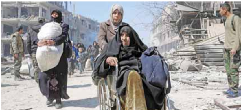
فرار الآلاف من الغوطة