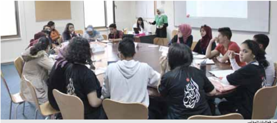
من فعاليات المؤتمر

ويوضح أن التغريب الثاني يدخل من باب الحب والغرام والعلاقات الجنسية، وهذه الأمور مجهولة للفتاة ولا تتحدث فيها مع الأهل، فبيدا هذا الطرف بشرحها للفتاة واستدراجها والتلبس عليها بالكلام المسول والوعود مستغلاً كونها غير ناضجة ووعيها غير مكتمل.