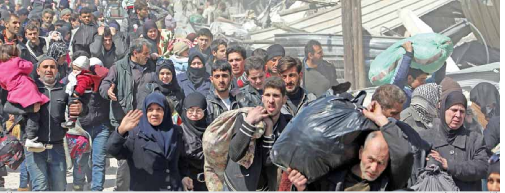
الآلاف يخرجون من الغوطة الشرقية هرباً من الموت

عربين - أ ف ب - واصل آلاف المدنيين نزوحهم القسري هرباً من الموت في سوريا، حيث تقدمت قوات الجيش السوري امس السبت في الغوطة الشرقية قرب دمشق وسيطرت على بلدتين جديدتين، بينما يستمر التصعيد التركي في منطقة عفرين الحدودية شمالاً سيما لطرده الأكراد منها. وياتت القوات السورية تسيطر على أكثر من ثمانين في المئة من مساحة الغوطة الشرقية، آخر معقل لمقاتلي المعارضة والجماعات المتطرفة قرب دمشق، بحسب ما افاد المرصد السوري لحقوق الانسان. بينما تستمر حملة القصف الجوي العنيف الذي حصده امس ٣٧ قتيلاً.