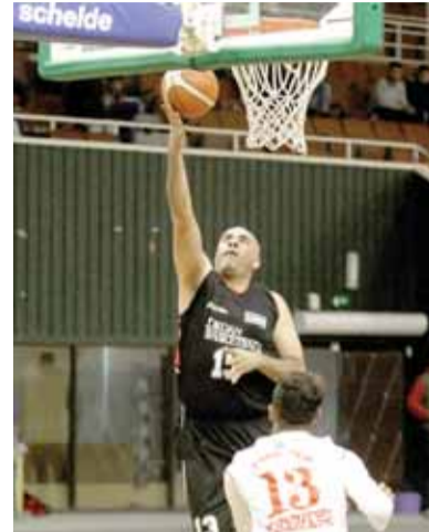
عمان - الرأي - تصدر السلة قبل المظانية الأرتوذكسي فرق المجموعة الثانية ضمن كأس الأردن التصنيفي لكرة السلة الذي شارك به ٢١ فريقا.

الأرتوذكسي رفع رصيده لـ اربع نقاط بتحقيقه الفوز الثاني على حساب دير أبي سعيد ٤٣-٤٠ في اللقاء الذي اقيم في صالته الرياضية ليتخطى حاجز المئة للمرة الثانية حيث استهل مشواره في البطولة بتجاوز بيت ايدس ٥١-٥٠.