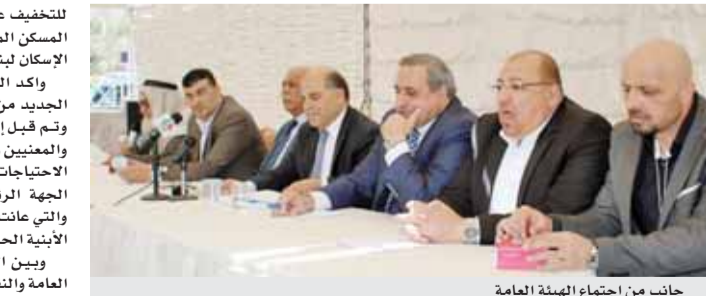
جانب من اجتماع الهيئة العامة

وبين العمري أن الجمعية شاركت ومنذ طرح مسودة النظام وبالتعاون مع الجهات المعنية الأخرى بدراسة بنود ومواد النظام المقترح ، وقدمت ملاحظاتها ومقترحاتها الهادفة إلى تجاوز سلبيات النظام لعدم ملائمة احتياجات المواطنين ومكانياتهم بعد الإرتفاع الكبير في أسعار الأراضي ومستلزمات البناء وأسعار الفائدة على القروض السكنية، في الوقت الذي يعاني فيه