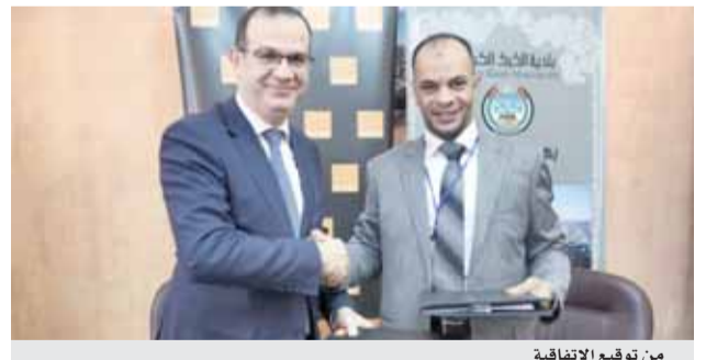
من توقيع الاتفاقية

عمان - الرأي - قالت أورانج الأردن في بيان أنها وقعت اتفاقية شراكة استراتيجية مع بلدية الكرك لتزويدها بمجموعة من حلول الربط الشبكي ونقل البيانات المعتمدة على خدمة التبديل متعدد البروتوكولات باستخدام المؤشرات التعريفية، بهدف تطوير آلية ربط البلدية ونقلها للمعلومات مع دوائرها وفروعها الأخرى بسرعة عالية وأمان كبير. وبموجب الاتفاقية، أيضا تقوم أورانج الأردن، برفع كفاءة وسرعة خطوط الإنترنت في المناطق المشمولة بالاتفاقية وربط مناطق البلدية ودوائرها الخارجية، ما يحسن من تداول