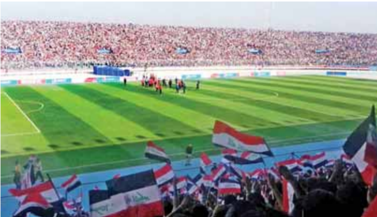
«فيفا»، يسمح بإقامة المباريات الرسمية في البصرة وكربلاء وأربيل

الرسمية في البصرة وكربلاء وأربيل، مؤكدا أنه يعود للمنظمين والاتحاد الآسيوي، أن يتخذوا قرارهم الخاص بهذا الشأن، لكن بالنسبة إلى الفيفا، لا مشكلة..»