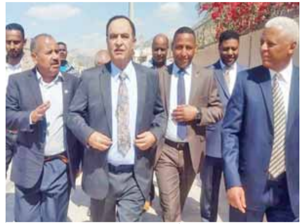
الضاربة خلال زيارته للمجمع الرياضي بالأغوار الجنوبية

فيسان القادم، فيما تتضمن المرحلة الثانية ببناء بمدرجات خاصة للملعب يقع تحتها سوق تجاري استثماري للمجمع الذي سيضم لخدمة رياضة الأغوار الجنوبية خاصة والكرك عامة. بدوره قدم د. العنوش شكره للرابطة الرياضية التي ساهمت منذ البداية بدعم المجمع الرياضي الذي يقع على قطعة ارض النادي والبالغ مساحتها 27 دونماً بدعم من شركة البوتاس العربية بكلفة إجمالية تقدر بـ 300 ألف دينار للمرحلة الأولى والتي تشمل زراعة ملعب كرة القدم بأرضيته بالشبب الاصطناعي على أن يكون جاهزاً بنهاية