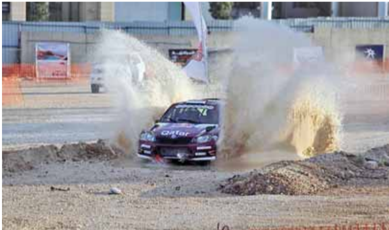
ناصر العظيمة في مشاركة سابقة برالي الأردن

عمان - الرأي - أصدرت الاردنية لرياضة السيارات تعليمات رالي الأردن - الجولة الأولى من بطولة الشرق الأوسط الذي سينطلق خلال الفترة من (٢٦ - ٢٨) الشهر المقبل في منطقة البحر الميت برعاية سمو الأمير فيصل بن الحسين رئيس هيئة المديرين.