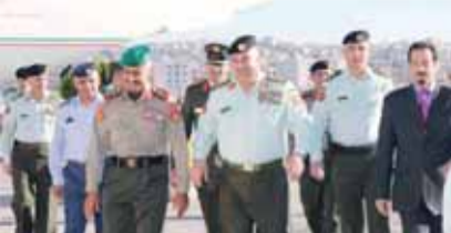
فريحات مستقبلا الخضز (بترا)

عمان - الرأي - نفذت كوادر وزارة المياه والري / سلطة المياه ترافقها قوات أمنية من مديرية شرطة الطفيلة و درك الجنوب بالتنسيق مع متصرف الحسا وقسم حوض مياه الكرك حملة لردم بئر ماء بناء على قرار محكمة الطفيلة. وقال مصدر مسؤول أمس «انه تم ضبط احدى الابار المخالفة سابقا داخل احدى المزارع التي تزود مزارع ويرك وتم احواله الامر للقضاء وبعد استئناف القرار واخذ الصفة القطعية قضت المحكمة