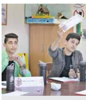
من فعاليات المؤتمر

وتوزع المشاركون على (٢٢) جلسة نقاشية، ناقشوا خلالها قضايا الوباء التكنولوجي والتدني والارهاب والموالمة والهوية الثقافية وحقوق المرأة وقضية البطالة وقضايا ارتفاع التضخم السكاني بالأردن ومديونية المملكة والتسرب من التعليم وعدم توافر البيئة ومشكلة اكتظاظ المدارس بالطلاب وعدم توافر البيئة المناسبة لذوي الاحتياجات الخاصة بالمدارس وهروب الطلاب وقضايا العتب بالآثار والمعالج الاترية.