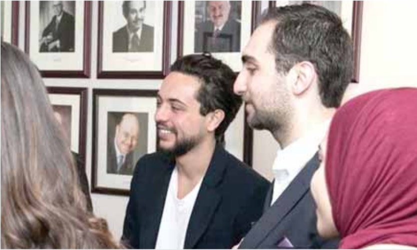
سمو ولي العهد خلال لقائه طلبة أردنيين يدرسون بالجامعات الأميركية