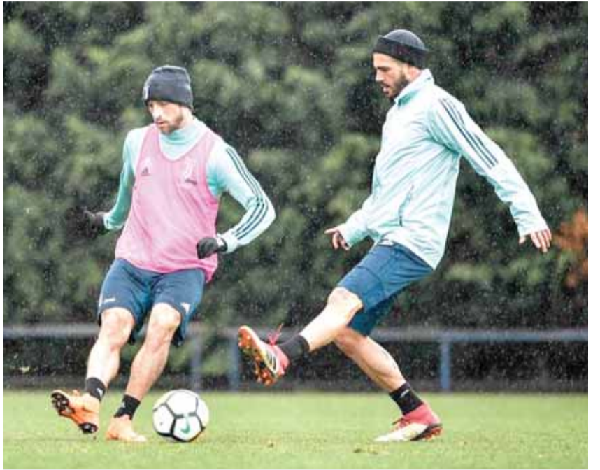
جانب من تدريبات لاعبي يوفنتوس

ويأتي مرسليليا ثالثا وله ٥٩ نقطة، وليون رابعا برصيد ٥٤ نقطة.