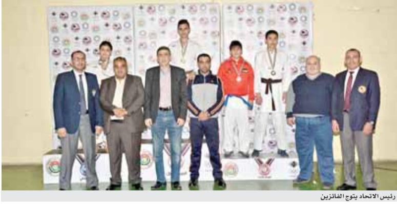
رئيس الاتحاد يتوج الفائزين

عمان - الرأي - تختتم اليوم نزلات بطولة المملكة التنشيطية للشباب بالكراتيه، والتي تقام في قاعة الامير راشد بمدينة الحسين للشباب بمشاركة ٣٨٥ لاعبا ولاعبة .