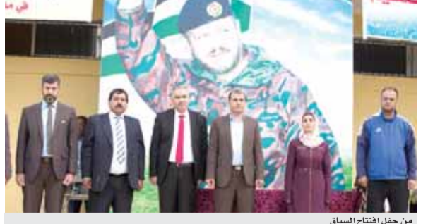
من حفل افتتاح السباق

عمان - الرأي - نظمت مديرية التربية والتعليم في السلط سباق القاندر لاختراق الضاحية الذي استضافته مدرسة بيوضة الشرقية الثانوية المختلطة. ومدنوب عن وزير التربية والتعليم رعى د. عبدالكريم البماني مدير إدارة النشاطات، السباق، الذي اقيم بمشاركة واسعة على مستوى وزارة التربية والتعليم، بحضور مدير التربية والتعليم