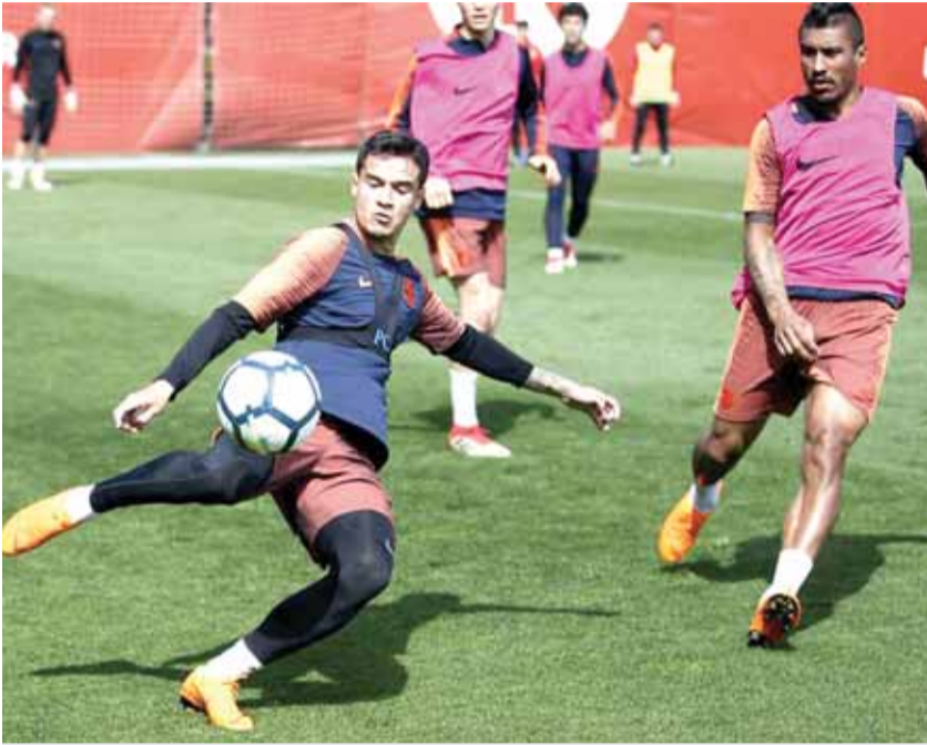
نجم برشلونة كوتينيو خلال التدريبات (أمس)