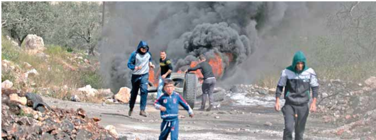
فلسطينيون يحرقون إطارات اشتباكات مع الاحتلال قرب نابلس