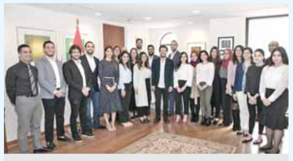
واشنطن - بتر - التقى الأمير الحسين بن عبدالله الثاني، ولي العهد، في السفارة الأردنية بواشنطن مجموعة من الطلبة الأردنيين الذين يتفنون الدراسة في الجامعات الأميركية. وأكد سموه، خلال اللقاء الذي جرى مساء الخميس، أن الشباب الأردني يمتلك