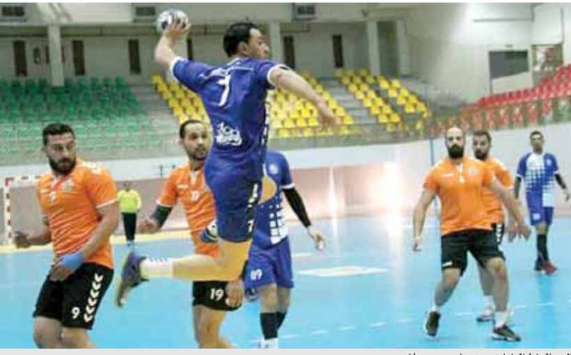
لاعب السلط الهنواوي يسدد على مرمرى عمان

التعادل لاول مرة ٢١/٢١، لتأخذ المباراة طابع الاشارة والقوة حتى اللحظات الاخيرة التي انتهت لصالح السلط بفارق هدف ٢٥/٢٤.