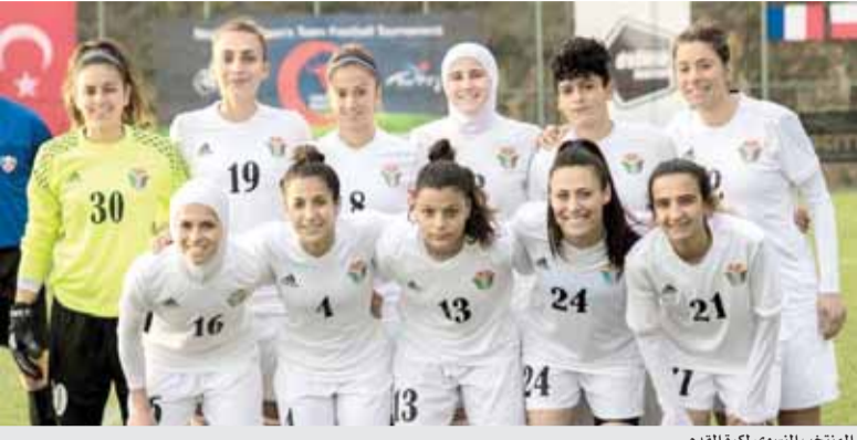
المنتخب النسوي لكرة القدم

داخلية وخارجية مختلفة، أقيمت في قبرص ولاتفيا والولايات المتحدة الأمريكية وكرواتيا والبوسنة وتركيا وتايلاند واليابان وإسبانيا، بالإضافة لمواجهة نادي اولمبيك مرسيليا الفرنسي في العقبة، والمنتخبات الجزائرية والياباني والأفغاني في عمان.