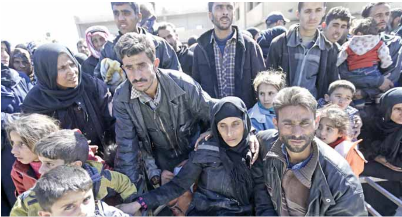
سوريون تم إجلاؤهم من الغوطة