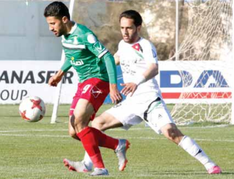
الردود مهاجم الوحدات (يسار) يمر من السلطان مدافع المنشيية (أوس جويعد)

على أرض الملعب وشكلوا طلعات هجومية منظمة وسط محاولات لاختراق العمق، وفي الوقت الذي كان فيه دفاع الوحدات جداراً صلباً أمام الخطورة، عاد لتوسيع بين مساحات خطوطه الامامية واعتمد على توسيع رقعة اللعب من خلال تناقل الكرة عبر أكثر من محور.