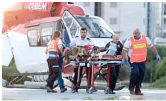
إخلاء جندي إسرائيلي من مروحية إلى مستشفى ببتاح تكفا

القدس المحتلة- كامل إبراهيم- وكالات - قال راديو جيش الاحتلال الإسرائيلي إن إسرائيليين قُتلوا وأصيب شخص واحد على الأقل أمس في واقعة دهس بسيارة في الضفة الغربية المحتلة قال شهود إنها متعمدة. وقال الراديو إن الواقعة حدثت قرب مستوطنة موفودوتان الصهيونية في مدينة جنين الفلسطينية. على صعيد آخر أصيب عدد من الفلسطينيين بالرصاص المعدني المغلف بالمخاط والعشرات بالاختناق خلال قمع قوات الاحتلال الإسرائيلي لمسيرات الغضب التي عمت محافظات الضفة أمس الجمعة، في اليوم المئة لإعلان ترمب المشؤوم الاعتراف بالقدس عاصمة لإسرائيل. وفي قطاع غزة أطلق جنود الاحتلال الرصاص الحي وقنابل الغاز المسيل للدموع باتجاه المشاركين في المسيرات الأسبوعية المنددة بإعلان ترمب.