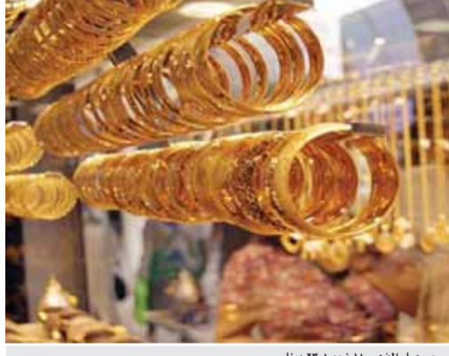
سعر عيار الذهب ١٨ نحو ٢٣,٨ دينار

أسابيع عند ١٣٦١,٧٦ دولار للأوقية في التعاملات المبكرة. لكن المعدن الأصفر ينهى الأسبوع على مكاسب قدرها ٢,٢ بالمئة في أفضل أداء أسبوعي منذ تشرين الأول ٢٠١٧. وزادت العقود الأمريكية للذهب تسليم نيسان ٠,١ بالمئة لتبلغ عند التسوية ١٣٥٦,٢٠ دولار للأوقية. ومن بين المعادن النفيسة الأخرى انخفضت الفضة ١,٣٣ بالمئة في التعاملات الفورية إلى ١٦,٦٥ للأوقية لكنها تنهي الأسبوع على مكاسب قدرها ٢ بالمئة. وارتفع الليالين ٠,٢ بالمئة إلى ١٠٠٣,٢٤ دولار للأوقية بعد أن سجل أعلى مستوى منذ التاسع والعشرين من كانون الثاني عند ١٠١٢,٧٠ دولار. وينتهي الأسبوع على مكاسب قدرها ٤,٣ بالمئة. وصعد البلاديوم ٢,٣٦ بالمئة إلى ١٠٤١,٨٠ دولار للأوقية منهايا الأسبوع على مكاسب تبلغ حوالي ٧ بالمئة، في أكبر زيادة أسبوعية منذ تشرين الأول