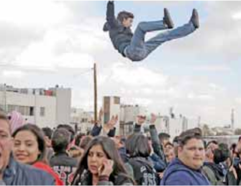
..وقذف ناجح للأعلى