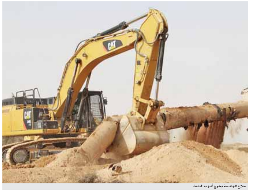
سلاح الهندسة يخرج أنبوب النفط

وأضاف انه قد صدرت التعليمات للوحدات الفنية المعنية من سلاح الهندسة الملكي بتدمير هذه الانفاق وإخراج خط الأنابيب فوق سطح الأرض والذي كان (النتمة ص١٨)