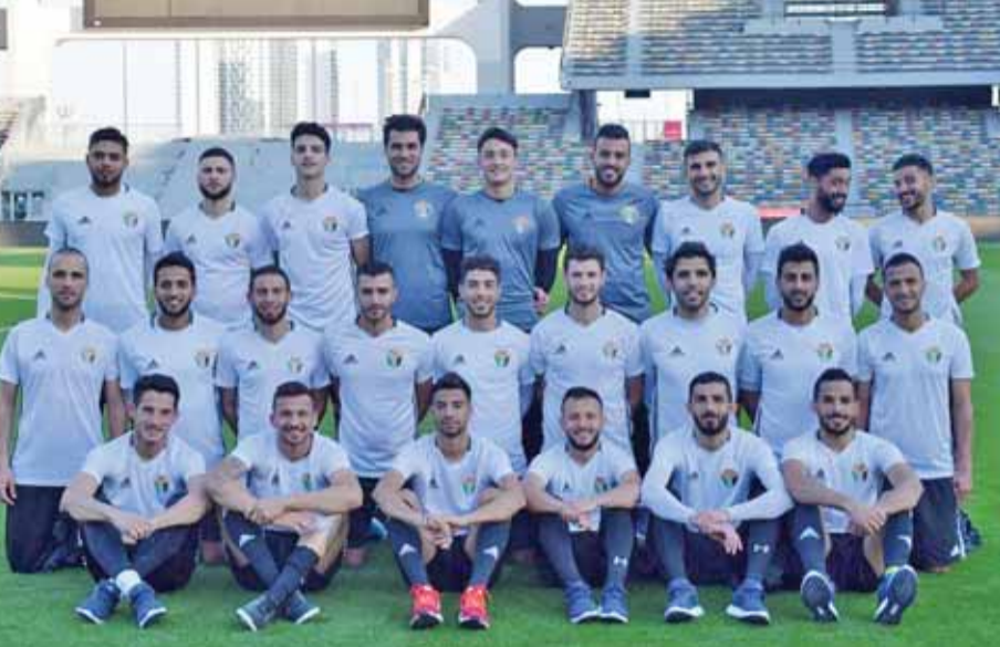
المنتخب الوطني لكرة القدم

وفاز البقعة على المنشية (٢/٦) في اللقاء الذي جرى على ملعب كتعان عزت، ثلثا فاز الاهلي على ذات راس (١/٢) في المواجهة التي استضافها ملعب الاهلي.