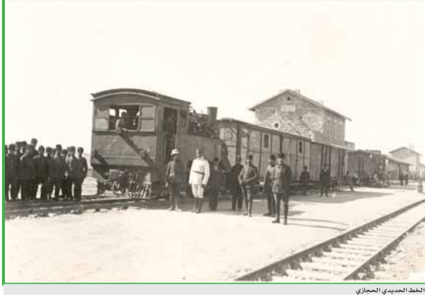
الخط الحديدي الحجازي