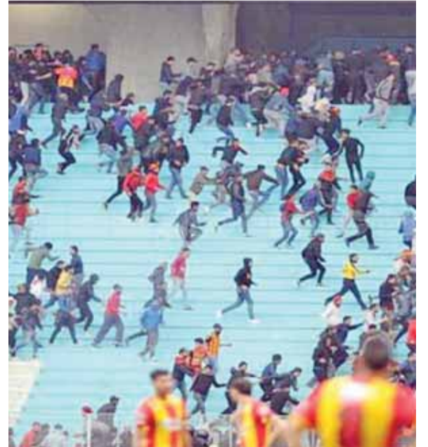
من أعمال شغب مباراة الترجي والنجم

واعلن بيان صادر عن الاتحاد التونسي لكرة القدم بان حكم المباراة كريم الخميري اوقف حتى نهاية الموسم لانه ارتكب «اخطاء جسيمة»، خلال المباراة.