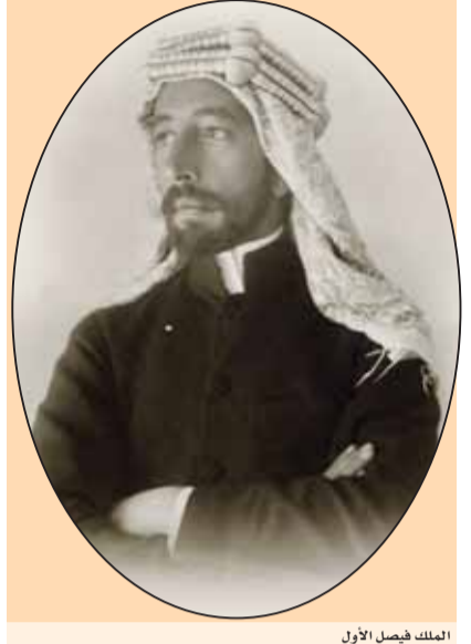
الملك فيصل الأول