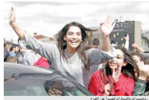
..ومسيرات بالسيارات تعبيرا عن الفرع