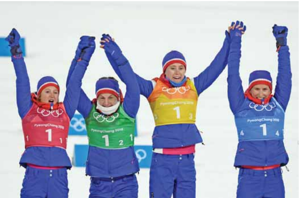
الفريق النرويجي للتزلج الطويل بعد الفوز بالذهبية

وكان تويج هانيو في سوتشي جعله معبود الجماهير في اليابان ولم يخيب امال انصاره الذين ساندوه بقوة.