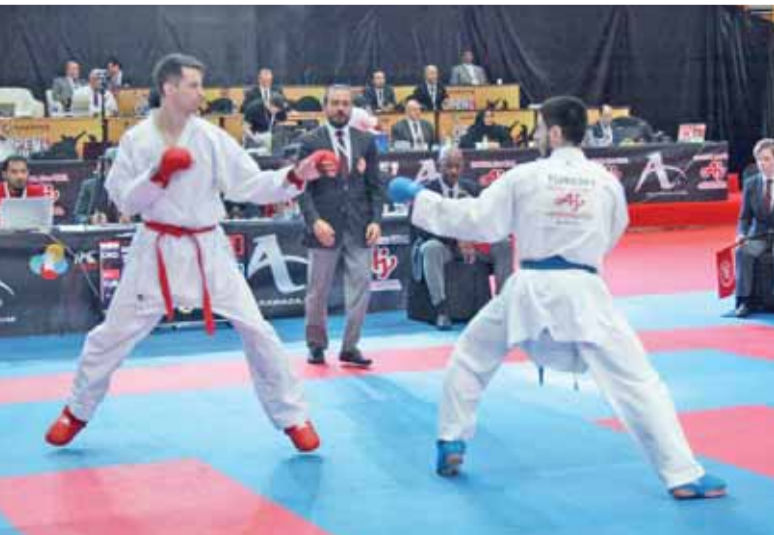
جانب من نزالات البطولة

عمان - الرأي - انهى امس المنتخب الوطني للكراتيه مشاركته في بطولة الدوري العالمي الك1، التي اقيمت في دبي دون تحقيق اي ميدالية او مركز متقدم في النزالات.