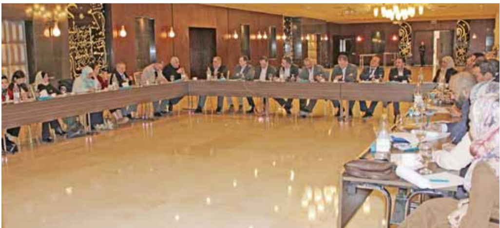
جانب من الجلسة النقاشية

عمان - الرأى - اتفق المشاركون بجلسة نقاشية حول دور المبادرات الريادية في تطوير المشاريع الصغيرة والمتوسطة نظمها المجلس الاقتصادي والاجتماعي اخيراً، على تشكيل لجنة متابعة برئاسة المجلس للأعداد مؤتمر لبحث المعيقات والتحديات التي تواجه المنشآت الصغيرة والمساهمة في معالجة الفقر والبطالة من ناحية أخرى، إضافة إلى امتلاكها العديد من الصفات والخصائص التي جعلها عنصراً أساساً في إيجاد الوظائف وأداة في تشجيع المجتمعات على الريادة والابتكار والتوجه الى التشغيل الذاتي لفئة الشباب. وأكد رئيس المجلس الدكتور مصطفى الحمارنة خلال افتتاح الجلسة ضرورة دعم المنشآت الصغيرة والمتوسطة التي تعد أهم محركات تحفيز النمو الاقتصادي من خلال التشغيل الذاتي وإيجاد فرص عمل