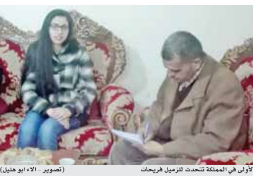
الاولى في المملكة تتحدث للزميل فريجات

وقال والد نور «جريس الرضي» ان ابنتي كانت مثابرة ومجتهدة لذلك حصلت على هذا المعدل.