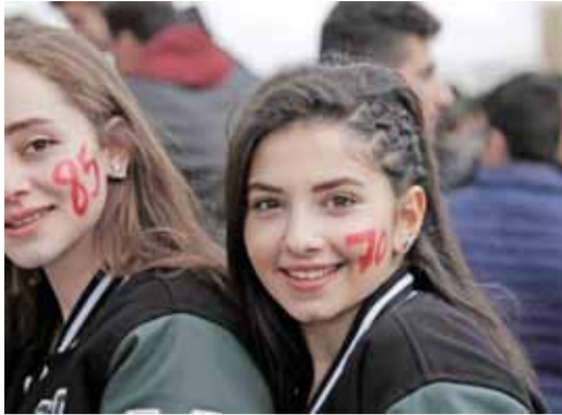
معدلات ترسم على الوجوه

كشوفات الطلبة توزع على مديريات التربية .. اليوم