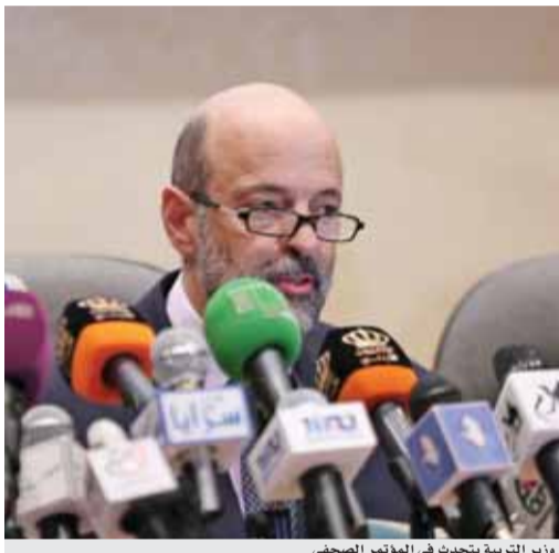
وزير التربية يتحدث في المؤتمر الصحفي

٢٠٠ ألف طالب في امتحان الدورة الصيفية لعام ٢٠١٨ السماح لغير المستكملين التقدم لامتحان التوجيهي لسنوات ما قبل ٢٠١٤