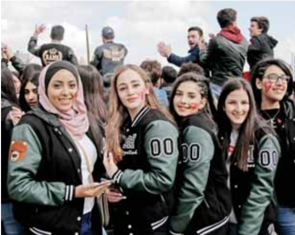
طلاب يحتفلون بالنجاح