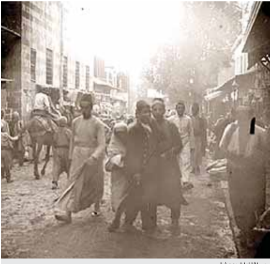
حي القنوت بدمشق