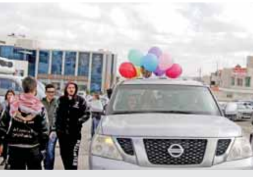
..ومسيرات بالسيارات تعبيرا عن الفرع

عمان - الراي - قال الأمن العام أن عدد المخالفات المرتكبة بسبب اعلان نتائج «التوجيهي» انخفض بشكل لافت، ما يدل على الالتزام والوعي لدى المواطنين والاستجابة التي لاقتها تحذيرات الامن لهم. وذكر ان العاملين في ادارة السير المركزية سجلوا في مختلف محافظات المملكة ما يقارب الـ ٥٠٠ مخالفة مرورية ارتبطت بالتعبير الخاطئ عن الفرع مقارنة مع ما يزيد عن ألفي مخالفة