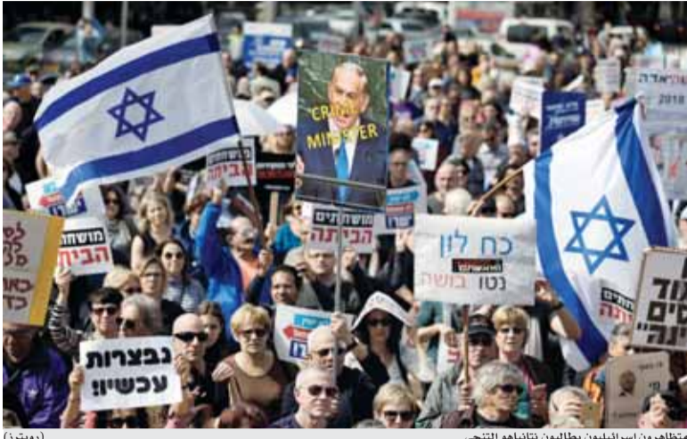
متظاهرون اسرائيليون يطالبون بتناياهو التحي