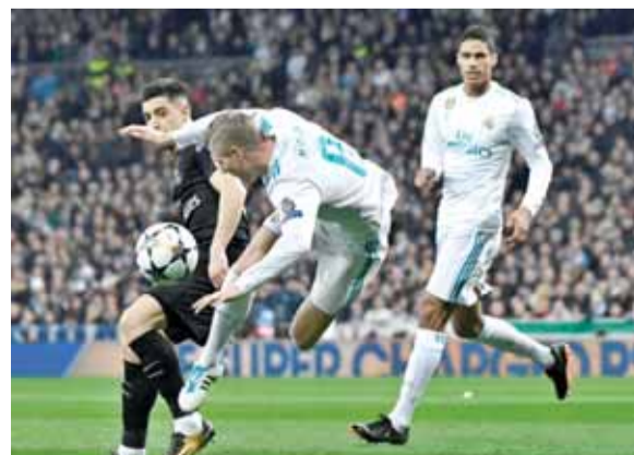
كروس (وسط) يقاتل على الكرة في مباراة سان جيرمان

مدريد - أ ف ب - أصيب لاعب وسط ريال مدريد رابع الدوري الإسباني لكرة القدم الدولي الألماني طوني كروس في ركبته وسيبعت لفترة عن الملاعب كما أعلن ناديه أمس. وأصدر ريال مدريد بيانا جاء فيه «بعد فحوصات خضعت لها طوني كروس، تبين إصابته بضرر في الرباطة الخارجية لركبته اليسرى». ولم يكشف نادي العاصمة الإسبانية عن فترة غياب كروس (٢٨ عاما) وهو يأمل بأن يكون جاهزا لخوض مباراة الاياب ضد باريس