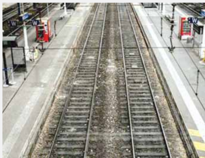
احتجاج على خطة حكومية تقضي بالغاء بعض الامتيازات الممنوحة لعمال السكك (أرضيفية)

العام. وتعد التظاهرات الواسعة والإضرابات مشهداً معتاداً في فرنسا حيث أجبرت الحكومات في الماضي على التراجع عن سياسات معينة، لكن ماكرون تعهد المضي قدماً. والجزء الأكثر حساسية في تقرير إصلاح سكك الحديد والذي عُرض الخميس، يقترح عدم منح العمال الجدد امتيازات التوظيف التاريخية نفسها مثل زملائهم، ومن بينها التقاعد المبكر وضمان العمل مدى الحياة. وقال كريستوف كاستانييه رئيس حزب الجمهورية إلى الأمام، الذي ينتمي إليه ماكرون الجمعة، لا يتعارض مع المنطق القول أنك إذا وظفت موظفين جديداً بتعين اعطاهم راتباً تقاعدياً مساوياً لما يتقاضاه غيرهم من الفرنسيين.