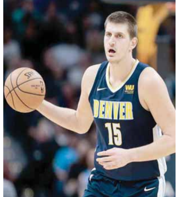
يوكيتش نجم ناجتس

وسجل اللاعبون الاساسيون الخمسة لدنفر ١٠ نقاط او اكثر، فيرز جاري هاريس (٢٨ نقطة بينها ثلاثيات)، وجمال موراي (٢٦ نقطة بينها ثلاثيات).