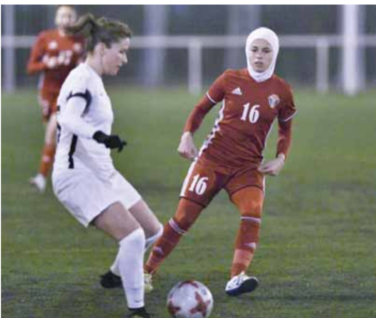
المنتخب الوطني تقدم مرتين قبل أن يعادل الفريق المضيف الكفة

المثير للجدل. وأوشكت غزال على التصدي لركلة الجزاء، الا ان التسديدة القوية ارتدت من يدها الى الشباك، لتنتهي المواجهة على التعادل بهدفين للطرفين. ومن المنتظر ان يواجه المنتخب نادي أتليتكو مدريد في مباراته القادمة يوم الأربعاء المقبل، ويختتم مسكره بملاقاة رايو فايكانو الخميس الذي يليه.