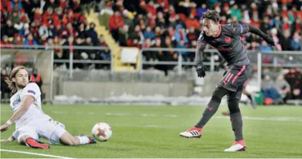
جريرمان لاعب أتليتيكو يحاول بالكرة أمام حارس كوبنهاجن