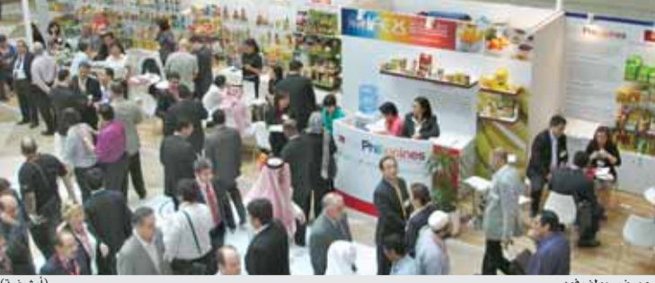
معرض جولف فود (أرضيفية)

الزرقاء أن الغرفة رتبت مشاركة الصناعة الأعضاء فيها مشيراً إلى الفوائد والخبرات التي يمكن أن يستفيد منها الصناعيون من المعرض والفعاليات والندوات التي ستقام على هامش المعرض التي تشارك فيه وفود من مختلف دول العالم. وأكد أبو وشاح حرص الجمعية على المشاركة السنوية بالمعرض لتمكين الشركات الأردنية للتعرف على نظرائهم من التجار المشاركين بالمعرض من مختلف العالم؛ ما يشكل فرصة حقيقية لتبادل الخبرات وعقد الصفقات التجارية، وأوضح أن تنظيم الجمعية لمشاركة شركات صناعات أردنية في معرض مختلف أسواقاً في كندا، والولايات المتحدة الأمريكية، وأفريقيا، جاءت في فترة فقد الأردن فيها عدداً من أسواقه التقليدية المجاورة ما يتطلب البحث عن أسواق جديدة تملك الصناعة الأردنية فيها تنافسية عالية وبخاصة بالدول الأفريقية إلى جانب تعزيز تواجداتها بالدول العربية.