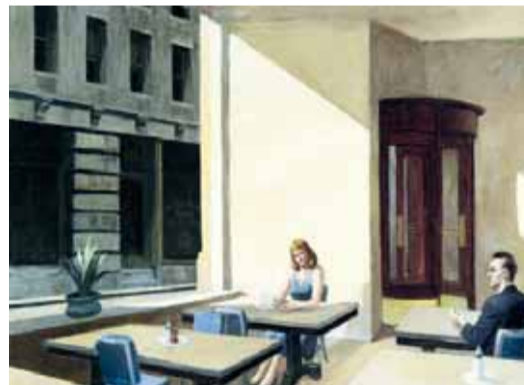
للفنّان الأميركي ادوارد هوبر