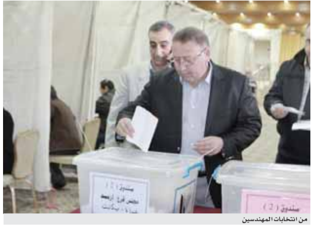
من انتخابات المهندسين