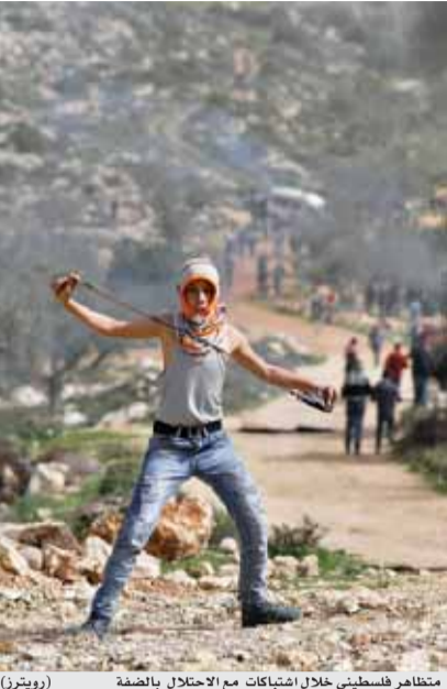
متظاهرين فلسطينيين خلال اشتباكات مع الاحتلال بالضفة