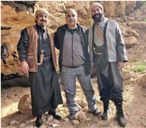
الجراح وحجاوي وبراهمه

كانت نوف جميلة وذكية، مثل خطى صاف يمشي على قدمين، وقعت نوف بغرام «غيث»، حيث رسمت منذ نعومة أظفارها صورة فارسها على الرمال، فيما الشعراء الجوالون يتناقلون سيرته ومآثره، والسراب يمر محملا بالأحلام بيراة عابر سبيل. وعشقتها فارسها بنفس القدر الذي عشقته به دون أن يعرف لها هوية أو مكان، عشقها كجنينة أو حلم بعيد المنال، تظهر من بعيد كسراب وعندما يدنو منها تختفي مخلفة وراءها ألف سؤال وسؤال. وحين تلاقت خطاهما كان العذر لهما بالمرصاد.