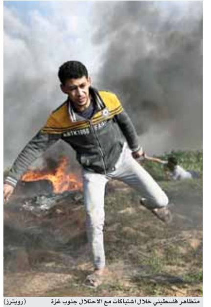
متظاهرين فلسطينيين خلال اشتباكات مع الاحتلال جنوب غزة