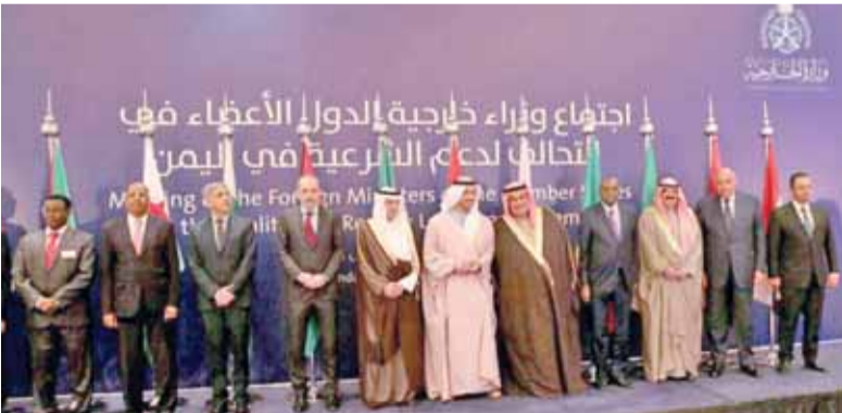
الصفدي يتوسط وزراء خارجية في اجتماع الرياض

الرياض - بترا - شارك وزير الخارجية وشؤون المغتربين أيمن الصفدي أمس باجتماع وزراء خارجية دول التحالف لدعم الشرعية في اليمن الذي التأم في الرياض للإعلان عن خطة العمليات الإنسانية الشاملة في اليمن بهدف تحسين الوضع الإنساني في اليمن.