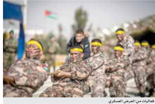
فعاليات من العرض العسكري