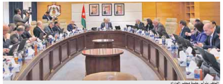
الملك يتراس جلسة مجلس الوزراء

وزير الصناعة والتجارة والتموين بدء سريان القرار وبالإسعار التي تم الاعلان عنها سابقا . وقرر مجلس الوزراء الموافقة على مجموعة من الاجراءات لغايات دعم استقرار مزارعي البندورة في الاغوار الجنوبية لهذا العام فقط وذلك نظرا لزيادة الانتاج وانخفاض اسعار البيع في