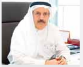
عدنان أحمد يوسف رئيس اتحاد المصارف العربية سابقاً

توقّف كما دنا كنا في مطلع كل عام عن إطالة على القضايا التي تواجه المصارف الخليجية والعربية وتوغلنا لآداء هذه المصارف. ونحن اعتدنا طوال فترة ما بعد الأزمة العالمية عام ٢٠٠٨ أي منذ نحو عشر سنوات أن نوه ونشيد بأداء هذه المصارف، حيث قد يعبرنا البعض متفائلين في هذا الجانب، لكننا قلنا منذ البداية أننا نقر بتأثر هذه المصارف بالأوضاع الاقتصادية والمالية الإقليمية والعالمية المحيطة لكن درجة المخاطر التي تتعرض لها ليس بالحجم الذي تتعرض له المصارف في أوروبا والولايات المتحدة كون أداء المصارف العربية عموماً تسم بالتركيز على اقتصادياتها الوطنية وليس المضاربات في استثمارات عالمية أو مشتقات مالية، وقد ثبت صحة هذه الرؤية على مدار الأعوام الماضية حيث أننا لم نشهد انهيار أي من المصارف العربية كما جرى في الغرب.