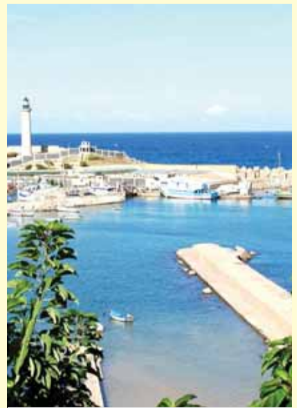
مدينة شرشال الجزائرية