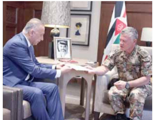
جلالته يتسلم رسالة من العبادي

عمان - بترا - استقبل جلالة الملك عبدالله الثاني، في قصر الحسينية أمس، المبعوث الخاص لرئيس الوزراء العراقي، رئيس جهاز المخابرات مصطفى الكاظمي، الذي سلم جلالتهم دعوة من رئيس الوزراء العراقي الدكتور حيدر العبادي للمشاركة في المؤتمر الدولي لإعادة إعمار العراق الذي