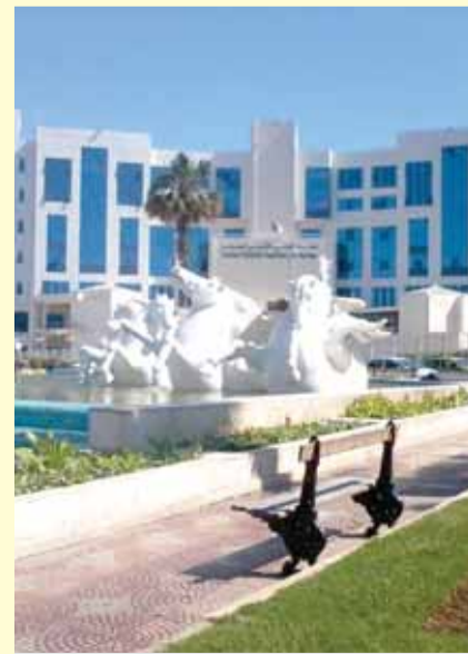
معهد الموسيقى الجزائري

التغني بمنكب كرة القدم لأي بلد يعتبر خمسون عاماً أمضتها نورة في حقل الغناء و قدمت ما يقارب ال ٥٠٠ أغنية باللغة العربية