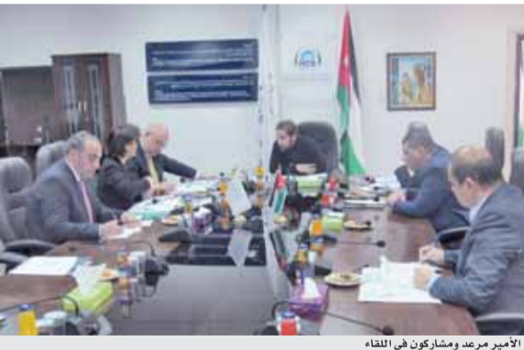
الأمير مرعد ومشاركين في اللقاء

امانة عمان بدورها اتخذت الاجراءات اللازمة لإعادة فتح الطريق امام حركة المرور وابتقت على التحويلات المرورية المؤقتة تجنباً لأزمات السير ووقت الذروة.