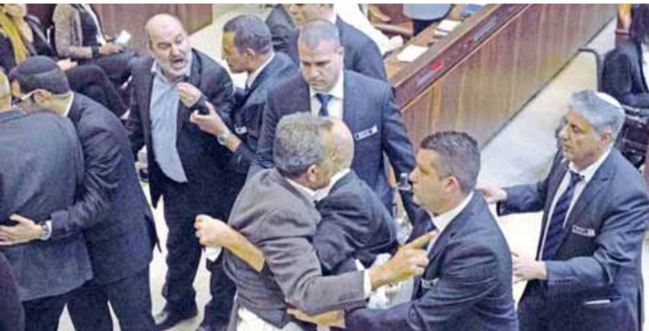
مشهد من طرد النواب العرب من الكنيست...

من جانبها الارباهيين.. وتابع الطيبي، لقد كان نواب القائمة شجعنا عبروا عن ضمير الشعب الفلسطيني ووجدان العالم العربي واحرار العالم وكان رديفا لمليون ونصف امركي خرجوا في مظاهرات ضد ترمب... وعلى الرغم من مقاطعة الفلسطينيين لها، تقول إدارة ترمب إنها لا تزال ملتزمة بمساعدتهم وإسرائيل على التفاوض على اتفاق سلام. وتلك المحادثات متوقفة منذ أربع سنوات تقريبا. في رده على خطاب بنس، قال نيل أبو رديئة المتحدث باسم عباس «إذا أردت الولايات المتحدة الأميركية أن تلعب دورا وسيطا في عملية السلام لا بد أن تكون وسيطا نزيها وان تلتزم بقرارات الشرعية الدولية..» واحتلت إسرائيل القدس الشرقية في حرب ١٩٦٧ في خطوة لم يعترف بها دوليا وتعتبر القدس بأكملها عاصمتها الأبدية وغير المقسمة». وهذه أرفع زيارة يقوم بها مسؤول امركي إلى المنطقة منذ إعلان ترمب بشأن القدس واعلنت بنس وتننيهاو فرصة لإبراز علاقتهما الودية للقطاع المسيحي المحافظ من المجتمع الأميركي الذي يعد قاعدة القوة للإدارة الأميركية. وإبرز بنس، وهو مسيحي انجيلي، أوجه الشبه بين التاريخ اليهودي الذي يعود إلى الحقب التوراتية وبين النزوات الأوروبيين الذين أسسوا الولايات المتحدة. وتخلل خطاب بنس تصفيق حار