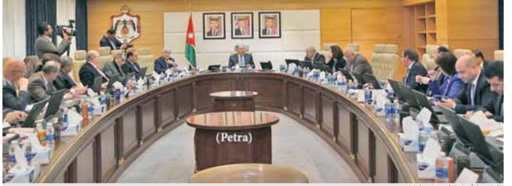
الملتقى يترأس اجتماع مجلس الوزراء

الموافقة على السير بدراسة الترخيص المبدئي لجامعتين طبييتين خاصيتين