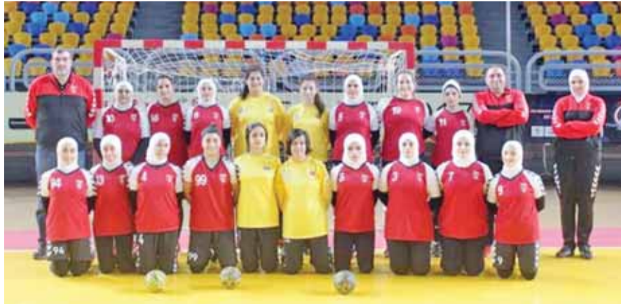
منتخب كرة اليد للسيدات

عمان - الرأي - أعلنت سبع دول مشاركة في النسخة الثانية من بطولة غرب آسيا لكرة اليد للسيدات التي يستضيفها الأردن في صالة الأميرة سمية بمدينة الحسين للشباب خلال الفترة من ١٥ إلى ٢١ الشهر المقبل. وتشارك في البطولة منتخبات، قطر، العراق، لبنان، سوريا، فلسطين، إيران إضافة إلى الأردن، ومن المقرر أن تقام قرعة البطولة بعد غد الخميس في كوريا الجنوبية بالتزامن