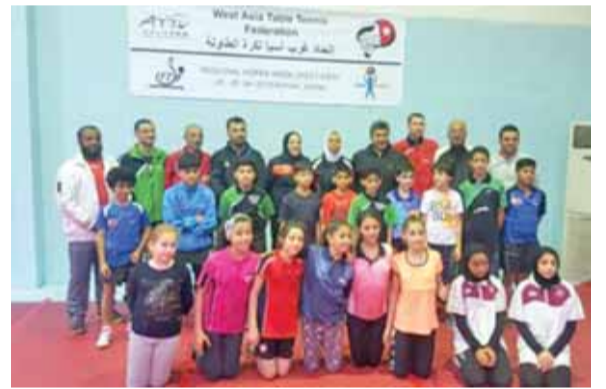
جانب من فعاليات المعسكر