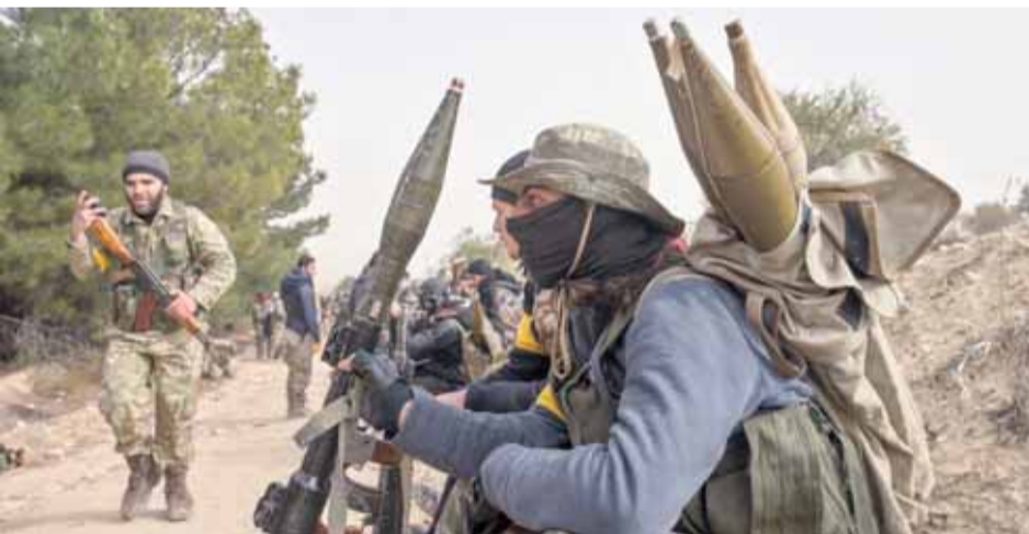
أفراد من الجيش الحر في عفريين

عليها مقاتلو وحدات حماية الشعب إنها قد ترسل تعزيزات إلى عفريين وعت إلى جهود دولية لوقف الهجوم. وتعمد إردوغان أيضا بطرد قوات سوريا الديمقراطية من بلدة منج إلى الشرق وهي جزء من منطقة أكبر في شمال سوريا تسيطر عليها قوات سوريا الديمقراطية التي قادت الحملة المدعومة من واشنطن لهزيمة داعش في معاقلها السورية العام الماضي.