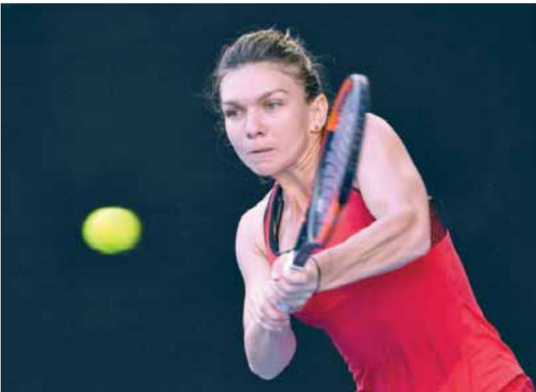
أ ف ب