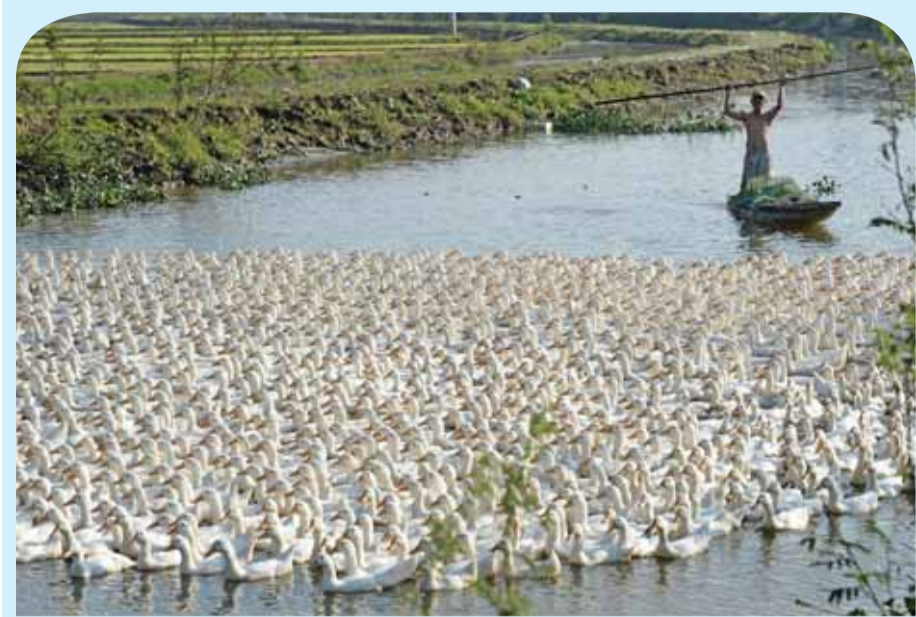
كان المزارعون في الدول الآسيوية مثل اليابان، الصين، وفييتنام يربون البط في حقول الأرز ولاحظوا أن المزارع التي يربي فيها البط تنتج أفضل من غيرها، لأن البط يأكل الحشرات والأعشاب الصغيرة الضارة في حقول الأرز.. ويبدل تلك تتأمن بيئة صحية للغرست ومحصول جيد من الأرز. وتظهر هذه الصورة مزارعاً يربى قطعيعه من البط على قناة في ضواحي هوى في وسط فيتنام.

وقالت إدارة أمن النقل الأميركية إن معظم المتطلبات يتم تطبيقها طوعاً من قبل شركات الطيران حول العالم.