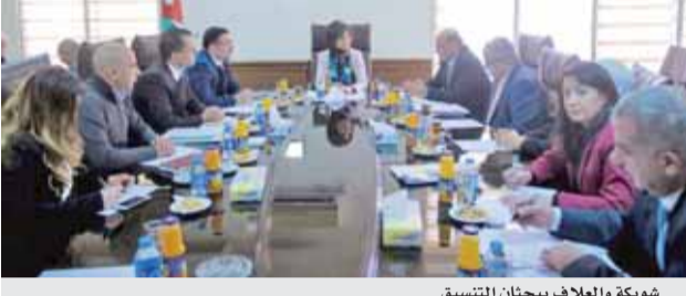
شويكة والعلاف يبحثان التنسيق

عمان - بترا - بحثت وزيرة الاتصالات وتكنولوجيا المعلومات وزيرة تطوير القطاع العام مجد شويكة خلال لقائها، امس الاثنين، رئيس هيئة النزاهة ومكافحة الفساد محمد العلاف، آليات تعزيز التنسيق والتعاون بين وزارة تطوير القطاع العام والهيئة في المشاريع والبرامج ذات الاهتمام المشترك وعلى رأسها تعزيز النزاهة وممارسات الحوكمة في القطاع العام. وأكدت شويكة ضرورة التعاون والتنسيق المشترك بين الجانبين لتعزيز قيم النزاهة والحوكمة في القطاع العام والتركيز على مبدأ سيادة القانون في الإدارة العامة في جميع الإجراءات والليات وتفعيل مبدأ المساءلة