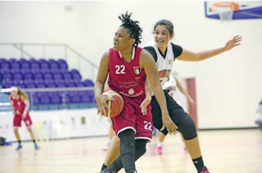
الأردن يمتلك سجلاً لافتاً في الدورة

المنظمة العليا للدورة «نحن سعداء بالإقبال الكبير الذي تشهده الرياضات التسع التي تتضمنها الدورة، بما فيها كرة السلة والمبارزة والكاراتيه، لذلك حرصنا على أن تكون أولى المنافسات التي نستهل بها الدورة الرابعة».