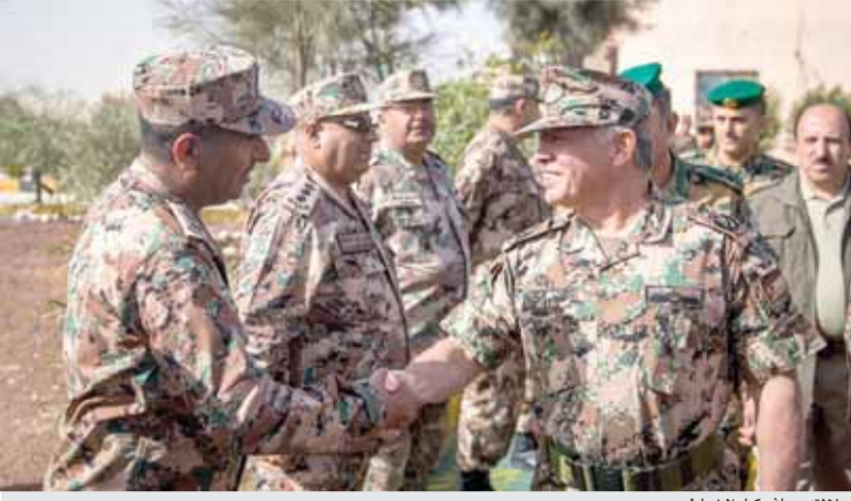
جلالته يصافح كبار الضباط