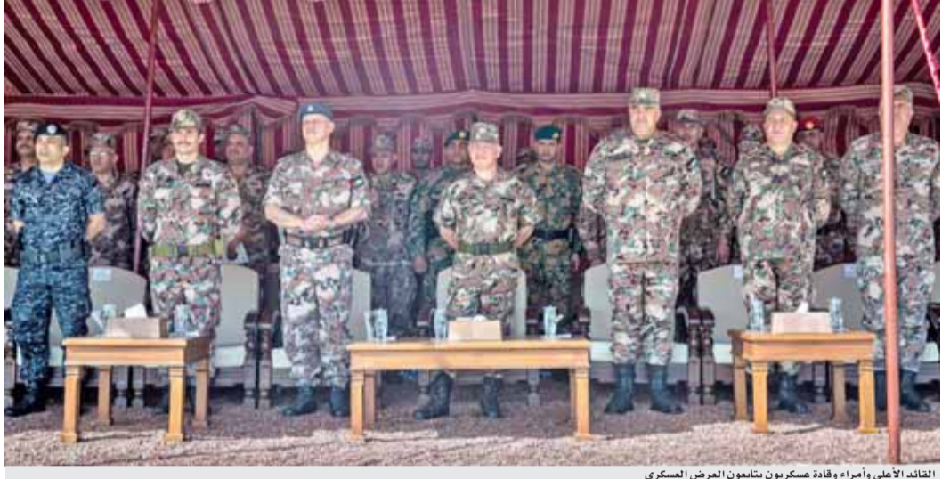
القائد الأعلى وأمرء وقادة عسكريون يتابعون العرض العسكري

عمان - بترا - اطلع الأمير الحسين بن عبدالله الثاني، ولي العهد، خلال زيارته إلى جامعة الحسين التقنية أمس الاثنين، على برامج الجامعة الأكاديمية ومختبراتها ومشاعرها الهندسية، بعد أن استقبلت العام الماضي أول دفعة من الطلبة في التخصصات الهندسية والحاسوبية. (التفاصيل ص١٧)