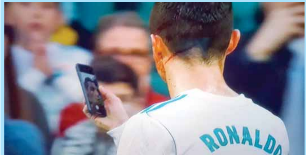
رونالدو يمسك بالهاتف للإطمئنان على إصابته

■ مقارنته.. جاريث بيل سجل (٦) أهداف في الليجا هذا الموسم مثلما سجل كريستيانو رونالدو، رغم أنه لعب ٦٨١ دقيقة أقل من البرتغالي.