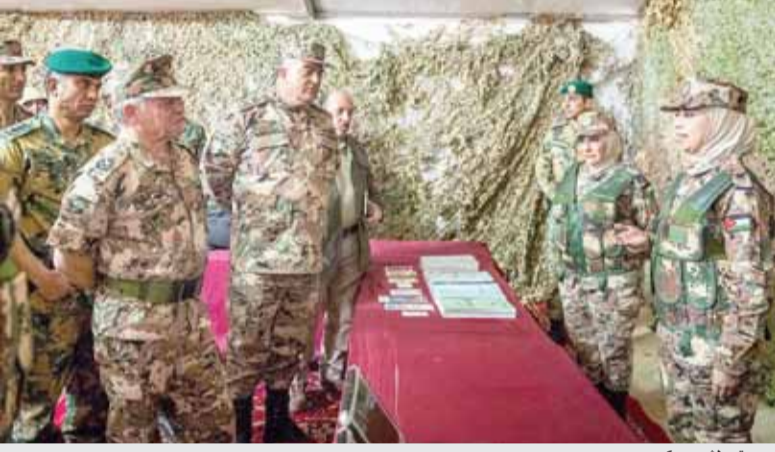
ويستمع لشرح عسكري

عمان - بترا - حضر جلالة الملك عبدالله الثاني القائد الأعلى للقوات المسلحة أمس، الاحتفال الذي أقامته القيادة العامة للقوات المسلحة الأردنية - الجيش العربي، في كتيبة الأميرة بسمة الألبية/٣ (أم النشامى)، بمناسبة العيد السادس والخمسين لميلاد جلالتهم. ولدى وصول جلالتهم موقع الاحتفال كان في استقباله رئيس هيئة الأركان المشتركة الفريق الركن محمود عبدالحليم فريجات، وقائد المنطقة العسكرية الشرقية العميد الركن محمد سليمان بني ياسين، وقائد كتيبة الأميرة بسمة الألبية/٣، حيث استعرض جلالة القائد الأعلى القطعة المنتظرة الخاصة. واطلع جلالة القائد الأعلى على معرض الأسلحة والمعدات المستخدمة في الكتيبة، التي اختيرت عام ٢٠١٠ للمشاركة مع حلف الناتو في برنامج مفهوم المواطنة العملياتية لرفع مستوى التأهيل والتدريب، حيث تتلاءم تلك الأسلحة والمعدات مع الكفاءة العملية الدولية في هذا المجال.