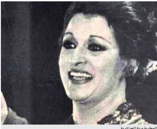
المطربة وردة الجزائرية

الجانب الإنساني ظل حاضراً في أغاني نورة واتحفتنا بمجموعة اعمال تتوافق مع رسالة الفن السامية والتي يبقى الإنسان هو هدفها