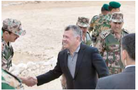
جلالته يصافح كبار الضباط