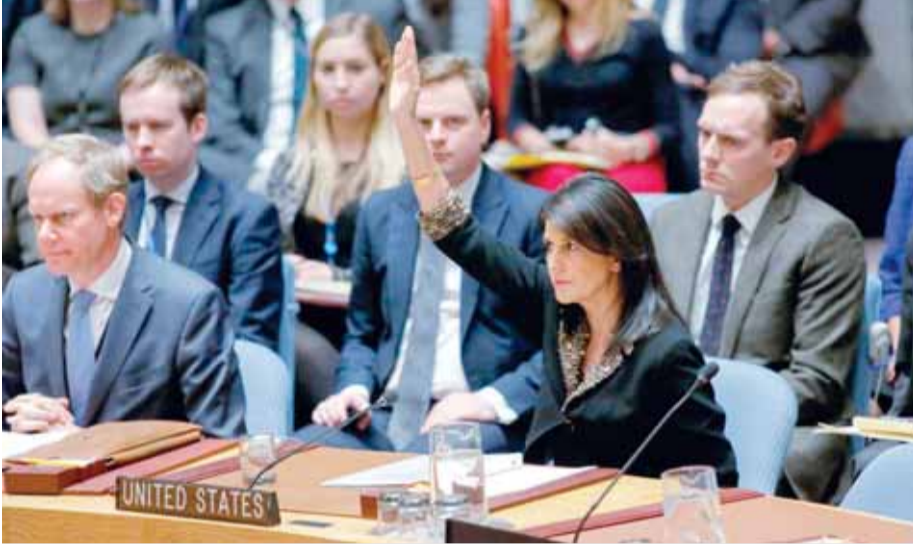
سفيرة أميركا لدى الأمم المتحدة نيكي هالي خلال تصويتها على مشروع القرار