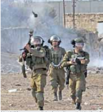
قوات الاحتلال تقمع مظاهرات في طولكرم

الاحتلال يعلن الاستنفار ويحول البلدة القديمة إلى ثكنة عسكرية