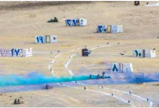
مجريات التمرين العسكري