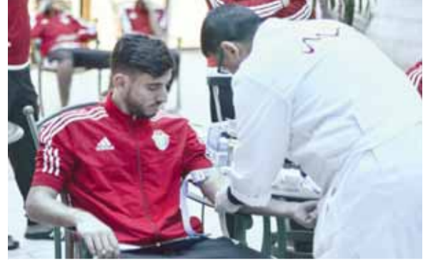
جانف من الفحوصات

عمان - الرأي- خضع امس منتخب ت ٢٣ لكرة القدم لفحوصات طبية في اطار استعداده لخوض النهائيات الآسيوية في الصين الشهر المقبل. وقامت مختبرات «مدلاب» الراعي الرسمي للطبي للمنتخبات الوطنية من خلال فريق متخصص باجراء تلك الفحوصات في فندق الفنار مكان اقامة المنتخب، حيث شملت الفحوصات المخبرية قوة الدم، التهابات الجسم، السكري، فحوصات الكلى والكبد، الاملاح والفحوصات التي تتطلبها تعليمات الاتحادين الآسيوي والدولي.