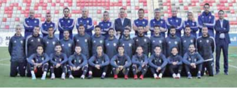
منتخب كرة القدم