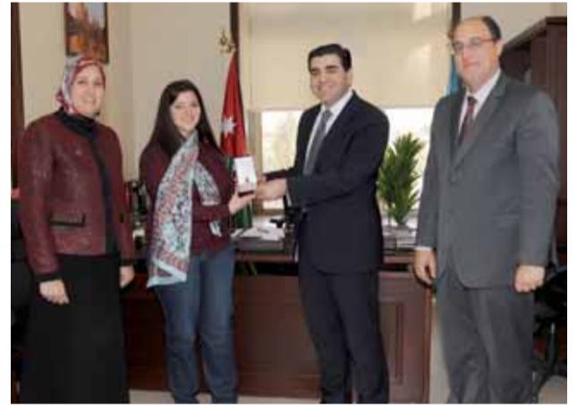
رئيس الجامعة تكريم مرعي