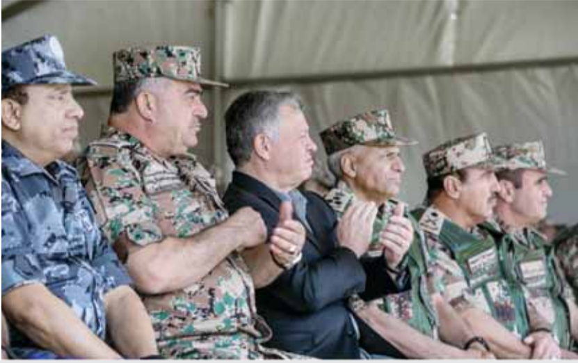
جلالته يتابع التمرين