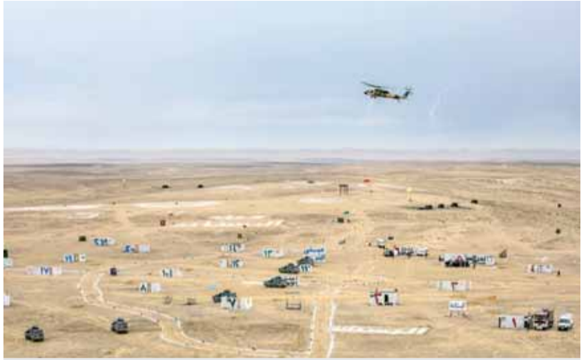
مجريات التمرين العسكري