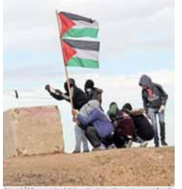
فلسطينيون يرشقون الاحتلال بالحجارة في القدس