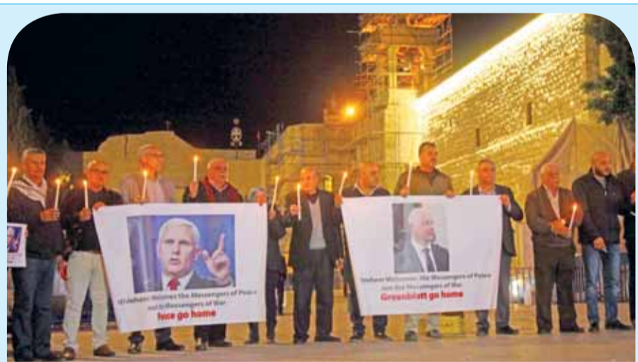
الفلسطينيون يحملون صور نائب الرئيس الأمريكي مايك بينس ومساعد الرئيس ترمب والمبعوث الخاص للمفاوضات الدولية جيسون غرينبلات خلال احتجاج على إعلان ترمب الاعتراف بالقدس عاصمة من إسرائيل، أمام كنيسة المهد في بيت لحم بالضفة

وقال المالكي للصحفيين في جنيف، ان الفلسطينيين سيتحركون في غضون ٤٨ ساعة للدعوة لاجتماع طارئ للجمعية العامة مضيفاً أن المجتمع الدولي سيدين قرار الرئيس الأمريكي دونالد ترمب. وأضاف: «نحن نأمل في رؤية رد الفعل السريع من قبل السلطات الإسرائيلية». وقال داود فيمى داود خبير الاتصالات ونظم المعلومات في ساحة البراق برفقة عدد كبير من المسؤولين الإسرائيليين.