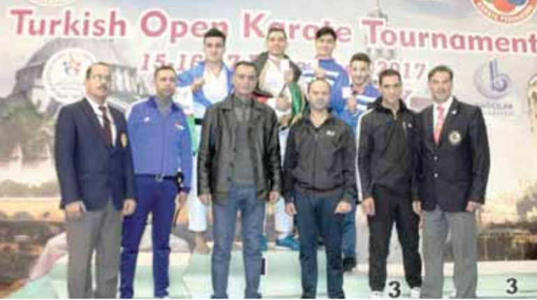
فريق قوات الدرك

الدرك اللواء الركن حسين الحواتمة في اتصال هاتفى اللاعبين على الإنجاز المتحق، مؤكداً أن قوات الدرك وتنفيذاً للتوجيهات الملكية السامية، ستبقى سندا وعوناً للرياضة الأردنية وللشباب الأردني المبدع. وترأس وفد الدرك المشارك في البطولة الامين العام للاتحاد المقدم الركن علاء الجعافرة، وضم الوفد النقيب طلال الفاعوري، النقيب قيس