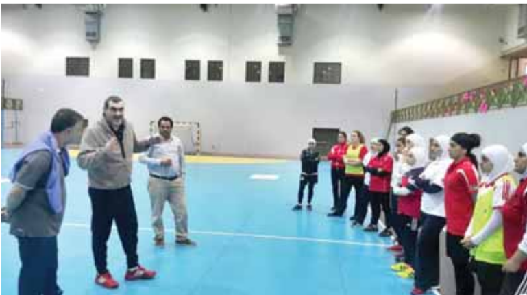
من استعدادات سابقة للمنتخب النسوي لبطولة غرب آسيا