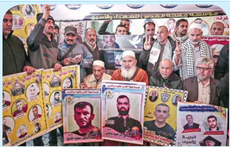
غزيون يتضامنون مع المعتقلين بالسجون الإسرائيلية