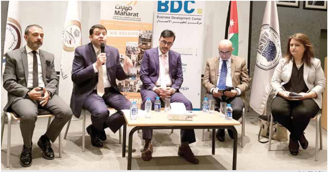
من الجلسة الحوارية