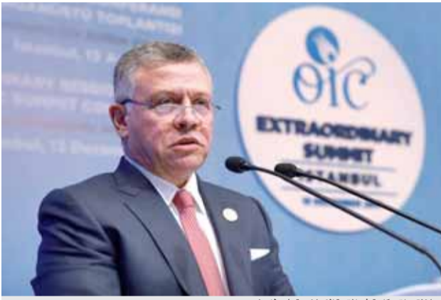
جلالته يلقي كلمة في القمة الإسلامية باسطنبول