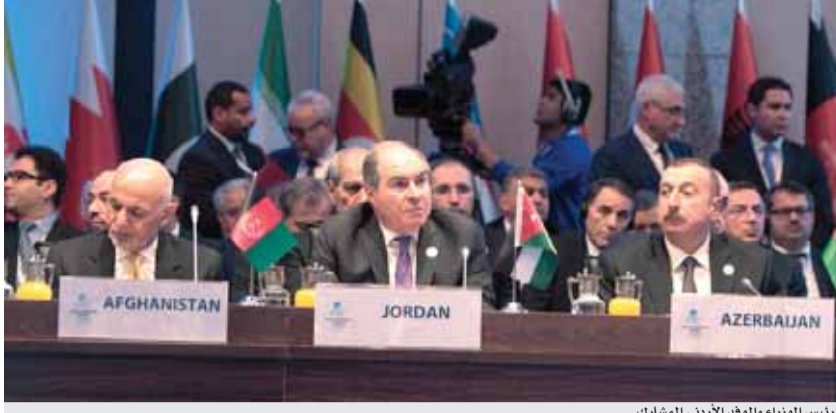
رئيس الوزراء والوفد الأردني المشارك