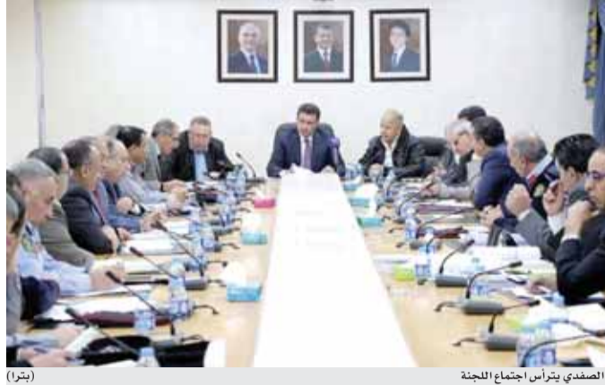
الصفدي يترأس اجتماع اللجنة (بترا)

وزير النقل: لا تنمية اقتصادية أو اجتماعية بدون قطاع النقل