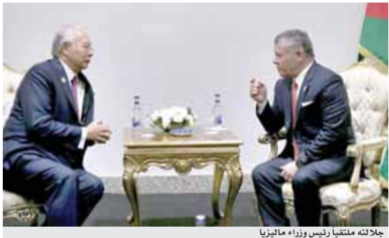
جلالته ملتقى رئيس وزراء ماليزيا

مثلما يقوض الأمن والاستقرار في المنطقة والعالم، وجرى، خلال اللقاءين، التأكيد على أهمية تكثيف الجهود وتنسيق المواقف بين الدول الإسلامية لحماية القدس وهويتها التاريخية، والمقدسات الإسلامية والمسيحية فيها. وشهد جلالة الملك، في هذا الصدد، على أن مدينة القدس في مفتاح تحقيق السلام والأمن والاستقرار في المنطقة، لما لها من مكانة خاصة لدى العرب والمسلمين، مؤكداً ضرورة دعم الأشقاء الفلسطينيين لتمكينهم من نيل حقوقهم المشروعة في إقامة الدولة الفلسطينية المستقلة على التراب الوطني الفلسطيني، وعاصمتها القدس الشرقية.