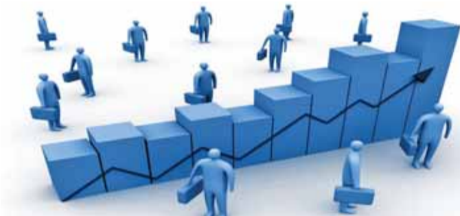
مجموعة النقل أسهمت في الارتفاع

عمان - الرأى - أصدرت دائرة الإحصاءات العامة تقريرها الشهري حول الرقم القياسي لأسعار المستهلك (التضخم) والذي يشير إلى ارتفاع الرقم القياسي لأسعار المستهلك لشهر تشرين ثاني ٢٠١٧ ليصل إلى ١٢٠,٤ مقابل ١١٦,٦ لنفس الشهر من عام ٢٠١٦ مسجلاً ارتفاعاً مقداره ٣,٣٪. وقد ساهم في هذا الارتفاع، كل من مجموعة النقل بنسبة ١,٠٠٪ أو ما مقداره ١,٣ نقطة مئوية، والإيجارات بنسبة ٢,٩٪ أو ما مقداره ٠,٤ نقطة مئوية، والخضروات والبقول الجافة والمعلبة بنسبة ٩,٦٪ أو ما مقداره ٠,٤ نقطة مئوية، والتبغ والسجائر بنسبة ٦,٩٪ أو ما مقداره ٠,٣ نقطة مئوية، واللحوم والدواجن بنسبة ٢,٣٪ أو ما مقداره ٠,٢ نقطة مئوية. في حين كان من أبرز المجموعات السلعية التي انخفضت أسعارها مجموعة الملابس بنسبة ٢,٦٪، والفواكه والمكسرات بنسبة ٢,٤٪، والأحذية بنسبة ١,٧٪. كما ارتفع الرقم القياسي لأسعار المستهلك لشهر تشرين ثاني ٢٠١٧ مقارنة مع شهر تشرين أول من نفس العام بنسبة ٠,٢٪. ومن أبرز المجموعات السلعية التي ساهمت في هذا الارتفاع، ارتفاع مجموعة الخضروات والبقول الجافة والمعلبة بنسبة ٤,١٪ أو ما مقداره ٠,١ نقطة مئوية، واللحوم والدواجن بنسبة ١,٦٪ أو ما مقداره ٠,١ نقطة مئوية، والزيت والدهون بنسبة ٢,٥٪ أو ما مقداره ٠,٤ نقطة مئوية، والملابس بنسبة ١,٦٪ أو ما مقداره ٠,٣ نقطة مئوية، والحبوب ومنتجاتها بنسبة ٠,٢٪ أو ما مقداره ٠,١ نقطة مئوية. في حين كان من أبرز المجموعات السلعية التي انخفضت أسعارها مجموعة