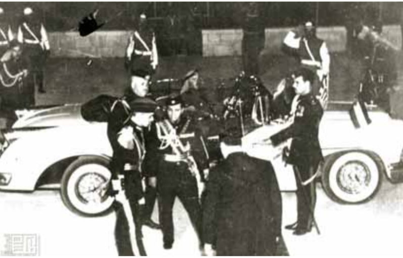
في حفل تويج صاحب الجلالة الملك الحسين المعظم رحمه الله يظهر في الصورة من اليمين الملازم عواد الخالدي/ المقدم محمد سعيد السعدي / بمنصف الصورة صاحبي الجلالة الملك الحسين رحمه الله والملك فيصل رحمه الله

تنشر ابواب - الرأي مجموعة من المقتنيات المهمة من الصور الفوتوغرافية والوثائق التي تقوم علي دراستها وارشفتها دائرة المكتبة الوطنية، وتشكل مفرات مهمة من ذاكرتنا الوطنية.