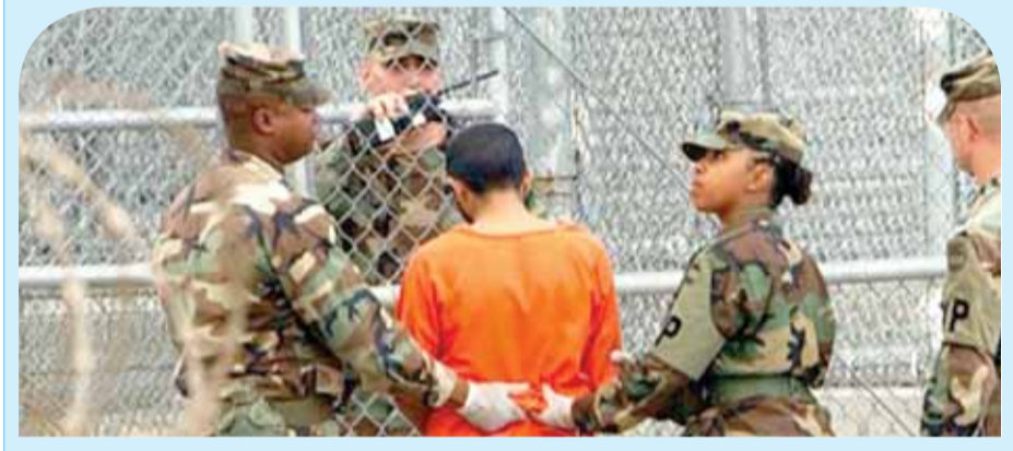
خبير في الأمم المتحدة: أميركا تواصل التعذيب في معتقل جوانتانامو قال نيلز ميلنسر مقرر الأمم المتحدة الخاص المعني بالتعذيب في بيان أمس إن أحد نزلاء معتقل جوانتانامو الأميركي في كوبا لا يزال يتعرض للتعذيب. وأنه الرئيس الأميركي السابق باراك أوباما استخدام «أساليب الاستجواب المعززة» عبر أمر تنفيذي أصدره في كانون الثاني ٢٠٠٩ لكن ميلنسر قال إن استخدام التعذيب بحق من تحتجزهم وكالة المخابرات المركزية الأميركية (سي.آي.إيه) لم يؤد بعد إلى ملاحقات قضائية ولا تعويضات لضحايا.