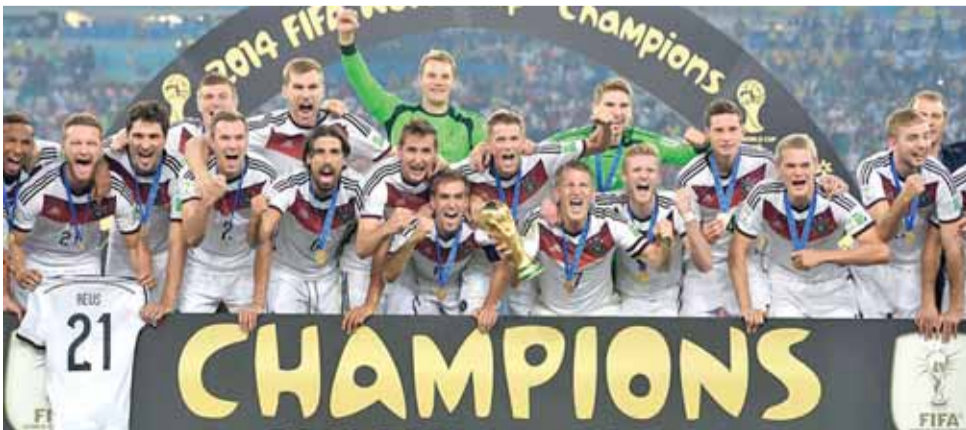
المنتخب الألماني بطل كأس العالم ٢٠١٤

برلين - أ ف ب - أعلن الاتحاد الألماني لكرة القدم، أمس، على موقعه الرسمي في شبكة الانترنت أن كل لاعب سينال ٣٥٠ الف يورو مكافأة في حال احتفاظ المنتخب بلقب كأس العالم في المونديال الروسي الصيف المقبل. وهي المكافأة الأكثر أهمية التي سيحصل عليها لاعبو المنتخب الألماني في نهائيات كأس العالم، بعد أن حصل كل منهم على ٣٠٠ الف يورو بعد التتويج باللقب العالمي في البرازيل عام ٢٠١٤. ولم يرصد الاتحاد الألماني أي مكافأة في حال التأهل إلى الدور ثمن النهائي، لكنها ستكون ٧٥ الف يورو لكل لاعب في حال بلوغ ربع النهائي، ثم ١٢٥ الف يورو في حال بلوغ دور الأربعة، ثم ١٥٠ الف يورو في حال انتهاء العرس العالمي في المركز الثالث، و٢٠٠ الف يورو في حال حجز بطاقة النهائي على ملعب لوجنيكي في موسكو. وقال الامين العام للاتحاد الألماني فريدريك كوربوس ان «المفاوضات مع القائد مانويل نوير والفريق بأكمله كانت هادئة ومفتوحة وسهلة..» من جهته، قال رئيس الاتحاد الألماني راينهارد