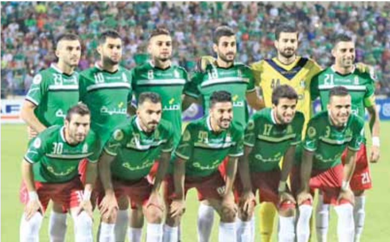
فريق الوحدات تصدر المشهد في عدد الجماهير التي أرتته

عمان - بترا - كشف اتحاد كرة القدم، عن احصائيات الحضور الجماهيري لمباريات الموسم الكروي الحالي ٢٠١٧-٢٠١٨ حتى الآن، كما كشف المبالغ المالية التي دخلت صناديق الأندية من ريع مباريات الدوري والكأس والدرع ومباراة كأس الكؤوس. ويبلغ مجموع الجماهير المشجعة لجميع الأندية التي دخلت الملاعب في جميع المباريات حتى الآن، ٢٢٢٧٥. وتصدر الوحدات المركز الأول في عدد الجماهير التي أرتت الفريق في ملعبه وخارج ملعبه، في مجموع المباريات التي اقيمت في الموسم الكروي الحالي حتى الآن، فيما تصدر الفيصلي قائمة الفرق الأكثر دخلاً لعابته الآن. ونجح مشروع ادارة عملية بيع التذاكر الذي استحدثه اتحاد الكرة في الموسم الحالي، في مضاعفة دخل أندية المحترفين، بعدما تولى الاتحاد مسؤولية الاشراف على طباعة وبيع التذاكر.