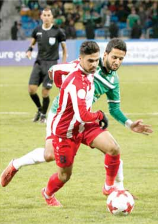
قبل نهائي الكأس يعود عبر إياب الوحدات وشباب الأردن غدا الجمعة

للدخول أعضاء مجلس إدارة النادي وحملة الباجات الخاصة الصادرة من اتحاد الكرة بمركباتهم، والمدخل لجمهور نادي الوحدات والمدخل لجمهور نادي شباب الأردن مشياً على الأقدام. وبالنسبة لمباراة الجزيرة الفيصلي، تم اعتماد ما نسبته ٧٥٪ من سعة المدرجات لجمهور الفيصلي و٢٥٪ لجمهور الجزيرة بواقع (٤٤٠٠) تذكرة للدرجة الأولى يسار المنصة لجمهور الفيصلي، ومثلها على يمين المنصة لجمهور الجزيرة، إلى جانب (٦٤٠٠) تذكرة للدرجة الثانية لجمهور الفيصلي وبناء على طلب إدارة نادي الجزيرة حددت أسعار التذاكر بـ ١٥ دينار للدرجة الخاصة، ٥ دنائير للدرجة الأولى، ٣ دنائير للدرجة الثانية. وتقرر تخصيص البوابة رقم (٢) لدخول أعضاء مجلس إدارة النادي وحملة الباجات الخاصة الصادرة من اتحاد الكرة بمركباتهم، والمدخل لجمهور نادي الفيصلي والمدخل لجمهور نادي الجزيرة مشياً على الأقدام. وسيعقد المؤتمر الصحفي الخاص بالمباراةين بعد ١٥ دقيقة من نهاية المباراة وبإشراف المنسق الإعلامي التابع لاتحاد الكرة، وتقع مهمة احضار المدير الفني على عاتق المنسقين الاعلاميين للأندية، مع التأكيد على تطبيق ما جاء في اللائحة التأديبية في هذا الامر.