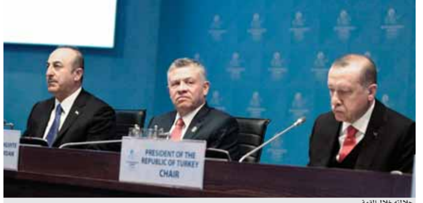
جلالته خلال القمة