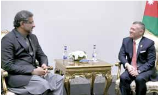
رئيس وزراء باكستان

وشكر اللقاءين رئيس الوزراء، ووزير الخارجية وشؤون المغتربين، ومدير مكتب جلالة الملك.