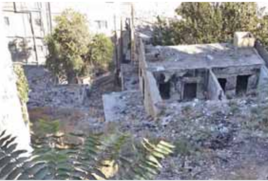
مكاره صحية في المنازل المهجورة