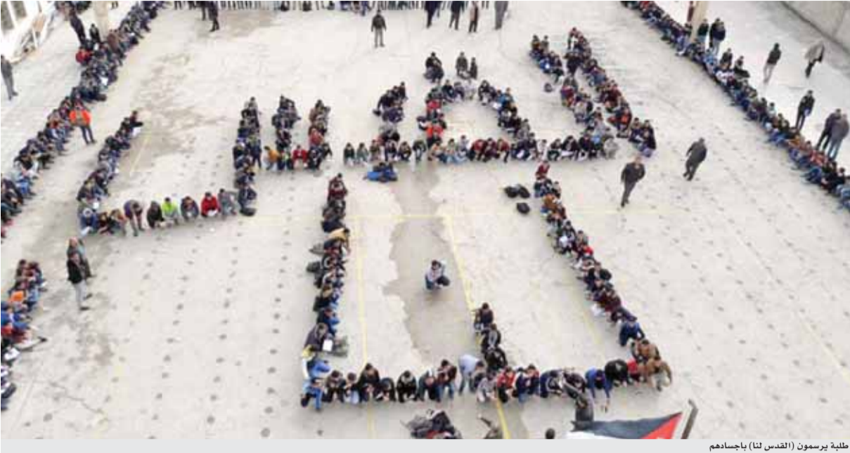
طلبة يرسمون (القدس لنا) باجسادهم