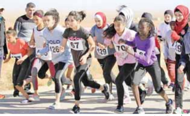
من أحد سباقات البطولة