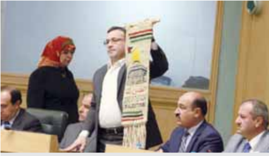
نائب يحمل منظراً للقدس