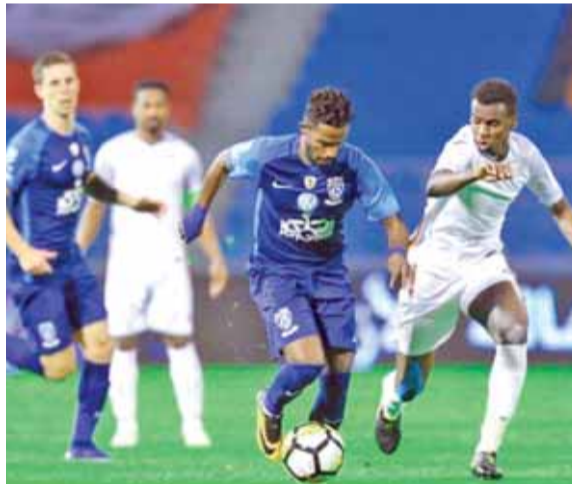
اللاعب (وسط) ينافس على الجائزة

الرأي - إنترنت - كشف الاتحاد العربي للصحافة الرياضية، عن قائمة المرشحين للحصول على جائزة أفضل لاعب عربي لعام ٢٠١٧. وأكد كاتبة الأبناء الجزائرية، أن قائمة المرشحين للحصول على جائزة أفضل لاعب عربي لعام ٢٠١٧ من جانب الاتحاد العربي للصحافة الرياضية، ضمت ١٠ لاعبين أبرزهم محمد صلاح نجم منتخب مصر ونادي ليفربول الانجليزي، والجزائري ياسين إبراهيمي لاعب بورتو البرتغالي. وقائمة المرشحين ضمت أيضاً كلاً من، عمر السومة مهاجم منتخب سوريا والأهلي السعودي، ونواف العابد لاعب منتخب السعودية والهلال، والمغربي كريم الأحمدى المحترف في فينورد الهولندي.