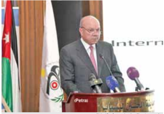
رئيس مجلس الاميان يتحدث في الاحتفال

وقال رئيس هيئة النزاهة ومكافحة الفساد محمد العلاف، إن الإحتفال باليوم الدولي لمكافحة الفساد يأتي كجزء أساسي من الجهود الدولية الرامية للسيطرة على هذه الظاهرة،