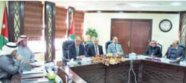
رئيس ديوان المحاسبة متحدتاً خلال الدورة التدريبية