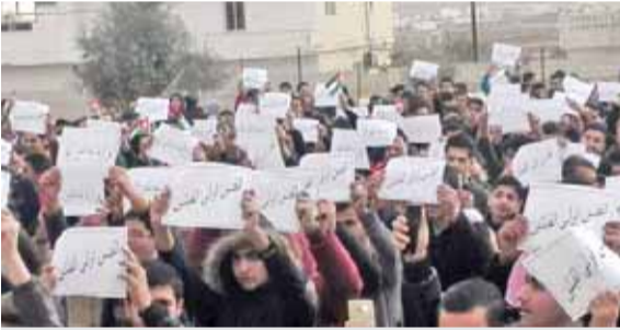
طلبة يشاركون في وقفة نصرة القدس

والثاني في كل المحافل الإقليمية والدولية للدفاع عن القضية الفلسطينية وحقوق الشعب الفلسطيني، وما يقوم به الأردن من إعمار هاشمي للمقدسات الإسلامية والمسيحية في مدينة القدس. وأكد الطلبة والمعلمون خلال مشاركاتهم، أهمية الوقوف خلف القيادة الهاشمية، وتمييز اللحمة الوطنية بين مكونات الشعب الأردني، ودعم الجهود التي يقوم بها جلالته الملك عبد الله الثاني للدفاع عن القضية الفلسطينية، والاعتزاز