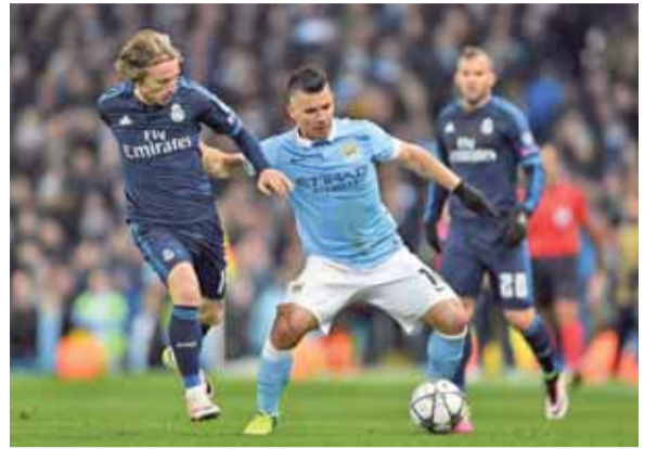
مواجهة متوقعة بين ريال مدريد ومانشستر يونايتد

الرأي - إنترنت - تشخص اليوم الأخطار عند الواحدة بتوقيت عمان، صوب مدينة نيون السويسرية عندما تجري مراسم سحب قرعة دور الـ١٦ لدوري أبطال أوروبا، لتتنر بمواجهات قوية ومن نوع خاص.