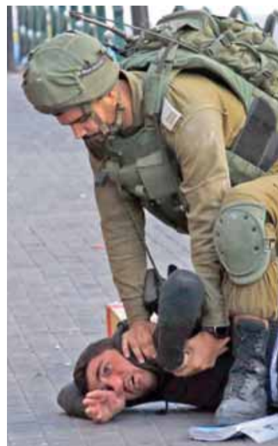
الاحتلال يعتدي على شاب في الخليل

الطعن يعود لشوارع القدس.. ومواجهات عنيفة في الضفة