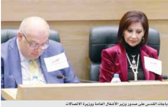
باجات القدس على صدور وزير الأشغال العامة ووزارة الاتصالات

وقال الطراونة: «بناءً على طلب من الأردن عبر مجلس النواب فقد قرر اتحاد مجالس الدول الأعضاء بمنظمة التعاون الإسلامي عقد اجتماع طارئ للمجموعة الرئاسية في الاتحاد ولجنة فلسطين الدائمة بالإتحاد في الثامن عشر من الشهر الجاري، ليبحث التداعيات الخطيرة جراء قرار الرئيس الأميركي بنقل السفارة الأمريكية إلى القدس المحتلة». وأشار إلى أنه وصل المجلس رُ من الاتحاد بالمواقفة على أن يحمل المؤتمر الثالث عشر للاتحاد، شعار القدس، عنواناً له، والذي سيعقد في طهران في الثالث عشر من الشهر المقبل. ولفت الطراونة إلى أنه سيعقد اجتماع طارئ للبرلمان العربي اليوم الإثنين في القاهرة بمقر جامعة الدول العربية، كما سيعقد الاتحاد البرلماني العربي اجتماعاً طارئاً في المغرب في الرابع عشر من الشهر الجاري كما وصلته رسالة من رئيسة الاتحاد البرلماني الدولي تؤكد فيها أن موقف الاتحاد مثل موقف مجلس النواب الأردني وأنسأ لقرار الإدارة الأمريكية لنقل السفارة الأمريكية من تل أبيب إلى القدس وادراك الاتحاد أن هذا القرار يقوض الوضع السياسي والقانوني لتسوية سلمية بين إسرائيل وفلسطين ويتناقض مع قرار رقم ٢٣٣٤ الصادر عن مجلس الأمن التابع للأمم المتحدة وسيكون لهذا القرار عواقب على عملية لتسوية السلام في الشرق الأوسط. وأكد أن هذا الجهد البرلماني يعد حلقة في سلسلة الإجراءات التي بدأتها المملكة في الدفاع عن القدس بقيادة جلالة الملك عبد الله الثاني، حيث أعلن الرئيس التركي رجب طيب أردوغان خلال لقائه جلالة الملك في إسطنبول قبل أيام، عن عقد قمة استثنائية لمنظمة التعاون الإسلامي في إسطنبول هذا الأسبوع حيث سيحضرها جلالة الملك.