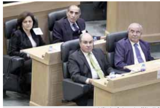
الملقي خلال حضوره جلسة مجلس النواب