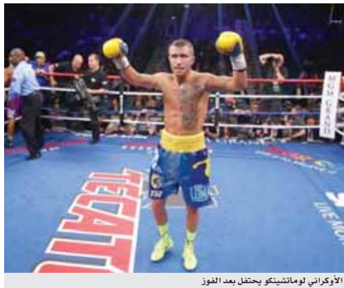
الأوكراني لوماتشينكو يحتفل بعد الفوز

نيويورك - رويترز - احتفظ الملاكم الأوكراني فاسيل لوماتشينكو بلبق وزن فوق الريشة لمنظمة الملاكمة العالمية بعد فوزه بالضربة القاضية الفنية في الجولة السادسة على منافسه الأنفة في جويروم ريجوندو في ماديسون سكوير جاردن في نيويورك الليلة الماضية. وهذه هي الهزيمة الأولى للملاكم الأمريكي المولود في كوبا منذ تحوله للاحتراق. وانتهت المباراة التي جمعت بين بطلين أولمبيين بصور غير متوقمة عندما أبلغ ريجوندو الحكم أنه لا يرغب في الاستمرار بسبب إصابة في الرغب واليد قبل بداية الجولة الرابعة. وكان جميع قضاة المباراة الثلاثة أجمعوا على تفوق الملاكم الأوكراني حتى انسحاب منافسه من المباراة وسط خيبة أمل الجمهور لتصبح هذه