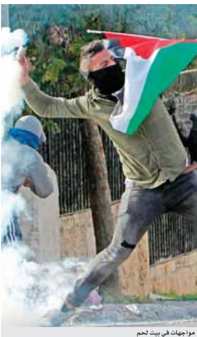
مواجهات في بيت لحم