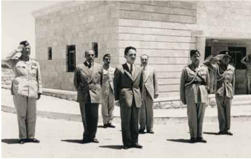
المغفور له بادن الله الملك الحسين بن طلال في زيارة للقيادة العامة للقوات المسلحة الاردنية ١٩٥٦ ويظهر في الصورة محمد علي المجلوني/ بهجت التلهوني/ بهجت طيارة/ راضي عناب/ مازن المجلوني/ ابراهيم عثمان

تنشر ابواب - الرأي مجموعة من المقتنيات المهمة من الصور الفوتوغرافية والوثائق التي تقوم علي دراستها وارشفتها دائرة المكتبة الوطنية، وتشكل مفردات مهمة من ذاكرتنا الوطنية.