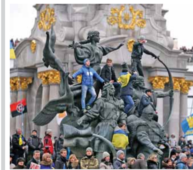
صورة ارشيفية من احتجاجات ماي دان