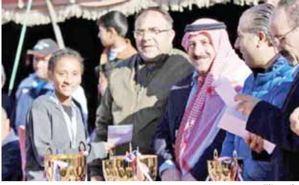
جانب من التتويج