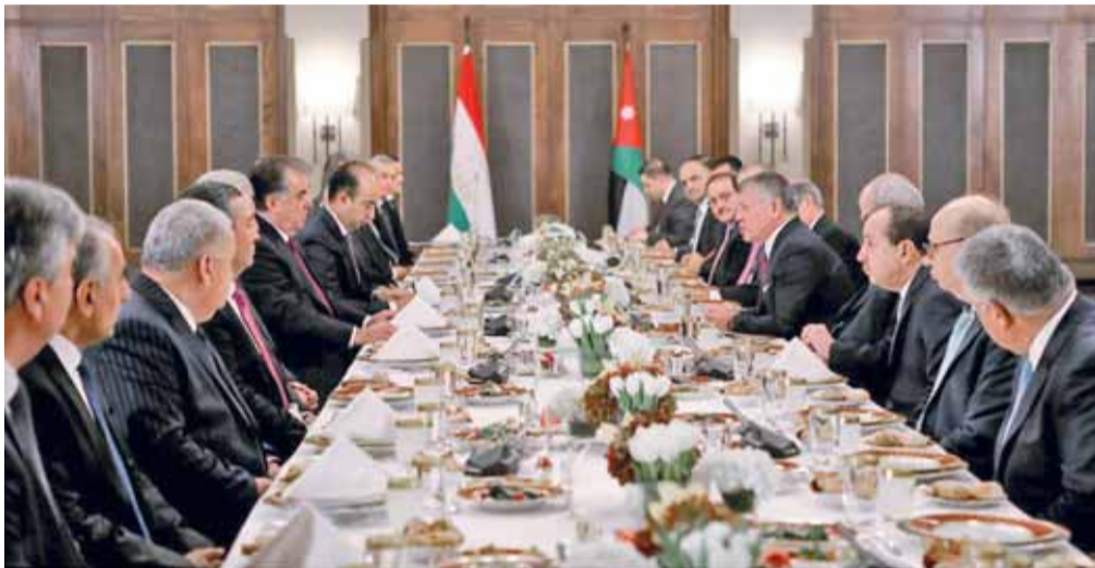
جلالته ورحمان يترأسان جلسة المباحثات

مكافحة الإرهاب والتطرف وتهريب المخدرات الرغبة بإنشاء مجلس مستثمري الأردن وطاجيكستان وتوفير الإطار القانوني للأنشطة الاقتصادية رفض قرار ترمب وتكثيف الجهود لحماية الفلسطينيين