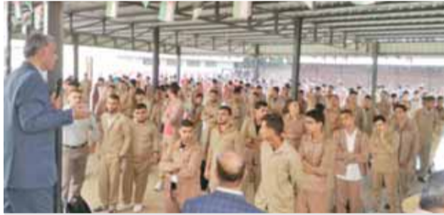
معلم يتحدث في طاوور صباحي