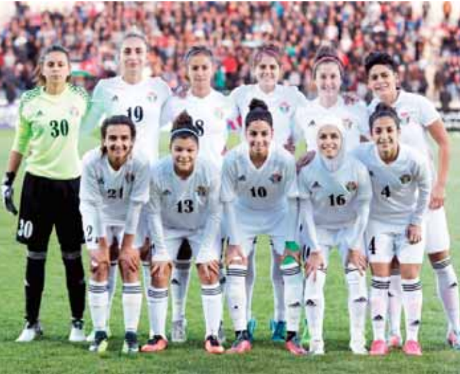
المنتخب النسوي لكرة القدم يكثف التحضيرات