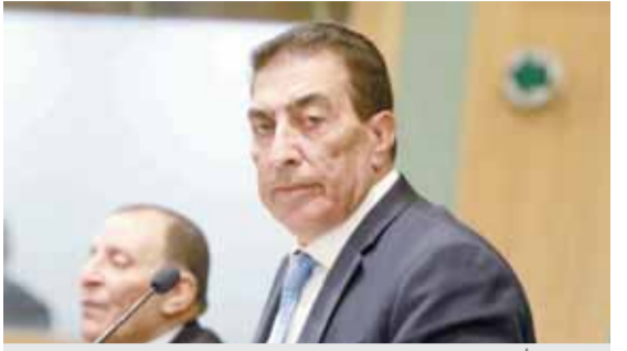
الطراونة يترأس الجلسة