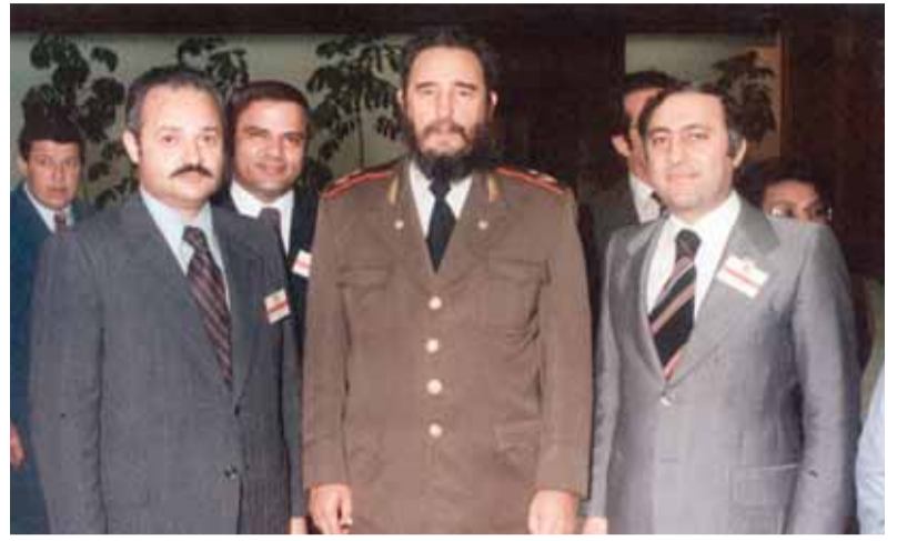
الرئيس الكويبي الراحل هيدل كاسترو ومعه سامي قموه وعدنان ابو عودة وابراهيم شهزادة خلال مؤتمر دول عدم الانحياز الذي انعقد في العاصمة هافانا عام ١٩٧٨.

للاستفسار وابداء الملاحظات والتوثيق بالشخصيات والاماكن الواردة في الصور نامل من الغراء الاتصال مع دائرة المكتبة الوطنية، على الارقام، /٠٦٦٦٦٢٨٥٤ /٠٦٦٦٦٢٨٥٤ / فرسي ٢٠٩٨ البريد الالكتروني، www.nl.gov.jo