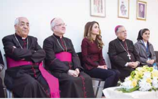
جلالته خلال زيارته لمركز سيدة السلام