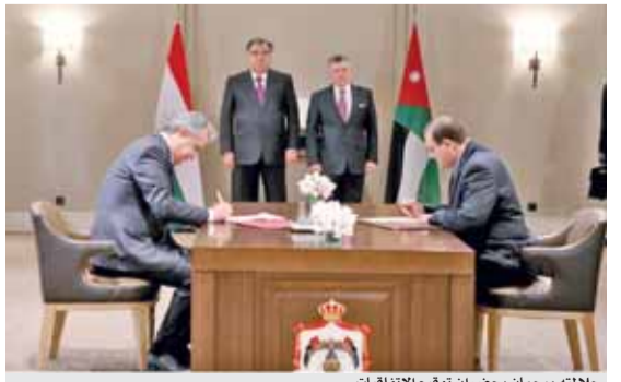
جلالته ورحمان يحضران توقيع الاتفاقيات