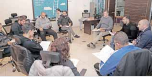
جانب من فعاليات البرنامج