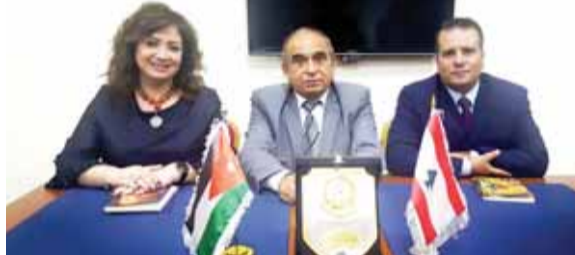
القياسية وأبو رضوان وحاديان أثناء الأمسية

يزاحمني ظلها في الصباح أنا عاشق امرأة لا يحل على غصنها غير شعري.