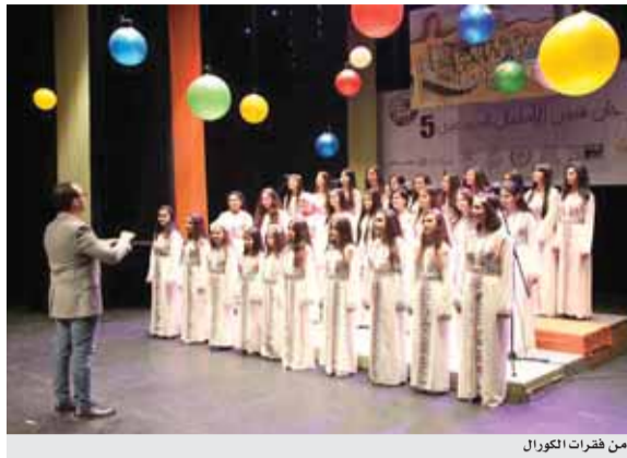
من فقرات الكورال