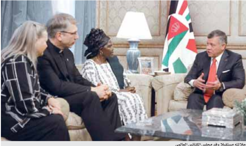
جلالته مستقبلا وفد مجلس الكنائس العالمي

عمان - بترا - استقبل جلالة الملك عبدالله الثاني، في قصر بسمان امس، وفد مجلس الكنائس العالمي، الذي يزور المملكة للمشاركة في اجتماع اللجنة التنفيذية للمجلس المنعقد في عمان. وأكد جلالته، خلال اللقاء، أن الأردن ومن منطلق الوصاية الهاشمية على المقدسات الإسلامية والمسيحية في القدس، سيواصل جهود للحفاظ على الأماكن المقدسة والدفاع عن ممتلكات الكنائس في جميع المحافل الدولية.