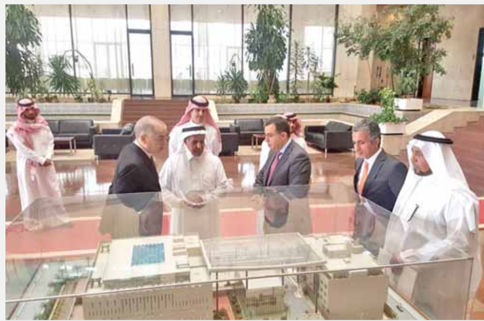
من زيارة الوزير الفاخوري للسعودية

عمان - الرأي - بحث وزير التخطيط والتعاون الدولي عماد الفاخوري مع نائب رئيس مجلس إدارة الصندوق السعودي للتنمية والعضو المنتدب المهندس يوسف بن إبراهيم البسام علاقات التعاون الاقتصادي بين الأردن والسعودية واليات تطويرها في مختلف المجالات. وذكر بيان لوزارة التخطيط أمس ان المباحثات جاءت خلال زيارة للفاخوري إلى المملكة العربية السعودية لتناول تعزيز علاقات التعاون الاقتصادي بين البلدين واليات تطويرها والبناء عليها في المجالات الاقتصادية والتنموية والمشاريع التنموية. ووفق البيان شكر الفاخوري المملكة العربية السعودية ملكاً وحكومة وشعباً على دورها في دعم الجهود التنموية في الأردن، معرباً عن تطلع المملكة الدائم لتوثيق عرى التعاون الثنائي مع المملكة العربية السعودية ومؤسساتها المختلفة لما فيه مصلحة وخير الشعبين الشقيقين. وأكد حرص الأردن على البناء على هذه العلاقات التاريخية والاستراتيجية التي أرسى دعائمها جلالة الملك عبد الله الثاني وأخيه خادم الحرمين الشريفين الملك سلمان بن عبد العزيز، وولي عهده نائب رئيس مجلس الوزراء ووزير الدفاع الأمير محمد بن سلمان آل سعود. وأشار الفاخوري الى ان الجانبين راجعا خلال الزيارة التي اختتمت أمس تقدم سير العمل في كافة المشاريع الممولة من خلال مساهمة المملكة العربية السعودية في المنحة الخليجية. وبهذا الخصوص نقل البيان عن البسام شكر وتقدير الصندوق السعودي للحكومة الأردنية على كفاءتهم في إدارة تنفيذ ملف المنحة الخليجية، وسرعة استجابتهم للمتطلبات التنموية، مؤكداً حرص واستعداد الصندوق الدائم للوقوف الى جانب الأردن لدعم البرامج والمشاريع التنموية ذات الأولوية. ووضع الفاخوري المسؤولين