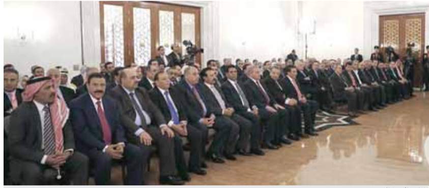
نواب يتابعون الرد

دراسة وإقرار مشاريع القوانين الاقتصادية ذات الأولوية ثمن وندعم جهود القوات المسلحة والأجهزة الأمنية وتماسك شعبنا ووعيه