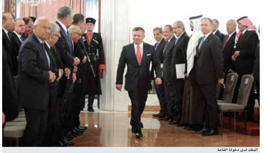
الملك لدى دخوله القاعة