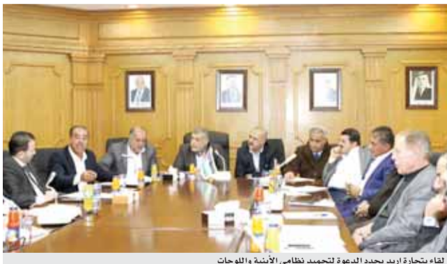
لقاء تجارة اربد يجدد الدعوة لتجميد نظامي الأبنية واللوحات

اهمية اعادة النظر بهما ومعالجة الاختلالات التي ترتب عليهما. وعقب اللقاء اعلن طيبشات عن تشكيل لجنة تضم ممثلين عن مختلف القطاعات والهيئات لصياغة مذكرة على شكل توصيات سبصار الى الجهات ذات العلاقة في السلطتين التشريعية والتنفيذية ولم يستبعد اتخاذ خطوات تصعيدية في حال عدم الاستجابة لهذه المطالب.