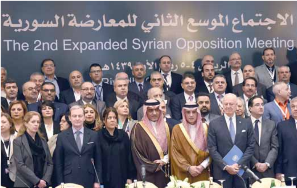
صورة لاجتماع المعارضة السورية في الرياض بصحبة وزير الخارجية السعودي ووزير الشؤون الخليجية السعودي والمبعوث الأممي لسوريا