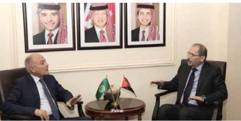
وزير الخارجية مستقبلا أمين عام الجامعة العربية

عمان - بترا - التقى وزير الخارجية وشؤون المغتربين ايمن الصفدي امس الأمين العام لجامعة الدول العربية أبو الغيط. ويبحث الجانبان المستجدات على الساحة العربية، والجهود المبذولة لحل الأزمات السياسية ومعالجة تبعاتها على أسس تضمن تحقيق الأمن والاستقرار وتحمي الأمن القومي العربي. واستعرضت المحادثات المستجدات في جهود إعادة تفعيل الجهود السلمية المستهدفة حل الصراع الفلسطيني الاسرائيلي على أساس حل الدولتين ووفق قرارات الشرعية الدولية ذات الصلة ومبادرة السلام العربية، كما تناولت التطورات في سورية واليمن وليبيا والحرب على الإرهاب. واكد الصفدي وأبو الغيط استمرار العمل العربي المشترك، والجهود المبذولة لتطوير عمل الجامعة العربية وتعزيز دورها كمظلة جامعة للعمل العربي وبما يحمي المصالح العربية. وشدد على أن الظروف الصعبة التي