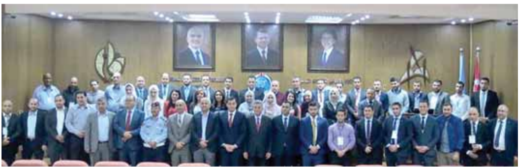
المشاركون بالبرنامج التدريبي

من الإدارات العليا والإدارات التنفيذية وخاصة في فرع تأمين المركبات من منتسبي شركات التأمين والاتحاد ومديرية الأمن العام ومسوي خسانر، وشارك في أعمال البرنامج ٤٧ من العاملين في دوائر تأمين السيارات من شركات التأمين المحلية ومن المؤسسات المحلية الكبرى ومنهم ٤ مشاركين من دولتي فلسطين وليبيا.