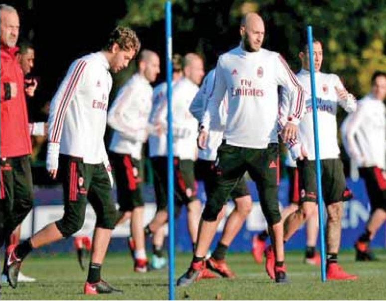
من تدريبات لاعبي ميلان (أسمن)

باريس - أ ف ب - يسعى ميلان الإيطالي الى تعويض خيبته المحلية على الساحة الأوروبية بحسم تأمله الى الدور الثاني من بطولة الدوري الأوروبي، ويوروبا ليغ، لكرة القدم عندما يستضيف أوستريا فيينا اليوم، في الجولة الخامسة.