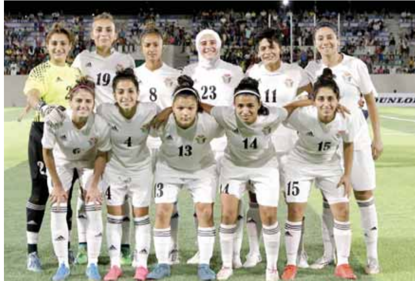
منتخب السيدات لكرة القدم

وتأتي المبارتان ضمن تحضيريات المنتخبين للمشاركة في نهائيات كأس آسيا التي يستضيفها الاردن في نيسان المقبل، والمؤهلة لكأس العالم في فرنسا ٢٠١٩. ويشارك في نهائيات كأس آسيا ثمانية منتخبات: كوريا الجنوبية، الفلبين، تايلاند، فيتنام، وأستراليا، الصين واليابان والاردن المستضيف وتحصل المنتخبات