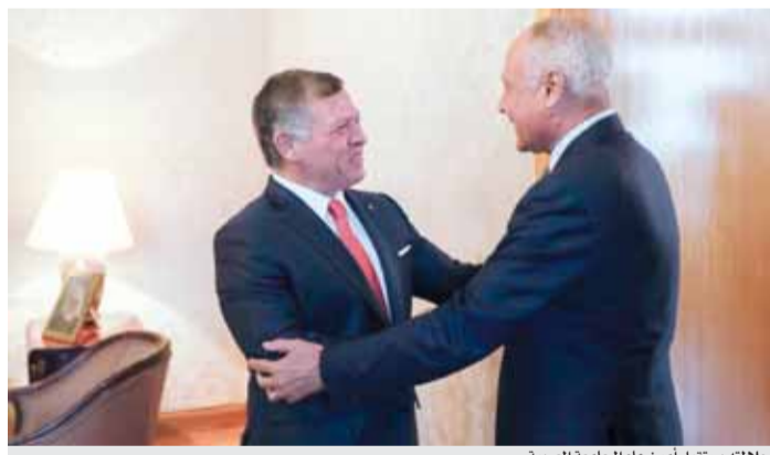
جلالته يستقبل أمين عام الجامعة العربية

عمان - بترا - استقبل جلالة الملك عبدالله الثاني، في قصر سمان أمس الأربعاء، الأمين العام لجامعة الدول العربية أحمد أبو الغيط. وأكد جلالة الملك حرص الأردن على دعم كل جهد يصب في تعزيز التعاون والعمل العربي المشترك وتنسيق المواقف وخدمة القضايا العربية، خاصة في هذه المرحلة الصعبة. كما استقبل جلالة الملك، وفد مجلس الكنائس العالمي، حيث أكد جلالته أن المسيحيين العرب هم جزء لا يتجزأ من المنطقة، وعناصر رئيس من هويتها، مضيفاً جلالته أن تناقص أعداد المسيحيين في القدس أمر مقلق ومحزن، فالقدس يجب أن تكون على الدوام رمزاً للأمل والسلام، وليس رمزاً للتفرقة والتقسيم. (التفاصيل ص٣)