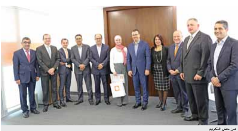
من حفل التكريم

يجري في الولايات المتحدة الأمريكية ويستمر لمدة ٤٠ يوماً، وقد تم اختيار الأردنية الخمس بعد منافسة شديدة بين ١٠٠ مشاركة من ٢١ دولة من أصل أربعة آلاف طلب تم تقديمه.