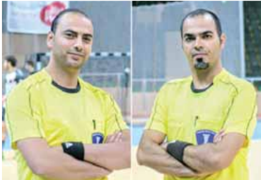
اختيار الزيات وعود تحكيم النهائيات الآسيوية

اللعبة ابلغ نظيره الآسيوي بموافقته على مشاركة الزيات وعود بالمهمة الجديدة. يشار ان الطاقم الأردني عاد قبل عدة