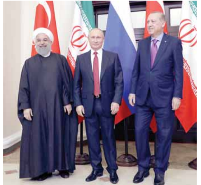
أردوغان وبوتين وروحاني يجتمعون في سوتشي

استنادا إلى قرارات الأمم المتحدة، مشددا في الوقت نفسه على ضرورة الحفاظ على سيادة ووحدة واستقلال سوريا.. كما أعلن البيت الأبيض أن الرئيسين شردا على الحاجة إلى إيجاد «حل سلمي للحرب الأهلية السورية، وإنهاء الأزمة الإنسانية، والسماح للاجئين السوريين بالعودة إلى بلادهم، وضمان الاستقرار في سوريا موحدة بعيدا من التدخلات وخالية من المملدات الأمنية للإرهابيين». من جهته أعلن الرئيس الإيراني حسن روحاني «النصر، على «داعش»، في العراق وسوريا، ناسبا هذا «النصر الكبير»، إلى «العمل الأساسي للشعوب والجيوش السورية والعراقية واللبتانية». وأوضح للرئيس الفرنسي إيمانويل ماكرون في اتصال هاتفي معه الثلاثاء أن إيران تريد «تجنب تفتيت دول المنطقة وليس السيطرة عليها».