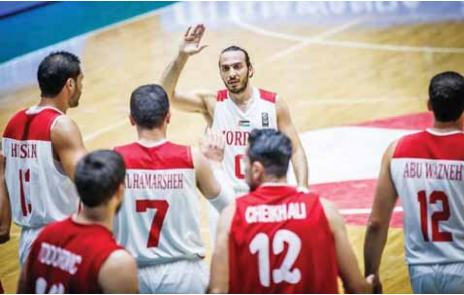
منتخب السلة يتطلع لانطلاقه قوية

ويشارك في التصفيات الآسيوية المؤهلة إلى كأس العالم ستة عشر منتخباً وزعت على أربع مجموعات، وستلعب المنتخبات في الدور الأول ضد بعضها البعض ذهاباً وإياباً على أن تتأهل المنتخبات الثلاث الأولى في كل مجموعة من المجموعات الأربع إلى الدور الثاني من التصفيات. وستتوزع المنتخبات الـ ١٢ المتأهلة إلى الدور الثاني على مجموعتين، حيث تتأهل