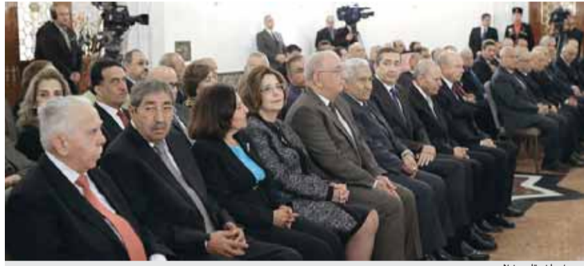
اعيان يتابعون الرد

تنفيذ خطة تحفيز النمو الاقتصادي ورفع مستوى معيشة المواطنين وتمكين الطبقة الوسطى