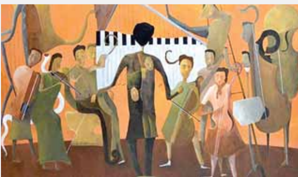
من أعمال المعرض

تهض أعمال الفنان الشوا بشكل كبير على تصوير لحظات واقعية من الحياة، وتنتج عن دراسة وتحليل لهذه اللحظات للتعبير عنها كحالة واحساس وليس كمجرد مشهد. يستخدم الشوا الذي درس الفن في إيطاليا وانجلترا، في أغلبية أعماله الأكريليك والزيت على القماش او الخشب، وادخل في كثير من الأحيان تكتيك الفن التلصقي (الكولاج) لتركيز فكرة معينة او ربط العمل بمحيطه بشكل واقعي.