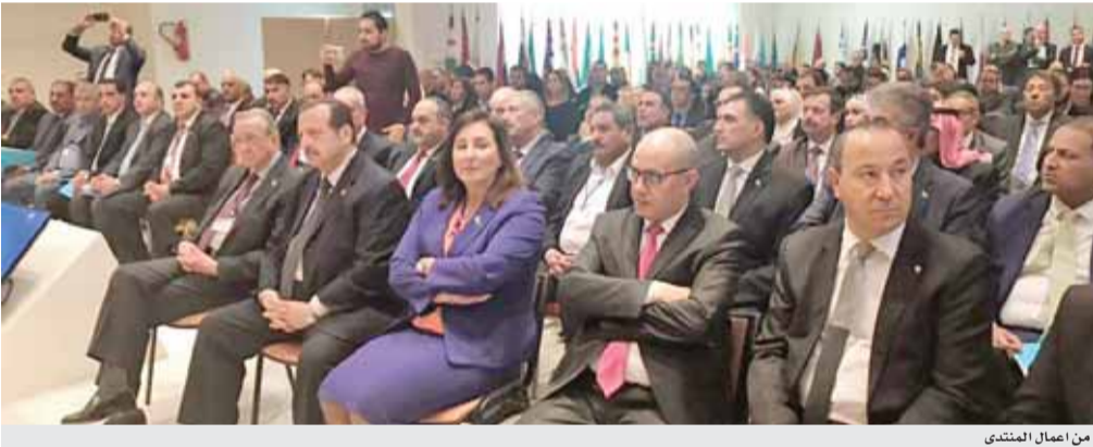
من أعمال المنتدى

كما شملت التوصيات تشكيل لجنة مشتركة من خبراء من الأردن والدول الاضياء في اتفاقية اغادير، لبحث السبل الكفيلة بإزالة العقبات المختلفة التي تحول دون تنفيذ وتفعيل الاتفاقية بين الدول ذات العلاقة.