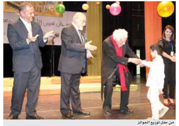
من حفل توزيع الجوائز