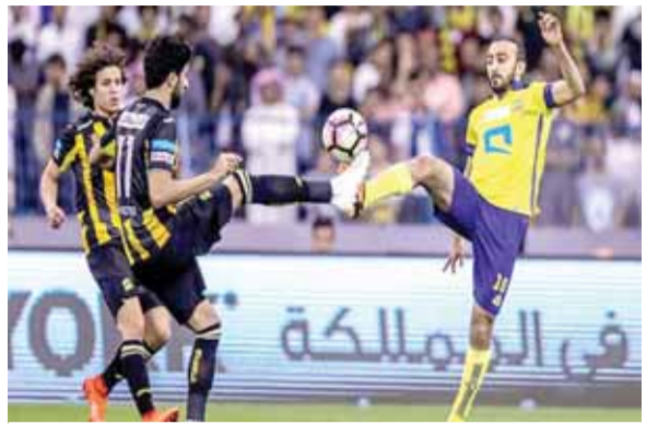
السهلاوي والأصناري في حوار كروي سابق

الرياض - أ ف ب - يصطدم النصر بضيفه الاتحاد في قمة المرحلة الحادية عشرة للدوري السعودي لكرة القدم اليوم الخميس في الرياض.