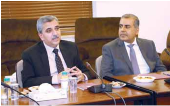
أبو حمور خلال لقائه الوفد الإماراتي

استطاع ان يحقق طموحات وامال الشعوب في الحياة الكريمة وفرص العمل المناسبة. ونوه ابوحمور بنجاح الأردن في المحافظة على استقراره وبناء قواعد متينة للنمو الاقتصادي بالرغم من