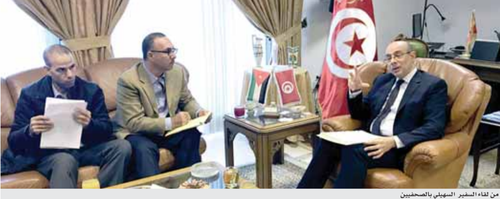
من لقاء السفير السهيلي بالصحفيين

وقال السهيلي إن حجم المبادلات التجارية بين البلدين متواضع، ولا يتجرم مائة العلاقات الأردنية التونسية ولا يرتقي إلى مستوى الطموحات السياسية، مبينا أن حجم المبادلات التجارية خلال التسعة أشهر الأولى من العام الحالي بلغ ٥٨,٣ مليون دينار تونسي أي بنسبة نمو ١٨,٤ بالمائة مقارنة مع الفترة نفسها من العام الماضي. وأضاف أن حجم الاستثمارات الأردنية في تونس يقدر بنحو ١٢٧ مليون دينار تونسي، وساهمت هذه الاستثمارات