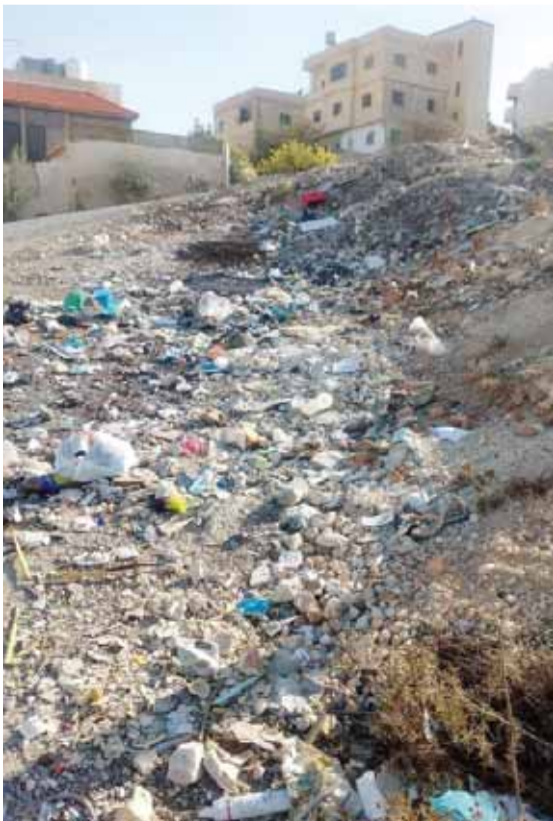
.. وشوارع مليئة بالحفر