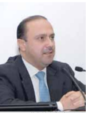
المومني يحاضر في القيادة والاركان

عمان - بترا - قال وزير الدولة لشؤون الإعلام الناطق الرسمي باسم الحكومة الدكتور محمد المومني، إن من أهم ما يميزنا في الأردن هو سياستنا الحكيمه والمعتدلة والمتوازنة تجاه مختلف التحديات والأزمات، والتي تأتي إضافة لرؤية وتوجهات جلالة الملك.. وأكد المومني خلال محاضرة ألقاها امس الأحد، في كلية القيادة والأركان الملكية الأردنية بعنوان: «الاستراتيجية الإعلامية الأردنية، أن حكمة قيادتنا الهاشمية، وتعاقدنا جميعاً في وجه التحديات التي تواجه الوطن، والتزامنا بالثوابت الوطنية، واحترافية مؤسساتنا العسكرية والأمنية، وعوي مواطننا وانتمائه لوطنه هو الرصيد الحقيقي لوطننا الذي جعل الأردن يتجنب الكثير من التحديات. وأضاف أن إعلامنا الوطني، المتميز بالثوابت الوطنية والقومية، والذي يعمل وفق المصلحة الوطنية، هو عامل أساسي في إنجاح مسيرتنا نحو الإصلاح وترسيخ أسباب الأمن والمنعة والاستقرار، مؤكداً أن الأردن يُعتبر من أفضل النماذج التي نجحت في تحويل منظومة الإعلام المتميز لتكون رافداً وسندا لمصالح الدولة العليا ووحدها ومنعتها في مواجهة التحديات. وأوضح المومني أن الاستراتيجية الإعلامية التي تسعى إلى تعزيز البيئة المواتمة لدعم وجود إعلام أردني مستقل ومستنير، يقوم على قاعدتي الحرية والمسؤولية، مشيراً إلى أن الإعلام الوطني يتميز بمعايير الانفتاح والتعددية