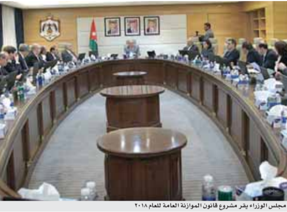
مجلس الوزراء يقر مشروع قانون الموازنة العامة للعام ٢٠١٨

الإيرادات المحلية تغطي ٩٨,٩% من النفقات الجارية