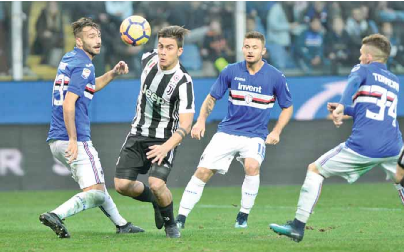
ديبالا لاعب يوفنتوس (وسط) يحاور مدافعين سمبدوريا

ورفع كافاني رصيده إلى ١٥ هدفا في ١٢ مباراة في الدوري في صدارة ترتيب الهذافين، بالإضافة إلى اربعة أهداف في دوري الابطال.