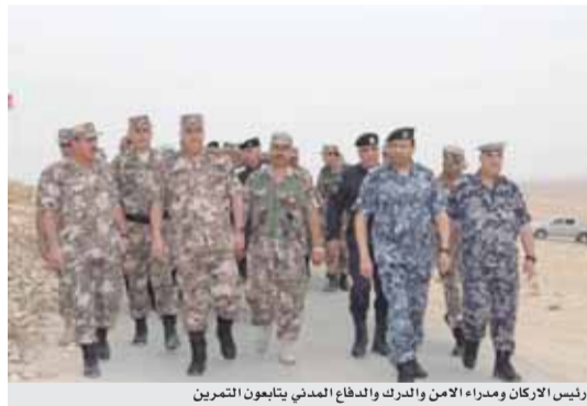
رئيس الأركان ومدراء الامن والدرك والدفاع المدني يتابعون التمرين