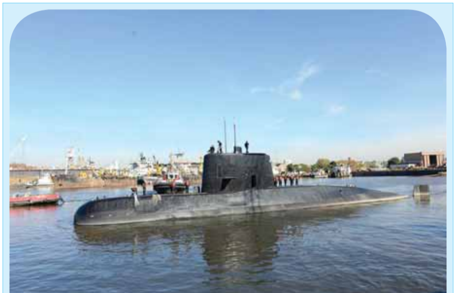
الرياح والأمواج تعرقل جهود البحث عن غواصة أر جنتينية مفقودة

بيروت - رويترز - قال قيادي في تيار المستقبل إن سعد الحريري رئيس الوزراء اللبناني المستقيل، سيزور مصر اليوم الاثنين. وقال الرئيس اللبناني ميشال عون إنه لن يقبل استقالة الحريري حتى يسلمها بنفسه ودمت كل الأطراف في بيروت إلى سرعة عودته. وانتقد الحريري إيران وحزب الله المتحالف معها في خطاب استقالته وقال إنه يخشى اغتياله.