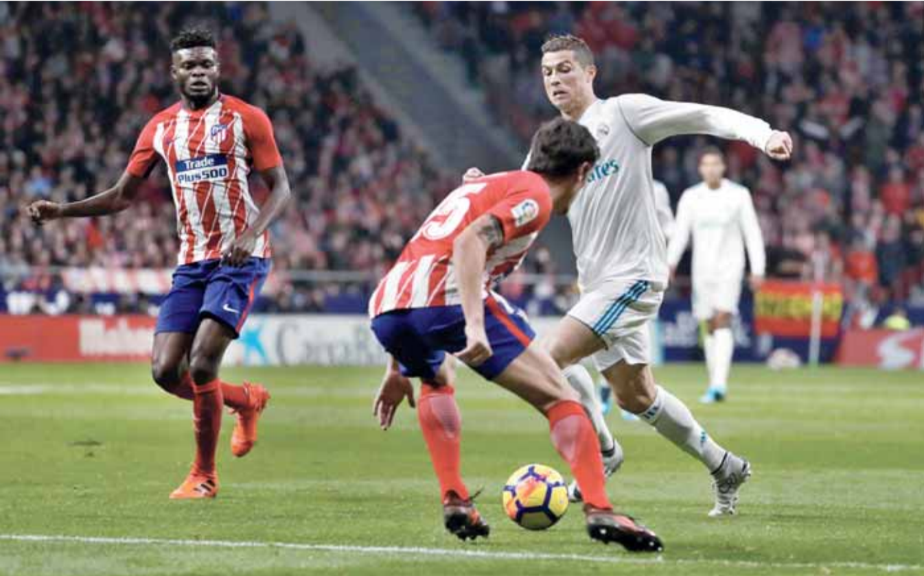
رونالدو نجم ريال مدريد يحاول تجاوز دفاع التنتيكو

يوفنتوس يخسر أمام سمبدوريا.. وبوجبا يقود يونائتد لتجاوز نيوكاسل