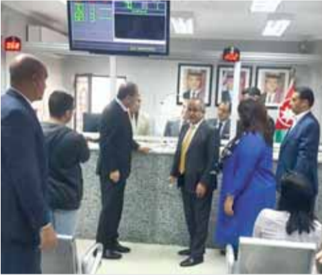
الصفدي يستمع لشرح من العايد

القاهرة - بثراً - أكد وزير الخارجية وشؤون المغتربين أيمن الصفدي أن تقديم الخدمات للمواطن الأردني هو واجب وأولوية قصوى تنفيذاً لتوجيهات جلالة الملك عبدالله الثاني. جاء ذلك خلال زيارة الصفدي لدار السفارة الأردنية في القاهرة امس الأحد، حيث التقى الطاقم الدبلوماسي والاداري فيها، واطلع الخدمات التي تقدمها للمواطنين.