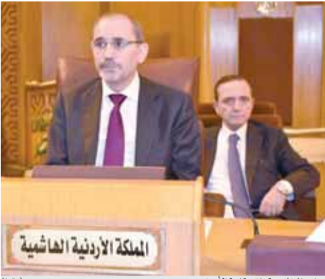
وزير الخارجية يلقى كلمة الأردن (بثراً)

القاهرة - بثراً - أكد وزير الخارجية وشؤون المغتربين أيمن الصفدي الحاجة إلى عمل عربي مشترك، يركز على تفكير عربي مشترك، وتخطيط عربي مشترك لحماية أمننا القومي العربي، في إطار تعريف شامل للأمن الليبي أيضاً متطلبات تحقيق الأمن الاقتصادي والسياسي والاجتماعي.