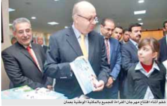
شقم أثناء افتتاح مهرجان القراءة للجميع بالمكتبة الوطنية بعمان

وفي محافظة الطفيلة أطلقت مديرية الثقافة بالتعاون مع جامعة الطفيلة التقنية، وتربية لواء