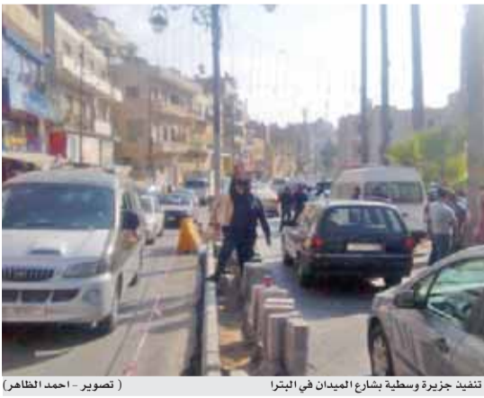
تنفيذ جزيرة وسطية بشارع الميدان في البترا

وسطية بالمكان تم تنفيذه قبل عدة سنوات الا انه اثبت عدم فاعليته لما نجم عنه من تأثيرات سلبية فاقمت ازمة المرور ولم تعمل على