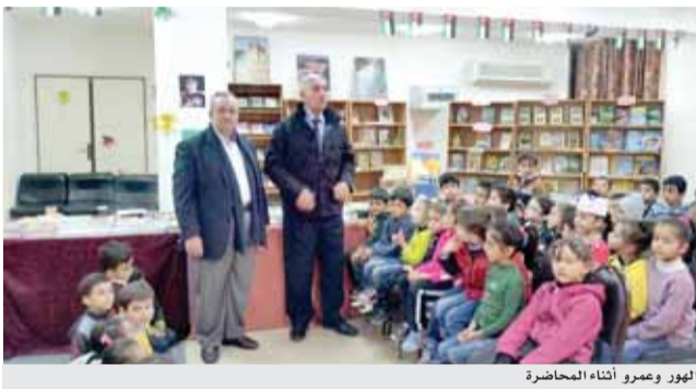
الهور وعمرو أثناء المحاضرة

وقدم محاضرة حول أهمية القراءة للطفل، تضمنت وسائل تشجيع الطفل على المطالعة ومواصفات الكتب الجيدة، تلا ذلك حوار حول الموضوع.