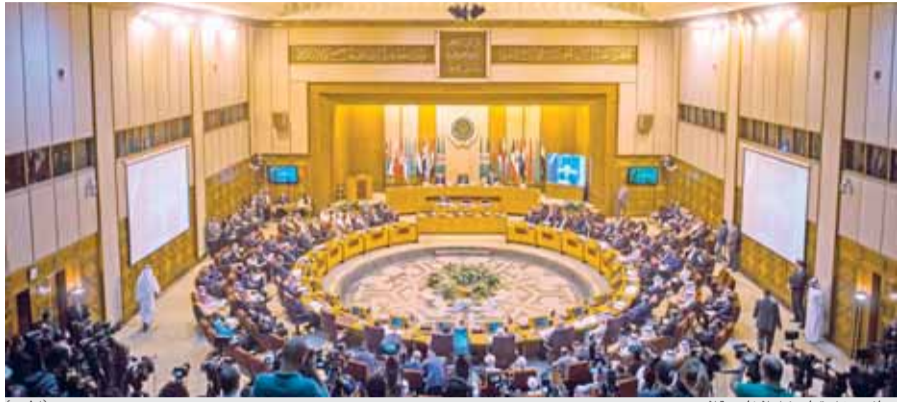
جانب من اجتماع وزراء الخارجية العرب

القاهرة - وكالات - طالبت الجامعة العربية بأن يتخذ مجلس الأمن مسؤولياته تجاه تدخلات إيران في المنطقة كما طالبت طهران لمراجعة سياساتها تجاه المنطقة ووقف تدخلاتها في الشؤون الداخلية للدول العربية.