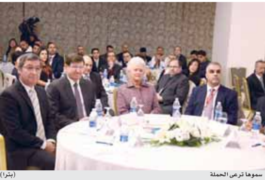
سومها ترعى الحملة

إجراء عمليات القلب المفتوح والقسطرة القلبية والشبكات، إضافة إلى الجراحة العامة.