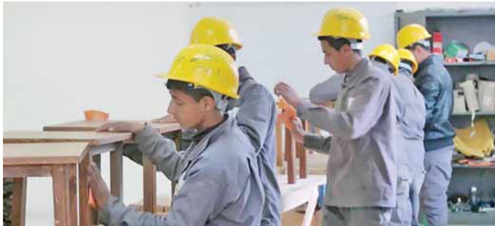
متدربون في مشاغل الشركة