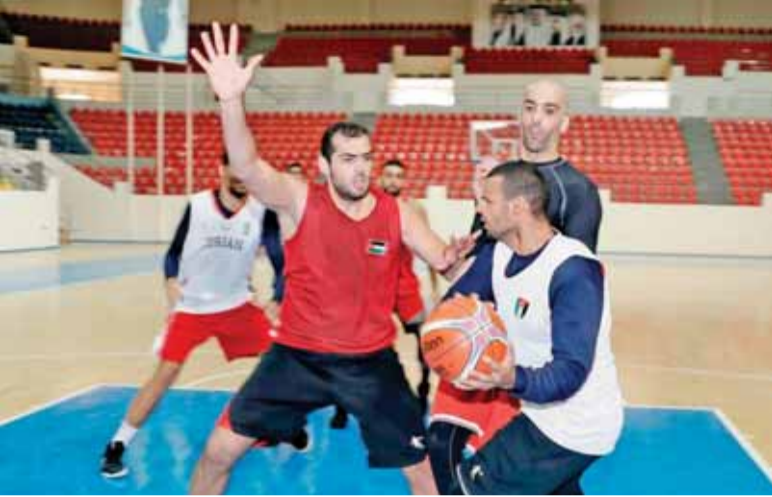
جانب من تدريبات المنتخب الوطني لكرة السلة

عمان - الرأي - يواصل المنتخب الوطني لكرة السلة تدريباته في صالة الأمير حمزة بمدينة الحسين للشباب استعداداً لخوض التصفيات الآسيوية المؤهلة إلى كأس العالم المقرر اقامتها في الصين عام ٢٠١٩.