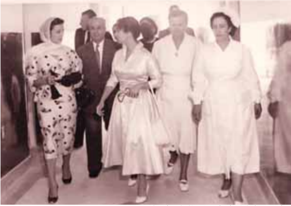
مع الاميرة دينا خلال زيارتها مستشفى الولادة عام ١٩٥٥