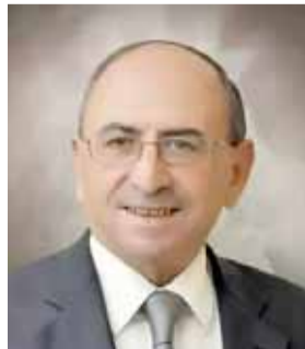
المرحوم اعطوي المجالي

افتتحت امس الأول على ملعب الكرك فعاليات بطولة كرة القدم التي ينظمها شباب الكرك تخليداً لذكرى النائب السابق المرحوم اعطوي المجالي بمشاركة فرق شيخان، الربيه، منشية ابو حمور، شباب القطرانة، الأغوار الجنوبية وشباب الخرشه.