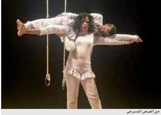
من العرض المسرحي