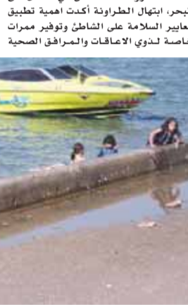
اطفال يسبحون خارج الاماكن المسموح بها لسباحة