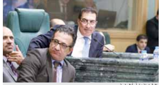
الطراوة متراً الجلسة

«النواب» ينتخب ١٥ لجنة ويستكملها الثلاثاء