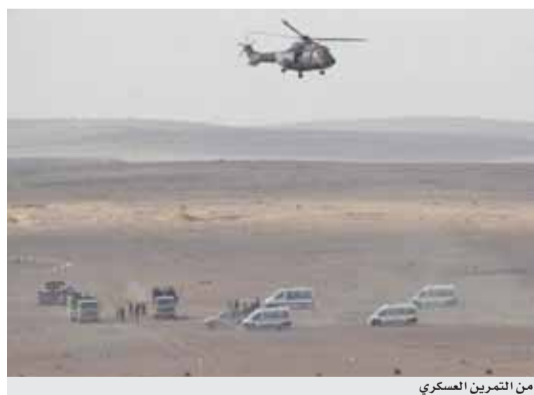
من التمرين العسكري