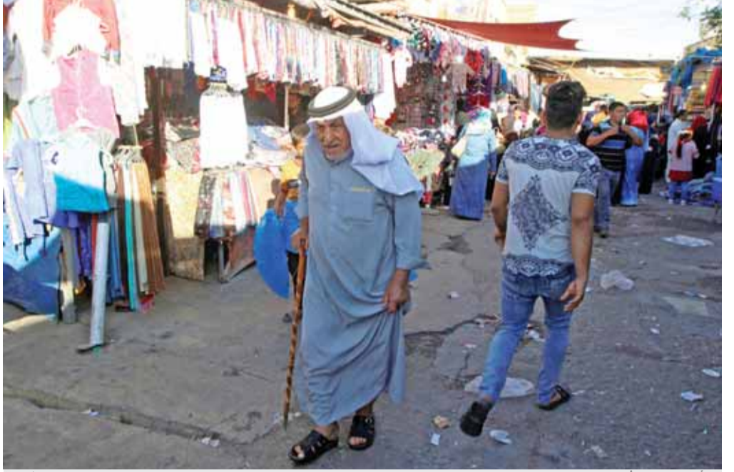
مسّن عراقي يمشي في أسواق كركوك