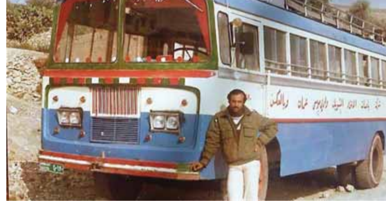
ياص نقل الركاب من وادي موسى والشوبك إلى عمان وبالعكس مطلع سبعينيات القرن الماضي