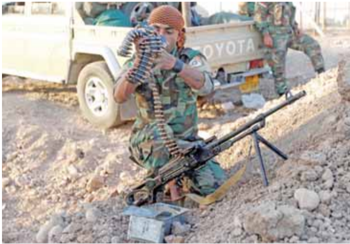
مقاتل من البشمركة يتحقق من سلاحه في كركوك

عواصم - وكالات - رحبت حكومة إقليم كردستان بالدعوة التي وجهها رئيس الوزراء العراقي حيدر العبادي للحوار الثلاثاء بعد العملية العسكرية الواسعة للجيش العراقي واستعادته المناطق المتنازع عليها وضمنها مدينة كركوك التي كان يسيطر عليها الكراكر.