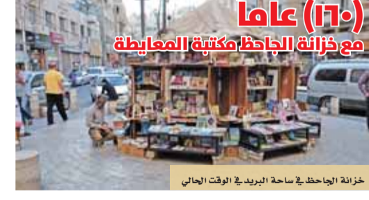
خزانة الجاحظ في ساحة البريد في الوقت الحالي