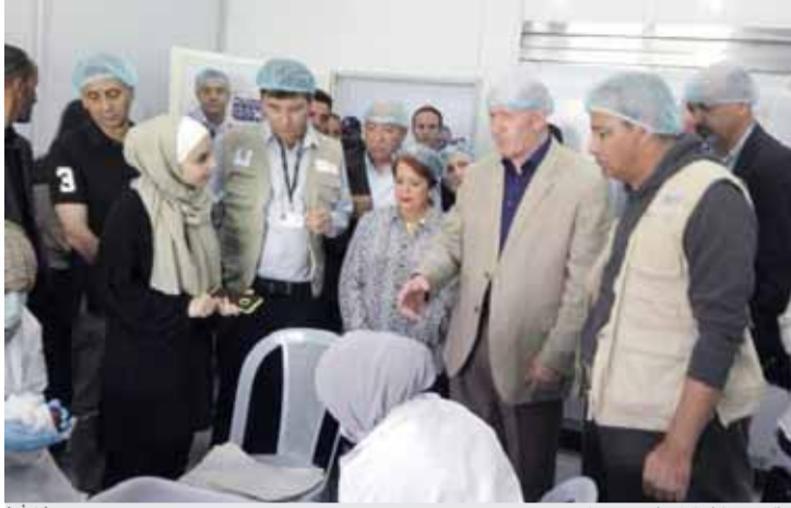
حاكم استراليا خلال زيارته مخيم الزعتري

ويصعب نمودج واحة المرأة التابع للأمم المتحدة الذي يخدم ١٩ ألف لائحة سنويا، إلى تلبية الاحتياجات الفورية للاجئات السوريات من خلال توفير فرص كسب الرزق،