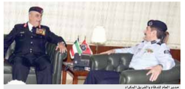
مدير العام للدفاع والفريق المكراد

من الدول الكاريبية تاركا دمرا واسعا. واتفق الوزيران على تبادل الدعم في المحافل الدولية بما فيها دعم ترشيحات البلدين في منظمات الأمم المتحدة، والتي تشمل دعم ترشيح المملكة للمجلس التنفيذي لمنظمة اليونسكو والتي ستجري انتخاباته الشهر المقبل. وكانت المملكة وأنتيغوا وباربودا وقعتا الشهر الماضي على بيان لإقامة العلاقات الدبلوماسية بين البلدين .