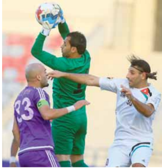
حارس مرمرى اليرموك الحنفاوي يلتقط الكرة قبل تدخل حريما (احمد العساف)