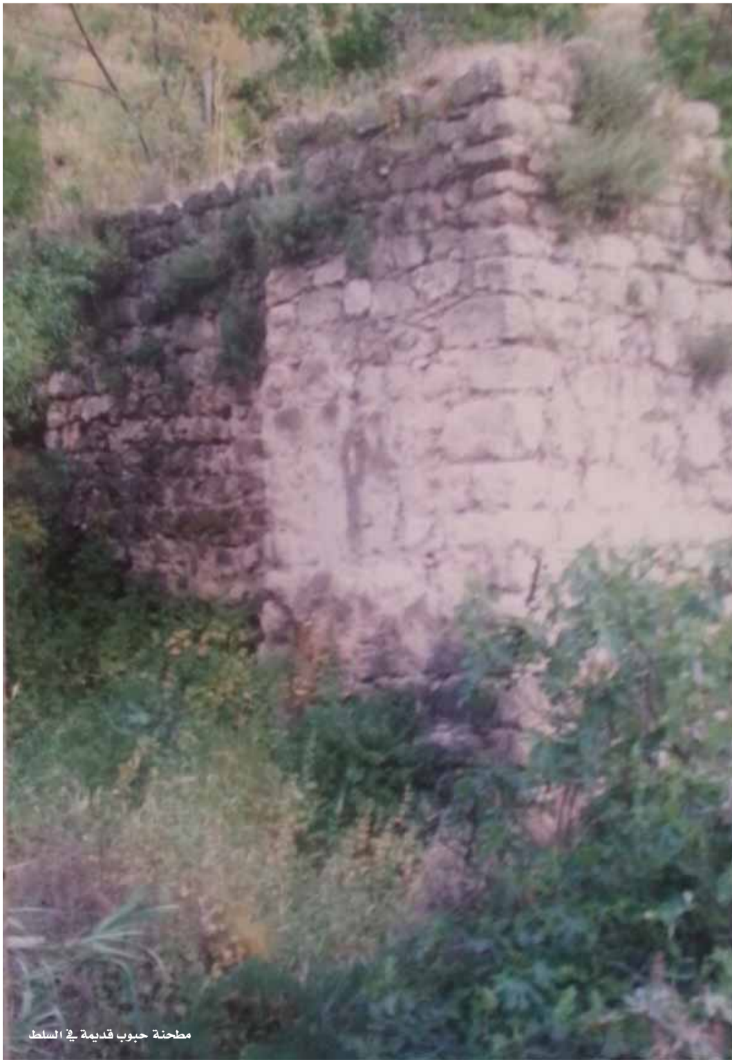
مطحنة حبوب قديمة في السلط