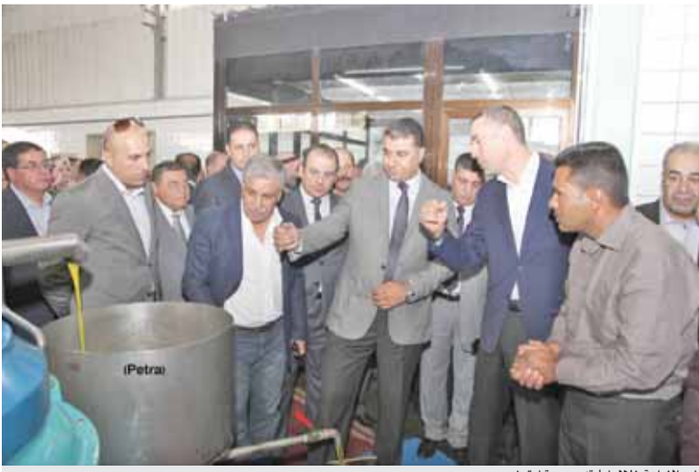
وزير الزراعة خلال زيارته معصرة زيتون

عمان - بترا - أعلن وزير الزراعة المهندس خالد الحنيقات خلال حفل أمس الخميس بمبصرة العلباء في منطقة من الساتين، افتتاح موسم عصر الزيتون، بحضور السفير الياباني سوشي سوكراي والجهات المعنية بقطاع الزيتون الأردني. وأكد الوزير ان قطاع الزيتون يشهد تطوراً مستمراً، سواء من حيث أساليب الإنتاج في الحقل والمعصرة، وأصبحت معاصر زيت الزيتون توأكب أحدث تكنولوجيا العضو في العالم، ويتوفر حالياً في الأردن ١٣٠ معصرة تُضخّر طاقتها الإنتاجية بنحو ٣٩٩ طن/ساعة ومخطّماً حديثة ومزودة بخطوط إنتاج متطورة ما يؤدي إلى جودة الزيت المنتج الفاد على المنافسة والتفوق. وأضاف ان الوزارة مستمرة بالعمل على تخصيص مشاريع تعمل على تثبيت مؤشرات جغرافية لكل منطقة من مناطق الإنتاج الرئيسية في المملكة، ممتصة المؤشر الجغرافي لزيت الزيتون الكفاري في لواء بني كنانة لما له من أهمية في خدمة قطاع الزيتون، وسنعمل على جعل الزيتون منتجاً إستراتيجياً بحيث يوصل إليه ما يستحق من الدعم الحكومي اللازم.