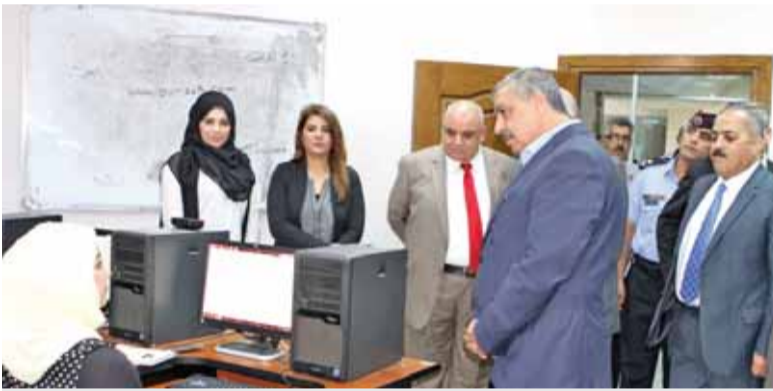
وزير العمل خلال زيارته لمحافظة اربد