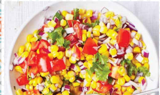
سلطة الذرة بالجبنه

نصف كيلو كفتة نصف كيلو لبن عصير الليمون سن الثوم مهروس ملح ملعقة كبيرة الطحينة خبز مقطع مربعات، محمص أو مقلي، لوز للتزيين صنوبر للتزيين