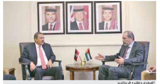
الصفدي ونظيره فريناديز

عمان (بترا) - بحث وزير الخارجية وشؤون المغتربين أيمن الصفدي امس مع وزير الخارجية والتجارة الدولية والهجرة في جمهورية أنتيغوا وباربودا تشارلز فريناديز التعاون الثنائي وقضايا إقليمية ودولية ذات اهتمام مشترك، خصوصاً بناء جسور التواصل بين دول الكاريبي والدول العربية. وأكد الصفدي تعاطف المملكة مع أنتيغوا وباربودا ومع ضحايا إعصار «رأءما» الذي ضرب أنتيغوا وباربودا وعدداً