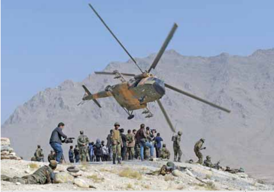
تدريبات للجيش الأفغاني بالقرب من كابول (أ ف ب)

كتاب أشر سوسر نشر قبل عام 2000 وهو يستحق القراءة المتأنية لأنه يعطي صورة عن الأردن ودوره كما يبدو للمراقب الخارجي. أتمنى لو أن المؤلف يعيد إصدار كتابه هذا بعد تحديثه ليضم نظره إلى عوامل صمود الأردن في عهد جلالة الملك عبد الله الثاني. هذه العوامل معروفة لنا وتكمن أهميتها في أنها تمثل رؤية خارجية من مؤرخ يهودي وأستاذ جامعي متخصص بالشؤون الأردنية. ومن الواضح أنه كتب بمنهج موضوعي يبحث عن الحقيقة ويصفها كما يراها.