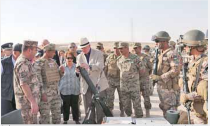
كوسفروف يتطلع على أسلحة لواء الرد السريع (بترا)

عمان - بترا - زار الحاكم العام لأستراليا بيتر كوسفروف وعقبته، أمس، قيادة لواء رد الفعل السريع، حيث كان في استقبالهما مدير العمليات الحربية المشتركة وقائد اللواء.