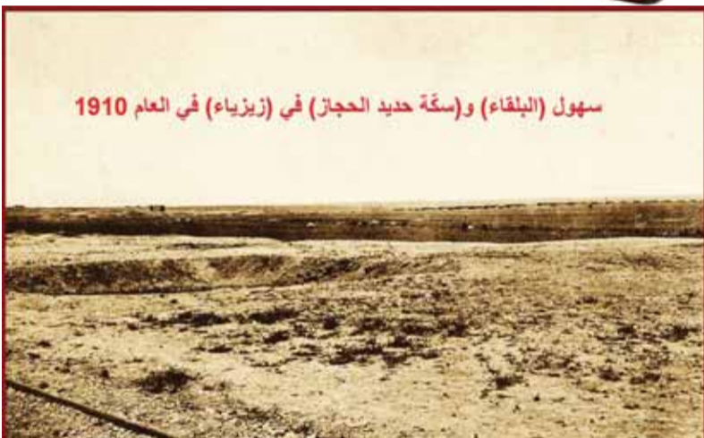
سهول (البلقاء) وسهول حديد الحجاز (في زيزياء) في العام 1910