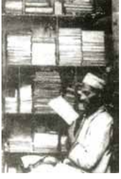
المعايطة .. الجد الأكبر وخزانة الجاحظ في القدس