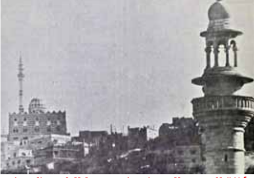
مئذنة المسجد الحسيني في وسط البلد ويظهر في الصورة مسجد أبو درويش في جبل الأشرفية عام ١٩٧٢