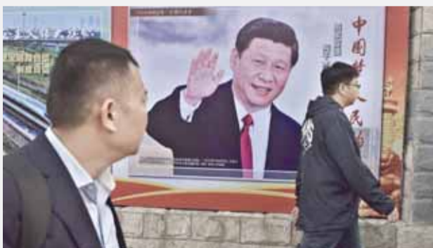
ملصق يظهر فيه الرئيس الصيني في بكين