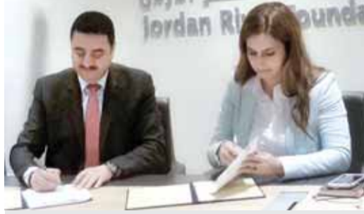
من توقيع الاتفاقية

التدريبية والفرص الوظيفية، لتحقيق المنفعة للشباب والتنسيق فيما يتعلق بتكوين اللجان المحلية التي من شأنها تعزيز المشاركة المجتمعية وحشد واستقطاب الفئة المستهدفة للمشروع.