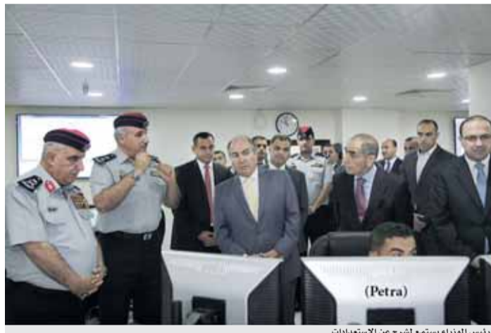
رئيس الوزراء يستمع لشرح عن الاستعدادات

إنشاء «الأوقاف» شركة حج وعمرة يثير حفيظة وكلاء السياحة