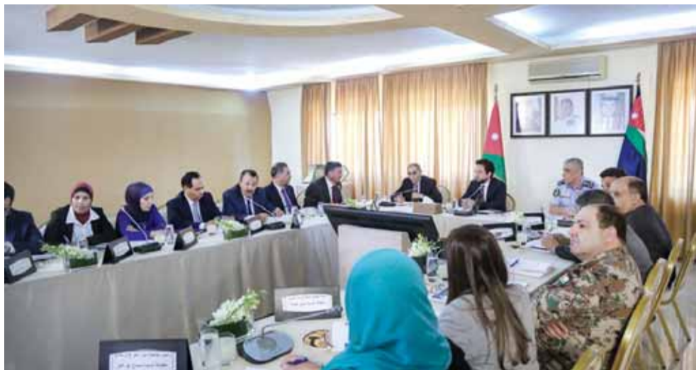
الامير الحسين خلال زيارته لإدارة مكافحة المخدرات

وتم استعراض دور العواطف والواعظات وأئمة المساجد، والمراكز والأندية والمعسكرات الشبابية، والعلميين والمعلمين والمرشدين التربويين، وأعضاء الهيئات التدريسية في الجامعات، والمركز الوطني لتأهيل المدمنين، إضافة إلى الدور الذي تقوم به الجمعيات كمؤسسات مجتمع مدني، في موضوع التوعية من خطر أفة المخدرات.