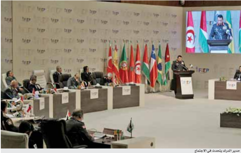
مدير الدرك يتحدث في الاجتماع