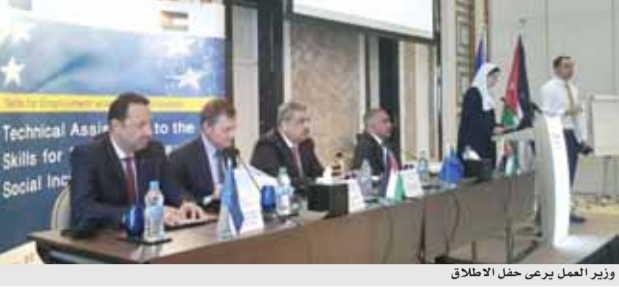
وزير العمل يرضى حفل الإطلاق