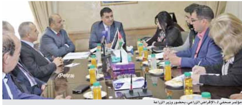
مؤتمر صحفي لـ الإقراض الزراعي، بحضور وزير الزراعة

ممكنة وخاصة فئة صغار المزارعين. وأشار الحيارى إلى حرص المؤسسة على توجيه سياستها الإقراضية نحو فئة صغار المزارعين والأسر الريفية العاملة في القطاع الزراعي من خلال خلق فرص التمويل في الريف والبادية الأردنية بهدف المساهمة في الحد من ظاهري الفقر والبطالة وإسعاد فائدة او مرابحة مخفضة، حيث بلغت قيمة هذه القروض خلال عام ٢٠١٧ نحو (٦,٢) مليون دينار استفاد منها (١٤٤٠) مزارعاً من أصل المخصص للمشروع لنهاية العام البالغ (٧,٥) مليون دينار ونسبة إنجاز (٨٨).