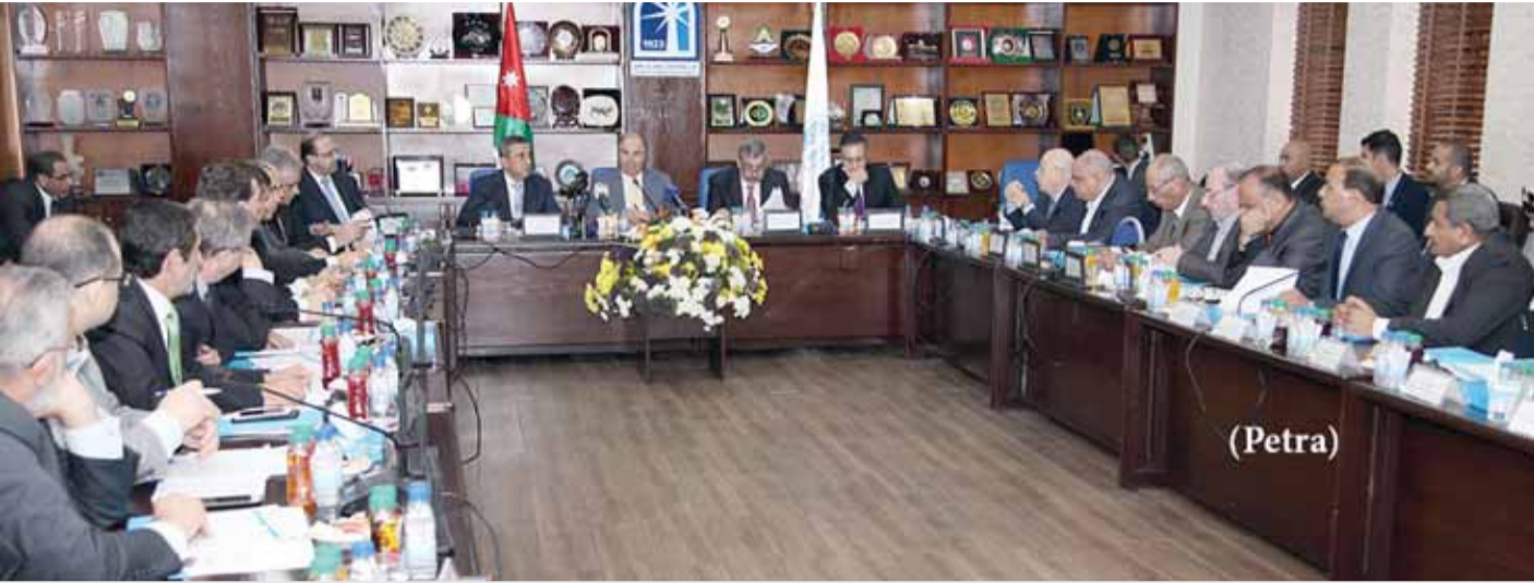
رئيس الوزراء ملتقىاً بالفعاليات التجارية