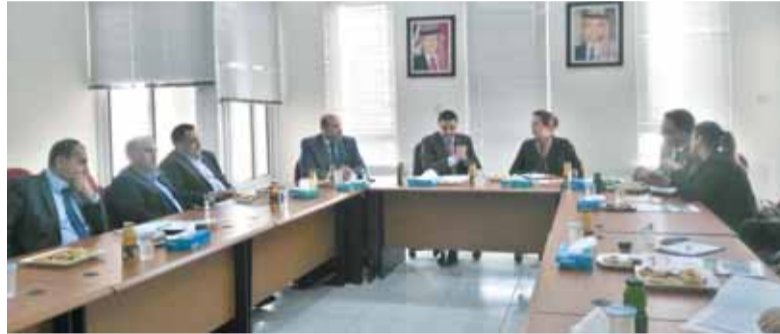
وفد السفارة الأميركية في غرفة صناعة اربد