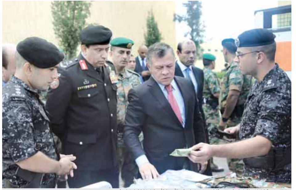
جلالته يزور قيادة الشرطة الخاصة ويلتقي قادة ومدراء وروساء وفود الأجهزة الأمنية المشاركة باجتماع فيب،

والتقى جلالته، خلال الزيارة، قادة ومدراء وروساء وفود الأجهزة الأمنية المشاركة باجتماع المجلس الأعلى للمنظمة الأورومتوسطية لقوات الشرطة والدرك ذات الصيغة العسكرية (فيب)، والذي تستضيفه قوات الدرك في عمان، خلال الفترة من ١٥ - ١٨ تشرين الأول الجاري. وأكد جلالته، خلال اللقاء، أهمية تمتين الشراكة بين المؤسسات الأمنية والعسكرية في العالم، وتوحيد الجهود الدولية المبذولة في مكافحة التطرف، والحرب على الإرهاب، والتصدي للجريمة. واستمع جلالته، خلال اللقاء، إلى شرح قدمه اللواء الركن الحواتمة