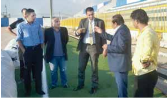
من الجولة التقديرية

وأكد أبو حسان أن الانتهاء من فرش أرضية الملعبين سيكون خلال عشرة ايام، بعدها سيتم إضافة وإعادة صيانة بعض