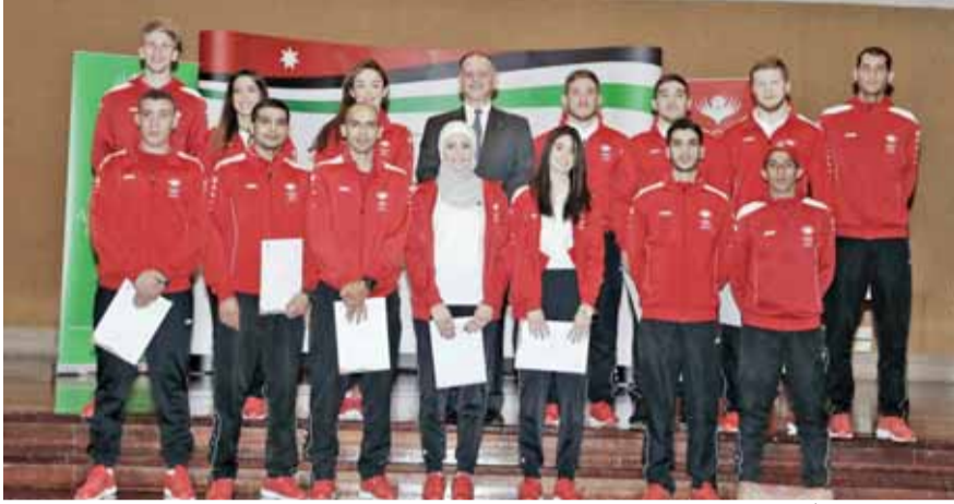
الامير فيصل يتوسط الأبطال المكرمين

عمان-الرأي- رعى سمو الأمير فيصل بن الحسين رئيس اللجنة الأولمبية أمس حفل تكريم أصحاب الانجاز من الرياضيين والمدربين الذين مثلوا الأردن في النسخة الخامسة من دورة الألعاب الآسيوية للصالات المغلقة والفنون القتالية والتي أقيمت أيلول الماضي في عشق آباد عاصمة تركمانستان. وعبر الأمين العام للجنة الأولمبية، ناصر المجالي، عن تقديره بالانجازات التي تحققت في عشق آباد قائلا:، اجتمعنا اليوم -إمس- في هذا التكريم الذي ننظمه على شرف أبطالنا وبطلاننا وبرعاية ملكية من صاحب السمو الأمير فيصل بن الحسين رئيس اللجنة الأولمبية. نؤكد أن الرياضة الأردنية قادرة على تحقيق الانجاز وإن العمل الصادق والمخلص يأتي بشماره ويستحق