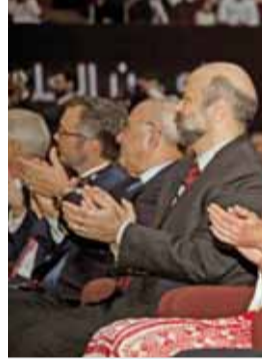
جلالتها تلقي كلمة في الحفل

وقالت جلالتها في كلمة جلالتها أمس خلال حفلها احتفال تخريج الفوج الأول من المعلمين الطلبة للدبلوم المهني لإعداد وتأهيل المعلمين قبل الخدمة ومديري المدارس للدبلوم المهني في القيادة التعليمية المتقدمة بحضور وزير التربية والتعليم الدكتور عمر الرزاز ورئيس الجامعة الأردنية الدكتور عزمي محافظة إضافة إلى الخريجين وعائلاتهم والفوج الثاني وكبار المسؤولين والإعلاميين والمؤثرين والشركاء والداعمين والوزارة. وأعربت جلالتها عن فخرها بدبلوم أعداد وتأهيل المعلمين قبل الخدمة، وبأكاديمية تدريب المعلمين وما تؤسسه ليكون صرحاً أردني الملامح عالمي الكفاءة، وقدمت الشكر للجامعة الأردنية ووزارة التربية والتعليم على شراكتهم مع الأكاديمية وعلى إيمانهم بتدريب