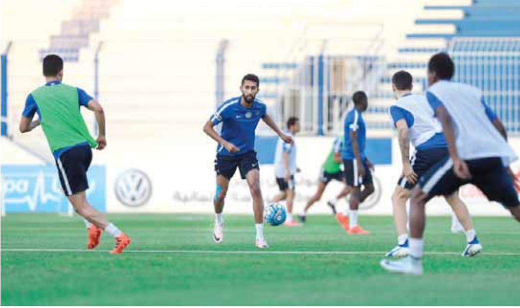
من تدريبات الهلال السعودي

لاعب لن يكون مؤثراً، فلدنيا البديل الجاهز وأثبتنا ذلك في مواجهات سابقة، والفريق لديه مجموعة كبيرة من اللاعبين الدوليين، والمميزين، وسيخوضون المباراة من أجل تحقيق نتيجة مميزة.