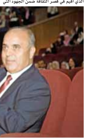
جلالتها تلقي كلمة في الحفل

تجدها من خضرتها إلا فصل خريف سينجلي فيها نحن نستبشر بقدم الربيع، بازدهار فرع متين يحمل لمحوم المستقبل، أنتم أيها المعلمون الخريجون، أنتم بوادر ربيع التعليم، ١٧٤ غصنا مياداً تخرجوا اليوم، ويأتي تخريج الذي أقيم في قصر الثقافة ضمن الجهود التي