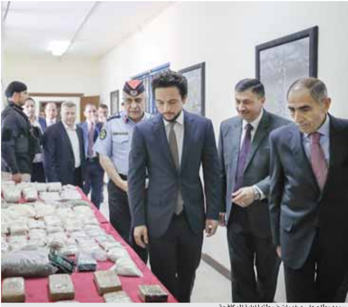
سموه يطلع على مخدرات ضبطتها إدارة مكافحة

عمان - بترا - أكد الأمير الحسين بن عبدالله الثاني، ولي العهد، خلال زيارته إلى إدارة مكافحة المخدرات التابعة لمديرية الأمن العام امس، ضرورة تقسيم البرامج المتعلقة بمكافحة المخدرات والوقاية والعلاج منها، وربطها بمؤشرات لقياس أثرها ومدى فعاليتها على أرض الواقع. كما أكد سموه، خلال اجتماعه مع عدد من مسؤولي الجهات ذات العلاقة بمكافحة المخدرات، أن معالجة آفة المخدرات وأسبابها تتطلب وضع وتنفيذ استراتيجية وقائية شاملة. ولفت ولي العهد إلى ضرورة تبني برامج لبناء قدرات الأطفال والشباب والأسرة وغيرهم من الفئات المستهدفة، لتعزيز الوعي بخطورة المخدرات، فضلا عن الاستفادة من وسائل الإعلام