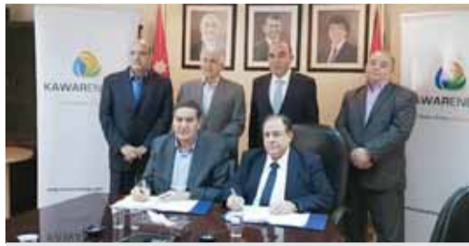
من حفل التوقيع

شأنه تخفيف عبء فاتورة الكهرباء على عند اكتماله حوالي عشرة آلاف كيلواط ساعة من الطاقة الكهربائية بكلفة تقدر بحوالي ثلاثة ملايين دينار سنوياً. وقال ان مشروع محطة توليد الكهرباء من الطاقة الشمسية المتوقع إنجازه بعد ثمانية أشهر من الان من المنفذة للمشروع.