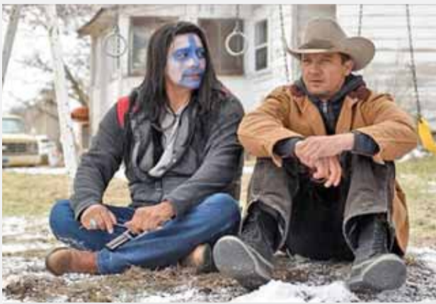
لقطة من الفيلم

و١٩ في القسم الفني و١٧ من البدلاء وعشرة في المؤثرات البصرية والخاصة بملامحة في قسم الموسيقى وسبعة في المونتاج وأربعة في المايكاف وثلاثة في تصميم الأزياء، بالإضافة إلى اثنين من مساعدي المخرج.