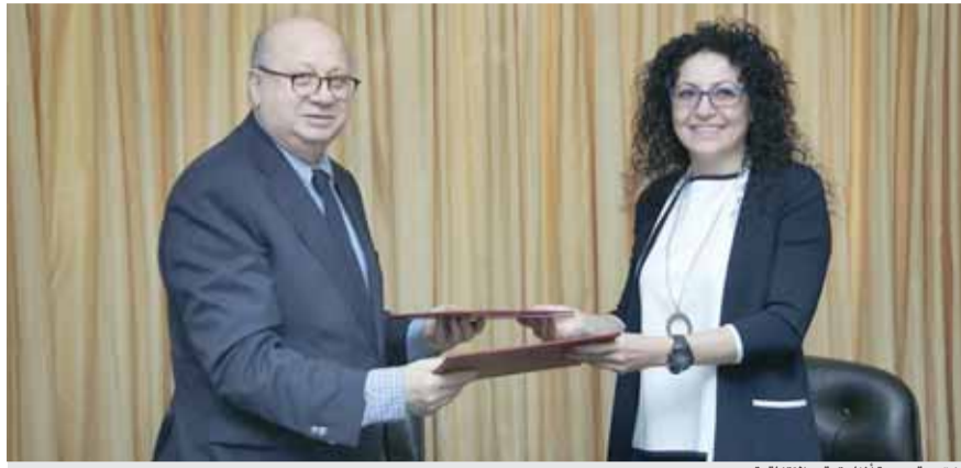
شقم وقسيسية أثناء توقيع الاتفاقية

من خلال طباعة العديد من كتب الدراسات والترات الأردنية، التراث العربي والإسلامي، الفكر والحضارة، الأدب الأردني، الأدب العربي، الأدب العالمي، العلوم، الفنون، الثقافة العامة والأطفال، مبيناً أن دورة هذا العام ركزت على اختيار عناوين تنويرية في القضايا الفكرية المتعددة والمتنوعة، بحيث تساهم في إغناء المعارف ورفع مستوى الوعي لدى أفراد الأسرة.