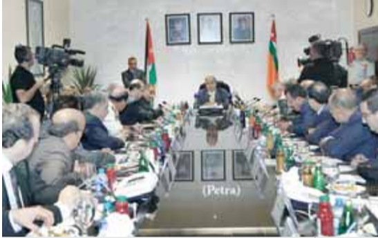
رئيس الوزراء يترأس اجتماع المجلس الاعلى للدفاع المدني

الملقي يدعو لإدامة التنسيق بين «الأعلى للدفاع المدني» و«الوطني لإدارة الأزمات»