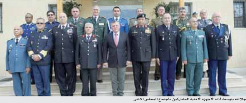
جلالته يتوسط قادة الأجهزة الامنية المشاركين باجتماع المجلس الاعلى

الاستراتيجيات والبرامج التي انتهجتها قوات الدرك وتسهم في بناء قدراتها التنظيمية والعملياتية، وآليات التعاون والتنسيق التي تتبعها على المستويين المحلي والدولي وصولاً إلى تمكينها من أداء دورها الوطني بكفاءة ومهنية عالية.