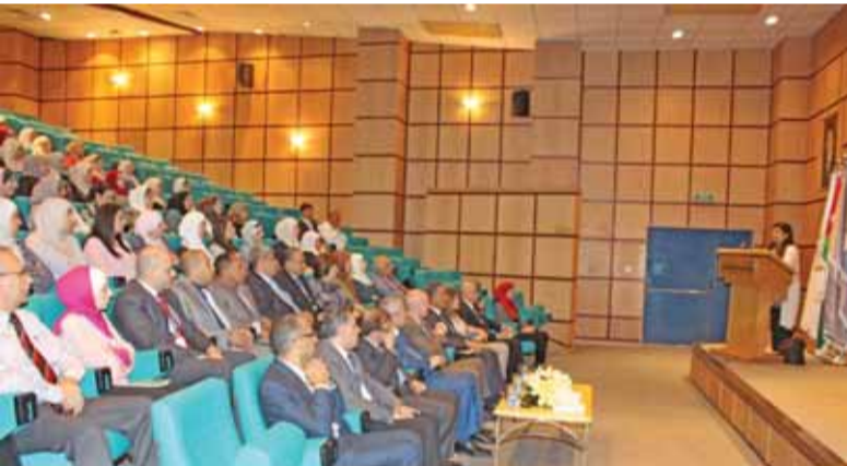
سموها تتحدث للهيئة الادارية والاكاديمية في الجامعة

عمان- الراي-التقت سمو الأميرة سمية بنت الحسن رئيس مجلس أمناء جامعة الأميرة سمية للتكنولوجيا، أعضاء الهيئة الأكاديمية والإدارية في الجامعة، حرصاً منها على التواصل المستمر مع جامعة الأميرة سمية للتكنولوجيا. واعربت سموها عن اعتزازها وثقتها بإدارة الجامعة وهيئتها الأكاديمية والادارية، مشيرة الى ان مسيرة الجامعة التي بدأت منذ ٢٥ عاماً كان هدفها الأساسي أن تكون مركزاً متميزاً ومتخصصاً في الأردن والمنطقة بتكنولوجيا المعلومات والاتصالات. وقالت سموها ان الجامعة التي