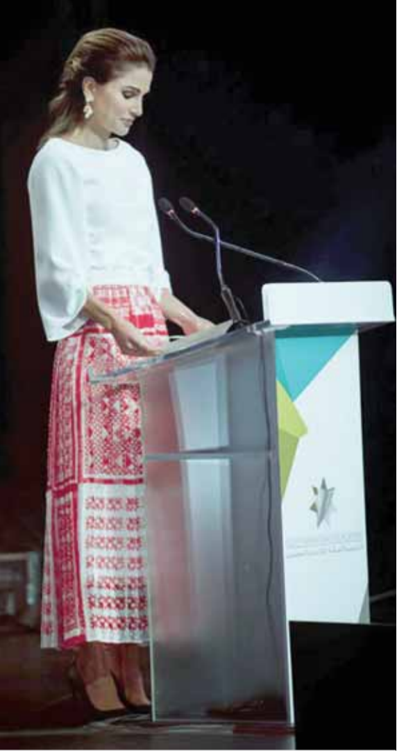
جلالتها تلقي كلمة في الحفل

المهني لإعداد وتأهيل المعلمين قبل الخدمة والدبلوم المهني للقيادة التعليمية المتقدمة وتخرير الفوج الأول من الطلبة المعلمين ومديري المدارس.