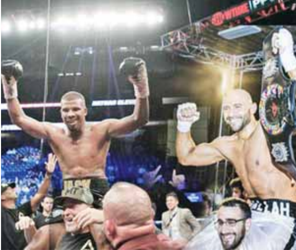
المحسيري والبطل العالمي يادو جاك في مناسبة سابقة

عمان - الرأي - يصل إلى عمان عصر اليوم بطلا العالم للكيك بوكسينج عامر المحسيري والملاكمة الأميركي يادو جاك في زيارة تستغرق يومين.