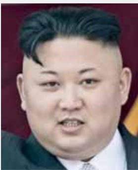
كيم جونج أون