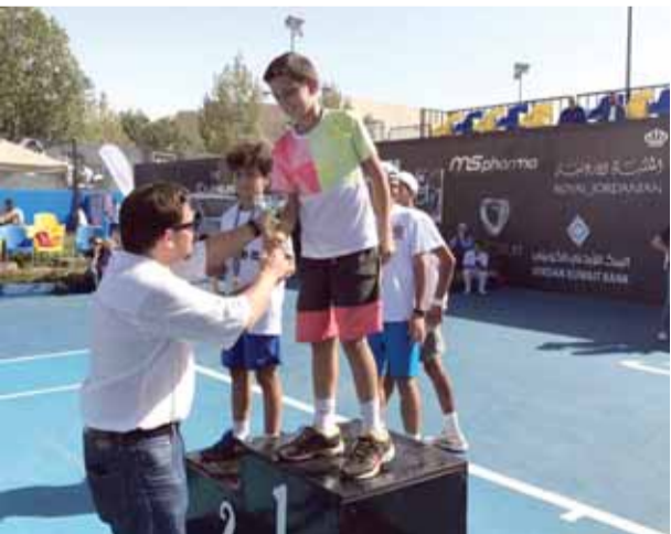
الامير فيصل بن رعد يتوج القبط

- فئة فردي رجال مفتوح: موسى القبط، سيف عدس، نادر الخطيب وعبدالله شلباية. يشار ان المهرجان اقيم على ثمانية ايام، بدعم من: شركة المركزية لكزس، ويوجي ميلانو، ميس ماستر كارد، الملكية الاردنية، شركة بيبسي، البنك الاردني الكويتي، ارامكس، فارمسي ون والعديد من الشركات.