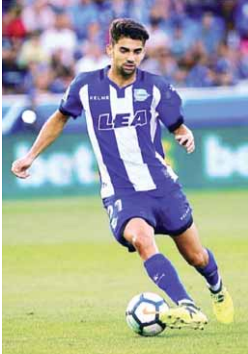
انزو ابن زيدان مشاركة منتظرة أمام ريال مدريد

وفي المباريات الأخرى، يأمل لاتسيو بتعويض خسارة منتصف الأسبوع والاستعداد بشكل جيد لمباراة الخميس ضد ضيفه تسولته فارغم البلجيكي في «يوربا ليغ»، امام هيلاس فيرونا.