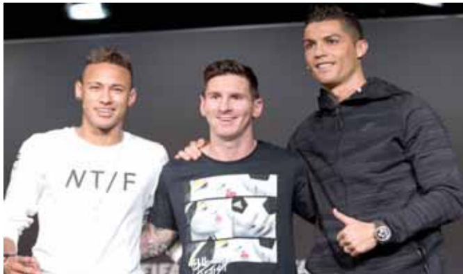
رونالدو وميسي ونيمار

للموسم الثالث على التوالي ونهائي مسابقة دوري ابطال اوربا.