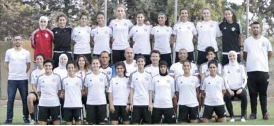
منتخب السيدات لكرة القدم

وتبرتها بشكل تدريجي وتصبح أعلى بدنياً وأكثر تنافسية، حيث يجري ه حصص تدريبية أسبوعياً مقسمة على فترتين صباحية ومسائية، ويتخللها مباراة تحضيرية في نهاية كل اسبوع.