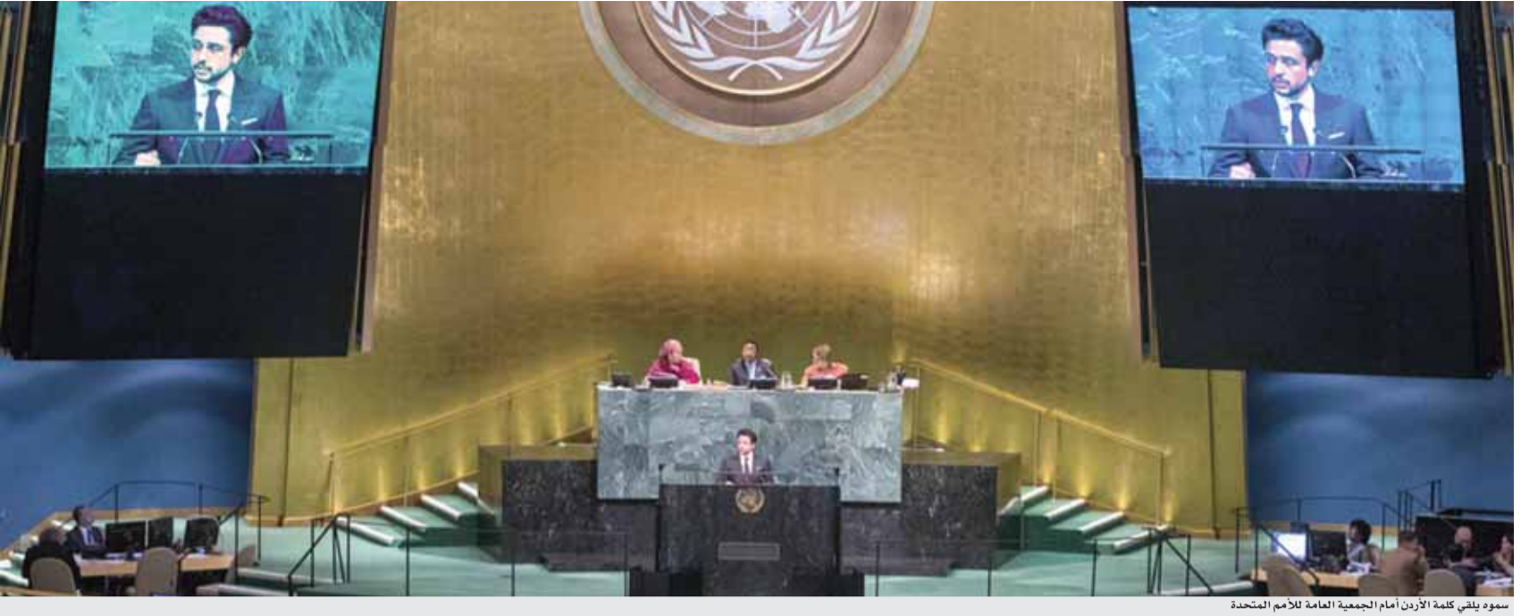
سمو وليي كلمة الأردن أمام الجمعية العامة للأمم المتحدة