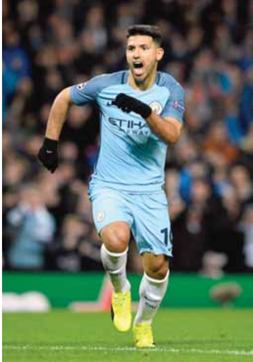
اجويرو يحاول ان يصبح افضل هداف بتاريخ السيتي

ويلعب السبت ايضا بوردو مع جانجان، وكاين مع اميان، وليون مع ديجون، ومترز مع تروا، والاحد سانت اتيان مع رين، وستراسبورج مع نانت، ومرسيليا مع تولوز.