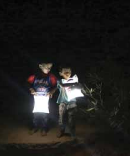
اطفال من وادي رم استفادوا من مصايب الطاقة الشمسية

مبادرة "مسار الخير" تلقت دعما من جهات عديدة من بينها: المؤسسة الصحفية الأردنية "الرأي" والجامعة الأردنية وجمعية المتحف الثقافي "سلام"، ومن المساعدات مصايب تعمل على الطاقة الشمسية، يوجد بداخلها جهاز شحن ويستمر بالاضاءة لفترة تصل إلى ١٢ ساعة دعم وتبني تلك المبادرات الاجتماعية والفردية والسعي نحو نجاحها يساهم في خدمة المجتمع المحلي ويحفز على العمل التطوعي والخيري، ويعزز ثقافة العطاء والتكافل الاجتماعي بين افراد المجتمع.